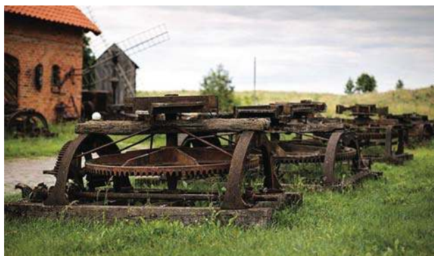
Kolekcja kieratów konnych z Muzeum Maszyn Rolniczych jest największa na świecie

To, że na co dzień projektujemy nowoczesne urządzenia, bardzo pomaga w zrozumieniu dawnych konstrukcji. Patrząc na kierat czy starą młocarnię, widzimy nie tylko piękny zabytek, ale przede wszystkim rozwiązanie techniczne. I widzę, jak niesamowicie zdolni byli ci konstruktorzy sprzed 100 lat. Nie mieli