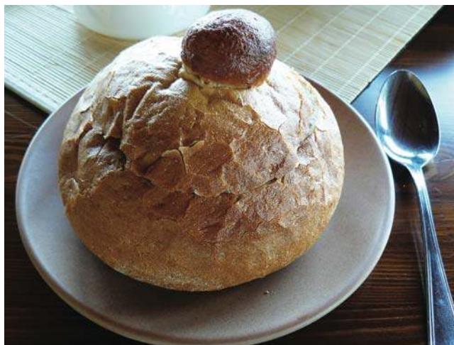
Żurek podany w chleбку z charakterystyczną wypustką u góry

kowego i bakterii, które go wytworzyły. Ów kwas mlekowy i bakterie fermentacji mlekowej mają nader pozytywne działanie na przewód pokarmowy człowieka. Kwas mlekowy obniża pH treści jelitowej, optymalizując proces trawienia i zapobiegając zaparciom. Utrudnia wzrost niepożądanym bakteriom chorobotwórczym, zaś sprzyja rozwojowi probiotyków. Z kolei bakterie probiotyczne syntezują witaminy i produkują enzymy pozwalające na lepsze wykorzystanie składników odżywczych z pokarmu.