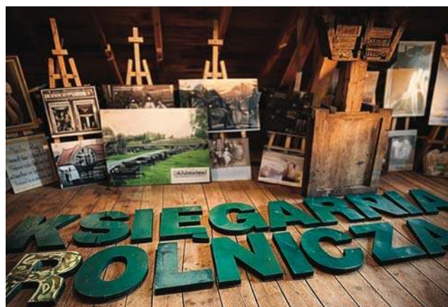
Tan szyld dobrze znają tysiące weterynarzy, geodetów, inżynierów i techników rolnictwa

— Kiedy wpisywano nas do Księgi rekordów