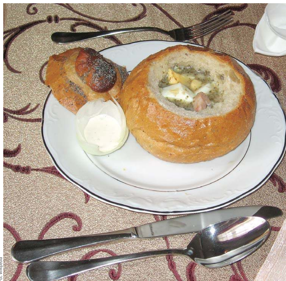
Żurek podany w chlebk

Jedni za powstanie żurku „winia” wrednego karczmarza spod Poznania, inni — biedną żonę. A zatem, jak to drzewiej bywało, w pewnej małej polskiej wiosce, o której nawet Bóg zapomniał, żył sobie pewien wredny karczmarz. Skapiradło to było okropne! A jak