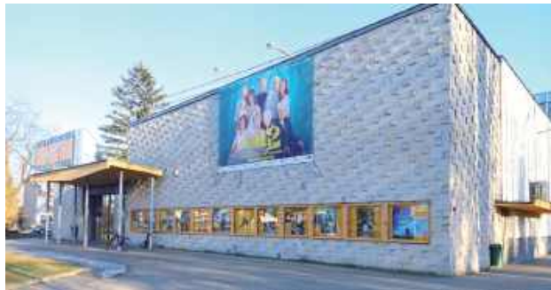
Kino „Mercury” zmieni właściciela

Już w 2016 roku poprzedni białski prezydent chciał kupić na warunkach preferencyjnych kino przy ul. Brzeskiej. Spółka jednak godziła się tylko na cenę rynkową. Rok później Zarząd Województwa Mazowieckiego nie wyraził zgody na sprzedaż tej nieruchomości, gdyż działka należała do Mazowsza (dawno temu był tam cmentarz żydowski), a budynek kina do IF „MAX-FILM”.