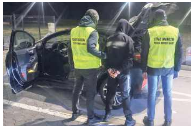
Podczas dalszych czynności funkcjonariusze ustalili, iż zabezpieczone narkotyki zostały przewiezione z terytorium Niemiec

- Podczas prowadzonej kontroli, w należącym do niego samochodzie osobowym marki