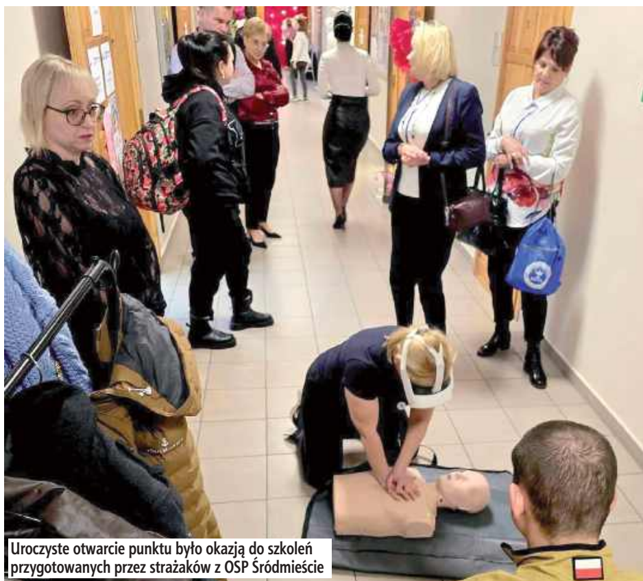
Uroczyste otwarcie punktu było okazją do szkoleń przygotowanych przez strażaków z OSP Śródmieście

Dyrekcja białskiego urzędu pracy zdecydowała się na model przypominający funkcjonujące niegdyś przy zakładaniu firm „jedno okienko”. Założenie jest proste: każdy, kto odwiedzi punkt, ma z niego wyjść z pełnym pakietem informacji lub precyzyjnymi wskazówkami, dotyczącymi dalszych kroków w planowaniu swojej przyszłości.