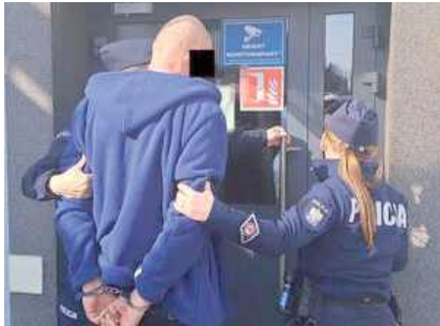
Sprawa jest tym bardziej poważna, że 53-latek niedawno wyszedł z więzienia, gdzie odbywał karę za znęcanie się nad najbliższymi

GMINA OPOLE LUBELSKIE: Groźne sceny rozegrały się w jednej z miejscowości w gminie Opole Lubelskie. 53-letni mężczyzna pod wpływem alkoholu wpadł w szal i zaczął grozić swoim rodzicom spaleniem ich dobytku. Niszczył przedmioty w domu, a na podwórku rozpałił ognisko tuż przy budynkach gospodarczych. Przerażeni rodzice wezwali policję.