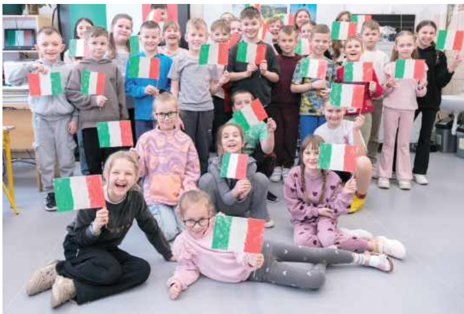
Wyjątkowy projekt, skierowany do dzieci od 7. roku życia, został zorganizowany przez Gminny Ośrodek Kultury w Międzyrzeczu Podlaskim. Inicjatywa mogła zostać zrealizowana dzięki wsparciu finansowemu Fundacji LOTTO im. Haliny Konopackiej, przyznanemu w ramach ogólnopolskiego konkursu „odLOTTOwe ferie 2026”

Każdego dnia w godz. 10-15.45 na uczestników czekał inny europejski kraj, a wraz z nim zajęcia artystyczne, manualne, sportowe i kulinarne (organizatorzy zadbali również o ciepły, jednodaniowy obiad dla każdego dziecka). Feryjna