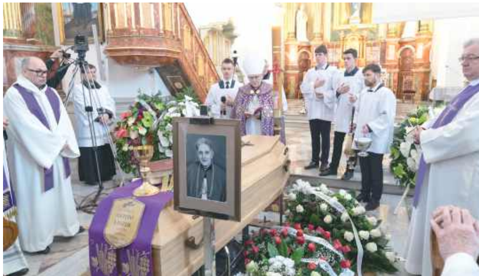
Ks. infułat Antoni Laszuk zmarł 8 marca w wieku 96 lat. Po uroczystej Eucharystii ciało śp. ks. infułata Antoniego Laszuka zostało złożone do grobu na cmentarzu parafialnym w Białej Podlaskiej

Śp. ks. infułat Antoni Laszuk urodził się 3 lutego 1930 roku w Worgulach w województwie lubelskim. Już w młodym wieku podjął decyzję o wstąpieniu na drogę kapłaństwa. Święcenia kapłańskie przyjął 26 maja 1956