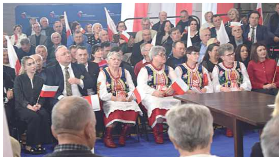
Przybyła grupa w strojach ludowych

prezydenta Rzeczypospolitej Polskiej – mówił kandydat na premiera.