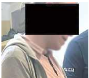
Podczas policyjnej interwencji okazało się, że mężczyzna był poszukiwany przez prokuraturę i miał przy sobie narkotyki

Do zdarzenia doszło we wtorek, 10 marca. Mężczyzna wyszedł ze sklepu z artykułami drogowymi, za które nie zapłacił. Jego zachowanie zauważył pracownik ochrony, który natychmiast zareagował i ujął sprawcę. Wtedy sytuacja zrobiła się niebezpieczna - 38-latek próbował za wszelką cenę utrzymać skradzione rzeczy.