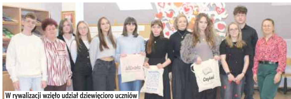
W rywalizacji wzięło udział dziewięcioro uczniów

Przed feriami w Liceum Ogólnokształcącym im. gen. Władysława Sikorskiego w Międzyrzeczu Podlaskim zrobiło się niezwykle lirycznie. Dziewięcioro uczniów zmierzyło się w konkursie recytatorskim „Miłość w poezji i prozie – męska poezja miłosna”.