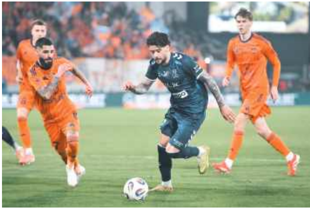
Wygrana w Niecieczy oddala Motor od spadku