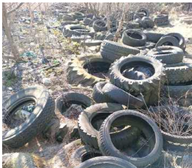
Na obrzeżach lasu zrzucano bardzo dużo opon. Niektóre już zarosły trawą

Po pewnym czasie usłyszeliśmy od drugiego z mężczyzn, że to dziki wysypisko opon i in-