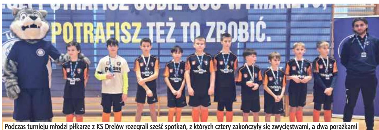
Podczas turnieju młodzi piłkarze z KS Drelów rozegrali sześć spotkań, z których cztery zakończyły się zwycięstwami, a dwa porażkami

Drużyna KS Drelów Akademii z rocznika 2014 wzięła udział w turnieju Lobos Cup (17 stycznia), który dostarczył wielu sportowych emocji, pięknych bramek i niezapomnianych wrażeń.