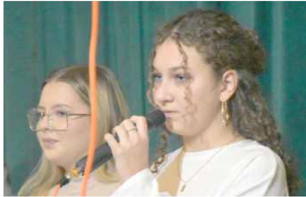
Nie zabrakło przedstawicieli młodego pokolenia, czyli Scholi Niezapominajki z Żabiec

Podczas spotkania uczestnicy mieli okazję wspólnie przeżyć magię bożonarodzeniowych melodii oraz radość płynącą ze wspólnego koledowania.