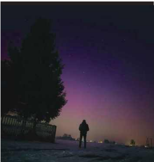
Różne kolory zorzy w zimową noc.

i żółć, tworząc świetlistą kurtynę nad horyzontem. Zorza była widoczna gołym okiem, a jej intensywność momentami przypominała obrazy znane z dalekiej północy Europy – opowiada pan Tomasz.