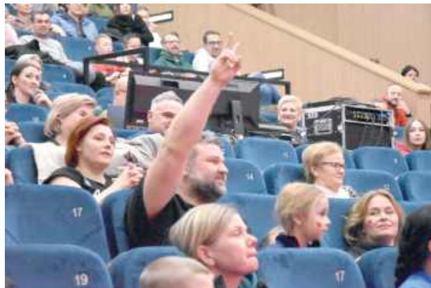
Podczas aukcji licytowano wiele ciekawych fantów, m.in.: dzień w fotelu wicestarosty, pluszowego bociana czy ciasto

Warto przypomnieć, że 34. Finał w naszym mieście to nie tylko niedziela. Imprezy towarzyszące trwały już od połowy stycznia. Mieszkańcy aktywnie wzięli udział w biegu „Policz się z cukrzycą” nad Międzyrzeczkimi Jeziorkami,