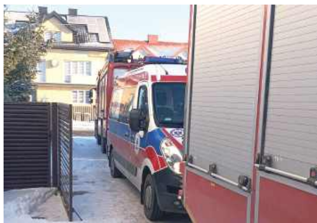
Zdarzenie miało miejsce w czwartek, 22 stycznia