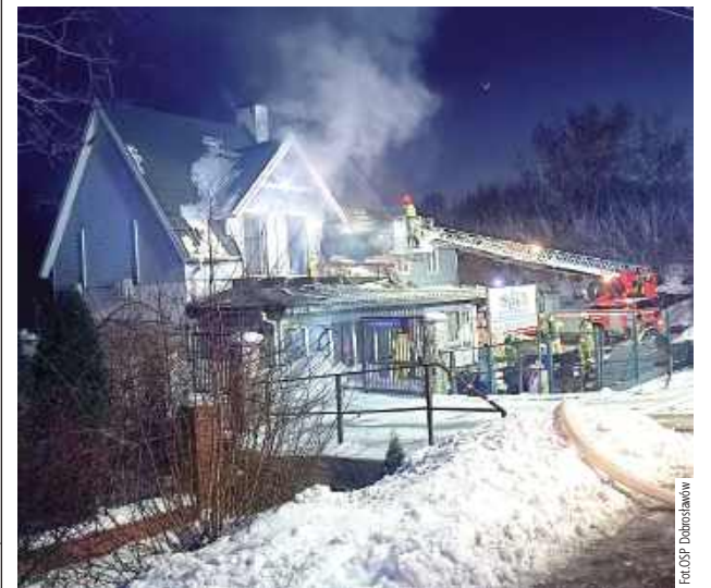
Mieszkańcy sami opuścili płonący budynek jeszcze przed przybyciem straży pożarnej. Na szczęście nikt nie ucierpiał

Blisko cztery godziny trwała akcja gaśnicza w Górze Puławskiej przy ul. Radomskiej, gdzie w minioną środę wybuchł pożar domu jednorodzinne. Na szczęście nikt nie ucierpiał.