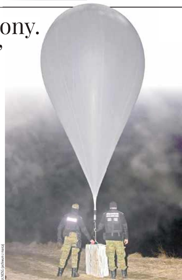
Przechwycony przez Straż Graniczną balon z przemytem