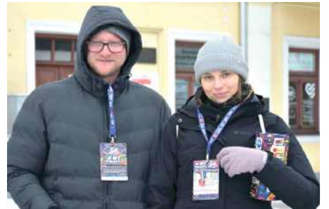
Już od wczesnych godzin porannych ulice Międzyrzecza wypełnili wolontariusze z charakterystycznymi, kolorowymi puszkami

bawili się na koncercie w Pałacu Potockich oraz rywalizowali w turnieju piłki nożnej z KS Huragan Międzyrzec. W sobo-