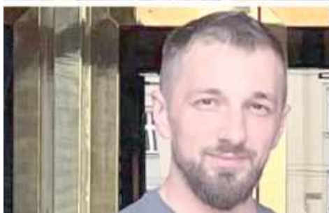
W ciągu jednej godziny stracił wszystko, na co pracował przez ponad siedem lat. Możemy mu pomóc

utrzymania trzypięcioro rodziny - mówi właściciel zakładu.