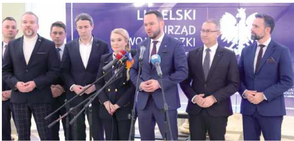
O przyspieszeniu inwestycji poinformowano podczas konferencji europarlamentarzystki, wojewodów, prezesów, prezydenta i radnego

W styczniu przyspieszyła sprawa rozbudowy portu przeładunkowego w Małaszewiczach. PKP Polskie Linie Kolejowe już przejęły spółkę Cargotor, a Rada Ministrów zapewniła o finansowaniu inwestycji. Chodzi o likwidację wąskiego gardła, jakim jest możliwość przyjęcia i odprawienia pociągów głównie z Chin.