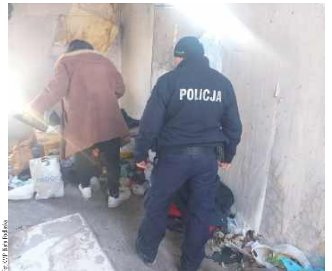
Dotarli do dwóch mężczyzn w wieku 52 i 60 lat. Jeden z nich przebywał w pustostanie w warunkach i sytuacji zagrażającej życiu