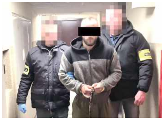
Łukowski sąd przychylił się do wniosku policjantów, a także prokuratury i zastosował wobec Adriana S. środek zapobiegawczy. Co najmniej trzy najbliższe miesiące 28-latek spędzi w areszcie tymczasowym

Jak ujawnia prokurator, Adrian S. był pod wpływem substancji odurzających.