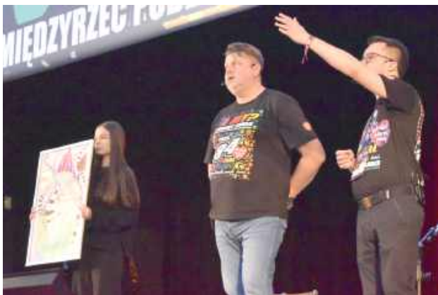
Licytacje przyniosły rekord – zebrano 42 460 zł

bawili się na koncercie w Pałacu Potockich oraz rywalizowali w turnieju piłki nożnej z KS Huragan Międzyrzec. W sobo-