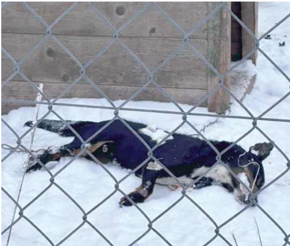
To zdjęcie wstrząsnęło tysiącami internautów

Rezonans był olbrzymi. Jej post zyskał aż 2,6 tys. udostępnień, 252 lajki i 498 komentarzy. W Internecie posypały się przekleństwa, wyzwiska, obelgi i najgorsze życzenia dla zniechęconego właściciela, lekceważącego psią tragedię, jakby to była norma. Ostro atakowano też urzędników i policję.