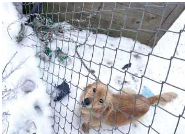
Bardzo wychudzony, jeszcze żywy pies na łańcuchu czekał na ratunek

- Czemu pan nie wrzucił do budy słomy? – pytał właściciela gospodarstwa.