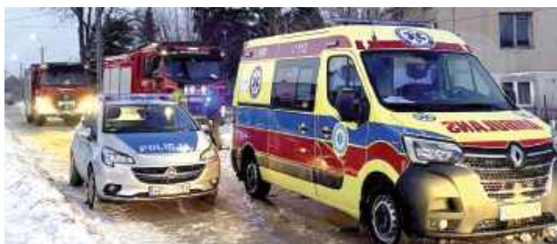
Pomimo podjętych działań ratunkowych życia mężczyzny nie udało się uratować

Na miejsce skierowano jednostki straży pożarnej, zespołu ratownictwa medyczne-