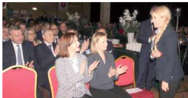
Niektórzy politycy wiedzą jak działa czar gal...

Europosłanka Marta Wcisło przybyła na styczniową galę w białskim starostwie z dużym spóźnieniem, tuż przed zakończeniem części oficjalnej imprezy.