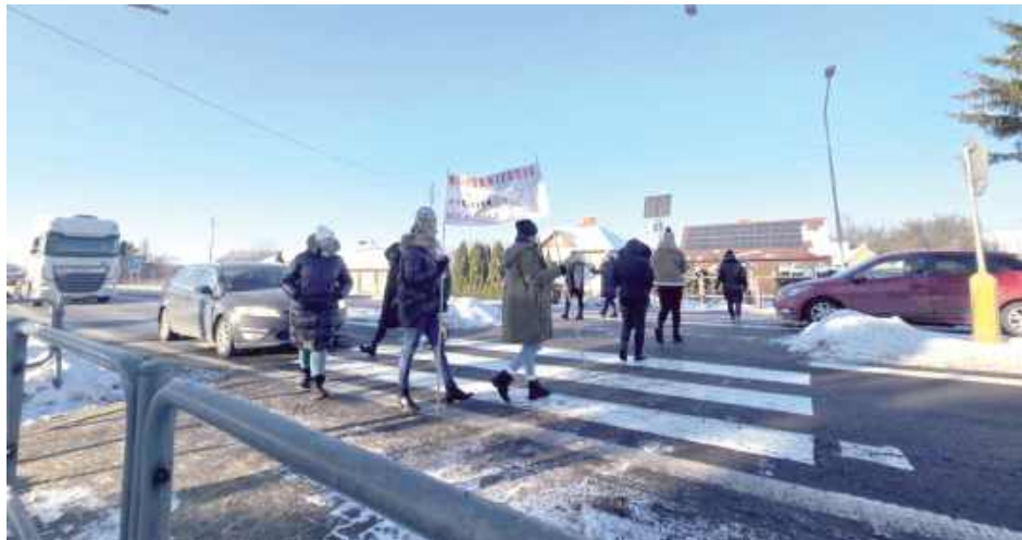
Rodzice są zdeterminowani do walki o utrzymanie nauczania we wszystkich oddziałach SP w Wólce Dobryńskiej. Potwierdziła to ich manifestacja w miniony wtorek

Jak informowaliśmy wcześniej, pod koniec listopada wójt gminy Zalesie, Tomasz Szewczyk, poinformował nauczy-