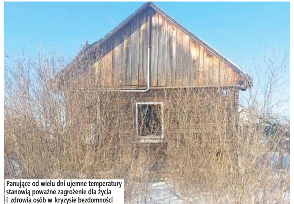
Panujące od wielu dni ujemne temperatury stanowią poważne zagrożenie dla życia i zdrowia osób w kryzysie bezdomności

Dotarli do dwóch mężczyzn w wieku 52 i 60 lat. Jeden z nich przebywał w pustostanie w warunkach i sytuacji zagrażającej