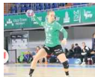
Drużyna z Lublina walczy o mistrzostwo Polski