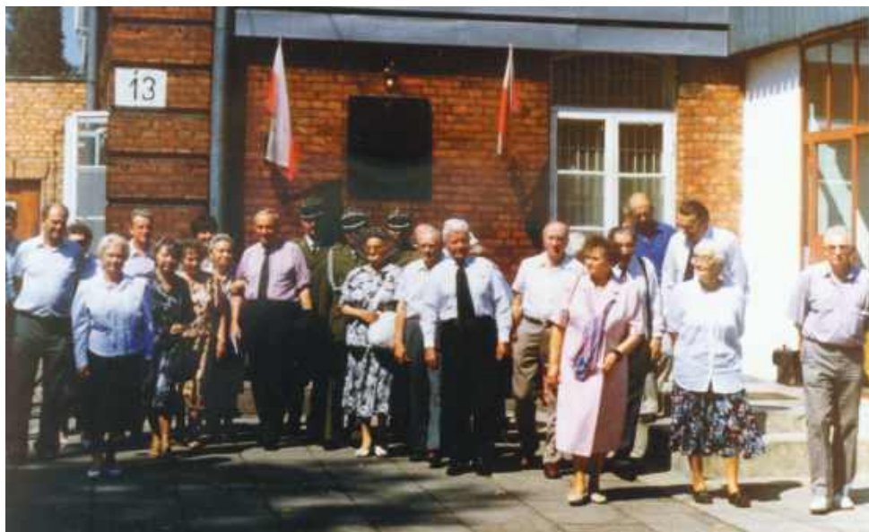
Rok 1994. Odświeżenie tablicy pamiątkowej w Nowym Dworze