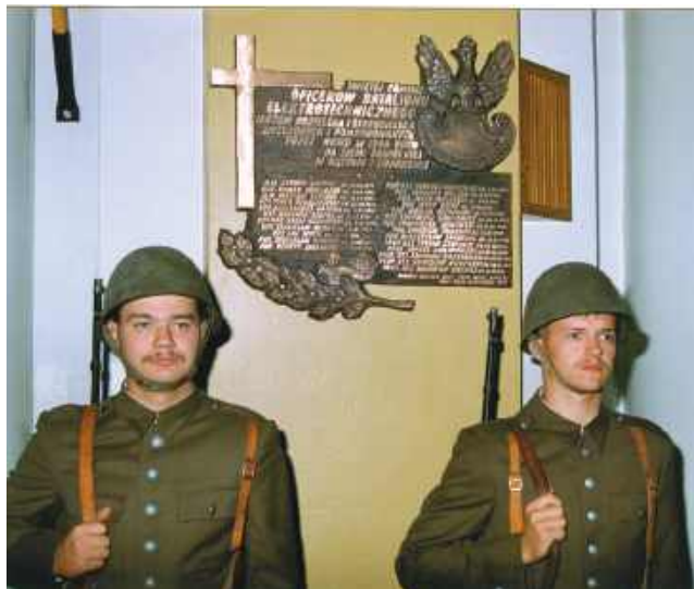
6.08.1994 Odświeżenie tablicy w kościele parafialnym w Nowym Dworze

Redakcja: - Panie Pułkowniku, bardzo dziękuję za rozmowę.