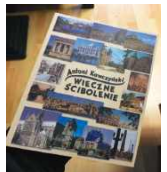
Książka opublikowana przez Wydawnictwo TiO. Do nabycia w księgarni „U Leszka” - Legionowo, Stefana Batorego 10

Mam ją na sobie, gdy piszę te słowa, marynarkę koloru marengo. Portki dawno przepadły, lecz marynarka wciąż w użyciu. Niekiedy kładę się na tapczanie, by uciąć sobie drzemkę. Myśl, że spanie w marynarce naraża ją na pogniecenie, ani trochę mnie nie wzrusza. Cackać się z nią nie warto, bo nic jej zaszkozić nie