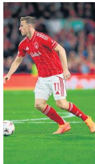
Nowozelandczyk Chris Wood w barwach Forest

Awans na mundial 2026 Kiwi osiągnęli bez żadnych problemów, bo w strefie Oceanii brakuje im poważnego konkurenta.