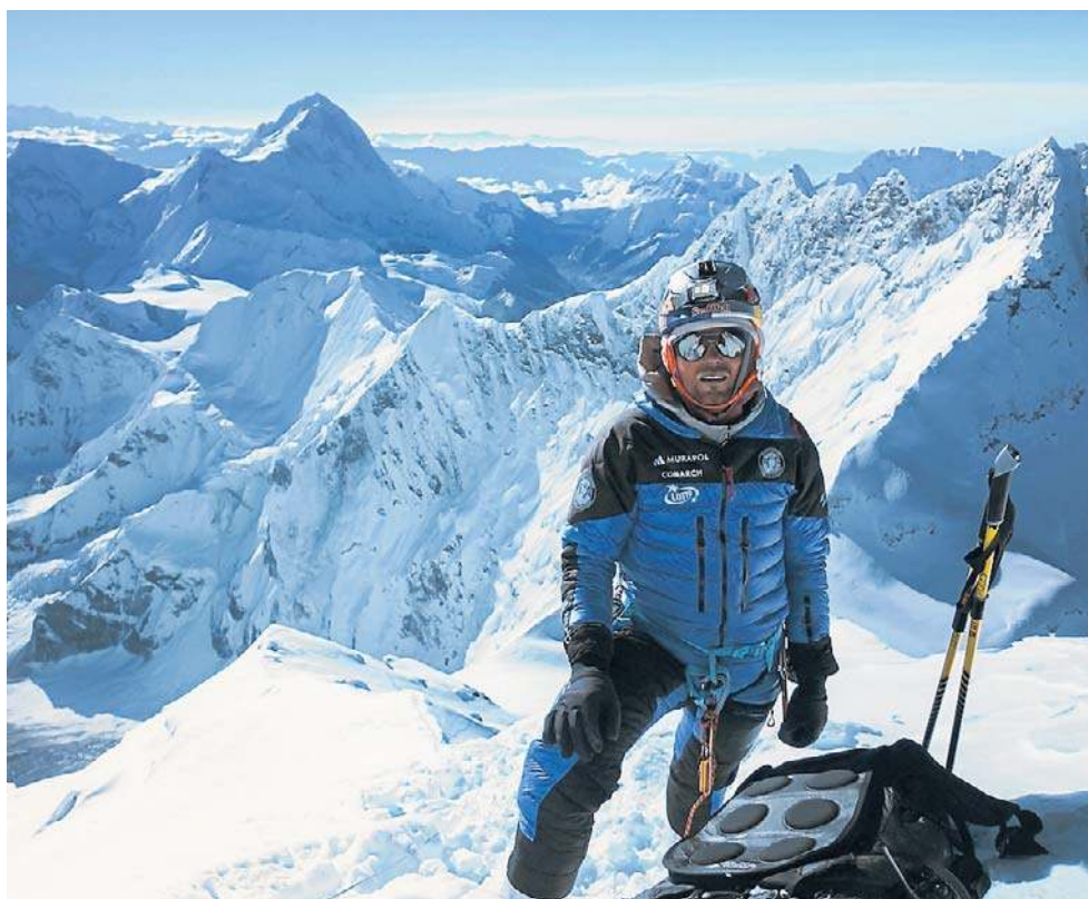
Andrzej Bargiel jako pierwszy zjechał na nartach z Mount Everestu bez wspomaganie tlenem

Tak, wspinaczkę pokazał mi mój brat i rozwijałem się w tym przez lata. Połączenie narciarstwa ze wspinaczką zaowocowało startem w zawodach przez prawie 10 lat, byłem w reprezentacji Polski, z sukcesami udawało się startować w Pucha-