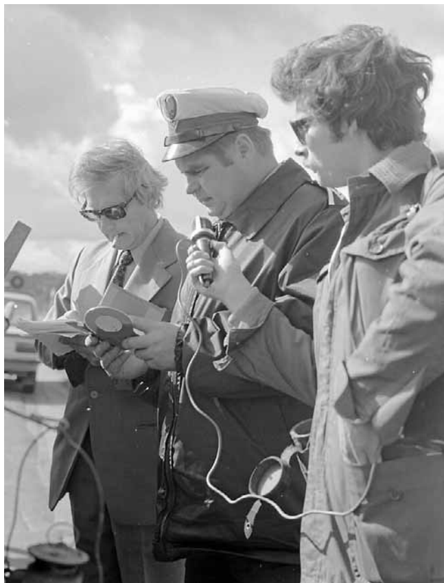
Święto MO i SB nigdy nie było spektakularne, przeciwnie – odbywało się nieco dyskretnie i raczej kameralnie, choć w propagandowym anturazju

Elementem widowiskowości uatrakcyjnione były uroczystości w 1974 r., gdy Szkole Podstawowej nr 10 w Poznaniu na Górczynie (dawniej św. Stanisława Kostki) nadano