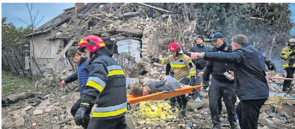
Tym razem Rosja zaatakowała tereny leżące przy granicy z Polska

W nocy rosyjskie wojska przeprowadziły też zmasowany