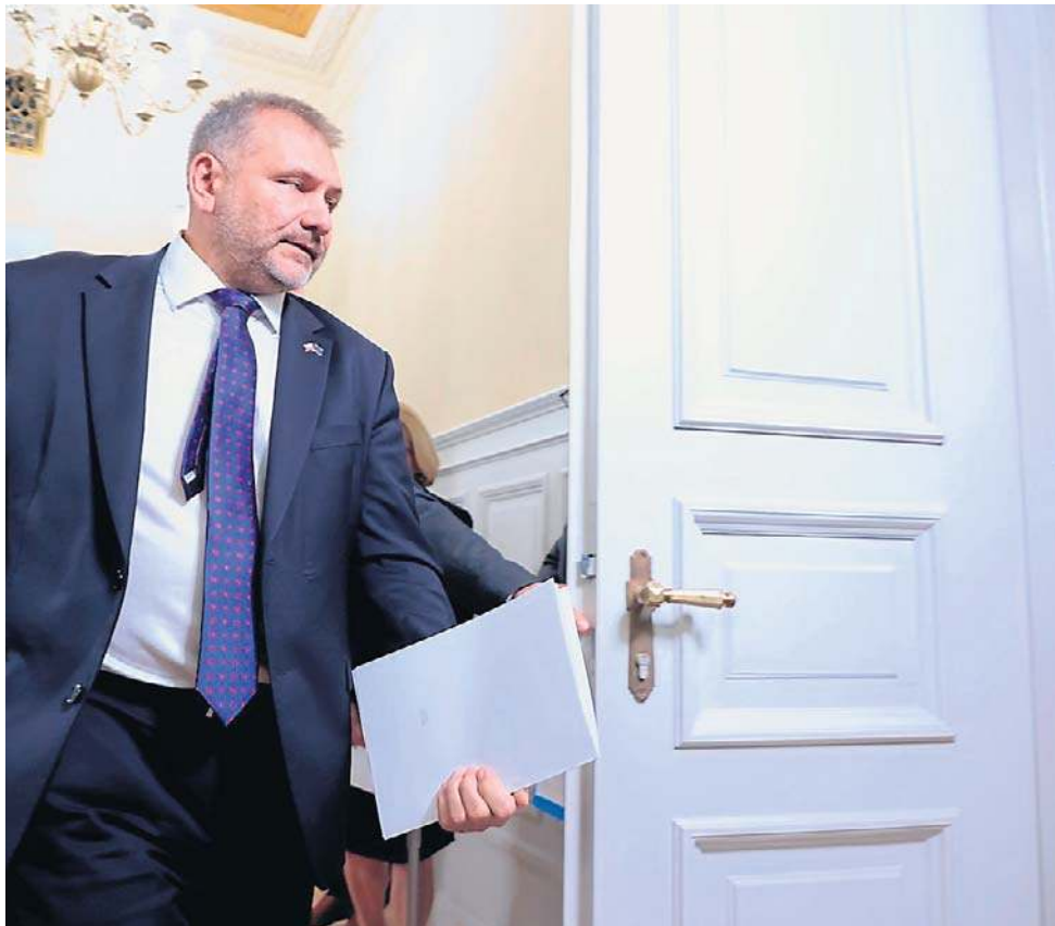
Minister Żurek podkreśla, że zmiany są zgodne z orzecznictwem Europejskiego Trybunału Praw Człowieka

Zareagował Zbigniew Ziobro, który stwierdził, że „Donald