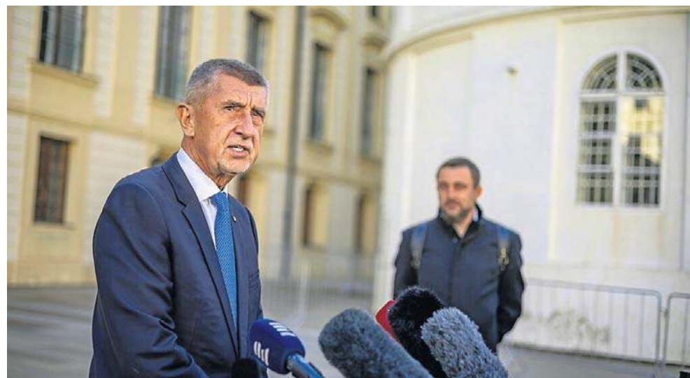
Andrej Babisz spotkał się w niedzielę z prezydentem Czech Petrem Pavlem

Pavel spotkał się także z politykami z koalicji SPOLU, która