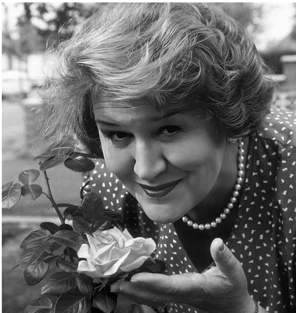
Patricia Routledge, posiadająca niesamowity talent komediowy, w serialu „Co ludzie powiedzą?” wspięła się na wyżyny swoich umiejętności aktorskich

- Ryszardzie, uważaj na ciężarówkę / Przecież stoi na parkingu! / Wtedy jest najbardziej niebezpieczna - ten dialog Hiacynty i Ryszarda dowodzi, że despotyczna małżonka, która nie ma pojęcia o prowadzeniu samochodu, uważa, że jest dokładnie na odwrót i uznaje za stosowne, by przekazać mężowi „cenne” wskazówki. Sytuacja z autem ma swoje odzwierciedlenie w każdej dziedzinie życia pani Bucket. To ona „najlepiej” gotuje, to ona ma „najlepszy” serwis do herbaty, to ona „najlepiej” przygotowuje parafialny piknik, to ona śpiewa „najlepiej”, to w niej wreszcie „kochają się” (tak na