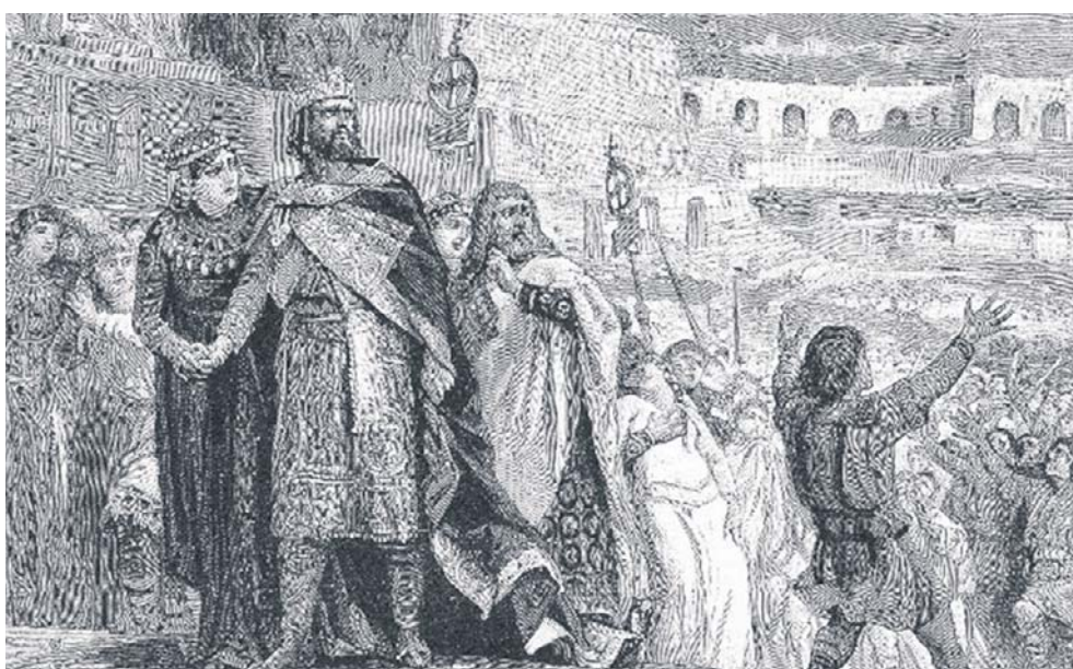
Ślub Marozji i jej przyrodniego brata, Hugona z Arles. Jego poprzednie małżeństwo zostało unieważnione przez papieża Jana XI

Początek ery sukcesów Teodory, żony wpływowego konsula, nastąpił wraz z początkiem pontyfikatu papieża Benedykta IV w 900 r., który – podobnie jak