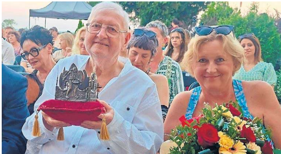
Reżyser Janusz Zaorski z żoną i koroną. Artysta jest jednym z głównych bohaterów tegorocznej edycji. W programie znalazła się retrospektywa jego filmów

Tegoroczna edycja festiwalu Festiwalu Filmów-Spotkań Niezwykłych zaskoczyła nową, rozszerzoną formułą. Wydarzenia odbywają się równolegle w trzech ośrodkach województwa świętokrzyskiego: Sandomierzu, Ostrowcu Świętokrzyskim oraz na Zamku Ćmielów.