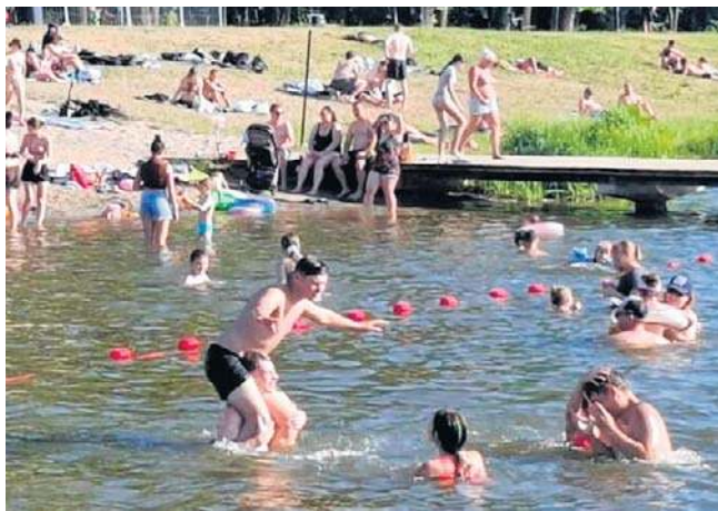
W sobotę i niedzielę dużo ludzi korzystało z kąpielisk na Borkach w Radomiu.

Choć słońce nie dawało wytchnienia, humory dopisywały. Tłumy wypoczywających sprawiły, że Borki przypominały nadmorski kurort. ©