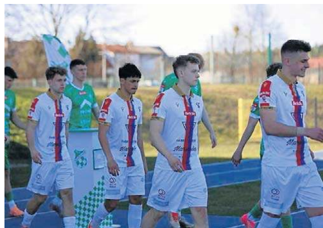
Co najmniej siedmiu zawodników Broni Radom jesienią zagra w innych klubach