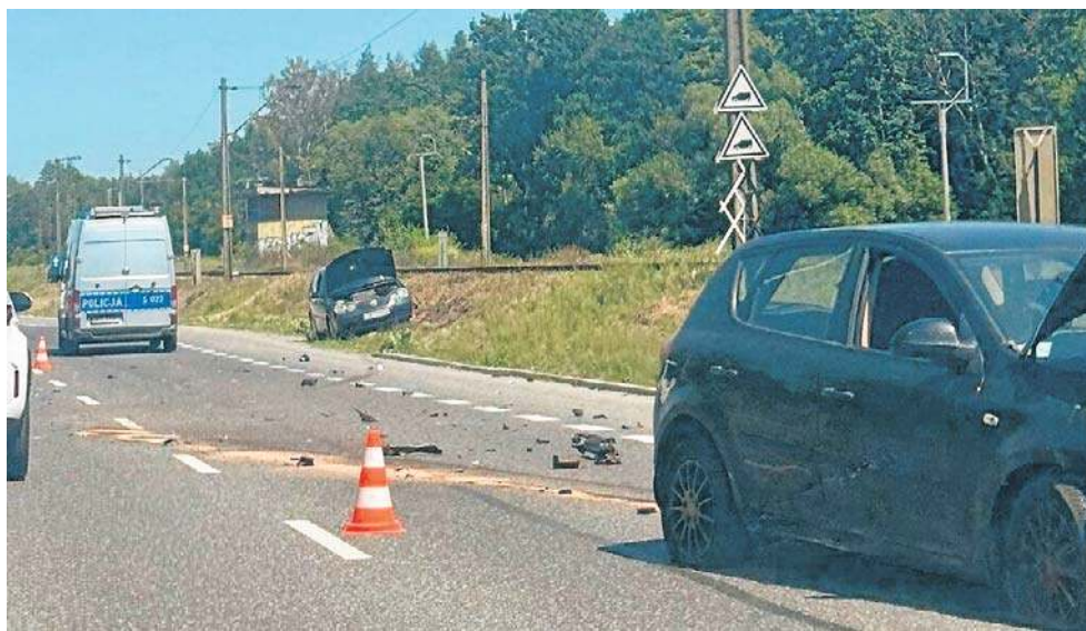
D zdarzenia doszło w popołudnie, 27 czerwca na ulicy Krakowskiej w Kielcach

Jak przekazywał młodszy inspektor Kamil Tokarski, rzecznik prasowy Komendy Wojewódzkiej Policji w Kielcach, w kolizji brały udział dwa pojazdy osobowe: Volkswagen Polo i Kia Ceed. - Kierowcy zdołali sami opuścić pojazdy, nie odnieśli obrażeń - informował Kamil Tokarski.