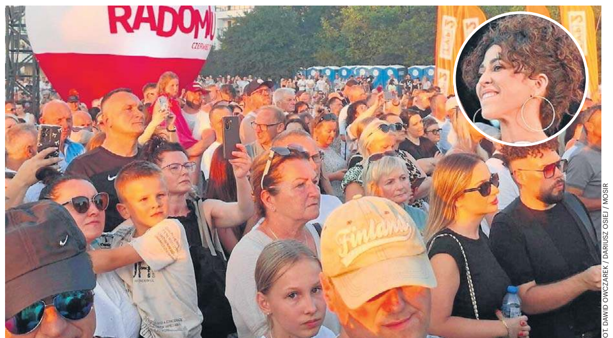
Na koncercie na Borkach bawili się mnóstwo osób. Jedną z gwiazd była Natalia Kukulska.