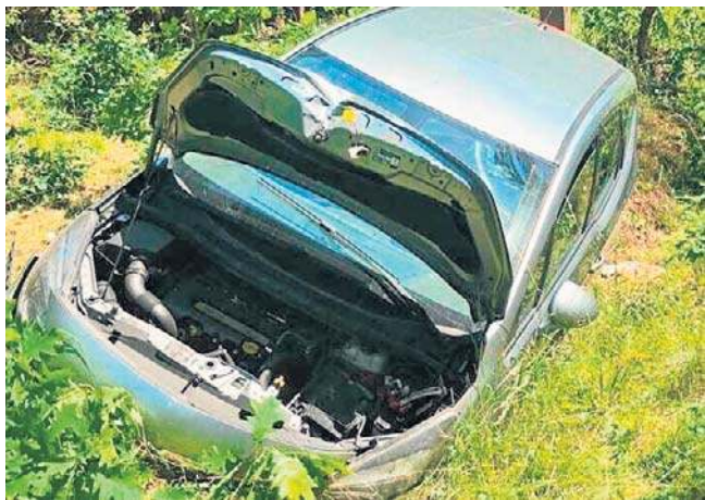
Pojazd zjechał z drogi do rowu i uderzył w przepust w miejscowości Wolica w gminie Szydłów