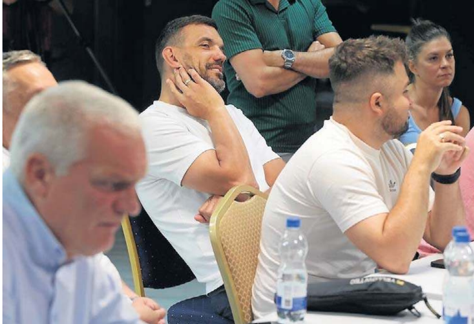
Wspólne losowniaie grup Ligi Mistrzów w Industriad. W środku Michał Jurecki

Dyrektor sportowy Industriad Kielce Michał Jurecki komentował na gorąco. - Z zespołami z Niemiec i Norwegii w ostatnich latach spotykaliśmy się regularnie, więc wiemy o sobie dużo. Nowa formuła EHF Ligi Mistrzów spowodowała, że pojawiło się osiem nowych i bardzo ciekawych zespołów, a jedną z nich jest szwajcarska ekipa z Lucerny. Z perspektywy kibiców