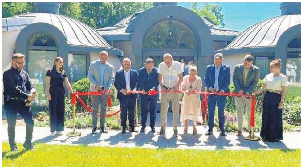
Wielkie otwarcie nowej inwestycji - Domów Kopułowych w hotelu Manor House SPA w Chlewiskach.

Uroczystość rozpoczęła się w zabytkowej Stajni Platera,