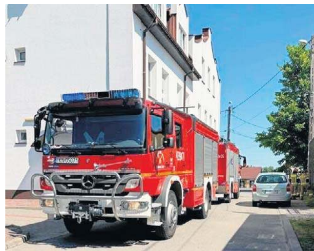
Jedną z instytucji, do których wpłynęło zgłoszenie, był Urząd Miasta i Gminy w Gowarczowie

Choć to alarmy tak zwanej małej wiarygodności, w ośmiu miejscach zdecydowano się na ewakuację. Oto one. W powiecie opatowskim maila dostała szkoła w Iwaniskach. Został odczytany około godziny 8.20. W budynku znajdowało się wtedy 30 osób. Zostały