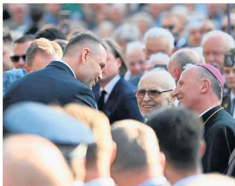
FOT. FEB BISKUP, MAREK SOLARCZYK