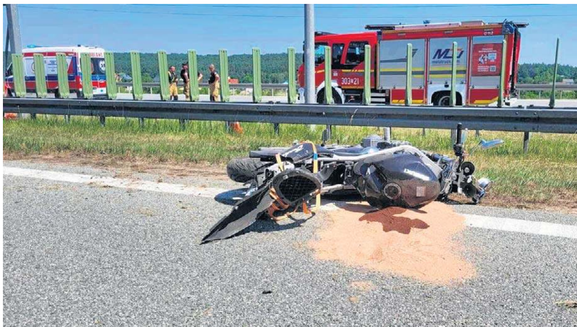
Do wypadku doszło w niedzielne przedpołudnie, 28 czerwca, na trasie S7 - kierunku na Kraków