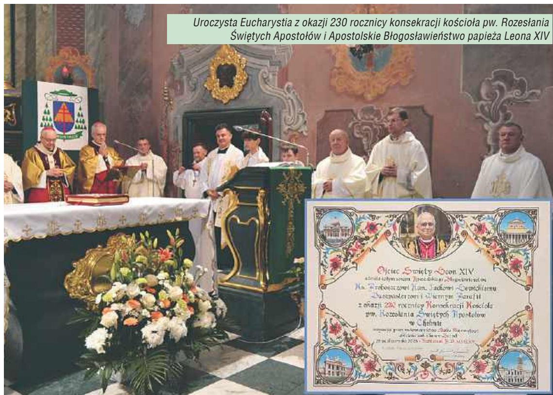
Uroczysta Eucharystia z okazji 230 rocznicy konsekracji kościoła pw. Rozesłania Świętych Apostołów i Apostolskie Błogosławieństwo papieża Leona XIV

W tym roku parafia przeprowadziła gruntowną wymianę ogrodzenia wokół całej posesji - ponad 600 metrów bieżących. Prace trwały od przełomu maja i czerwca do początku listopada. Pomysł narodził się 2,5 roku temu, ponieważ dotychczasowe ogrodzenie - około stu-