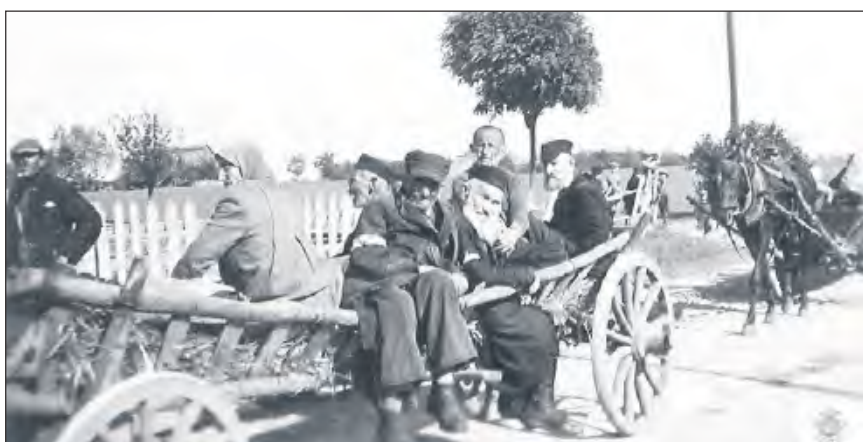
Starców i dzieci Niemcy załadowali na furmanki i przewieźli do stacji kolejowej w Sobolewie

Wieczorem 29 września 1942 r. niewielkie oddziały żandarmerii niemieckiej otoczyły żelechowskie getto