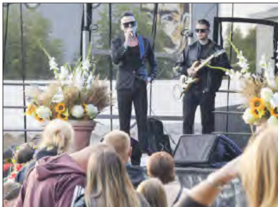
Zespół Milano na scenie w Borowiu

Dożynki Gminno-Parafialne „Święto Gminy Górzno - Dożynki 2025”, które odbyły się 24 sierpnia, kosztowały łącznie