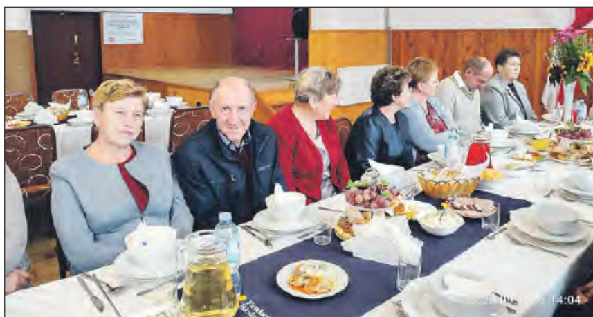
☛ W czwartym „Daniu wspólnych chwil” uczestniczyło blisko 70 mieszkańców, głównie z Trojanowa

» Koło Gospodyń Wiejskich w Trojanowie z przewodniczącą Anną Mądrą na czele ma za sobą pracowite miesiące. Panie zorganizowały serię udanych biesiad, wyjazdów edukacyjnych i spotkań z ekspertami