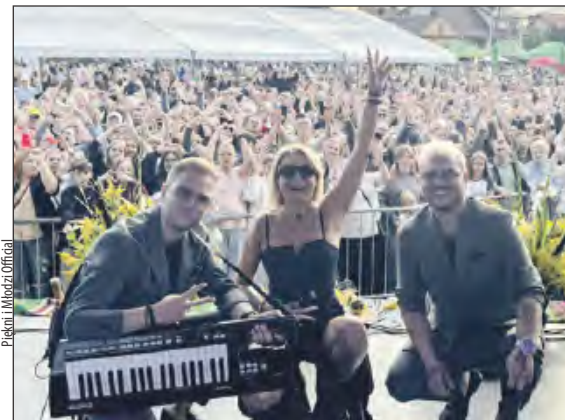
Piękn i Młodzi byli gwiazdą dożynek w Górznie

109 035 zł. Z tej kwoty 79 035 zł pochodziło ze środków własnych gminy, a 30 000 zł z Urzędu Marszałkowskiego.