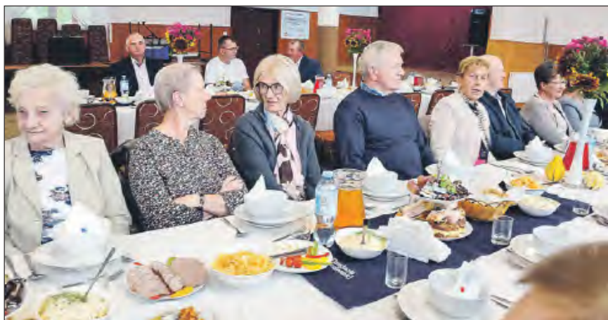
☛ Dobrze przyjęte przez mieszkańców Trojanowa zostały spotkania w ramach cyklu „Danie wspólnych chwil” z fundacją Biedronki