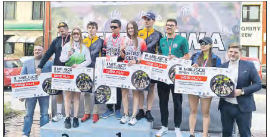
Zwycięzcy tegorocznych Mistrzostw Polski w Maratonie na Rolkach

» W sobotę, 27 września, Łaskarzew rozbrzmiewał rytmem kółek i okrzykami kibiców, stając się sportową stolicą Polski. Odbyły się tu Mistrzostwa Polski w Maratonie na Rolkach