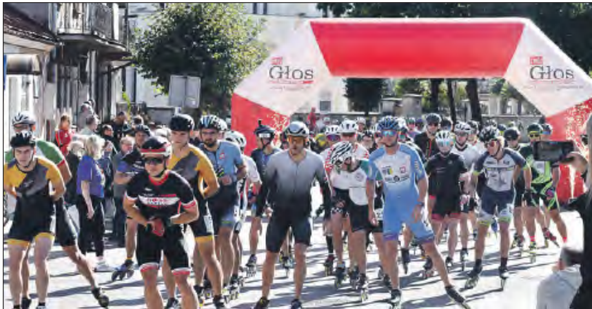
Na starcie tegorocznych Mistrzostw Polski stanęło ponad 200 zawodników