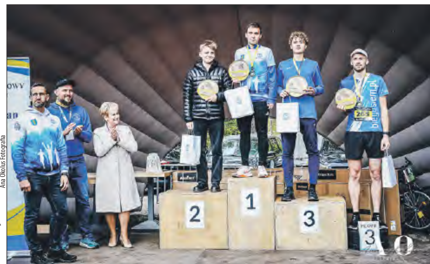
➤ Najszybsi biegacze „Połówki w lesie” (kat. open)