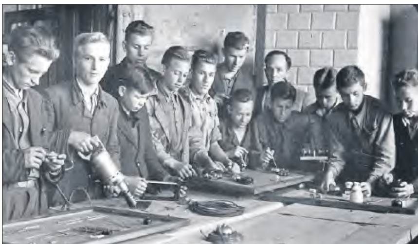
Uczniowie podczas zajęć w tymczasowej sali zajęć praktycznych