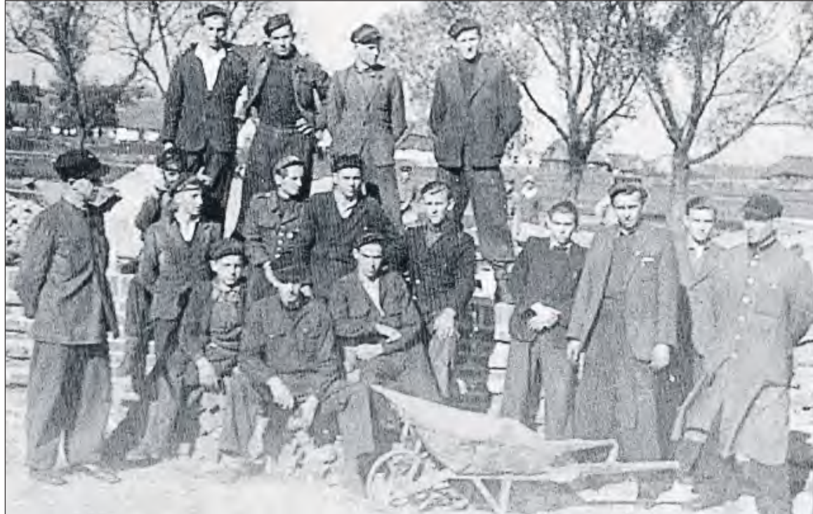
Uczniowie - budowniczości szkoły

H istoria szkoły rozpoczęła się jesienią 1945 roku, kiedy powołano do życia Publiczną Średnią Szkołą Zawodową przy Parowozowni w Dęblinie. Była to bezpośrednia odpowiedź na potrzeby środowiska lokalnego, a zwłaszcza na zapotrzebowanie Dęblińskiego Węzła Kolejowego, który odgrywał wówczas ogromną rolę gospodarczą w regionie. Dzięki determinacji i zaangażowaniu grona pedagogicznego oraz społeczności lokalnej, kształcenie pierwszych uczniów rozpoczęło się w pomieszczeniach socjalnych Związku Zawodowego Kolejarzy. Choć brakowało mebli, pomocy dydaktycznych i odpowiedniego zaplecza, od samego początku przyświecała wszystkim idea stworzenia miejsca, w którym młodzież będzie mogła zdobywać wiedzę i umiejętności zawodowe, przygotowujące do pracy w ważnych dla kraju gałęziach gospodarki.