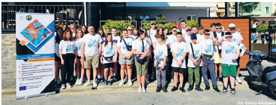
fol. Gmina Włodawa

● GM. WŁODAWA Szkoła Podstawowa im. Jana Pawła II w Orchówku po raz kolejny znalazła się w gronie placówek, które skutecznie sięgają po europejskie fundusze. Dzięki programowi Erasmus+ uczniowie i nauczyciele wyjadą do Grecji, by rozwijać swoje kompetencje, poznawać nowych ludzi i czerpać wiedzę w międzynarodowym towarzystwie. Tym razem placówka otrzymała blisko 94 tysiące euro dofinansowania.