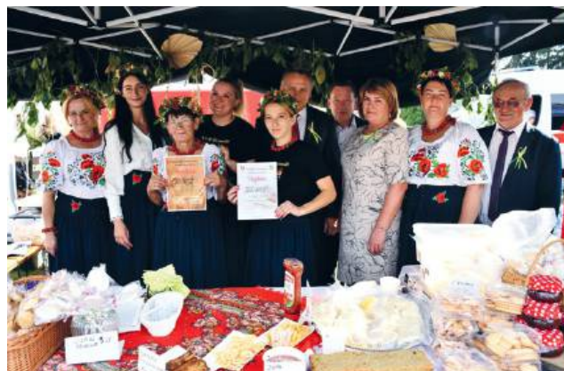
KGW Drewniki wygrało konkurs na najładniejsze stoisko

Na uwagę zasługiwał staranny wystrój miejsca dożynek przygotowany przez pracowniczki Gminnego Centrum Kultury w Siennicy Nadolnej, który nadał uroczystości wyjątkowy charakter.