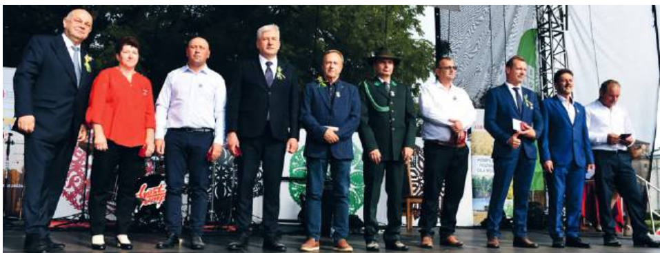
Laureaci odznak honorowych „Zasłużony dla rolnictwa”