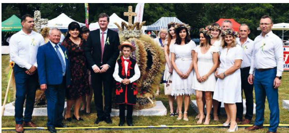
Delegacja z gminy Gorzków ze zwyciężkim wieńcem będzie reprezentowała 14 września powiat krasnostawski podczas dożynek wojewódzkich w Swidniku

Wyjątkowym punktem uroczystości było wręczenie Nagród Kulturalnych Woje-