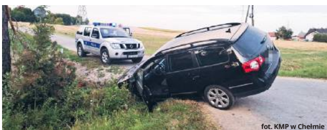
fol. KMP w Chełmie

● GM. CHEŁM Pijany 47-latek z gminy Chełm podróżował volkswagenem wraz z nietrzeźwym pasażerem. Jak się okazało, sam też był mocno pijany – miał w organizmie 4 promile alkoholu. Gdy wjechał do rowu, poprosił o pomoc w wyciągnięciu auta przypadkowego kierowcę, a ten, widząc co się święci, zaalarmował służby.