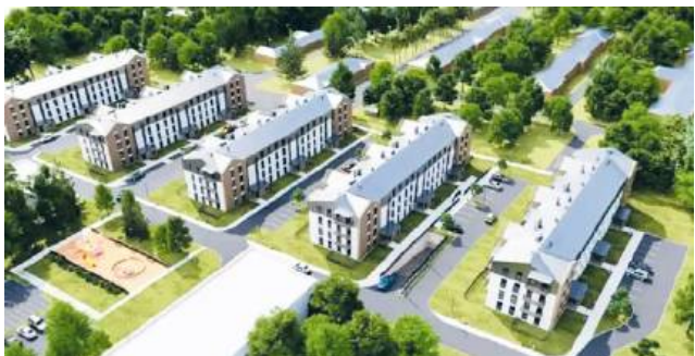
Wizualizacja nowych budynków przy ul. Hrubieszowskiej

Miasto nie kupi terenów pod planowaną zabudowę mieszkaniową. Powód - zbyt wysokie koszty. Zamiast tego stawia na inne projekty komunalne.