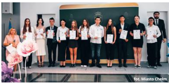
fol. Miasto Chełm

W tym roku stypendia trafiły do 213 osób, które nie tylko osiągnęły wybitne wyniki w nauce, ale również wyróżniają się wzorową oceną z zachowania, angażują się w działania społeczne na rzecz szkoły i środowiska, a także reprezentują Chełm w konkursach, olimpiadach i projektach edukacyjnych na szczeblu wojewód-