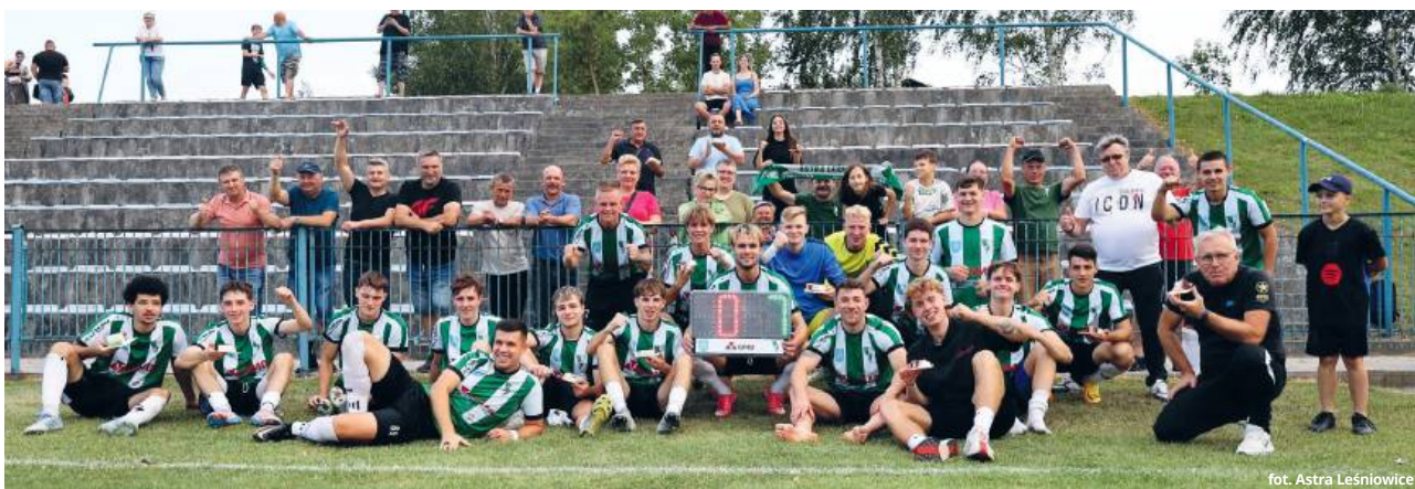
fol. Astra Leśniowice

- Muszę przyznać, że oba zespoły stworzyły wspaniałe widowisko, które śmiało mogłoby konkurować z poziomem IV ligi, a do tego przy pełnych try-