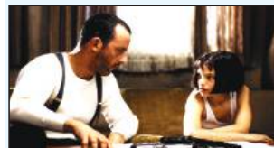
22.30 Leon zawodowiec - dramat sensacyjny, Francja, USA, 1994, reż. Luc Besson, wyk. Jean Reno, Natalie Portman, Gary Oldman, Danny Aiello, Peter Appel