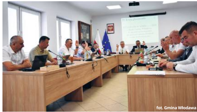
fol. Gmina Włodawa

Drugą strategiczną decyzją było przystąpienie gminy do Związku Gmin Lubelszczyzny. Jest to organizacja zrzeszająca samorządy regionu w celu współpracy, wymiany doświadczeń oraz wspólnego aplikowa-