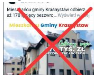
fol. UG Krasnostaw

● GM. KRASNYSTAW Mieszkańcy powinni zachować ostrożność przy korzystaniu z ofert publikowanych w Internecie, związanych z programem „Czyste Powietrze”. W sieci pojawiają się reklamy i linki sugerujące współpracę z urzędem, a nie jest to prawda.