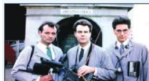
22.00 Pogromcy duchów: Imperium lodu - komedia fantasy, USA, 2024, reż. Gil Kenan, wyk. Paul Rudd, Carrie Coon, Finn Wolfhard, McKenna Grace, Kumail Nanjiani

0.20 Tower Heist: Zemsta cieciorów - komedia sensacyjna, USA, Japonia, 2011, reż. Brett Ratner, wyk. Eddie Murphy, Ben Stiller, Casey Affleck, Alan Alda