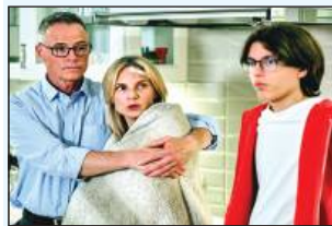
20.15 Na Wspólnej - serial