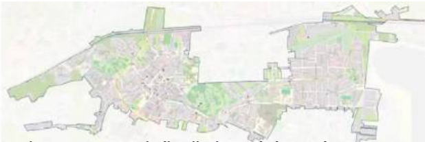
Gminny Program Rewitalizacji Miasta Chełma na lata 2024-2030

Celem rewitalizacji jest „poprawa jakości życia mieszkańców obszaru rewitalizacji poprzez zintegrowane działania