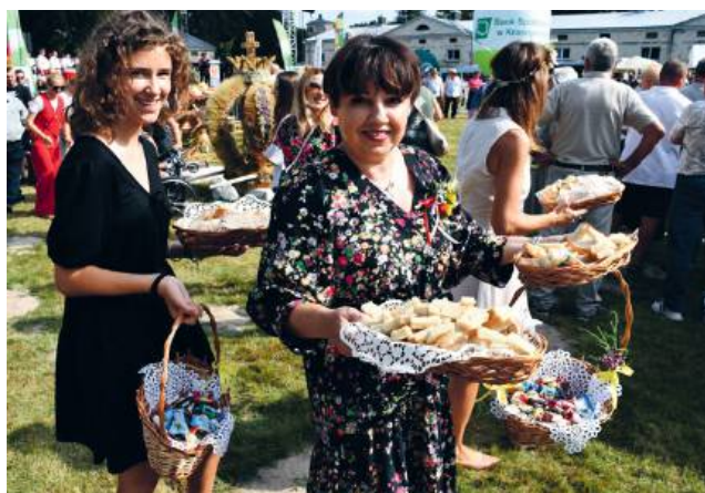
Po tradycyjnym obrzędzie przyszedł czas na dzielenie się chlebem