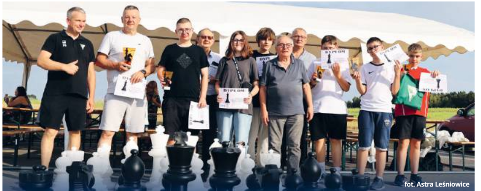
fol. Astra Leśniowice