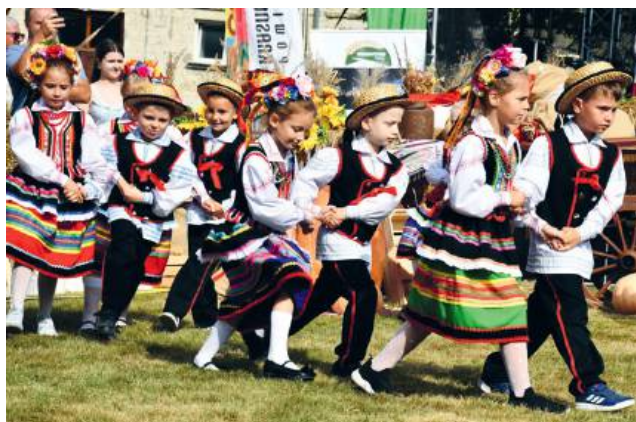
Występ dzieci z przedszkola w Siennicy Nadolnej