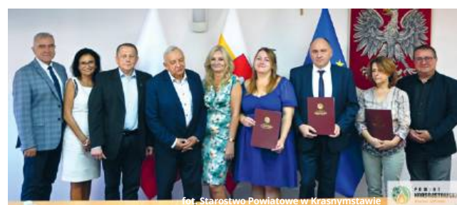
fol. Starostwo Powiatowe w Krasnymstawie

● POW. KRASNOSTAWSKI W Starostwie Powiatowym w Krasnymstawie odbyła się uroczystość wręczenia aktów nadania stopnia awansu zawodowego nauczyciela mianowanego. To ważny moment w karierze pedagogów, którzy swoją codzienną pracą kształtują młode pokolenie i mają bezpośredni wpływ na przyszłość lokalnej społeczności.