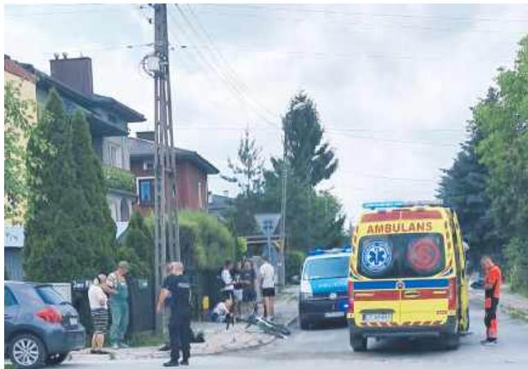
Środowy wypadek na skrzyżowaniu ulic Kilińskiego i Ogrodniczej w Chełmie

W Chełmie praktycznie codziennie są wypadki na elektrycznej hulajnodze. Póki co kończy się na niegroźnych urazach, ale jeśli nie zaczniemy jeździć wolniej i zgodnie z przepisami, tylko patrzeć, jak dojdzie do prawdziwej tragedii. - Hulajnoga to nie zabawka - obowiązują przepisy i zdrowy rozsądek - podkreślają ratownicy i policjanci.