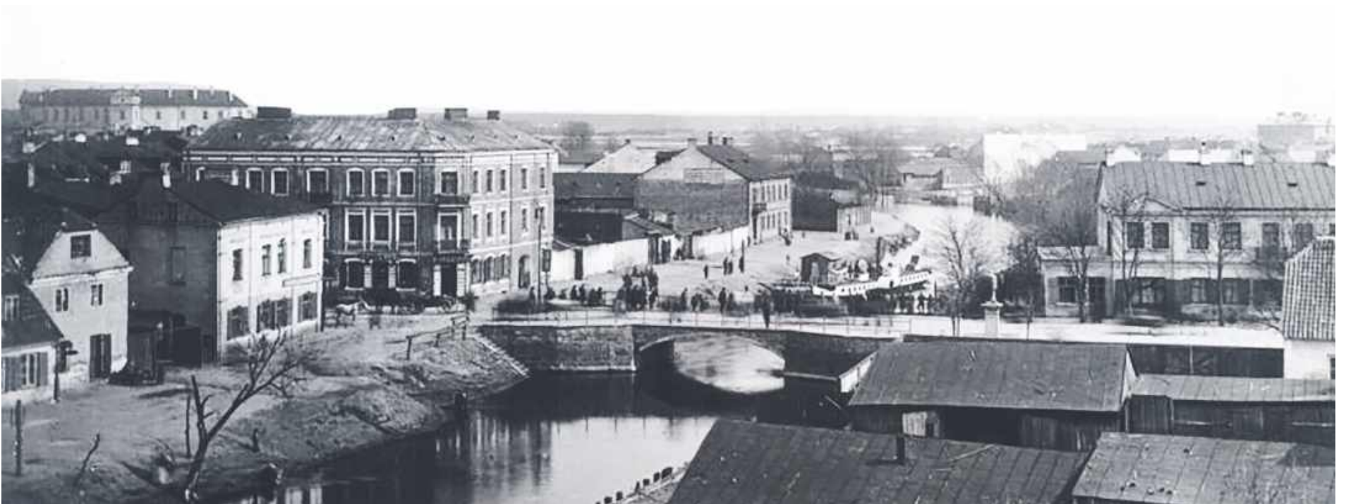
Most kozacki (dzisiejszy Świętojański). Początek XX wieku.

„Miejska Rada Narodowa miasta Pułtuska zebrana na uroczystym, nadzwyczajnym posiedzeniu [...] w gmachu Zarządu Miejskiego w Pułtusku dla uczczenia 70-lecia urodzin Generalissimusa Związku Radzieckiego Józefa Stalina jednogłośnie postanawia: odbudowany w miejscu zniszczonego przez krwawego okupanta hitlerowskiego i oddany do użytku publicznego w dniu dzisiejszym most żelbetonowy na kanale przy ul. Armii Czerwonej w Pułtusku nazwać imieniem Józefa Stalina, Twórcy nowej epoki, Twórcy wieczystego pokoju, Wodza klasy robotniczej całego świata, przewodnika i nauczyciela światowej demokracji” – taką oto uchwałę podjęła 21 grudnia 1949 roku na Miejska Rada Narodowa w Pułtusku. I tak oto Stalin zastąpił jako patron św. Jana Nepomucena.