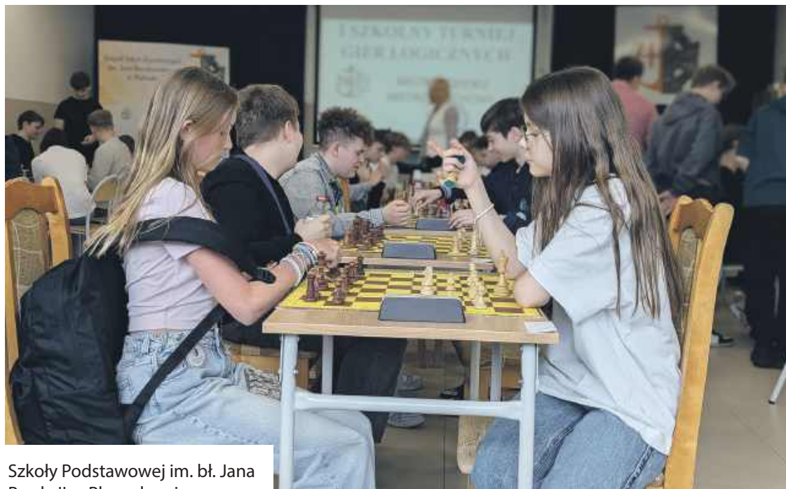
Szkoły Podstawowej im. bł. Jana Pawła II w Płocochowie.