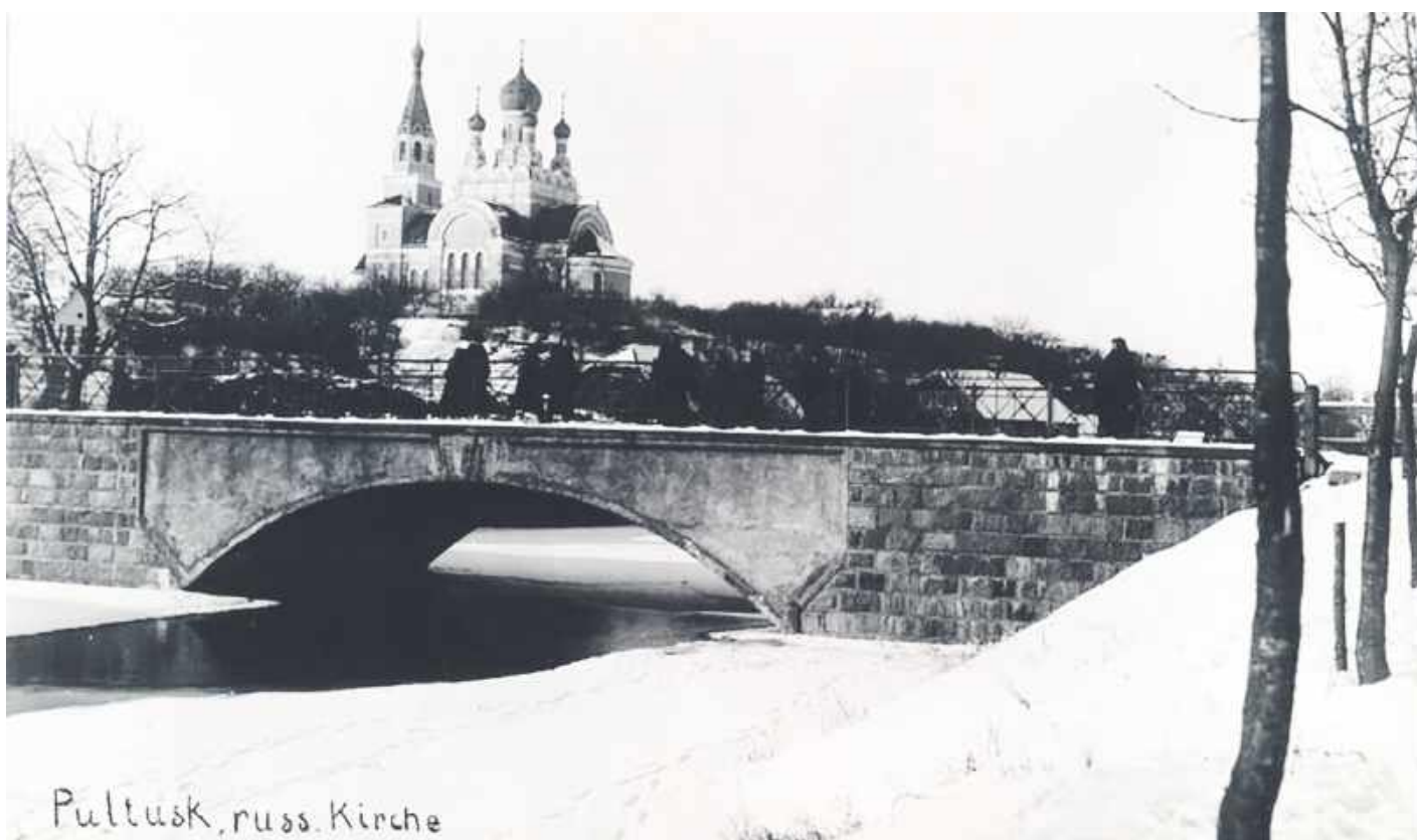
Pultusk, russ. Kirche Most Benedyktyński. W tle cerkiew w Pułtusk.