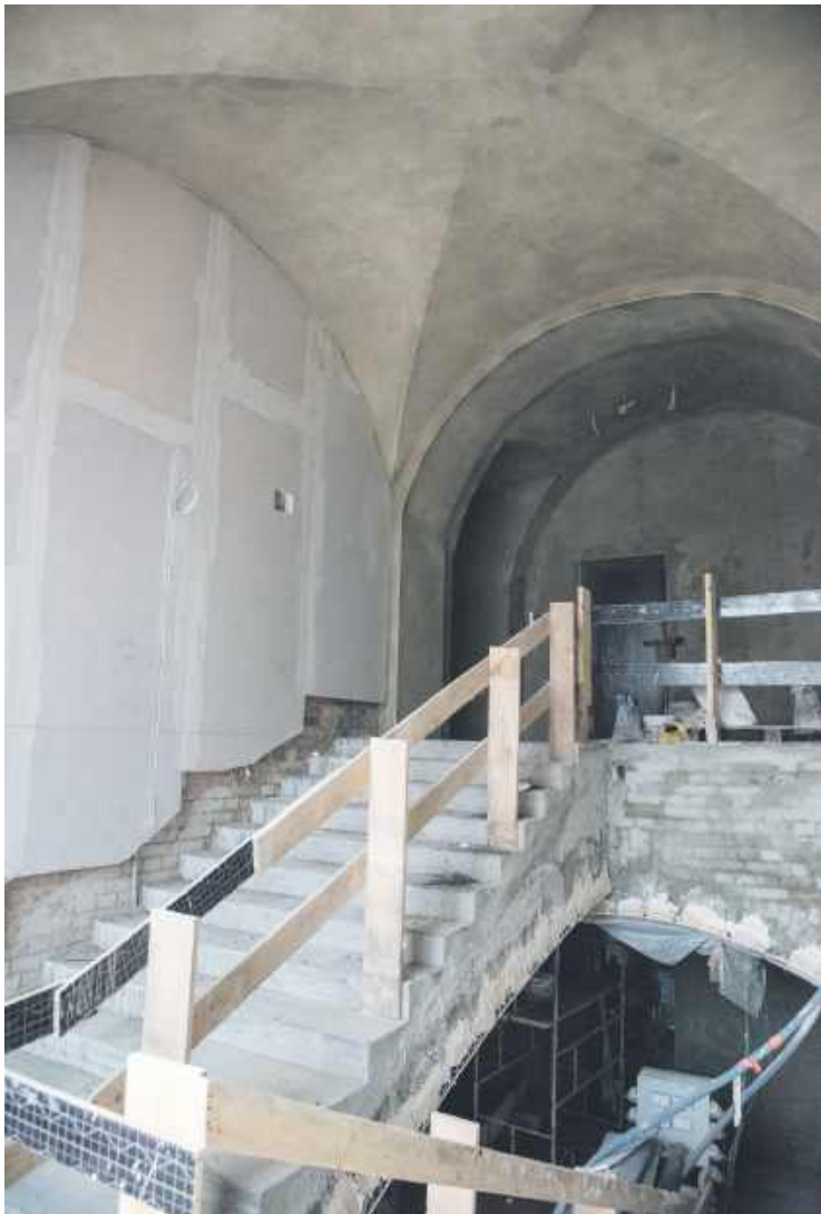
Przestronne korytarze z pięknymi łukami na sufitach