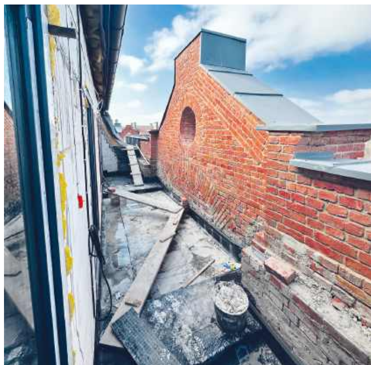
Największe z mieszkań mają ponad 70 metrów a dwa będą miały piękne balkony

■ Grzegorz Hubert Gerek grzegorz.gerek@pultusk24.pl