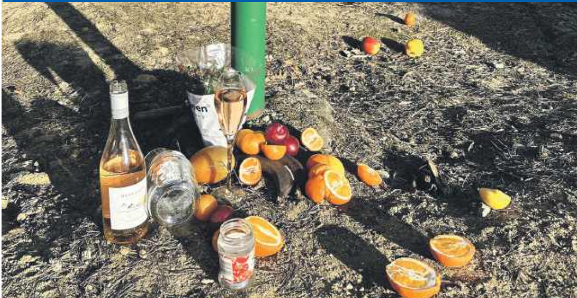
DARY DLA BOGA WEGE