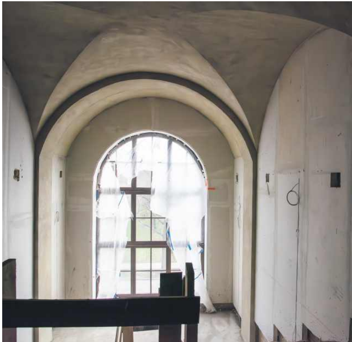
Duże, stylowe okna nadają wnętrzem ekskluzywnego charakteru

pie realizacji inwestycji, trochę zaskakują. O ile można zrozumieć, że w trakcie prac okazało się, że jakiś narożnik wiekowego budynku osiada i trzeba go wzmocnić, to trudno zrozumieć, dlaczego w pierwotnym kosztorysie (a więc i umowie) nie były uwzględnione takie koszty, jak koszt przyłączenia instalacji elektrycznej czy koszty remontu nadproży w korytarzach i mieszkaniach. Nie da się chyba uznać inwestycji za zrealizowaną, jeśli nie ma ona przyłączy elektrycznych! Ten koszt był więc konieczny od samego początku.