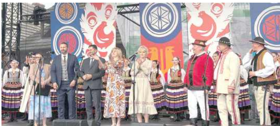
Organizatorem festiwalu od trzech lat jest Centrum Spotkania Kultur w Lublinie, które z powodzeniem kontynuuje i rozwija ideę zapoczątkowaną w 1966 roku

Wydarzenia festiwalowe odbywały się na dwóch scenach – Dużym i Małym Rynku, gdzie od piątku do niedzieli prezentu-