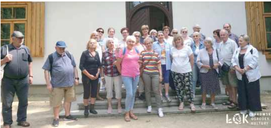
Uczestnicy wyjazdu poznali historię rodziny Sienkiewiczów