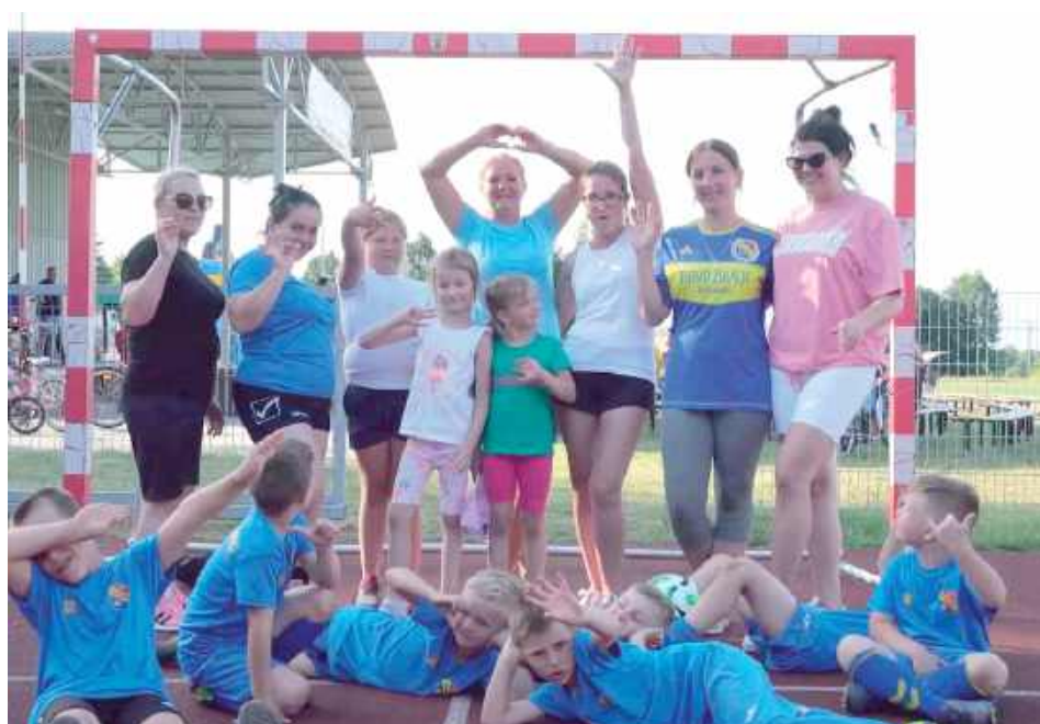
Unia Krzywda zakończenie sezonu 2024/2025

Unia Krzywda oficjalnie zakończyła sezon 2024/2025 w sobotę, 21 czerwca. Wydarzenie odbyło się na stadionie klubowym, gdzie podsumowano całą kampanię ligową.