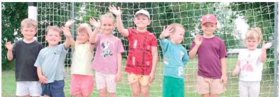
Mali sportowcy chętnie wzięli udział w konkurencjach

W trakcie olimpiady maluchy rywalizowały głównie w konkurencjach lekkoatletycznych, takich jak sprinty na krótkim dystansie, skoki w dal oraz zabawowe konkurencje zręcznościowe. Wydarzenie trwało kilka godzin, w przerwach zapewniono uczestnikom napoje i przekąski. Organizatorzy przygotowali także pamiątkowe medale, które