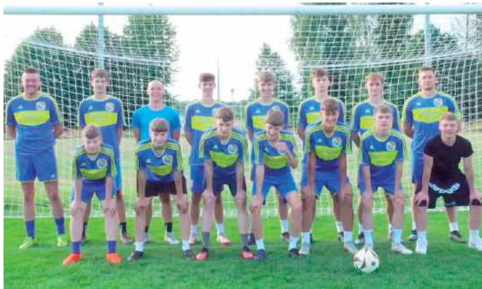
Unia Krzywda zakończenie sezonu 2024/2025