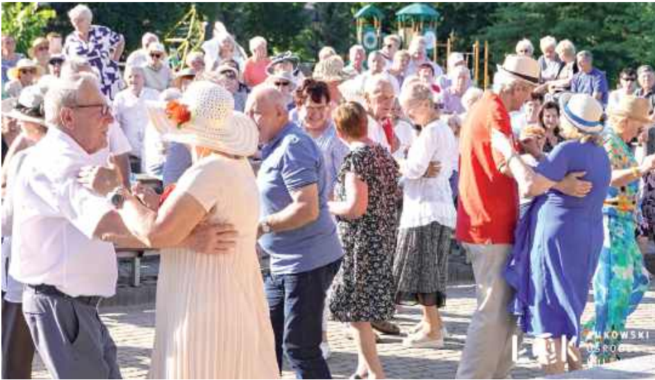
Seniorzy pełni wigoru ruszyli do tańca