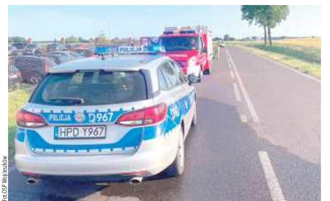
Do zderzenia samochodów doszło na drodze wojewódzkiej nr 808 w Bystrzycy

W pojazdach podróżowały cztery osoby, w tym mała dziewczynka. Po zderzeniu wszyscy uczestnicy wypadku opuścili pojazdy o własnych siłach przed przyjazdem służb ratunkowych. W wyniku zdarzenia dziewczynka została poszkodowana. Na miejsce