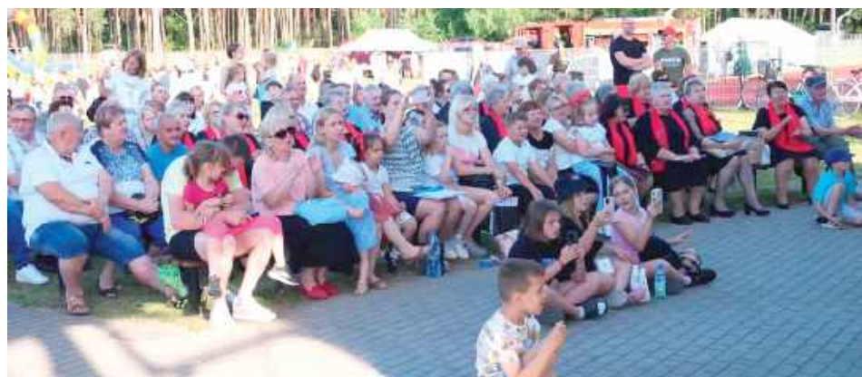
Mieszkańcy czekają na wakacyjne pikniki - jest to szansa na spotkanie w większym gronie i zaznanie rozrywki na świeżym powietrzu

W czwartkowe popołudnie, 26 czerwca na terenie GOSiR w Krzywdzie odbyło się wydarzenie zaplanowane przez wójta gminy, Gminną Bibliotekę Publiczną, Koło Gospodyń Wiejskich, OSP Krzywda oraz LKS Unia Krzywda.