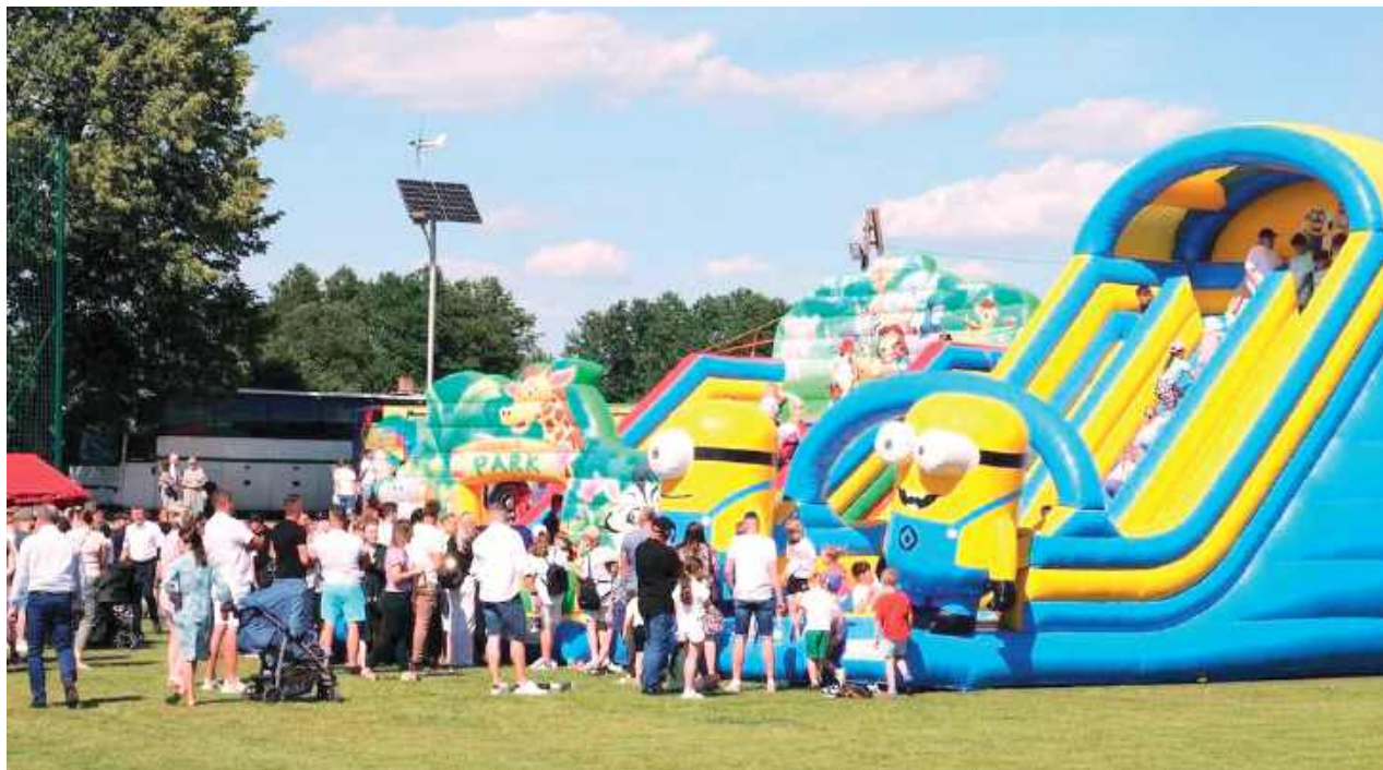
Hucznie obchodzono jubileusz w gminie