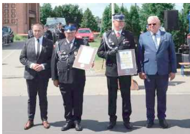
Nagrodom i podziękowaniom nie było końca - strażacy zasłużyli jak mało kto!