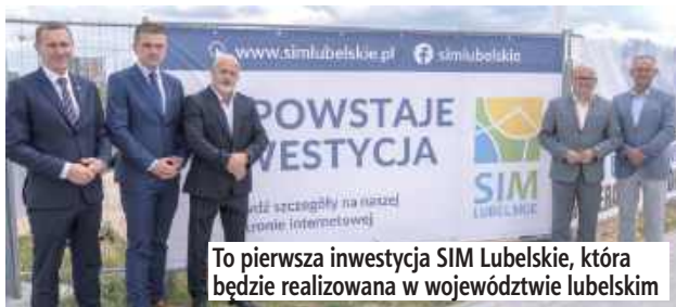
To pierwsza inwestycja SIM Lubelskie, która będzie realizowana w województwie lubelskim

Inwestycję realizuje spółka SIM Lubelskie, która zajmuje