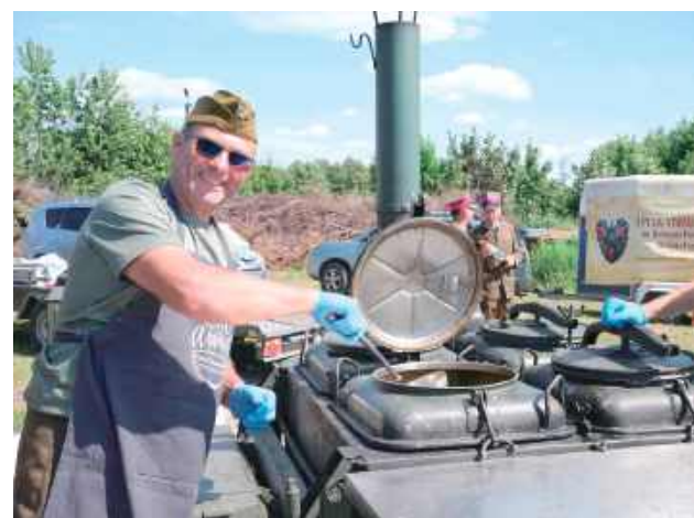
Nie mogło zabraknąć wojskowej grochówki!