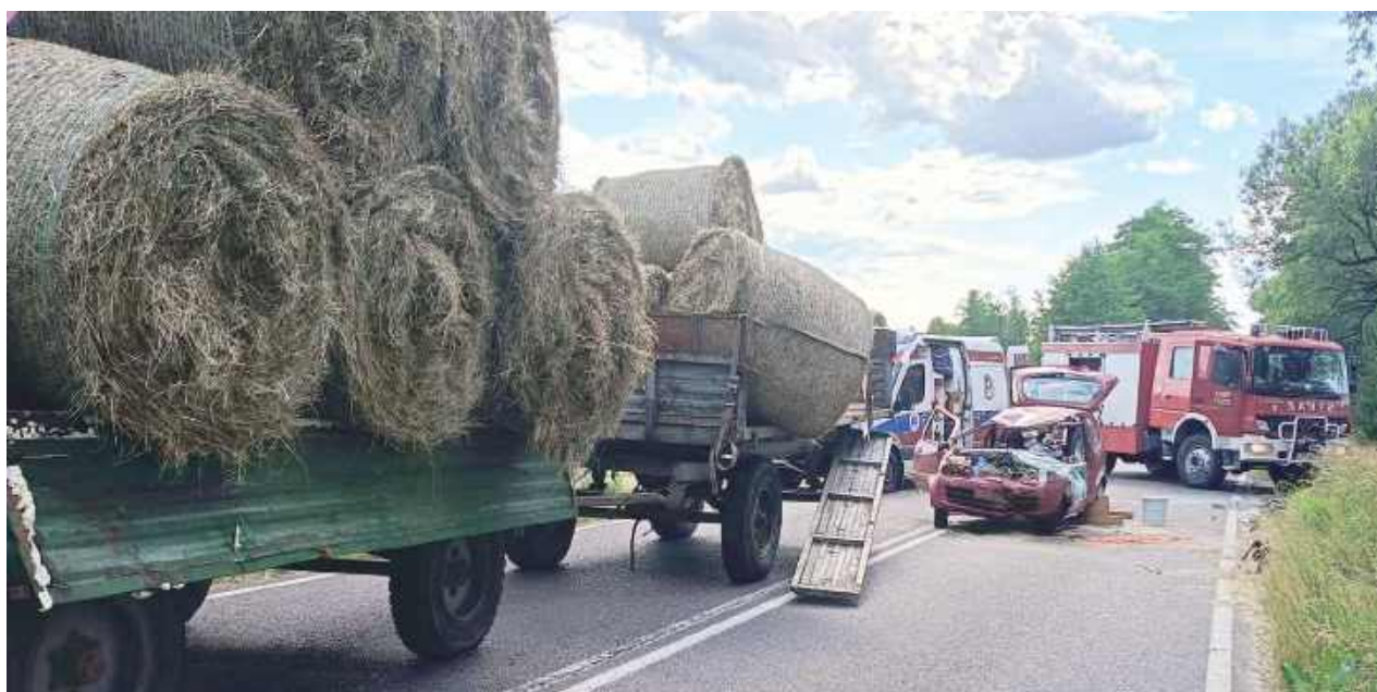
Usuwanie skutków zderzenia pojazdów w Werchliśu wymagało pracy wielu strażaków

Po akcji strażak z OSP napisał na profilu alarmujący post adresowany do mieszkańców gminy Janów Podlaski.