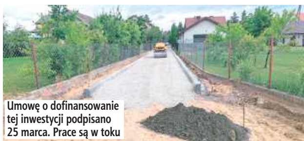
Umowę o dofinansowanie tej inwestycji podpisano 25 marca. Prace są w toku

Całkowity koszt zadania wynosi 491 721,79 zł. Połowę tej kwoty, czyli 245 860,89 zł, gmina pozyskała z Rządowego Funduszu Rozwoju Dróg. Pozostała część, czyli 245 860,90 zł, pochodzi ze