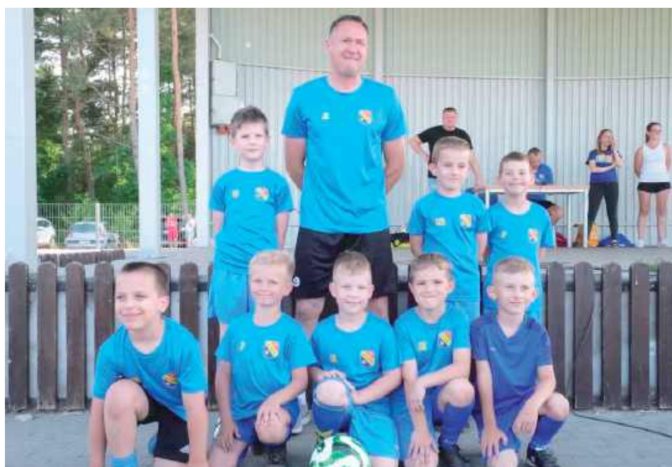
Unia Krzywda zakończenie sezonu 2024/2025