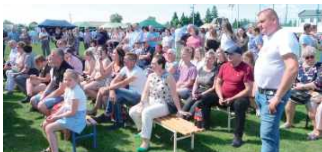
Kładna pogoda i chęć świętowania wraz ze strażakami przyciągnęły tłumy