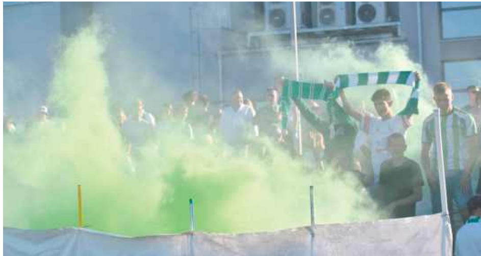
Przed godziną 22:00 świętowanie awansu przeniosło się w centralny punkt miasta. Nie potraowało to długo. W pewnym momencie w pobliżu wiwatujących pojawił się policyjny radiowóz

Jak wielka była radość biało-zielonej rodziny z wywalczenia promocji do najwyższej klasy rozgrywkowej w województwie lubelskim. 22 czerwca Ruch rozbił aż 8:0 zespół Gromu Różaniec.