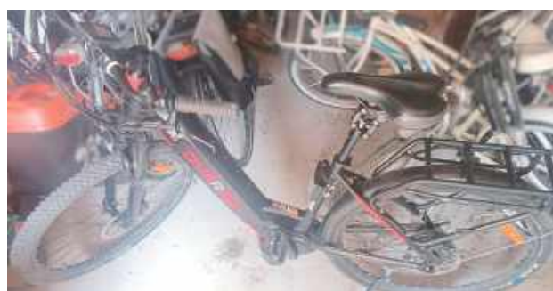
Warszawianin odzyskał swój rower dzięki policjantom z Łukowa

39-letni warszawiak zgłosił kradzież roweru z podziemnego garażu jednego z osiedli mieszkaniowych w stolicy. Jak wynikało z jego relacji, jednoślad o wartości ponad 10 tysięcy złotych był wyposażony w fabryczny nadajnik GPS, który umożliwił zlokalizowanie skradzionego mienia. Z uzyskanych danych wynikało, że rower znajduje się w jednej z miejscowości na terenie gminy Łuków.