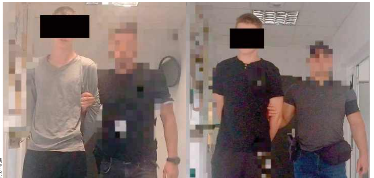
Policjanci ustalili i zatrzymali napastników. Teraz najbliższe 3 miesiące spędzą w więzieniu

Parczew: Do 58-latka na peronie dworca PKP w Parczewie podeszło dwóch mężczyzn, którzy zaproponowali mu wspólne spożywanie alkoholu. Potem jeden z nich uderzył go w twarz, po czym sprawcy zabrali mu portfel z dokumentami i pieniędzmi.