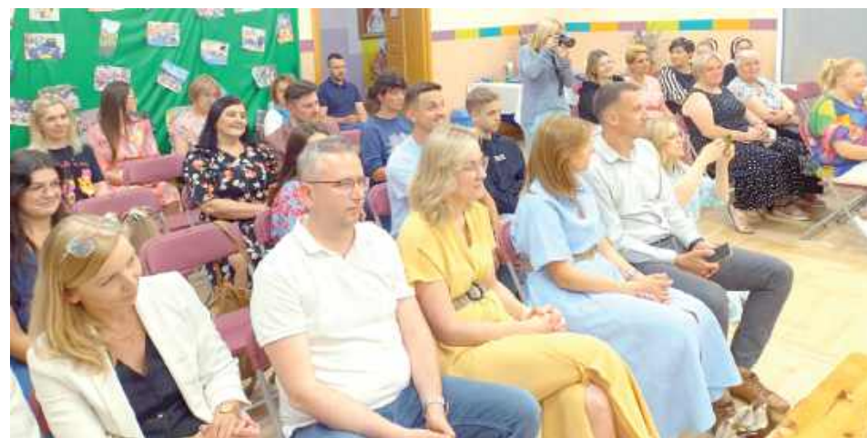
Rodzice także serdecznie dziękowali kadrze przedszkola za trud wychowania dzieci

wiersze, piosenki i układy taneczne, a także wiele wzruszających podziękowań skierowanych do wychowaw-