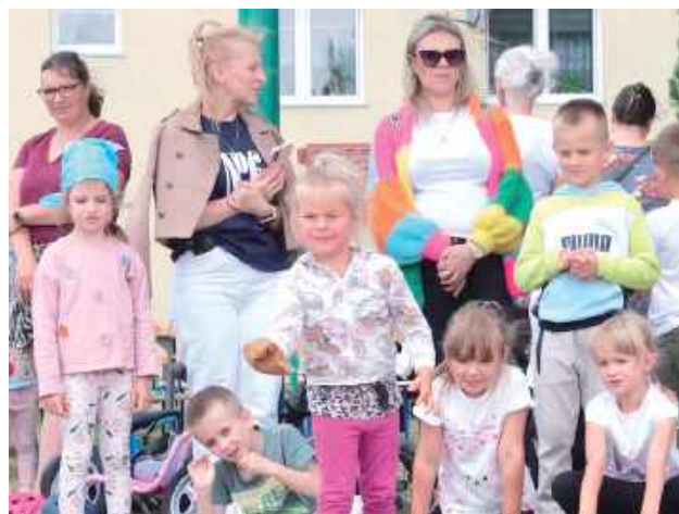
Skupienie, uważność i koordynacja - to klucz do wygranej!

wręczono wszystkim zawodnikom po zakończeniu rywalizacji. Na zakończenie olimpiady ogłoszono wyniki, a każdemu