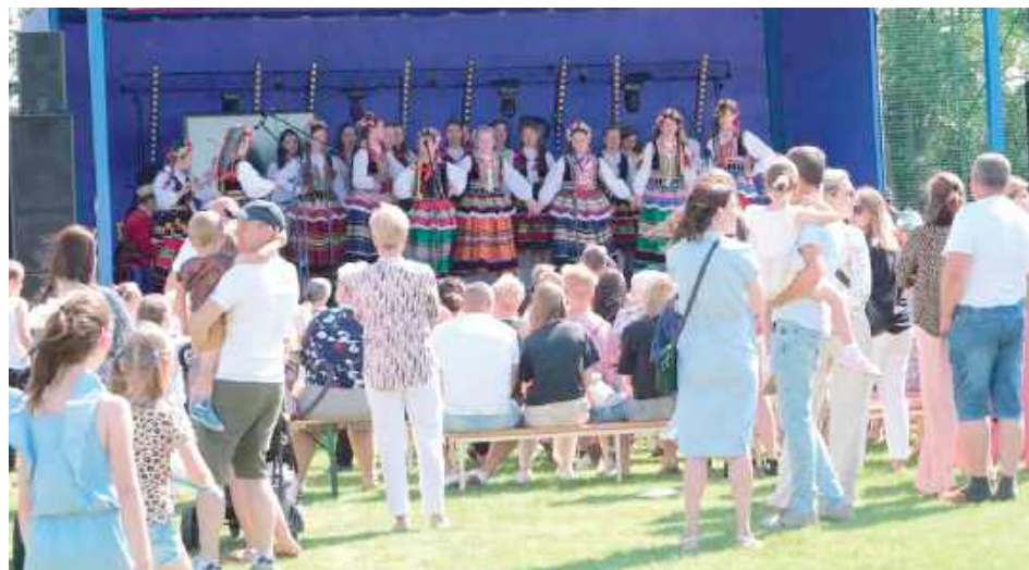
Występy były sympatycznym elementem pikniku