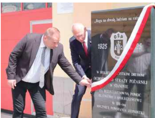
Odsłonięto ważną tablicę na pamiątkę 100-lecia istnienia jednostki