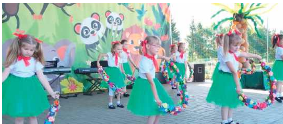
Piknikowi towarzyszyły występy

W programie znalazły się m.in. występy dzieci i młodzieży zaangażowanych w zajęcia biblioteczne, koncert zespołu „Serce na dłoni”, zróżnicowane formy aktywności oraz