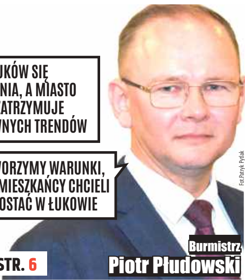
Burmistrz Piotr Płudowski