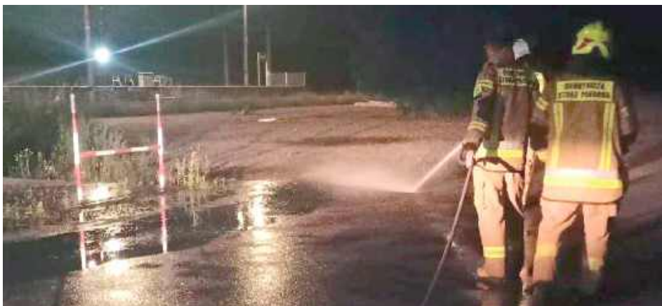
Działania straży na ulicy Kolejowej i Żelechowskiej w Krzywdzie

26 czerwca Ochotnicza Straż Pożarna w Krzywdzie interweniowała na ulicach swojej miejscowości.