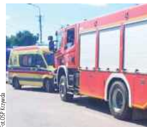
Zdarzenie miało miejsce 26 czerwca o godzinie 14.51

Służby ratunkowe informację o zdarzeniu otrzymały o godzinie 14.51. Na miejsce wezwano zastępy straży z JRG Łuków, OSP Krzywda oraz Zespół Ratownictwa Medycznego. Działania strażaków polegały m.in. na udzieleniu dziecku pierwszej pomocy kwalifikowanej oraz wsparciu psychicznym. Na miejsce wezwano również śmigłowiec LPR. Strażacy wyznaczyli bezpieczne miejsce do jego lądowania, następnie dziewczynka została przetransportowana do szpitala na badania.