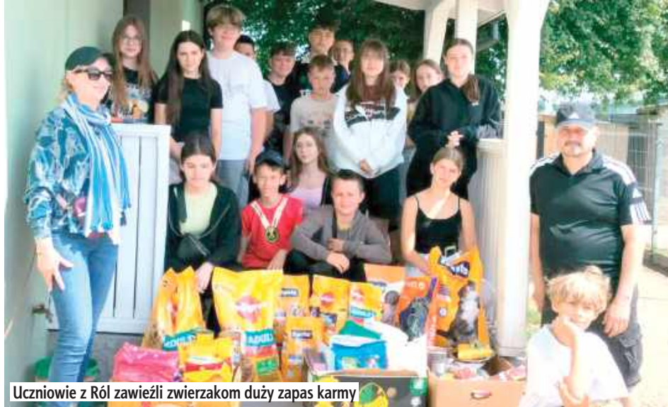
Uczniowie z Ról zawieźli zwierzacom duży zapas karmy