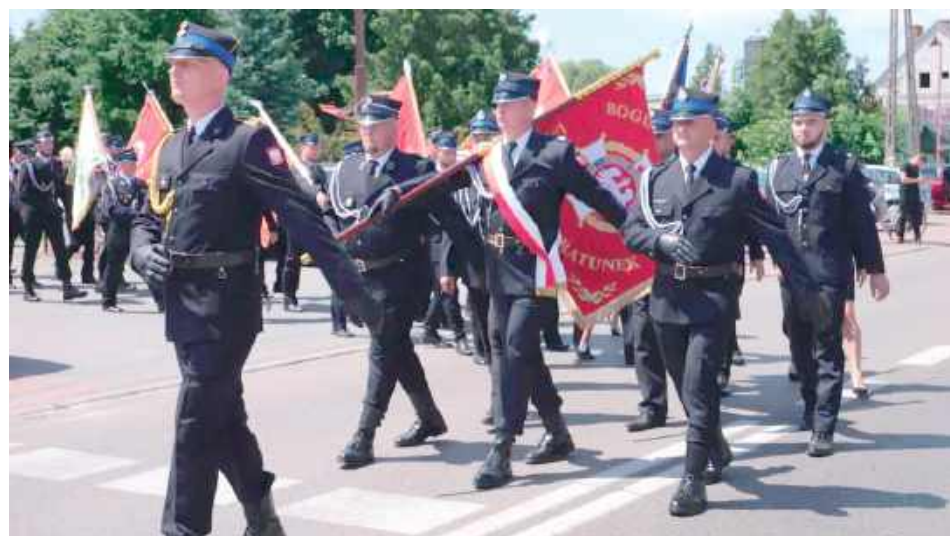
Nieprzerwanie od 100 lat pełnią służbę - OSP Stanin obchodził ważny jubileusz