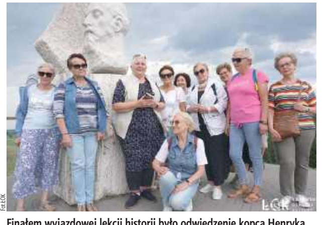
Finałem wyjazdowej lekcji historii było odwiedzenie kopca Henryka Sienkiewicza w Okrzei

Pierwszym przystankiem wycieczki było Muzeum Henryka Sienkiewicza w Woli Okrzejskiej. Uczestnicy wyjazdu poznali historię rodziny Sienkiewiczów, dzieciństwo Henryka oraz najważniejsze etapy jego pracy twórczej. Zwiedzający mogli zobaczyć archiwalne zdjęcia, pamiątki rodzinne, rękopisy oraz listy pisarza. Ważnym elementem wizyty