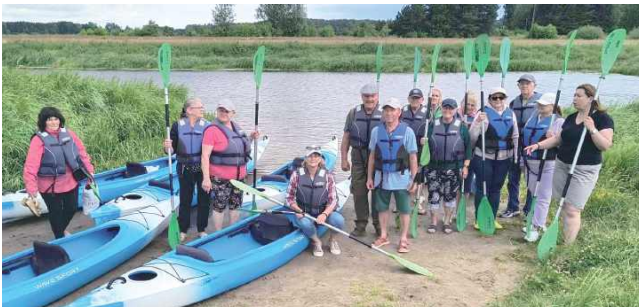
Seniorzy z Klubu Seniora „Teraz pora na Seniora” gotowi do wyruszenia na szlak spływu Liwcem

GMINA ŁUKÓW: Seniorzy z Klubu Seniora „Teraz pora na Seniora” wzięli udział w spływie kajakowym po urokliwej rzece Liwiec.