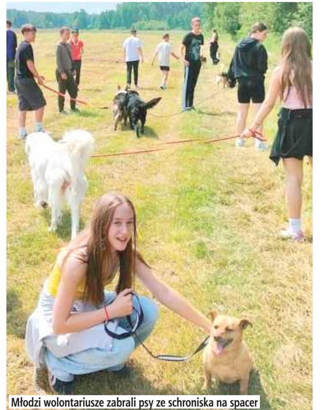
Młodzi wolontariusze zabrali psy ze schroniska na spacer