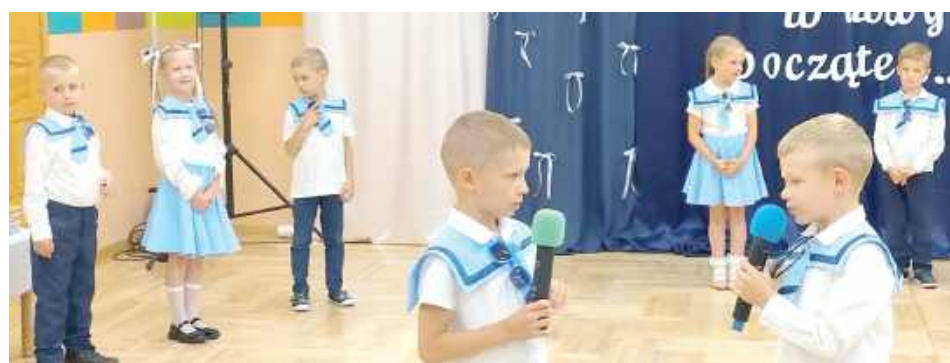
Przedszkolaki przygotowały pod okiem wychowawczynie piękny występ

Podczas popołudniowego spotkania dzieci zaprezen-