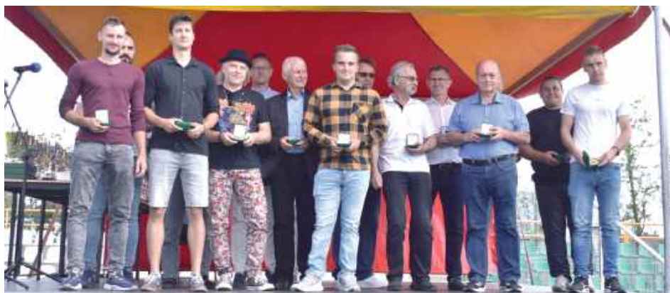
Podczas gali wręczono wyróżnienia oraz podziękowania wszystkim tym, którzy w znaczący sposób pomagali lub pomagają Niwie Łomazy

Czyżewski jest wójtem gminy Łomazy już trzecią kadencję. Po raz pierwszy