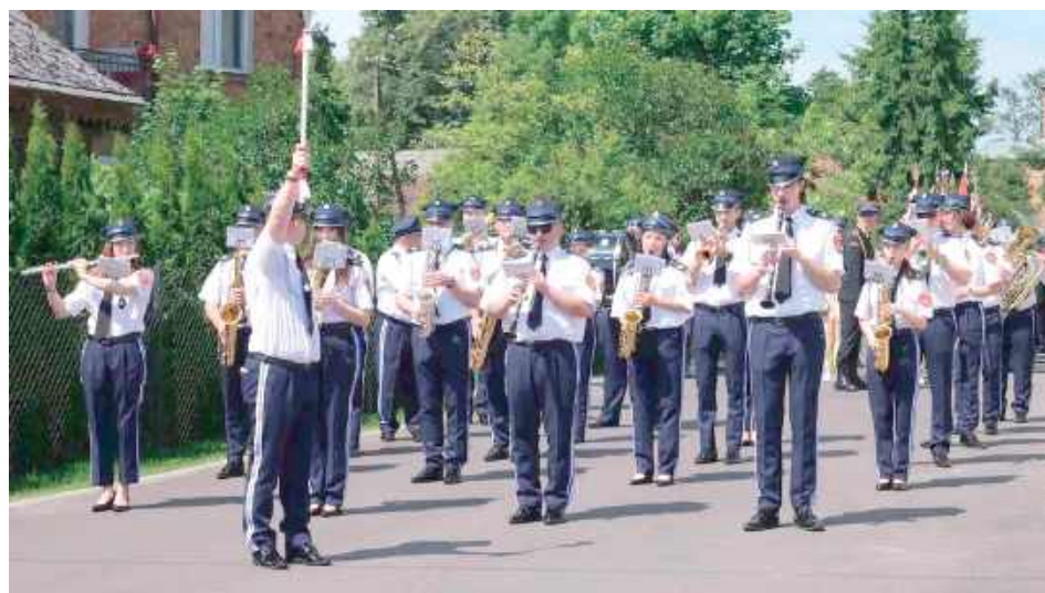
Nie mogło zabraknąć orkiestry OSP