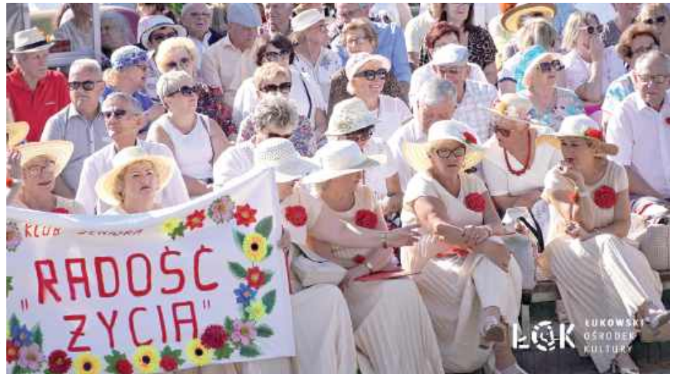
Amfiteatr wypełnił się rozśpiewanymi i roztańczonymi seniorami

W niedzielę, 22 czerwca w Parku Miejskim w Łukowie odbyła się VII Senioriada. Jak co roku impreza zgromadziła wszystkie organizacje senioralne działające w Łukowie.