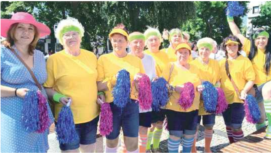
Cheerleaderki z Teraz pora na Seniors Klub Seniora Gminy Łuków