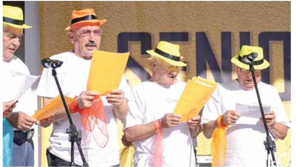
Panowie bez tremy wystąpili na scenie