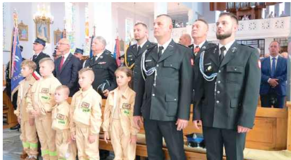
Mieszkańcy w czasie uroczystej Mszy Św. modlili się m.in. o pomyślność dla jednostki