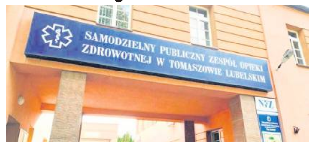
Na miejscu zastępcy dyrektora ds. lecznictwa SP ZOZ w Tomaszowie na razie jest wakat.