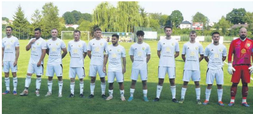
W sobotę na stadionie w Łaszczowie Graf Chodywańce rozegrał 91 mecz w klasie okręgowej. Odnosił 42 zwycięstwa w rozgrywkach „najciekawszej ligi świata”.