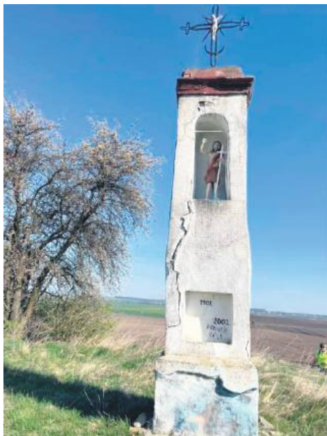
Kapliczka św. Jana w gminie Ulhówek.