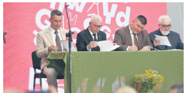
Podczas 11. Festiwalu Stolica Języka Polskiego podpisano list intencyjny dotyczący utworzenia Centrum Języka Polskiego.