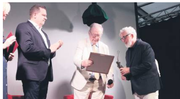
Reżyser, scenarzysta i producent filmowy Krzysztof Zanussi został wyróżniony nagrodą „Człowieka Słowa” na Festiwalu Stolica Języka Polskiego.