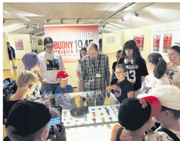
Dzieci z zacięciem oglądają ekspozycję wystawy „Trudny koniec – Trudny początek”.