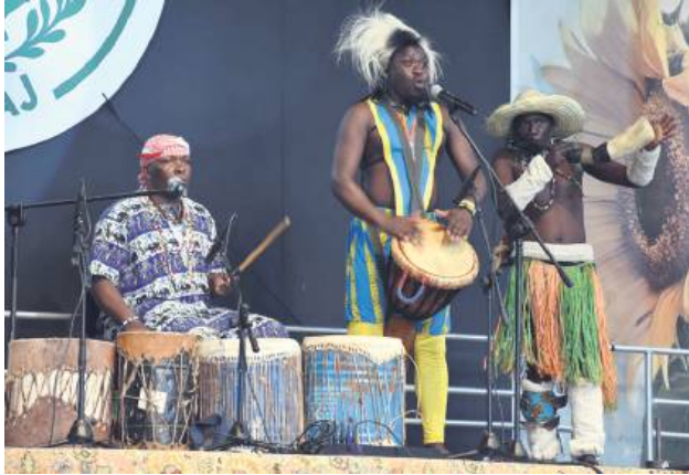
Zespół z Kenii.