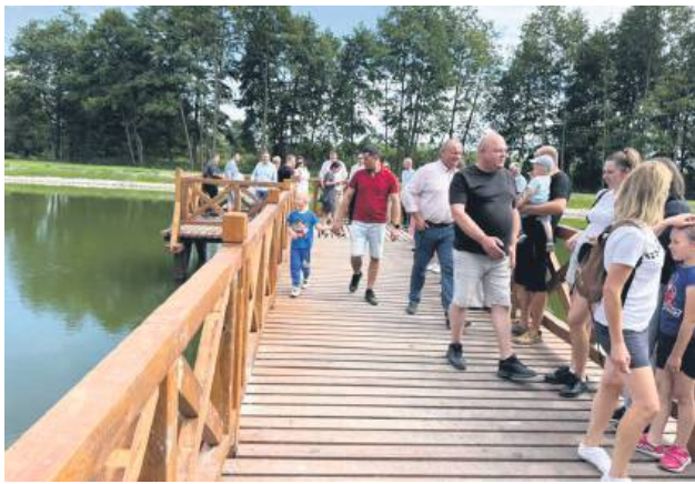
Na zbiorniku wybudowano kładkę.

2 sierpnia został oficjalnie otwarty zbiornik retencyjny w Szczebreszynie. Nowy obiekt powstał na tzw. „ścieżce zdrowia” przy ul. Wierzbowej, w pobliżu wieży widokowej i rzeki Wieprz. To inwestycja o znaczeniu zarówno praktycznym, jak i rekreacyjnym.