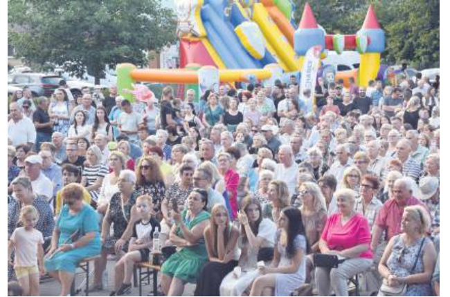
Publiczność nie zawiodła. Plac przy BCK wypełniony był po brzegi.