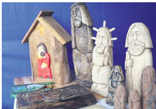
Na Jarmarku Św. Wawrzyńca nie mogło zabraknąć rękodzieła...