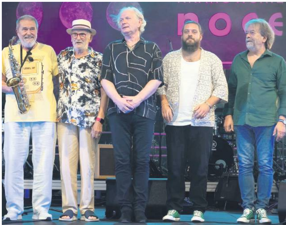
Zespół „Laboratorium” zagra w Jazz Club Kosz 16 sierpnia o godz. 20.