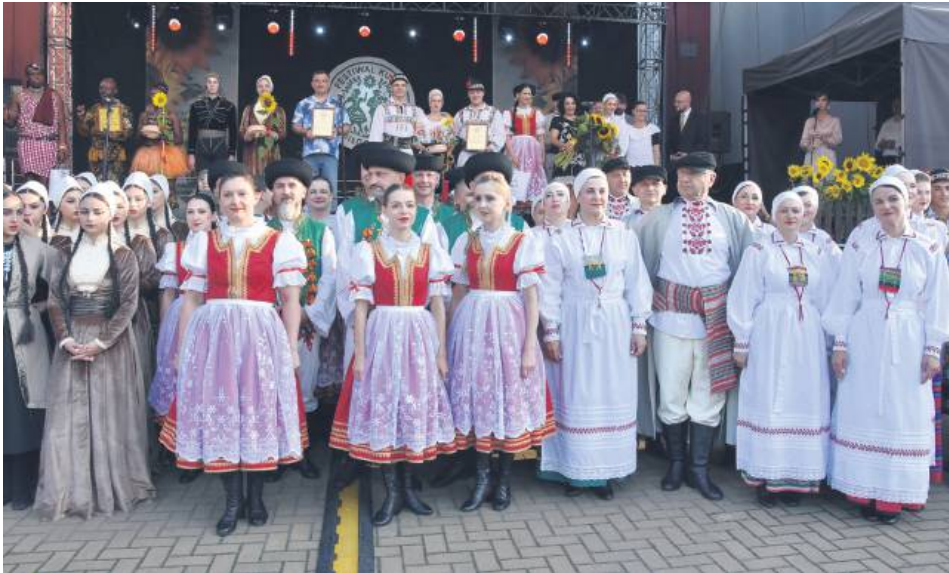
Na scenie było niezwykle barwnie.

Publiczność miała okazję poznać Gurię – jeden z najpiękniejszych regionów Gruzji, położony pomiędzy górami a wybrzeżem Morza Czarnego. Występy artystów ukazały bogactwo