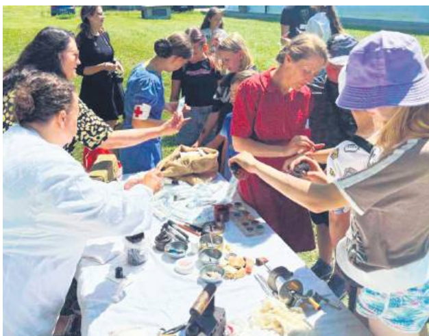
Stanowisko rekonstruktorskie – namiot medyczny jak z czasów Powstania Warszawskiego.

W ramach wystawy „Trudny koniec – Trudny początek” najmłodszy poznali historie