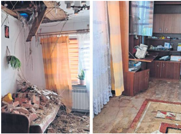
Ponad 22,7 tys. zł zebrano na pomoc dwojgu emerytom z Annapola, poszkodowanym przez huraganową nawałnicę, która przeszła przez gminę Hrubieszów na początku lipca.

W niedzielę, 3 sierpnia, w Ubrodowicach zorganizowano Charytatywny Turniej Piłki Siatkowej o Puchar Wójta Gminy Hrubieszów. Był on połączony ze zbiórką pieniędzy na pomoc rodzinie seniorów z Annapola. Dwoje emerytów podczas niedawnej wichury straciło dorobek całego życia. Mieszkańcy tej gminy, różne organizacje społeczne i sponsorzy byli bardzo hojni – podczas turnieju zebrano w sumie 22 709,01 zł!