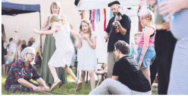
Zabawy przy muzyce.