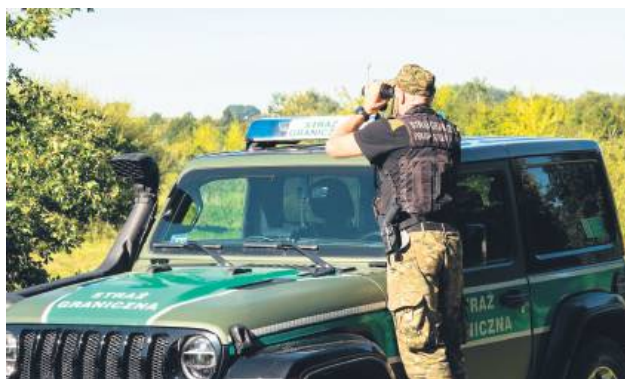
Syryjczyk odpowie za zorganizowanie przerzutu 160 migrantów przez granicę.

Śledztwo funkcjonariuszy Nadbużańskiego Oddziału Straży Granicznej zostało zakończone. Prokuratura Okręgowa w Zamościu skierowała do sądu akt oskarżenia przeciwko obywatelowi Syrii. Mężczyzna, działając w ramach zorganizowanej grupy przestępczej, miał umożliwić nielegalne przekroczenie granicy polsko-białoruskiej przez co najmniej 160 cudzoziemców.