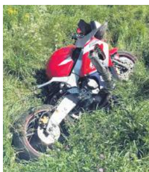
Motocyklista z Zamościa miał wypadek w Tarnawatce.

We wtorek 6 sierpnia doszło do groźnego zdarzenia w miejscowości Tarnawatka. 28-letni motocyklista z Zamościa jechał z nadmierną prędkością i za wzniesieniem drogi, w trakcie wyprzedzania pojazdu, stracił panowanie nad motocyklem i wpadł do rowu. Mężczyzna trafił do szpitala.