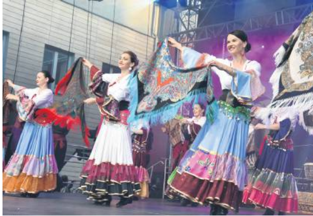
Tańce cygańskie to niezwykle widowisko.