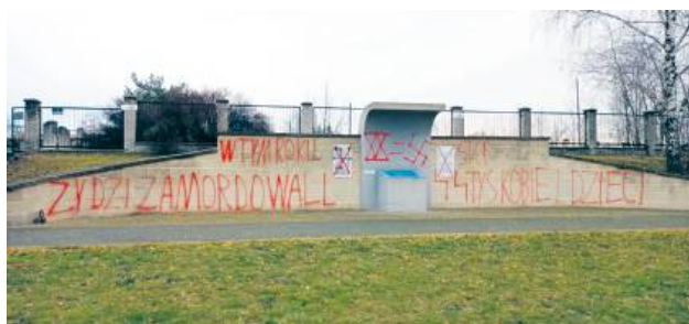
Wartość wyrządzonej szkody ustalono na 11 tys. 440 zł.

na policję, a wydarzenie odbiło się echem na międzynarodowej arenie. Policjanci ustalili sprawcę. Okazał się nim 42-letni mieszkaniec powiatu biłgorajskiego. W miejscu jego zamieszkania funkcjonariusze ujawnili i zabezpieczyli przedmioty mogące mieć związek ze zdarzeniem.