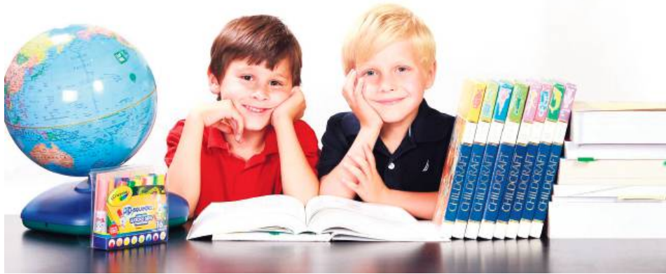
Zakup wyprawki można częściowo sfinansować z programu „Dobry Start” 300+.

Nowy rok szkolny zbliża się wielkimi krokami, a w sklepach trwa gorący okres zakupów. Rodzice uczniów chętnie korzystają z dofinansowania w ramach programu „Dobry Start”. W województwie lubelskim do końca lipca wypłacono już świadczenia o łącznej wartości ponad 14 mln zł.