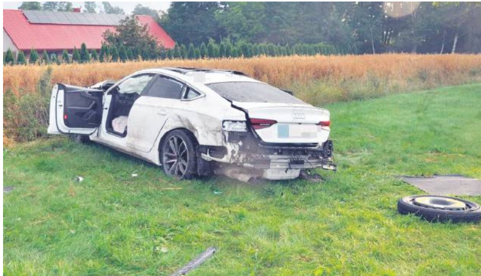
Kierowca zakończył jazdę, wjeżdżając w ogrodzenie.