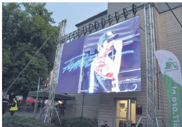
Jednym z pomysłów jest zakupienie telebimu.

31 lipca zakończył się pierwszy etap Budżetu Obywatelskiego Miasta Biłgoraj na rok 2026, czyli etap zgłaszania propozycji zadań przez mieszkańców. Dzięki zaangażowaniu lokalnej społeczności wpłynęło sześć różnorodnych projektów. Wszystkie propozycje są obecnie analizowane pod względem zgodności z kompetencjami gminy, wykonalności technicznej, zgodności z obowiązującymi