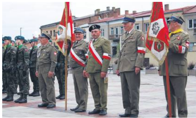
Ceremonia z udziałem pocztów sztandarowych na Rynku Miejskim.

Uroczystości zorganizowane 27 lipca rozpoczęły się mszą świętą w kościele pw. św. Mikołaja, podczas której modlono się w intencji Ojczyzny i żołnierzy oddziału „Podkowy”. Patriotyczny