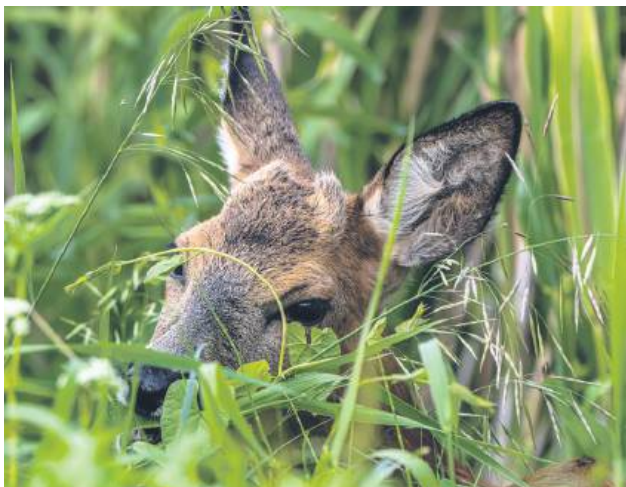
Myśliwi apelują, by zachować ostrożność i nie zbliżać się do dzikich zwierząt.

Jeszcze niedawno dzika, sarnę czy łosia można było spotkać tylko w lesie. Dziś ich obecność w pobliżu domów, przedszkoli czy miejskich ulic przestaje dziwić, również na Zamojszczyźnie. Dlaczego dzikie zwierzęta coraz częściej odwiedzają miasta i wsie?