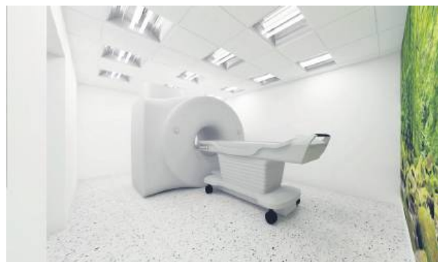
Pracownia rezonansu magnetycznego będzie mieściła się w głównym budynku Szpitala Powiatowego w Hrubieszowie.

ju lokalnej opieki zdrowotnej. Do tej pory pacjenci musieli dojeżdżać na badania MRI do odległych ośrodków, na przykład do Tomaszowa Lubelskiego – tłumaczy dyrektor SP ZOZ