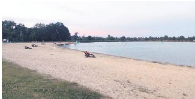
Dramat rozegrał się nad zalewem w Zamościu. Wstępne ustalenia nie wskazują na udział osób trzecich.

5 sierpnia nad zamojskim zalewem rozegrała się dramatyczna walka o życie 67-letniej zamościanki. Unoszące się na wodzie ciało kobiety zauważyły osoby postronne i zaalarmowały służby. Policjantka wyciągnęła z wody kobietę, a strażakom udało się przywrócić jej funkcje życiowe. Niestety, dwa dni później 67-latkka zmarła w szpitalu.