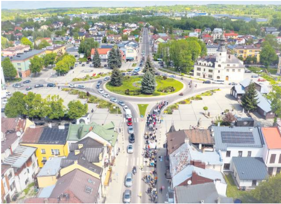
Wniosek pn. „Wizja lepszego życia w mieście Tomaszów Lubelski – słonecznym sercu Roztocza” otrzymał ocenę pozytywną, ale zdobył zbyt mało punktów, by przejść do kolejnego etapu naboru.

Wniosek pn. „Wizja lepszego życia w mieście Tomaszów Lubelski – słonecznym sercu Roztocza” otrzymał ocenę pozytywną i został