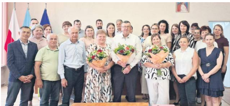
Pożegnanie trojga emerytów w Urzędzie Gminy Ulhówek.

Na koniec lipca władze gminy Ulhówek i pozostali pracownicy urzędu postanowili miło pożegnać kolegów i koleżanki. Zorganizowano spotka-