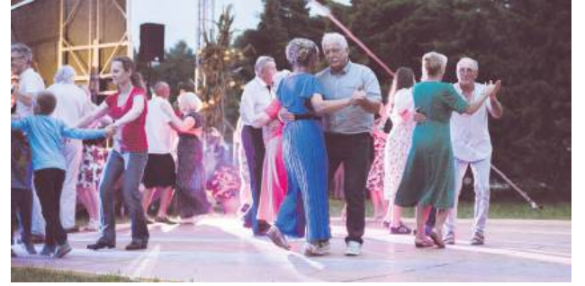
Na koniec była potańcówka.