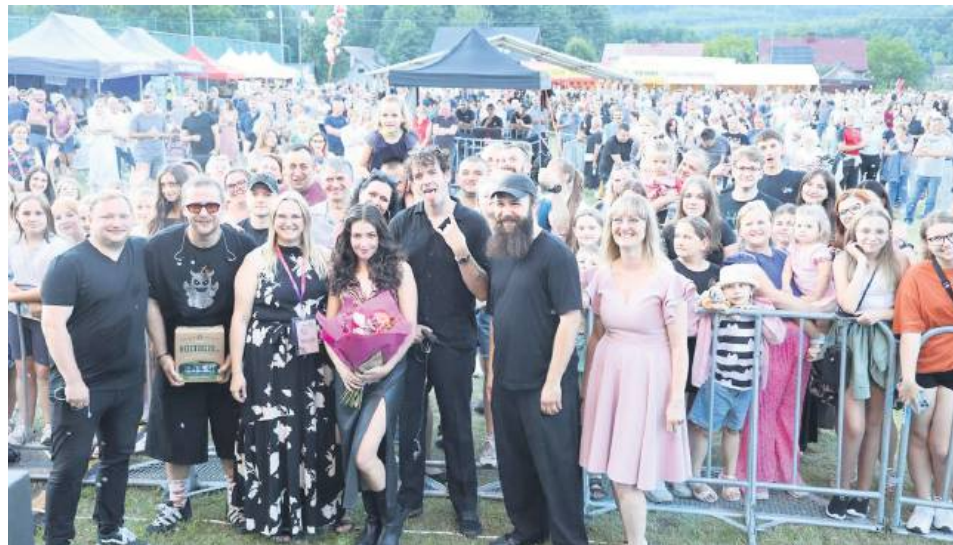
Dni Bełżca to przede wszystkim koncerty zaproszonych gwiazd. Publiczność bawiła się doskonale.

Zorganizowano także warsztaty garncarskie z pracownią