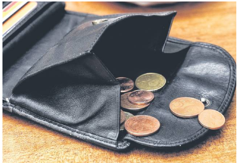
Mężczyzna został z 45 tys. zł kredytu.