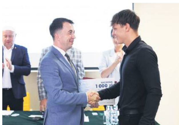
Gratulacje od starosty biłgorajskiego.