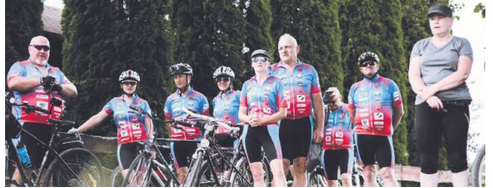
Uczestnicy rajdu rowerowego Brygady RR Rowerowa Radecznicza.

Do Zakładzie dotarli także uczestnicy rajdu rowerowego Brygady RR Rowerowa Radecznicza, którzy wzięli udział w oficjalnym otwarciu pikniku. Na miejscu nie zabrakło lokalnych specjalistów przygotowanych przez mieszkańców