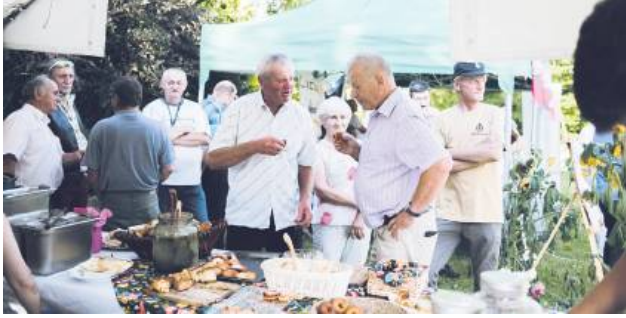
Można było spróbować pysznego jedzenia.