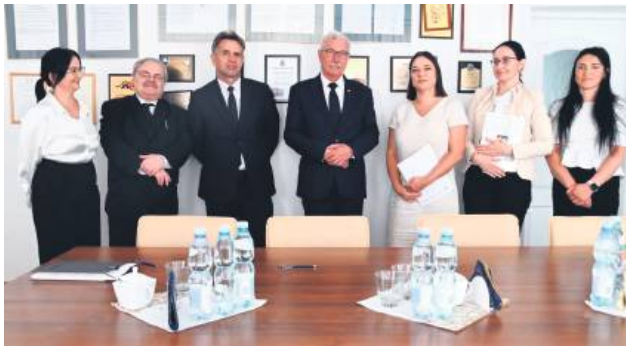
Łączna kwota dofinansowania z PFRON dla wszystkich projektów wynosi 1 176 018 zł.

Powiat Zamojski zawarł 5 sierpnia umowy z gminami: Stary Zamość, Komarów-Osada, Nielisz i Zwierzyńc. Dokumenty dotyczą dofinansowania projektów realizowanych w ramach „Programu wyrównywania różnic między regionami III”, finansowanego ze środków Państwowego Funduszu Rehabilitacji Osób Niepełnosprawnych (PFRON).