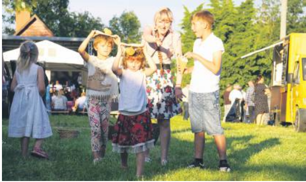
Dzieci brały udział w konkursach sprawnościowych.

Dla najmłodszych przygotowano kolorową strefę animacyjną z dmuchałkami, malowaniem twarzy oraz zabawami prowadzonymi przez Fundację