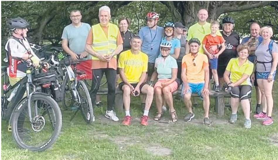
Po zakończonej wyprawie na uczestników czekały certyfikaty, pamiątkowe upominki oraz piknik integracyjny z ciepłym posiłkiem.

Roztoczańskie krajobrazy, przyjemna pogoda i blisko 50 kilometrów wspólnej jazdy – tak wyglądała sobota, 26 lipca, dla uczestników „II Rajdu Rodzinnego po Zamojszczyźnie”. Wydarzenie zorganizowane przez Stowarzyszenie Rozwoju Lokalnego Zamojszczyzna po raz kolejny połączyło aktywny wypoczynek z promocją walorów przyrodniczych i historycznych regionu.