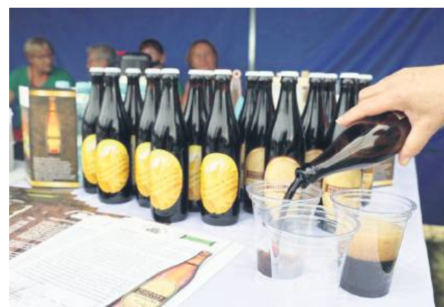
...i stoisk z regionalnymi potrawami i napojami.