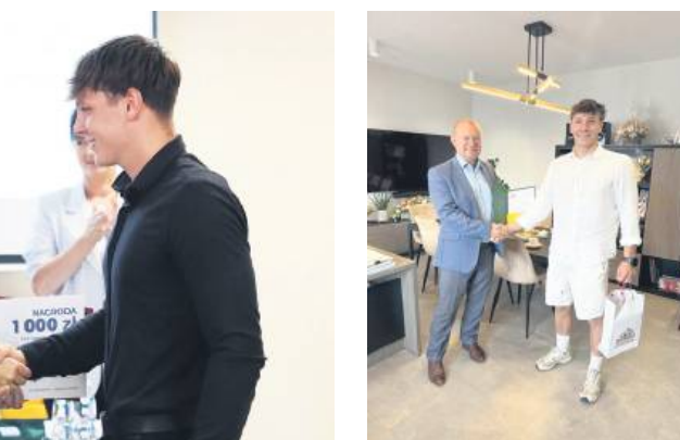
Wójt gminy Biłgoraj wraz ze sportowcem.