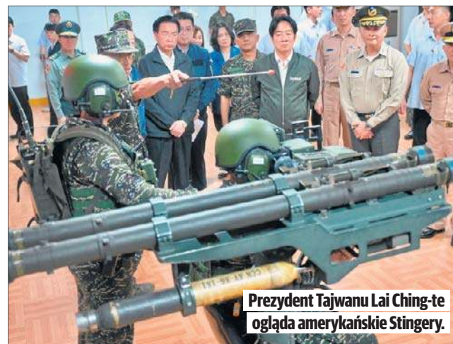
Prezydent Tajwanu Lai Ching-te ogląda amerykańskie Stinger.

Chiny uznają Tajwan za własne terytorium, a prezydenta tego kraju Laia Ching-te za „separatystę” i nie wykluczają zbrojnego przejścia kontroli nad wyspą. Wiceminister obrony Hsu Szu-chien zapewnił w poniedziałek, że wojsko regularnie