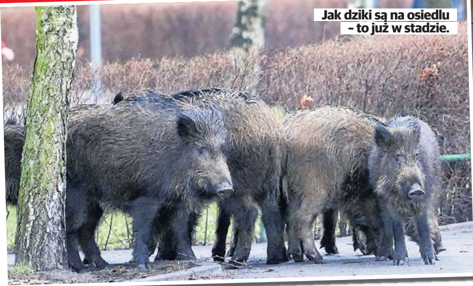
Jak dziki są na osiedlu - to już w stadzie.