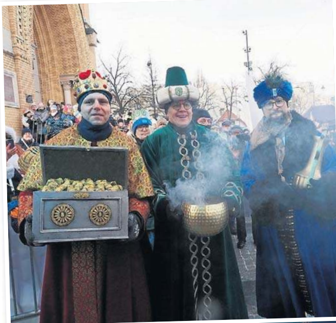
Na zakończenie orszaku zaśpiewał Mały Chór Wielkich Serc.

dawane na miejscu, ale i widać było nakrycia wykonane własnoręcznie. Wszyscy dotarli na Plac Katedralny, gdzie Trzej Królowie oddali pokłon Jezusowi i przekazali dary. Na zakończenie odbył się koncert kołed Małego Chóru Wielkich Serc. To działający przy franciszkańskiej parafii pw. Matki Bożej Anielskiej dziecięcy chór religijny. Jak co roku prowadzono zbiórkę charytatywną pod hasłem „Dar dla Nowonarodzonego”. Przed katedrą pieniądze do puszek zbierali Trzej Królowie i anielice. Datki można jeszcze wpłacić przez stronę internetową orszakwlo-dzi.pl lub bezpośrednio na konto Caritas Archidiecezji Łódzkiej. Zebrane pieniądze zostaną przekazane schronisku dla bezdomnych kobiet Towarzystwa Pomocy im. św. Brata Alberta przy ul. Kwietniowej. Budynek pilnie potrzebuje remontu dachu, a koszt prac to około 40 tys. zł.