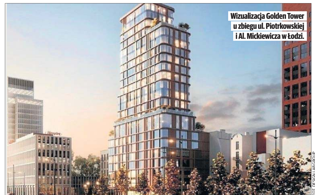
Wizualizacja Golden Tower u zbiegu ul. Piotrkowskiej i Al. Mickiewicza w Łodzi.