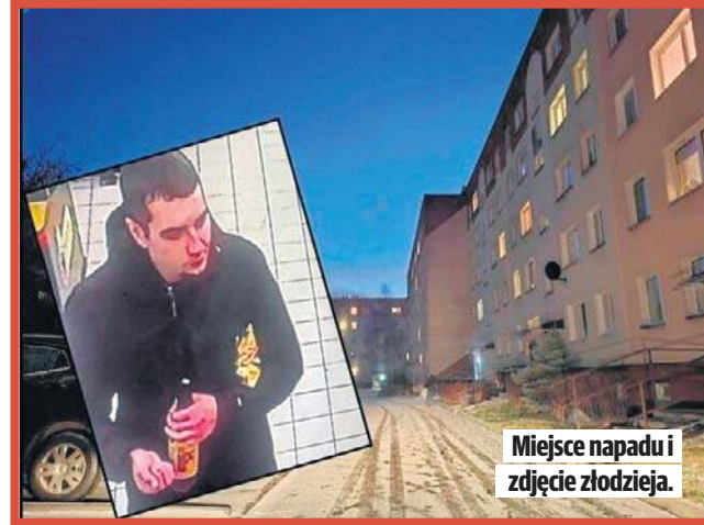
Miejsce napadu i zdjęcie złodzieja.

Zaatakował, gdy starszek wchodził do klatki schodowej swojego bloku przy ul. Czernika. Z dużą siłą uderzył go w plecy i popchnął. W efekcie 84-latek przewrócił się. Wtedy bandzior wyciągnął z kieszeni kurtki swojej ofiary portfel i uciekł. Zrabował około 500 zł. Wizerunek sprawcy zarejestrowały kamery Biedronki i bloku, w którym mieszka pokrzywdzony. Policja opublikowała wizerunek