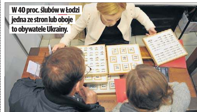
W 40 proc. ślubów w Łodzi jedna ze stron lub oboje to obywatele Ukrainy.

Wśród obcokrajowców ślubujących w Łodzi najmniej było obywateli państw afrykańskich.