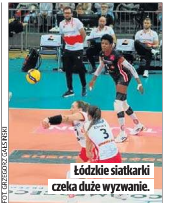
Łódzkie siatkarki czeka duże wyzwanie.

Od wielu lat liderką włoskiego giganta jest rozgrywająca Joanna Wołosz. Łodzianki, które bez punktu zamykają tabelę