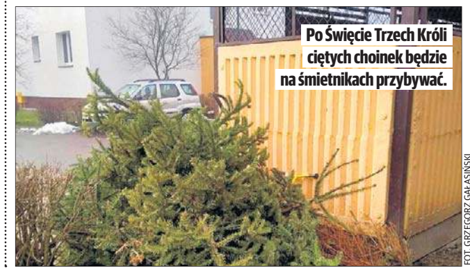
Po Święcie Trzech Króli ciętych choinek będzie na śmietnikach przybywać.

zywało się, że choinki zazwyczaj nie były odpowiednio przygotowane do dalszego wzrostu. Miały silnie zredukowany system korzeniowy, bywały przesuszone i nie były zahartowane do zimowych warunków. W efekcie tylko niewielki procent takich roślin nadawał się do późniejszego wkopania do gruntu. Na osiedlach z zabudową wielorodzinną drzewka należy zostawić przy śmietnikowych pergolach lub w miejscach wskazanych przez administratorów nieruchomości, podobnie jak odpady wielkogabarytowe.