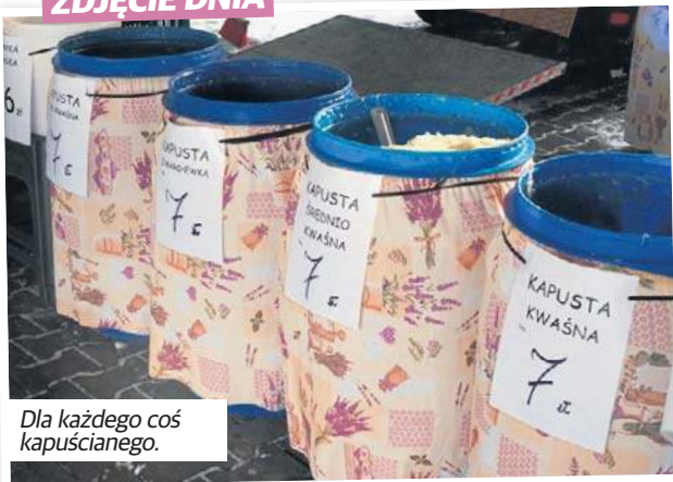
Dla każdego coś kapuścianego.