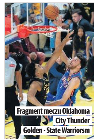
Fragment meczu Oklahoma City Thunder Golden - State Warriors