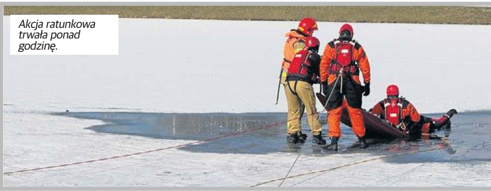
Akcja ratunkowa trwała ponad godzinę.

Koń był wprawdzie osłabiony tą przygodą, ale – zdaniem strażaków – powinien wkrótce dojść do siebie. Akcja ratowania rumaka, którym na brzegu zajął się lekarz weterynarii, trwała ponad godzinę.