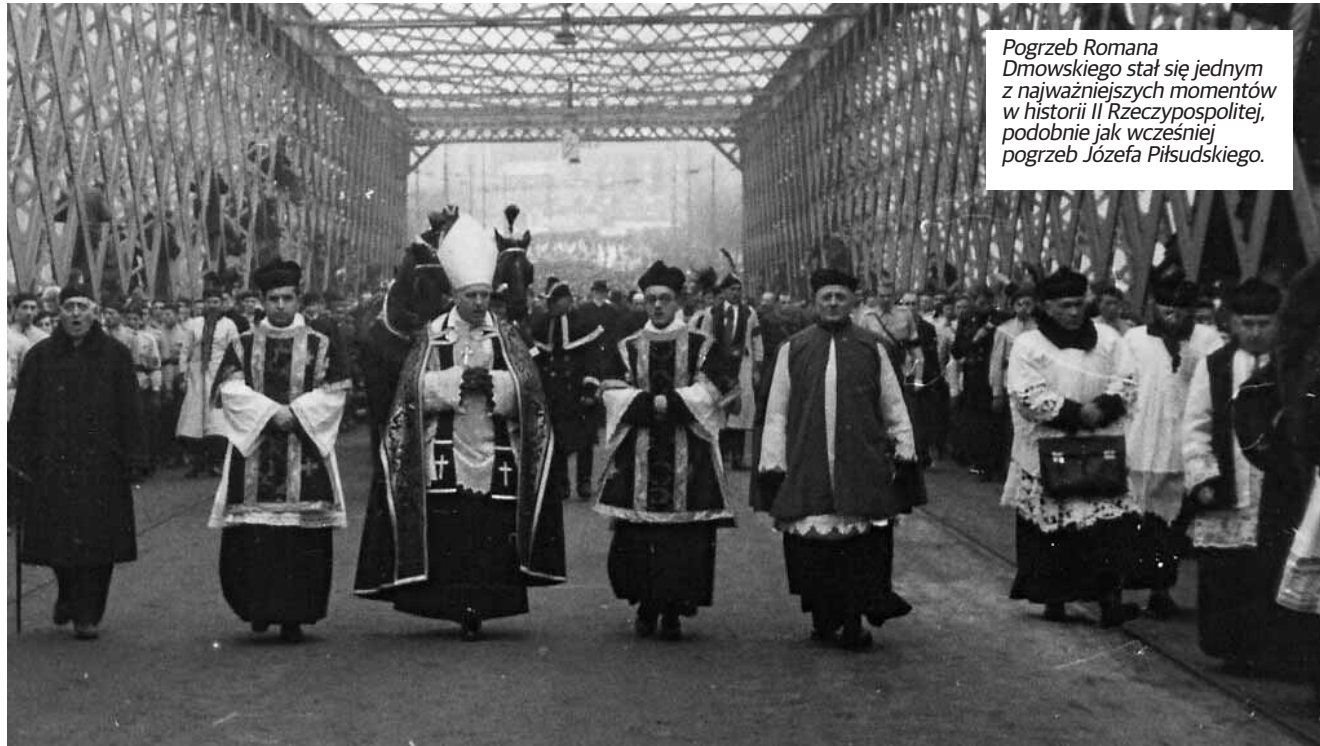
Pogrzeb Romana Dmowskiego stał się jednym z najważniejszych momentów w historii II Rzeczypospolitej, podobnie jak wcześniej pogrzeb Józefa Piłsudskiego.