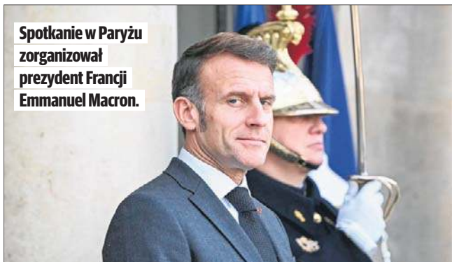
Spotkanie w Paryżu zorganizował prezydent Francji Emmanuel Macron.

Prezydent Macron spotka się w czwartek z przewodniczącymi obu izb parlamentu Francji i szefami frakcji parlamentarnych, by rozmawiać z nimi na temat Ukrainy i przyszłych gwarancji bezpieczeństwa. Wtorkowy szczyt był kolejnym z szeregu spotkań poświęconych Ukrainie. W sobotę w Kijowie obradowali doradcy ds. bezpieczeństwa krajów wspierających Ukrainę. Zełenski zapowiedział po nim, że rozmowy będą kontynuowane w Paryżu, a finałem tego procesu ma być spotkanie w USA, również na poziomie głów państw.