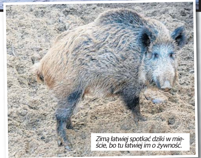
Zimą łatwiej spotkać dziki w mieście, bo tu łatwiej im o żywność.

Pozostaniesz na zawsze w naszej pamięci.