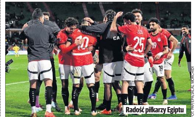
Radość piłkarzy Egiptu