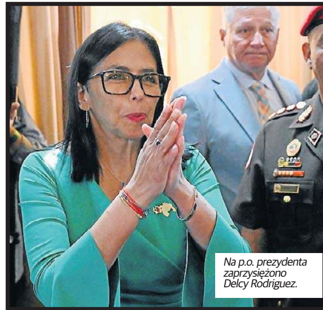
Na p.o. prezydenta zaprzysiężono Delcy Rodriguez.

Kontrowersje wzbudza jednak brak żądania wypuszczenia na wolność wszystkich więźniów politycznych. Budzi to obawy w kręgach polityki zagranicznej Partii Republikańskiej, czy działania Waszyngtonu faktycznie doprowadzą do trwałej i głębokiej zmiany w tym kraju.