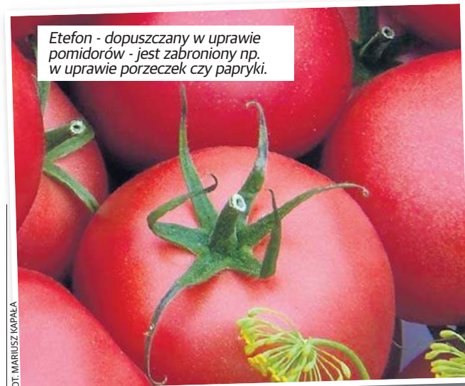
Etefon - dopuszczany w uprawie pomidorów - jest zabroniony np. w uprawie porzeczek czy papryki.

- W badaniach na zwierzętach ta substancja używana