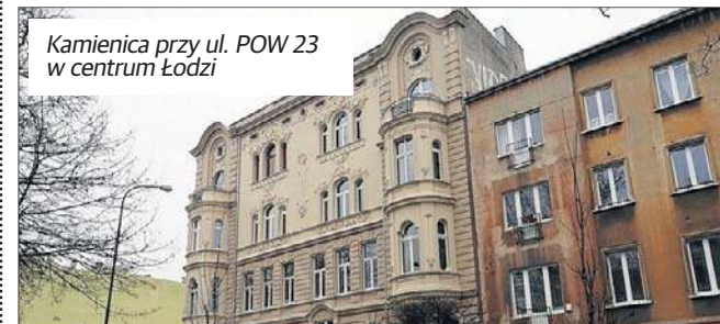
Kamienica przy ul. POW 23 w centrum Łodzi