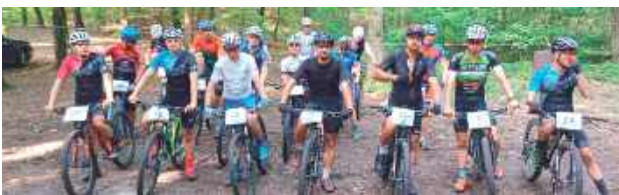
Będzie się działo. Pierwsze zmagania już 19 lipca

Organizatorem wydarzenia jest Puławskie Towarzystwo Krzewienia Kultury Fizycznej, które zaplanowało co najmniej trzy edycje wyścigu: 19 lipca, 23 sierpnia oraz 13 września. Nie wykluczone, że odbędzie się także czwarta runda na początku października. Wszystko zależy jednak od dostępnych środków finansowych.