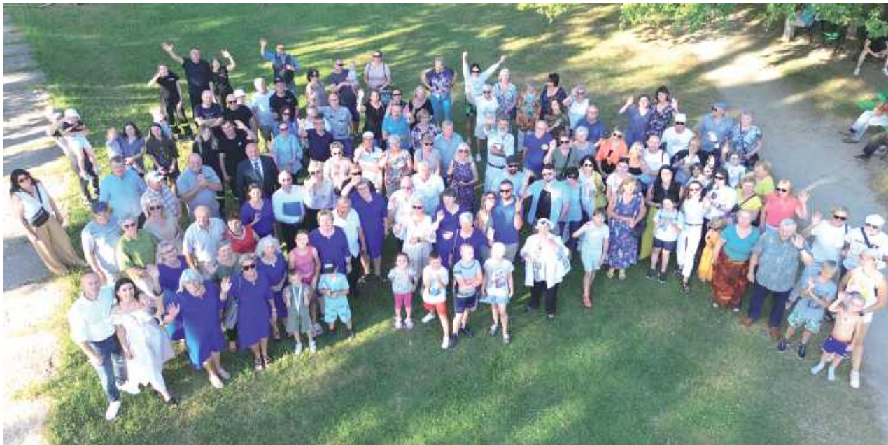
Wszyscy chętni mogli zrobić sobie wspólne pamiątkowe zdjęcie

Tegoroczna edycja święta obfitowała w atrakcje dla