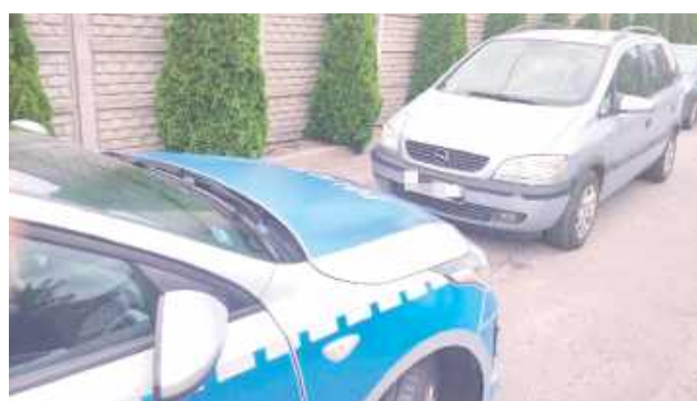
Kierowca odjechał w stronę ul. Przemysłowej, gdzie po krótkiej chwili zaparkował

Choć był po służbie i zapewne planował tylko szybkie zakupy, jego policyjny instynkt nie zawiodł.