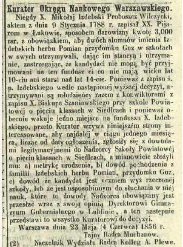
Diennik Urzędowy Gubernii Warszawskiej z 1856 z ogłoszeniem w sprawie poszukiwania chętnych na studiowanie w ramach ustanowionego przez proboszcza z Wilczysk stypendium Izdebskich

Rodzina Izdebskich wzięła nazwisko od wsi Izdebki w dawnym powiecie łukowskim, obecnie pow. Siedlce, parafia Zbuczyn, która odnotowana jest już w 1425 roku. Potem ulega podziałowi na kolejne osady - działy, które zostały nazwane m.in. Izdebki-Błażeje, Izdebki-Kośmidry, Izdebki-Kośmy, Izdebki-Wąsy oraz właśnie Izdebki - Guzy, z których wywodziła się rodzina będąca tematem niniejszych rozważań.