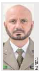
Maj Dar Si

- Na miejsce zostali wysłani funkcjonariusze Straży Granicznej, którzy odnaleźli grupę 17 nielegalnych migrantów. Osoby te przepłynęły rzekę i nielegalnie przekroczyły granicę państwową z Białorusi do Polski. Przy wsparciu funkcjonariuszy z Kodnia i Białej Podlaskiej migranci zostali