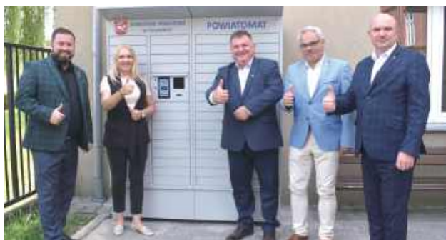
Na początku lipca urządzenie przyjechało do Puław, zostało zamontowane i uruchomione. Od tego tygodnia petenci będą już mieli możliwość wyboru sposobu odbioru dokumentów czy tablic rejestracyjnych za pośrednictwem powiatomatu

Powiatomat przyjechał do Puław w ubiegłym tygodniu. Został zamontowany i uruchomiony. W tym tygodniu szkolenie z zakresu wykorzystania urządzenia