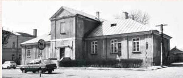
Nie udało nam się ustalić, w jaki sposób ojcowie pijarzy w Łukowie realizowali obowiązek zakwaterowania stypendystów Izdebskich. Dość prawdopodobne jest, że i oni przemieszkowali gdzieś kątkiem w konwikcie Szaniawskich

Wspomniany wcześniej zapis o podziale środków w razie likwidacji zgromadzenia pijarskiego stał się u schyłku XIX wieku przedmiotem sporów sądowych. Fundator zastrzegł, żeby w razie, gdyby pijarów spotkał taki los jak jezuitów, połowa majątku wróciła do rodziny, a połowa została