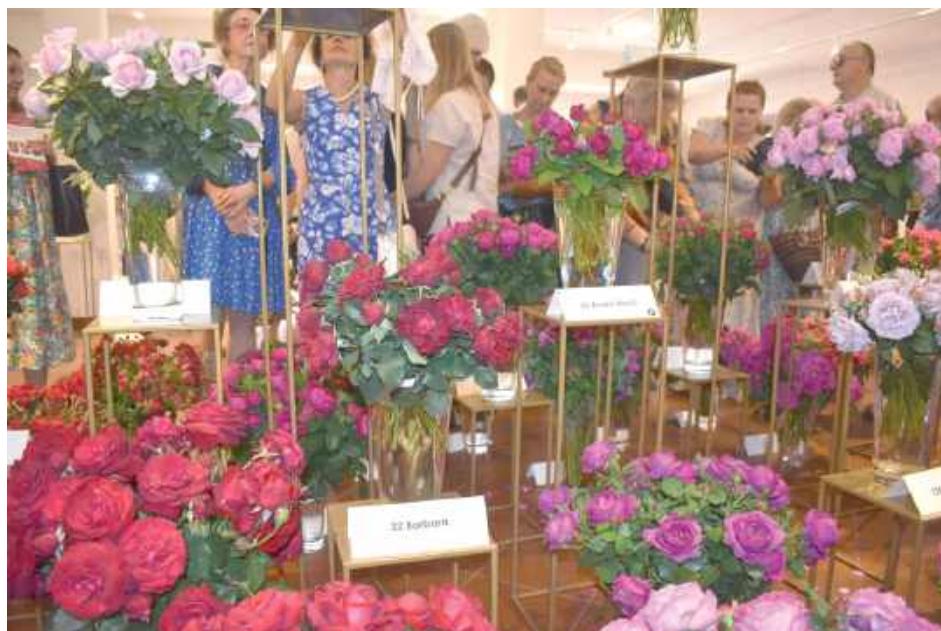
Wystawa róż w ratuszu cieszyła się ogromnym zainteresowaniem

A wiele okazów można było zakupić bezpośrednio od producentów na kiermaszu na placu przed ratuszem i mieć je w własnym ogrodzie.