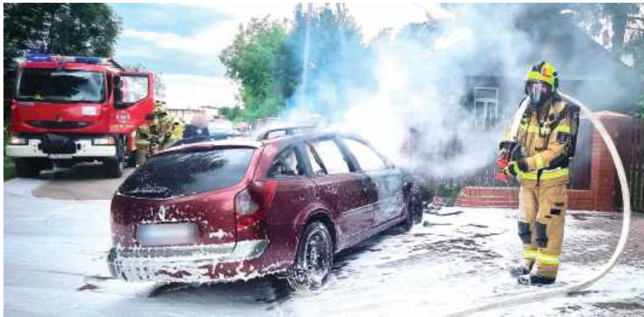
Jak relacjonują strażacy z OSP KSRG z Markuszowa na miejscu zastali cały pojazd w ogniu

Puławska policja pod nadzorem tutejszej prokuratury wyjaśnia okoliczności tragicznego wypadku, do jakiego doszło w niedzielne popołudnie w powiecie puławskim. 53-latką zjechała swoim Renault z drogi i uderzyła w płot. Samochód stanął w płomieniach. Kobiety nie udało się uratować.