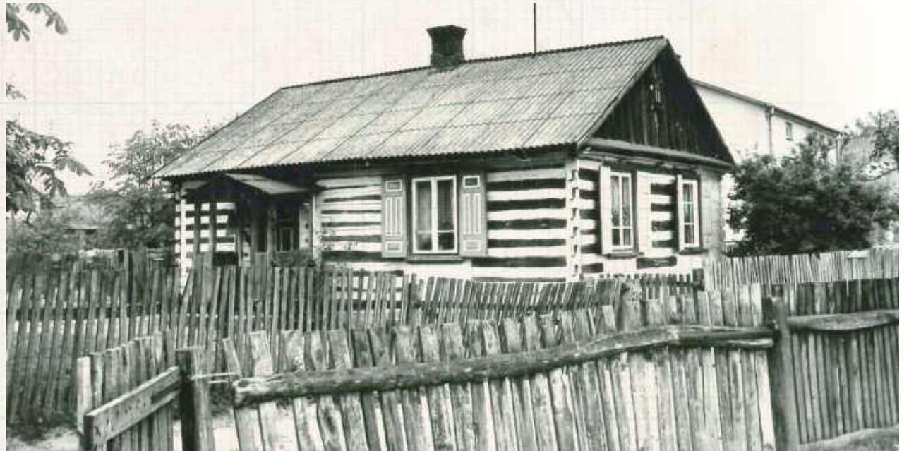
Serock, jedna z drewnianych zrębowych chałup w zachodniej części wsi, fot. A. Krzak, 1987 r. Zdjęcia ze studium historyczno-urbanistycznego Serocka opracowanego przez Włodzimierza Borucha w 1987 r.

W zakładach odbywał się cały cykl produkcyjny od przetapiania rudy żelaza do wyrobu gotowych narzędzi i maszyn rolniczych. Rudę przywożono z leżącej w Kieleckiem miejscowości Białogon. Na swoje potrzeby zakład zużywał duże ilości węgla drzewnego. Drewno pozyskiwano z lasów Dóbr Lubartowskich. Tam go wypalano, a następnie zwożono na teren fabryki. Cały cykl liczył 12 tygodni. Ponadto zużywano też mniejsze ilości węgla