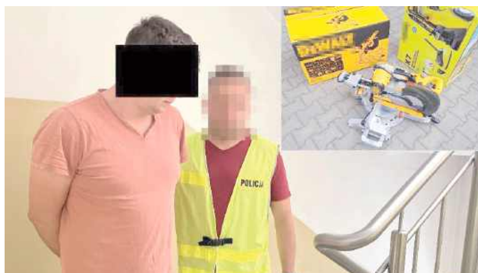
Wszystkie skradzione przedmioty udało się odzyskać. 28-latek usłyszał już zarzuty kradzieży mienia o łącznej wartości około 10 tysięcy złotych

- Dzięki szybkim działaniom funkcjonariuszy udało się ustalić tożsamość sprawcy. Okazał się nim 28-letni mieszkaniec