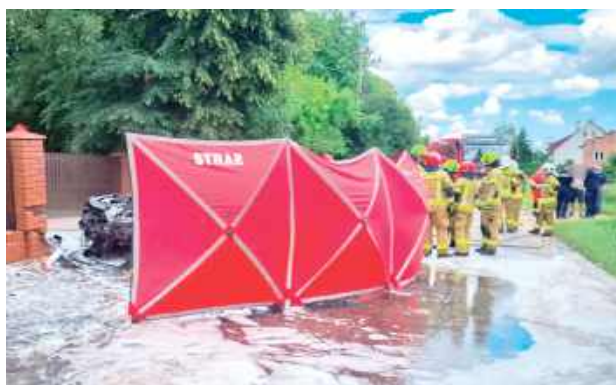
53-latką z powiatu puławskiego zginęła na miejscu. Decyzją prokuratora ciało kobiety zostało przewiezione na sekcję

Na miejsce zadysponowano nawet śmigłowiec Lotniczego Pogotowia Ratunkowego z Lublina, ale ostatecznie maszynę zawrócono. Mimo natychmiast podjętej akcji gaśniczej i ratunkowej oraz wysiłku nie zakończyła się ona sukcesem. Kierująca Renault kobieta nie przeżyła. To 53-letnia mieszkanka powiatu puławskiego.