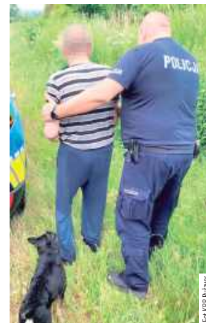
Pupil cały czas towarzyszył zaginionemu mieszkańcowi Gminy Baranów

Gdyby nie prawdziwy przyjaciel człowieka, czyli pies, mogłoby skończyć się różnie. Mieszkaniec gminy Baranów wyszedł z domu i nie potrafił samodzielnie do niego wrócić. Na szczęście staruszkowi towarzyszył pies, dzięki któremu policjantom udało się go odnaleźć na czas.