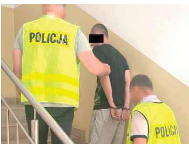
28-latek działał w warunkach recydywy. Grozi mu do 12 lat pozbawienia wolności

Czynności podjęte przez policję pozwoliły ustalić, że wszyscy to mieszkańcy Puław,