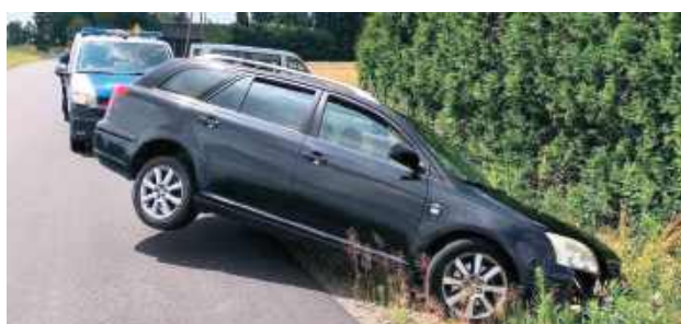
Kierowca osobowej Toyoty na terenie gminy Puławy wjechał do rowu, następnie wytoczył się z samochodu i schował się w krzakach. Myślał, że w ten sposób uniknie konsekwencji za jazdę pod wpływem alkoholu. Wydmuchał trzy promile

W takim stanie za kierownicą usiedli mieszkańcy powiatu puławskiego i zwoleńskiego. Jeden kierował Toyotą, drugi Hondą. W ręce policji wpadli jednego dnia.