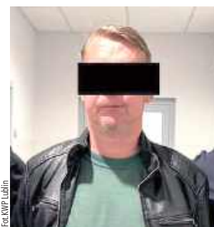
W piątek (11 lipca) mężczyzna usłyszał zarzuty. Decyzją prokuratura został objęty policyjnym dozorem

- Podczas udzielania pomocy medycznej nietrzeźwy 50-latek zachowywał się agresywnie i zaatakował pielęgniarkę - naruszył jej nietykalność cielesną poprzez duszenie za szyję i drapanie. Na miejsce wezwano policjantów z Komisariatu I Policji w Lublinie. Zatrzymali agresora, który podczas czynności znieważał interweniujących policjantów. Mężczyzna trafił do policyjnego aresztu. Zebrany materiał dowodowy pozwolił na przedstawienie 50-latkowi dwóch zarzutów: naruszenia nietykalności cielesnej oraz znieważenia funkcjonariusza publicznego - opisuje pod-