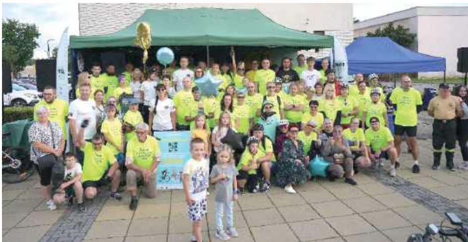
W minioną sobotę odbyło się świętowanie tytułu najlepszych!

Tegoroczna edycja RSP przyniosła wyjątkową dawkę adrenaliny, gdyż rywalizacja toczyła się aż na trzech płaszczyznach! Rowerzyści walczyli o zwycięstwo w osobnych kategoriach: dla dużych miast, dla mniejszych gmin, o zupełnie nowo wprowadzony Super Puchar RSP! W tej prestiżowej rywalizacji zmierzyły się dwa najbardziej utytułowane dotychczas miasta – Biała Podlaska i Nowa Sól, mające po trzy zwycięstwa w historii konkursu. Po zaciętej walce Najlepsza okazała się Biała Podlaska!