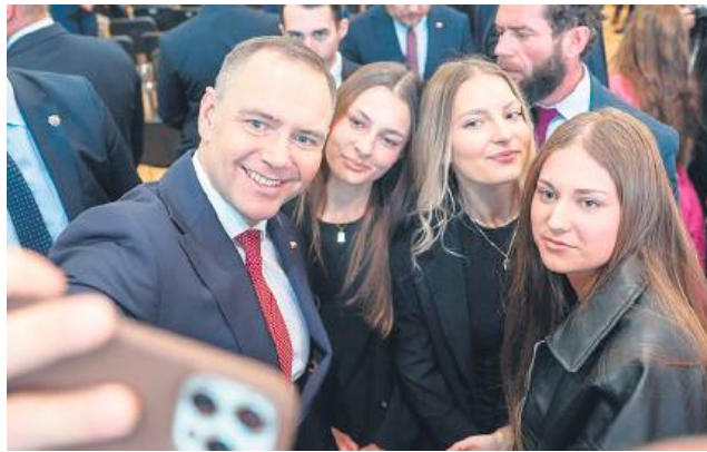
Po debacie na konferencji „Między informacją a dezinformacją” była chwila na pamiątkowe selfie z prezydentem RP.

z dezinformacji w dobie globalnych kryzysów.