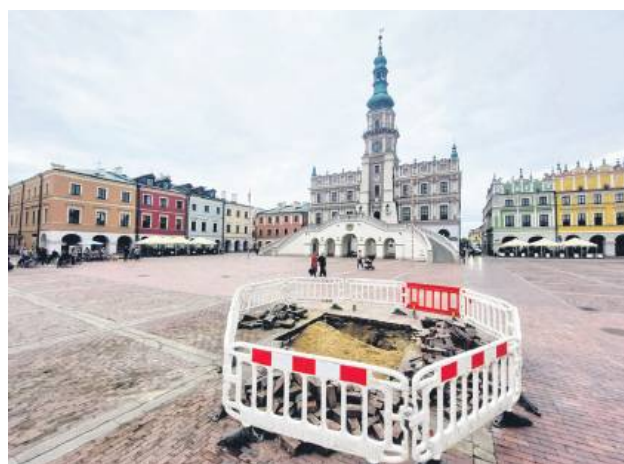
W tym miejscu woda najprawdopodobniej wypłukała piasek, dlatego doszło do obniżenia gruntu.

Poza ciekawskimi, którzy z bliska chcą zobaczyć te »podziemne korytarze«, nie się nie dzieje. Bruk nie zapadł się w tym miejscu, a celowo rozebraliśmy, aby sprawdzić, dlaczego w tym miejscu zbierała się woda. Dlaczego było lekkie jego obniżenie. W takich przypadkach naszym obowiązkiem jest sprawdzenie,