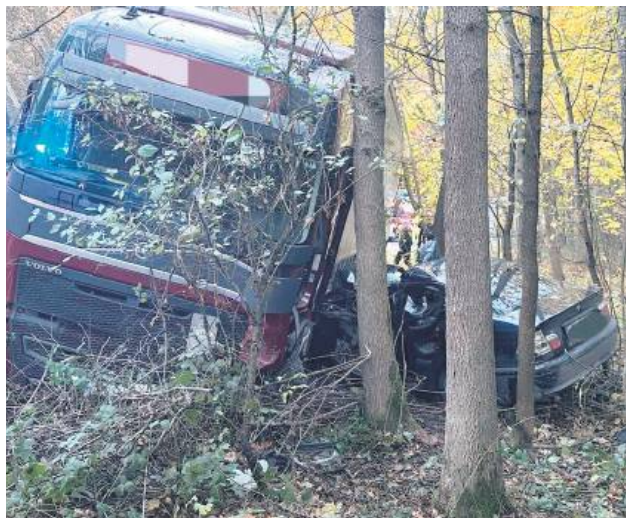
Śmiertelny wypadek w miejscowości Zatyłe. Nie żyje 60-letni kierowca ciężarówki.