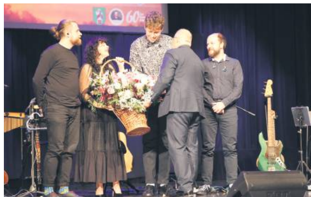
Wieczór zakończył koncert zespołu Ponad Chmurami.