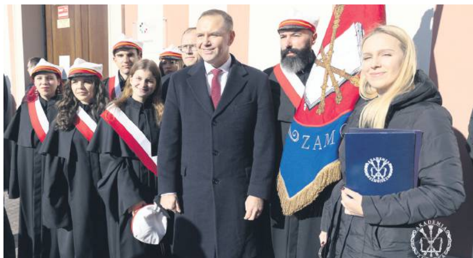
Prezydent RP przyjechał na inaugurację roku akademickiego w AZ.

K arol Nawrocki ostatni raz był w Zamościu 30 stycznia. Wtedy był kandydatem na prezydenta RP. 21 października, już jako prezydent RP, ponownie zawitał do Hetmańskiego Grodu. Na inaugurację roku akademickiego w Akademii Zamojskiej przyjechał z Tomaszowa Lubelskiego, gdzie wziął udział w konferencji „Między informacją a dezinformacją”. Na dziedzińcu odnowionego gmachu Akademii Zamojskiej czekały na niego nie tylko władze uczelni, wykładowcy i studenci, ale też parlamentarzyści oraz przedstawiciele władz samorządowych i służb mundurowych. W najnowszej historii uczelni była to pierwsza