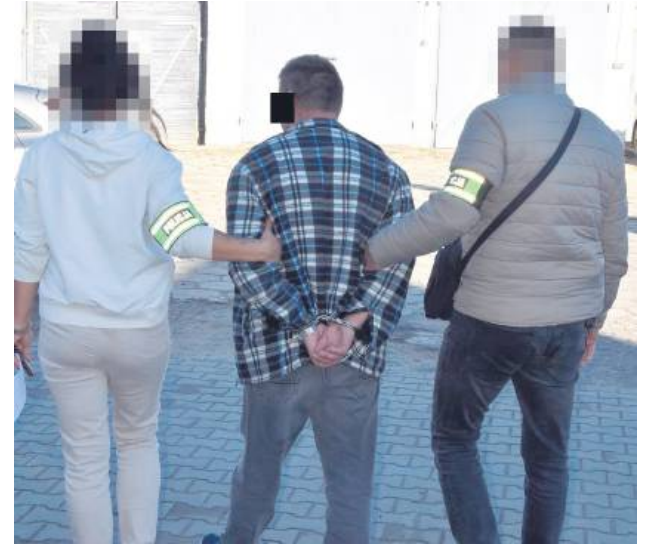
Ścigany listem gończym 56-latek z Gminy Horodło ukrył się pod podłogą na strychu w domu, ale policjanci i tam go znaleźli. Najbliższe 2,5 roku spędzi za kratami więzienia.

Obaj zostali skazani na więzienie za niepłacenie alimentów i uchylali się od odbycia kary. 45-latek z gminy Werbkowice, poszukiwany europejskim nakazem aresztowania, ukrywał się poza granicami Polski, natomiast ścigany listem gończym 56-latek z gminy Horodło schował się przed policjantami pod podłogą na strychu w domu. Oboje zostali zatrzymani i już trafili za kraty.