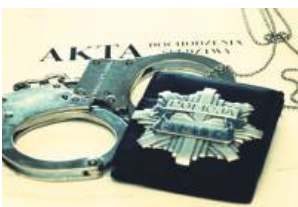
Zamościanin liczył na to, że mundurowi nie odnajdą jego kryjówki i nadal będzie mógł cieszyć się wolnością.

57-letni mieszkaniec Zamościa był poszukiwany przez policję. Przez pewien czas skutecznie unikał kary, aż w końcu wpadł w ręce funkcjonariuszy. Nie pomogła mu nawet kryjówka w tapczanie.