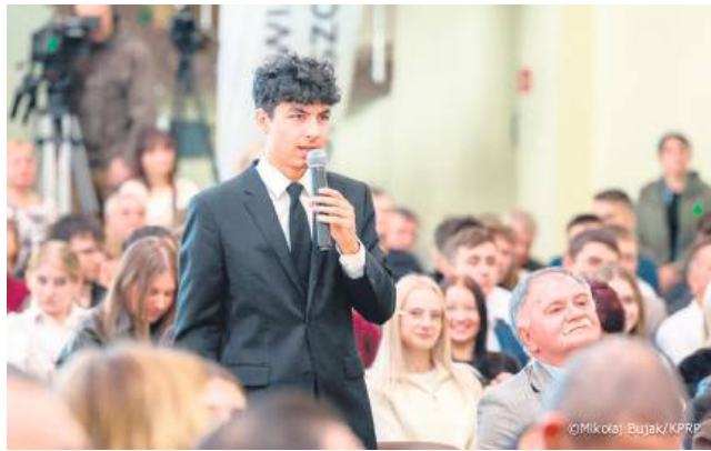
Młodzi ludzie z Tomaszowa Lubelskiego przywitani prezydenta RP z wielkim entuzjazmem. Chętnie też zadawali mu pytania.

To jest problem, którym będę się zajmował – zapewnił.