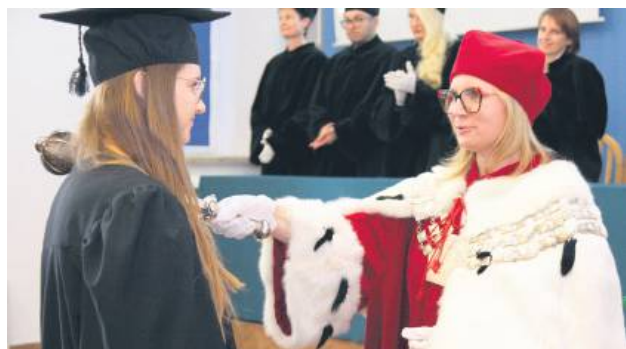
Nowi studenci mogą liczyć na przyjazną atmosferę studiowania oraz pomoc i wsparcie zarówno ze strony pracowników administracyjnych, jak i wykładowców.