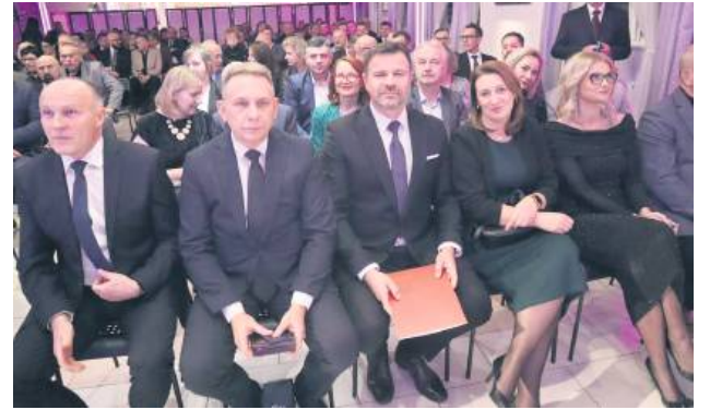
Na jubileuszu nie mogło zabraknąć władz miasta.