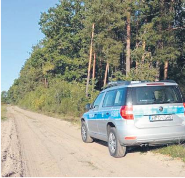
Szczęśliwy finał miały poszukiwania 73-letniego mieszkańca powiatu zamojskiego. Tej samej nocy funkcjonariusze pomogli również innemu seniorowi.

Nocą 23 października funkcjonariusze z Komendy Miejskiej Policji w Zamościu oraz posterunku w Krasnobrodzie prowadzili intensywne poszukiwania zaginionego 73-letniego mieszkańca regionu. Akcja zakończyła się szczęśliwie – mężczyzna został odnaleziony na nieużytkach rolnych, cały i zdrowy, po czym trafił pod opiekę krewnej. Tej samej nocy czujność jednego z policjantów pozwoliła pomóc także innemu seniorowi – 85-latkowi, który zgubił drogę do domu. Funkcjonariusz udzielił mu wsparcia i wezwał patrol, który bezpiecznie odwiózł starszego mężczyznę do rodziny.