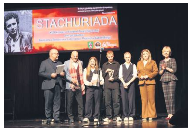
Znany zwycięzców tegorocznej edycji Stachuriady.

ka, odbyły się przesłuchania konkursowe. Każdy uczestnik przygotował dwa utwory – je-