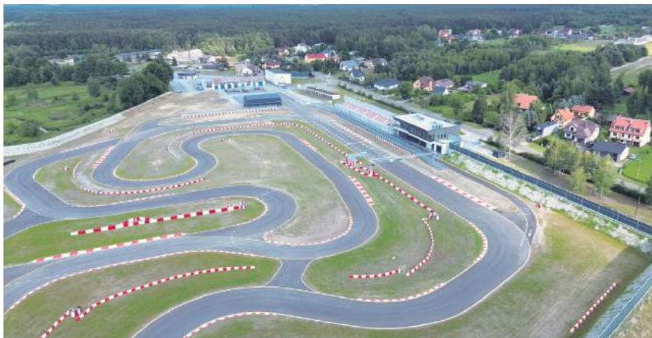
Biłgorajski Autodrom wzbudził zainteresowanie ze względu na przetarg na wynajem gokartów.