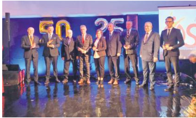
Podczas gali uhonorowano byłych dyrektorów OSiR.