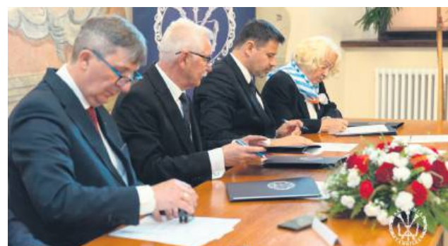
Podpisanie listu intencyjnego wyrażającego wolę utworzenia Muzeum Dzieci Zamojszczyzny.