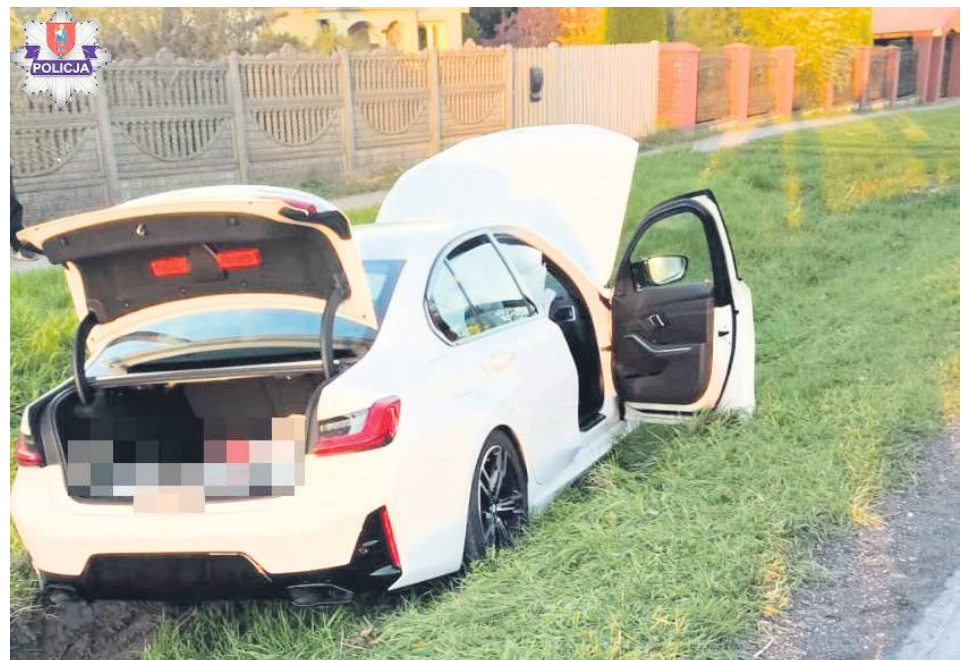
Kierowca BMW z Hrubieszowa został ukarany mandatem w wysokości 5 tys. zł.