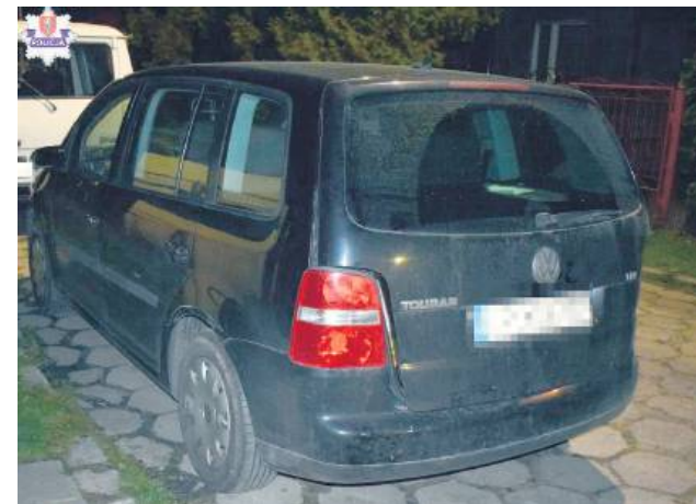
Nietrzeźwy kierujący bez uprawnień został zatrzymany w Zamościu dzięki obywatelskiemu zgłoszeniu.

zareagował na sygnał mundurowych do zatrzymania. Kiedy zmniejszył prędkość, nagle otworzyły się drzwi od strony pasażera i z samochodu wypadł kompletnie pijany mężczyzna. Jak się okazało, był to 67-letni pasażer. Na szczęście nie odniósł obrażeń – relacjonuje Dorota Krukowska-Bubiło.