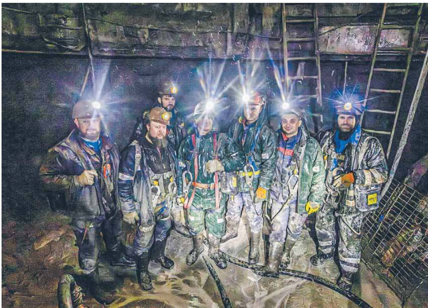
Górnicy połączyli wentylacyjnie szyb Grzegorz z wyrobiskami Zakładu Górniczego Sobieski