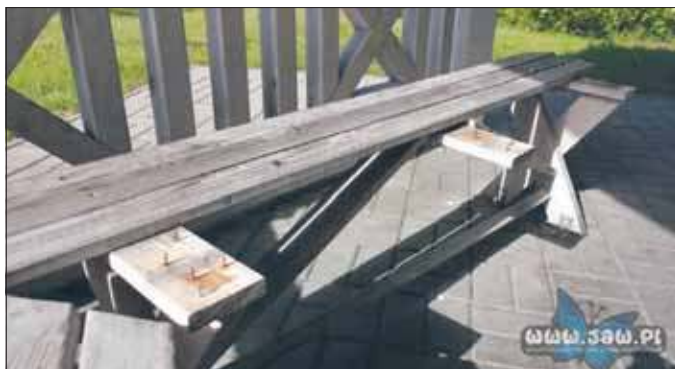
Zdemastowane ławki w parku angielskim

Park angielski to miejsce, które od lat służy mieszkańcom jako przestrzeń wypoczynku, spotkań i kontaktu z naturą. Starannie utrzymana zieleń i zadbane obiekty mają sprzyjać wspólnemu spędzaniu czasu. Jednak stał się on celem dla wandalów. Nieznani sprawcy zdemolowali