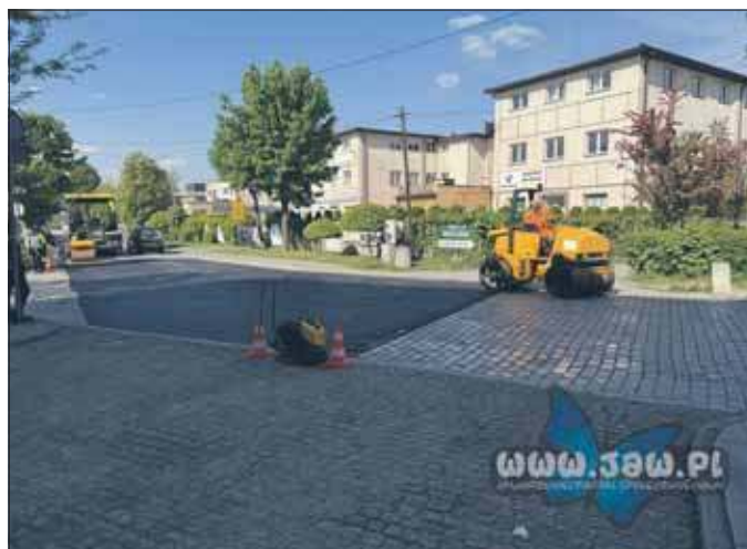
Prace na ulicy Inwalidów Wojennych

Wymiana wzbudziła różne reakcje wśród mieszkańców. Niektórzy są zdania, że granitowa kostka powin-