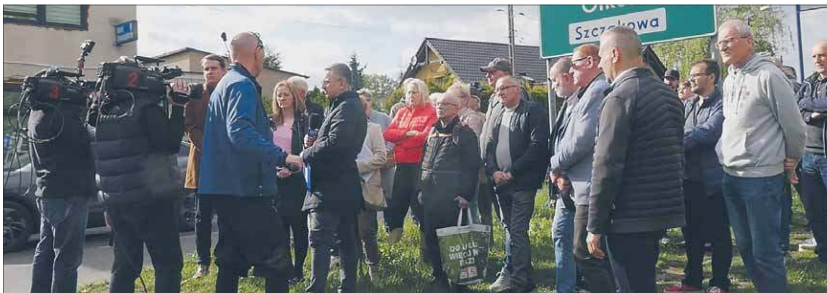
Mieszkańcy mają dość wzmożonego ruchu samochodowego pod swoimi oknami