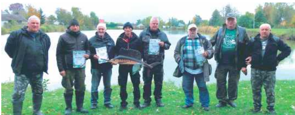
Pamiątkowe zdjęcie najlepszych. No i ta nagroda w rękach zwycięzcy!

W niedzielę na łowisku specjalnym w Przytocznie odbyły się towarzyskie spławikowe zawody wędkarskie o ręcznie rzeźbiony puchar przechodni prezesa Koła PZW Ryki.