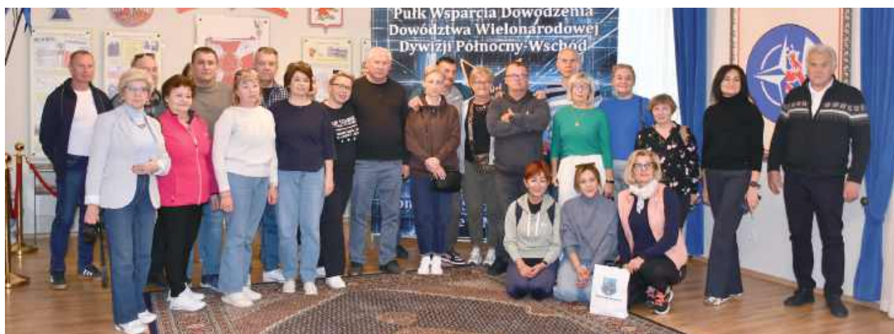
W czasie wyjazdu dęblńscy goście odwiedzili Salę Tradycji Pułku Wsparcia Dowodzenia Dowództwa Wielonarodowej Dywizji Północny-Wschód

W czasie podróży wojskowo – historycznej uczestnicy odwiedzili urokliwy Lidzbark Warmiński, zapoznali się z historią zamku oraz jego władcami. Kolejnym punktem wyjazdu był Frombork, a w nim przede wszystkim Katedra Fromborska, gdzie spędzili czas, słuchając muzyki organowej, w której dominował Jan Sebastian Bach. Wyjątkową atrakcją była