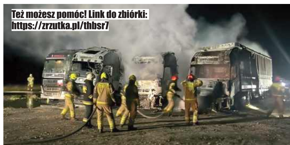
W pożarze zostały zniszczone wszystkie pojazdy należące do firmy