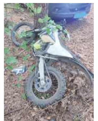
40-letni mężczyzna został przewieziony śmigłowcem LPR do szpitala

4 października na drodze gruntowej w Sobieszynie-Brzozowej doszło do wypadku 40-letniego motocyklisty na drodze gruntowej.