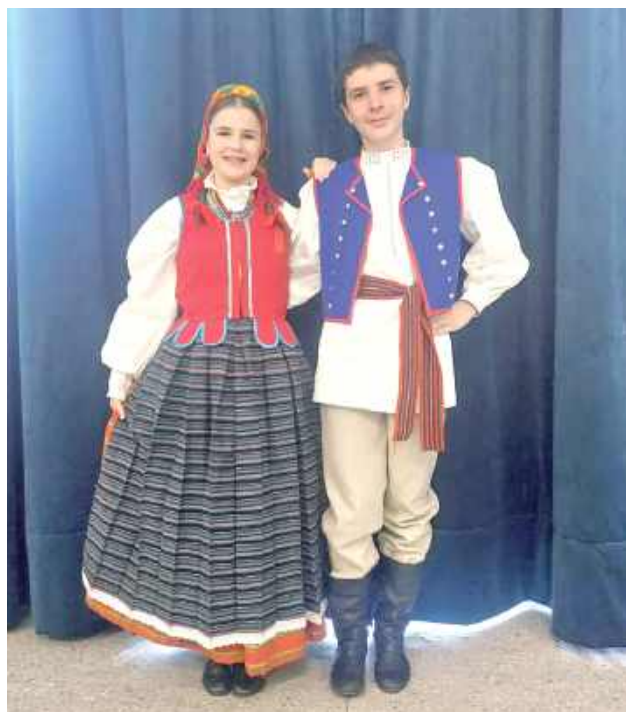
Według założeń projektu dzieci i młodzież poznają i przygotowują tańce ryckie oraz zaprezentują je w regionalnych (ryckich) strojach, które wykona pracownia strojów ludowych i historycznych „Z malowanej skrzyni”

Umowę z Narodowym Centrum Kultury na realizację przedsięwzięcia podpisało Towarzystwo Wspierania Edukacji i Kultury „Tradycja”. Zadanie pod nazwą „Ryckie tańce, ryckie stroje rozwijamy tradycji zwoje - regionalne stroje ludowe dla DZTL Ryki” jest realizowane od maja br. Jego całkowity koszt to 94830 zł. Ponad 94 proc. tej kwoty (90000 zł) pokryje Narodowe Centrum Kultury. Według za-