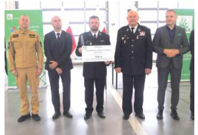
Promesę otrzymuje OSP w Rykach