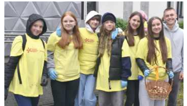
Uczniowie z Czernica bardzo chętni przyjechali, by uczestniczyć w akcji

Jak dodaje prezes Fundacji „Hospicjum - Razem możemy więcej”, żonkil jest symbolem nadziei i wsparcia osobom cierpiącym. - Połączyliśmy te wydarzenia, by przed naszym hospicjum na wiosnę zakwitły piękne kwiaty, rozkwitła nadzieja w naszych sercach. Wszystkie cebulki żonkili zostały posadzo-