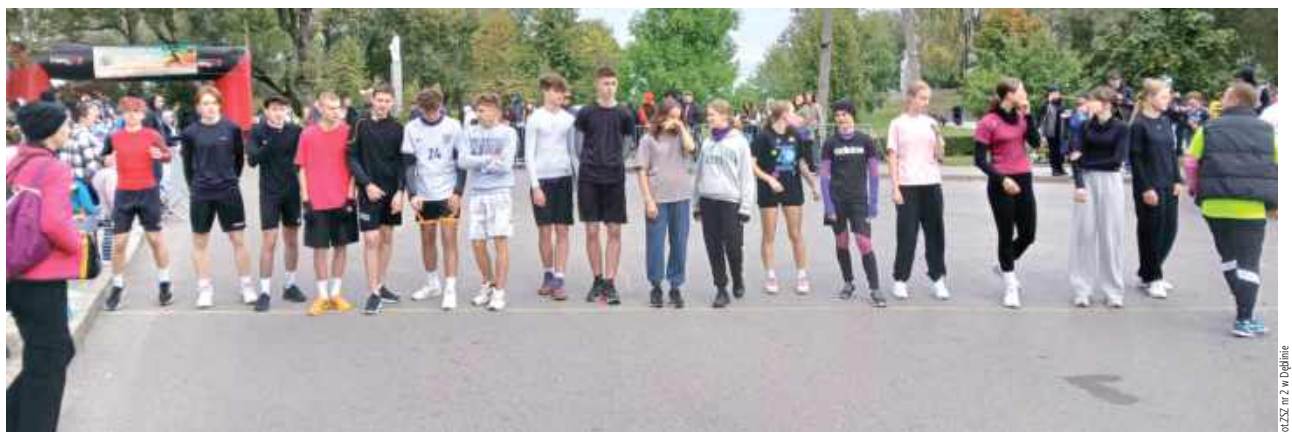
Cała drużyna otrzymała gratulacje za wspaniałe przygotowanie i wolę walki, która pozwoliła im stawić czoła trudnej trasie i silnej konkurencji

Uczniowie Zespołu Szkół Zawodowych nr 2 w Dęblinie odnieśli sukcesy podczas XXXI Ogólnopolskich Biegów Ulicznych Pamięci Generała Franciszka Kleeberga w Kocku, wykazując się dużą determinacją i sportowym duchem.