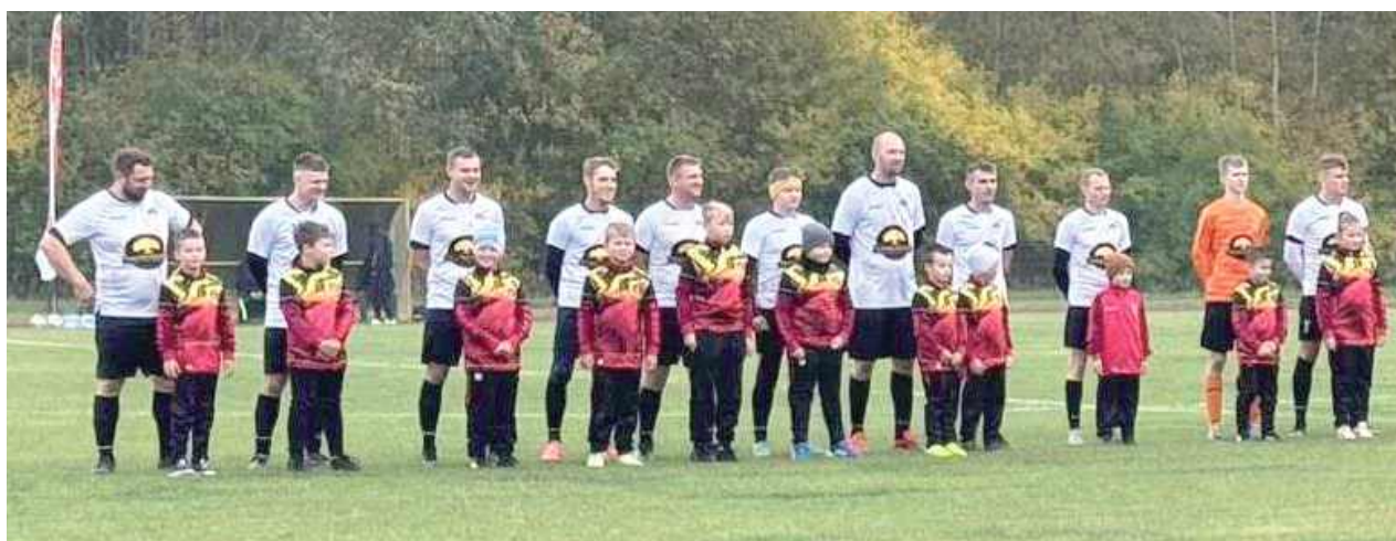
Piłkarze Orłąt wygrali starcie derbowe. Obie bramki zdobyli na samym początku spotkania

W miniony weekend piłkarze Orłąt Nowodwór odnieśli drugie zwycięstwo w sezonie, a pierwsze na wyjeździe, pokonując Laskowię Baranów 2:0. Mecz miał dodatkowy smaczek lokalnych derbów. Obie miejscowości dzieli zaledwie 10 kilometrów.