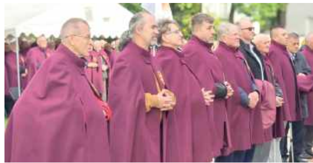
Pielgrzymka do Pratulina, będąca jednym z najważniejszych wydarzeń dla mężczyzn w diecezji, była nie tylko okazją do duchowej refleksji, ale także do pogłębienia więzi z innymi wiernymi oraz z Bogiem

Odbyła się XV Diecezjalna Pielgrzymka Mężczyzn do Pratulina, w której uczestniczyli również przedstawiciele Parafii Najświętszego Zbawiciela w Rykach. Podczas wydarzenia dwóch mężczyzn z parafii złożyło ślubowanie, stając się Braćmi Strażnikami Kościoła.