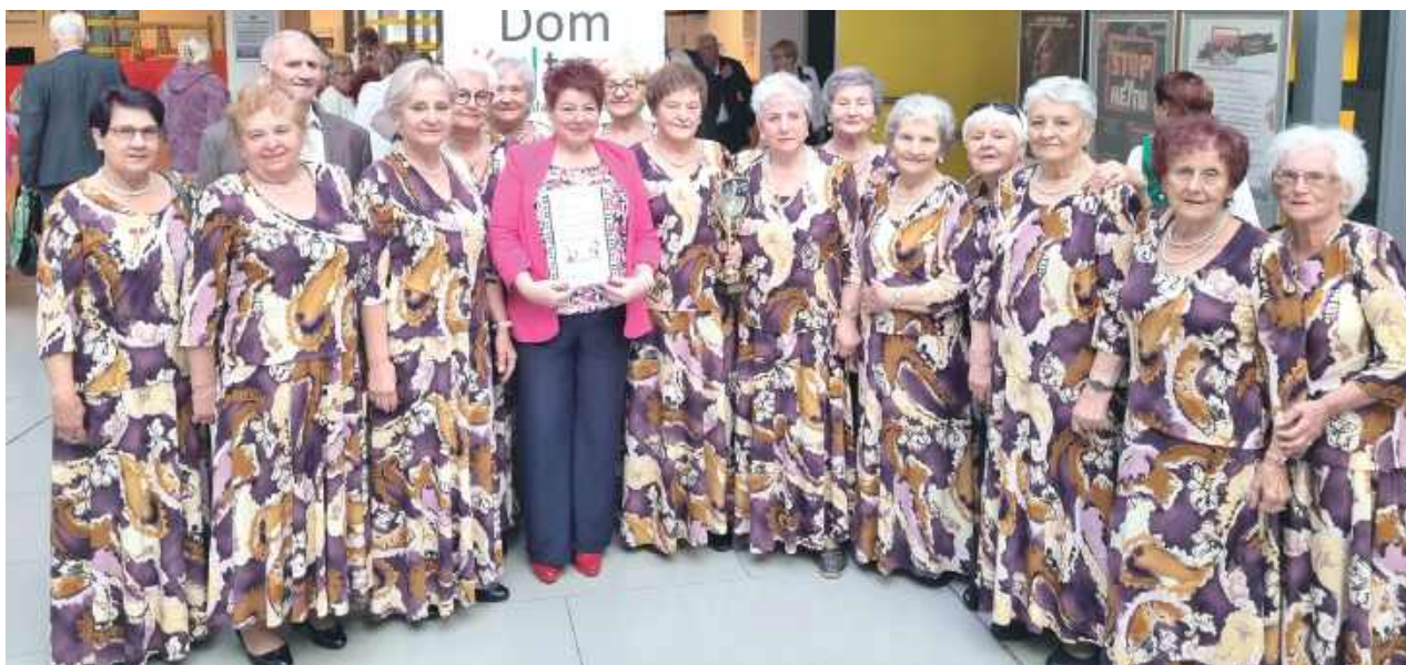
Po zakończeniu przeglądu wszystkim zespołom wręczono statuetki, dyplomy oraz upominki, doceniając ich talent, pasję i wkład w kultywowanie tradycji piosenki biesiadnej