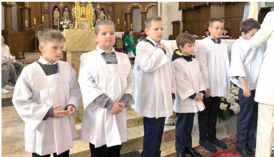
W Parafii Najświętszego Zbawiciela w Rykach odbyła się wyjątkowa uroczystość – Święto Ministrantów

5 października w Parafii Najświętszego Zbawiciela w Rykach, odbyła się wyjątkowa uroczystość – Święto Ministrantów. Podczas Mszy Świętej