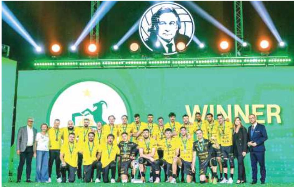
W Lublinie rozegrano Bogdanka Volley Cup im. Tomasza Wójtowicza!

W sobotę, 11 i niedzielę, 12 października w hali Globus odbył się Bogdanka Volley Cup im. Tomasza Wójtowicza, legendarnego siatkarza, którego imieniem nazwana jest również lubelska hala. Zmagania w sobotę otworzyli siatkarze Bogdanki LUK Lublin i JSW Jastrzębskiego Węgla. Lepszy w tym spotkaniu okazali się