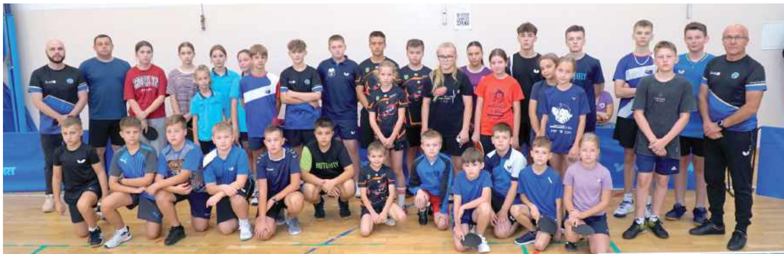
Pamiątkowe zdjęcie uczestników pierwszej edycji

- Pierwszy turniej wypadł bardzo dobrze, dlatego mamy nadzieję, że również i teraz frekwencja dopisze. Już teraz mieliśmy wielkie telefonów z pytaniami odnośnie turnieju, dlatego jesteśmy pewnie, że po raz kolejny będzie to świetna okazja do propagowania tenisa stołowego. Dla tych, którzy nie będą mogli być wspólnie z nami, przygotowaliśmy relacje z turnieju na naszym kanale YouTube - mówi