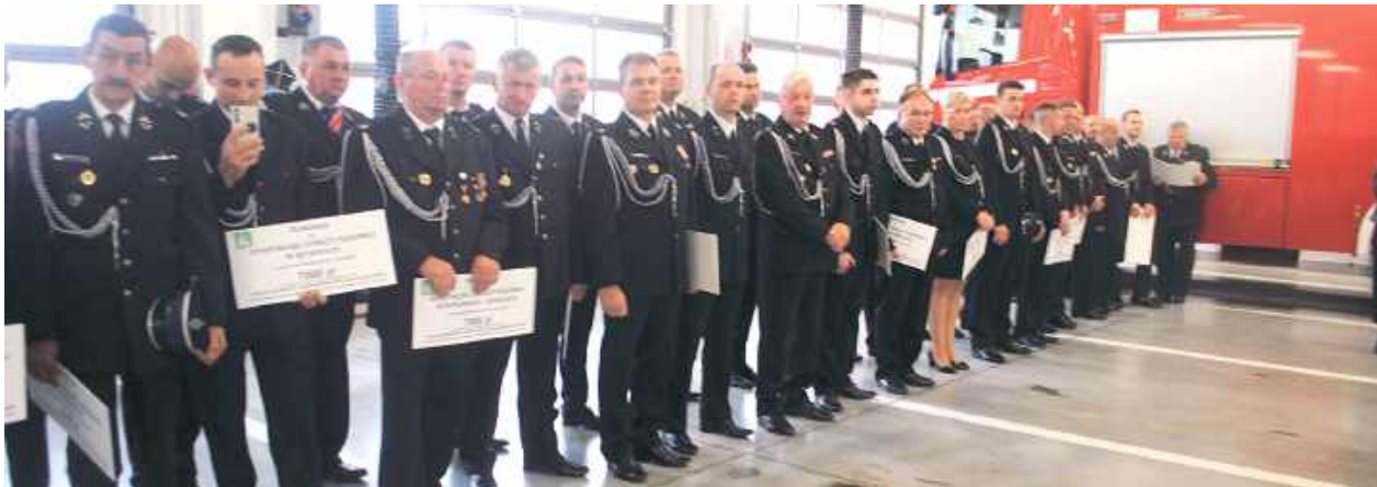
Uroczystość w KP PSP w Lubartowie

56 jednostek OSP z powiatów lubartowskiego, łukowskiego, puławskiego i ryckiego otrzymało dofinansowanie od KRUS.