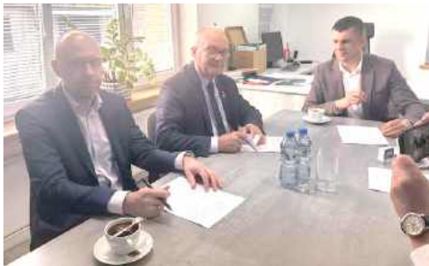
Inwestycje mają na celu poprawę stanu infrastruktury drogowej oraz zwiększenie bezpieczeństwa na terenie powiatu ryckiego

We wtorek, 7 października w siedzibie Zarządu Dróg Powiatowych w Rykach podpisano dwie umowy dotyczące realizacji remontów dróg powiatowych na terenie Powiatu Ryckiego. Celem inwestycji jest poprawa sta-