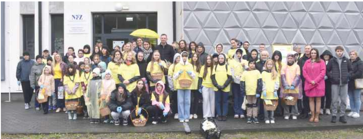
Pamiątkowe zdjęcie uczestników akcji

11 października przed siedzibą Hospicjum im. Św. Siostry Faustyny Kowalskiej przy ul. Stawskiej 322 odbyła się wyjątkowa akcja sadzenia żonkili w ramach ogólnopolskiej kampanii „Pola Nadziei”.