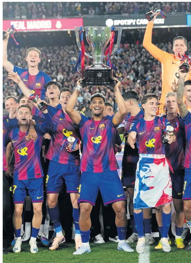
Piłkarze Barcelony pokonali Real Madryt 2:0 i zapewnili sobie drugi rok z rzędu mistrzostwo Hiszpanii. Na stadionie Camp Nou wybuchła prawdziwa euforia

Kibice Barcelony wiele minut przed końcem meczu śpiewali: „Campeones, campeones!” („Mistrzowie, mistrzowie!”).