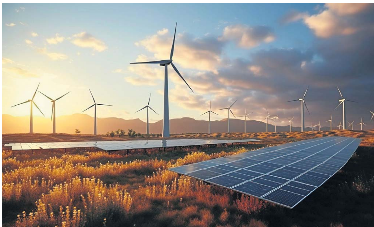
Lądowa energetyka wiatrowa w Polsce pozostaje jednym z kluczowych kierunków rozwoju sektora energii

- Mówimy o źródle energii, które zasila budżety gmin i może zapewniać długotermi-