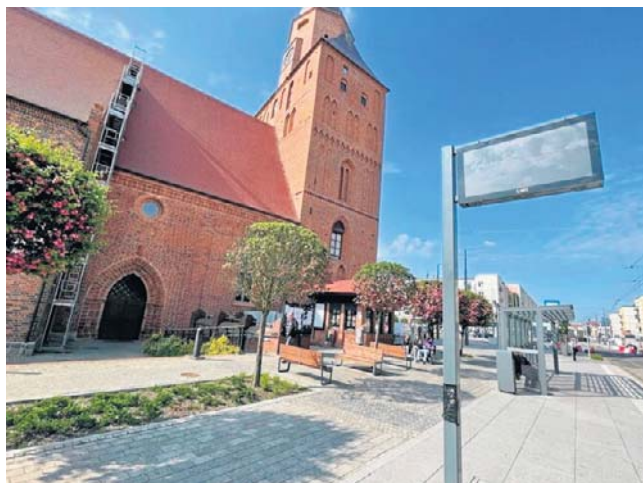
Według propozycji ten przystanek zmieniłby nazwę z „Katedra” na „Stary Rynek”

Ostatnia zmiana miałaby dotyczyć nazwy pętli „Wieprzycy PKP” na „Wieprzycę”. Zdaniem radnej dzisiejsza nazwa ma wprowadzać turystów i gości w błąd. Jest już bowiem przystanek „Dworzec Główny” na ul. Dworcowej.