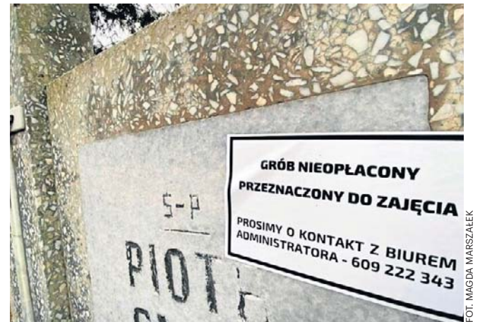
Opłata za grób pojedynczy wynosi w Gorzowie 583,20 zł. Jest płatna raz na dwadzieścia lat

- Na grobach na cmentarzu komunalnym przy ul. Żwirowej ostatnimi czasy zaczęły masowo pojawiać się kartki z informacją o konieczności wniesienia opłaty za grób ziemny pod rygorem ich likwidacji. Jednocześnie niejednokrotnie okazuje się, że zaległości obejmują okres dłuższy niż dwadzieścia lat. Problem polega na tym, że poprzedni zarządcy cmentarza nie umieszczali tego typu informacji na grobach i teraz na-