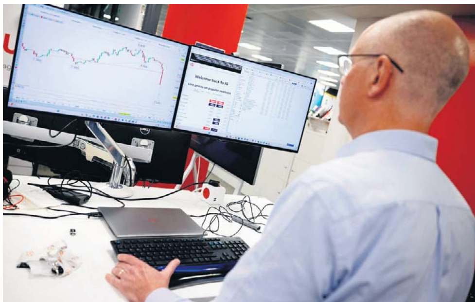
Rynki zareagowały na odrzucenie przez Trumpa odpowiedzi Iranu

„Właśnie przeczytałem odpowiedź od tak zwanych »przedstawicieli« Iranu. Nie podoba mi się to - CAŁKOWICIE NIE DO PRZYJĘCIA! Dziękuję za uwagę poświęconą tej