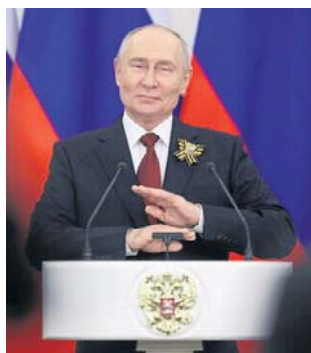
Putin „straszy” Armenię losem Ukrainy

Prezydent Rosji dał do zrozumienia, że wybór na korzyść Brukseli nieuchronnie doprowadzi do rewizji stosunków z Mo-