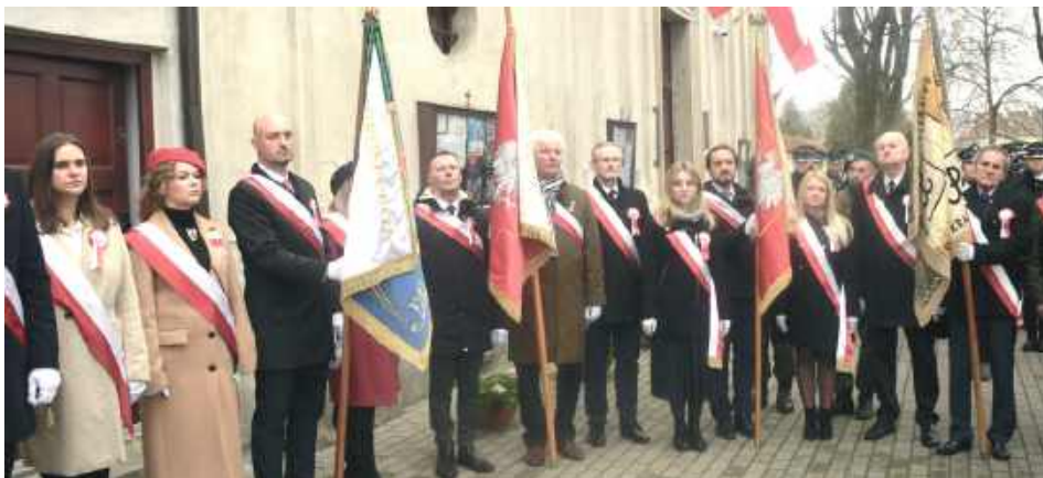
Poczty sztandarowe przed klasztorem oo. Kapucynów

Apel Pamięci w dniu Święta Niepodległości odczytano w Lubartowie dokładnie w tym miejscu, w którym polscy żołnierze toczyli walkę z Rosjanami. W treści apelu została pominięta, przypomniano za to pola bitew daleko od Lubartowa, w tym jedno aż na Litwie.