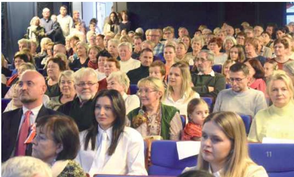
Jak zwykle podczas wspólnego patriotycznego śpiewania kino Lewart było wypełnione publicznością, nie dla wszystkich starczyło miejsc

Każde wspólne śpiewanie ma swój temat przewodni. W tym roku była to walka o niepodległość w polskim filmie. Zaprezentowane zostały fragmenty filmów o tematyce patriotycznej. Ciekawostką były fragmenty filmu „Pruska kultura” o strajku szkolnym we Wrześni. Niemy film powstał w 1907 r., został odnaleziony po przeszło stu latach w archiwum filmowym we Francji. Również niemy jest film „Rok 1863” na motywach powieści Stefana Żeromskiego „Wierna rzeka”. Dodatkową wartością jest jego ostatnia scena, w której pokazano mszę świętą już w Polsce niepodległej. W nabożeństwie z okazji rocznicy wybuchu powstania styczniowego można zobaczyć prawdziwych weteranów powsta-