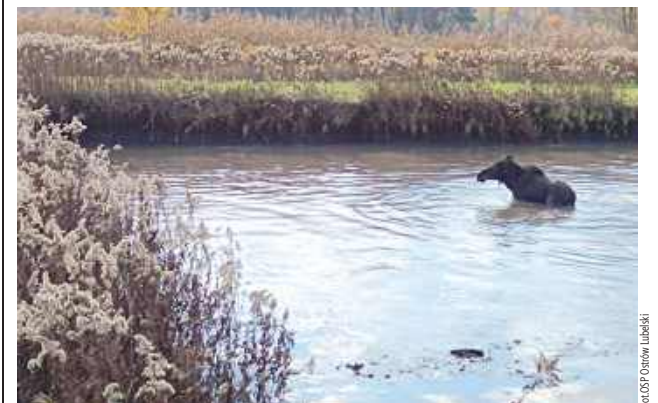
Strażacy ratowali łośia z wody

4 listopada kilkanaście minut po godzinie 11 w Bójkach w gminie Ostrów Lubelski łoś utknął w oczku wodnym. Na pomoc uwięzionemu łośiowi ruszyli strażacy. Zwierzę ratowały zastępy OSP w Ostrowie Lubelskim z samochodem Mercedes, OSP Jamy i JRG Lubartów. O akcji poinformowała OSP Ostrów Lubelski na