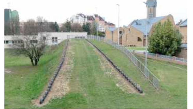
Górką saneczkowa na osiedlu Samsonowicza

Górką saneczkowa na osiedlu Samsonowicza przeszła pełną modernizację. Jest szersza, jaśniejsza i bezpieczniejsza, a dzięki nowym zabezpieczeniom i oświetleniu będzie mogła służyć dzieciom i rodzinom przez wiele sezonów.