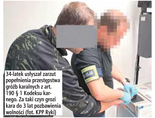
34-latek usłyszał zarzut popełnienia przestępstwa gróźb karalnych z art. 190 § 1 Kodeksu karnego. Za taki czyn grozi kara do 3 lat pozbawienia wolności

Policjanci z Komendy Powiatowej Policji w Rykach zatrzymali 34-letniego mężczyznę, który w trakcie awantury domowej groził swojej matce podpaleniem wspólnie zajmowanego domu.