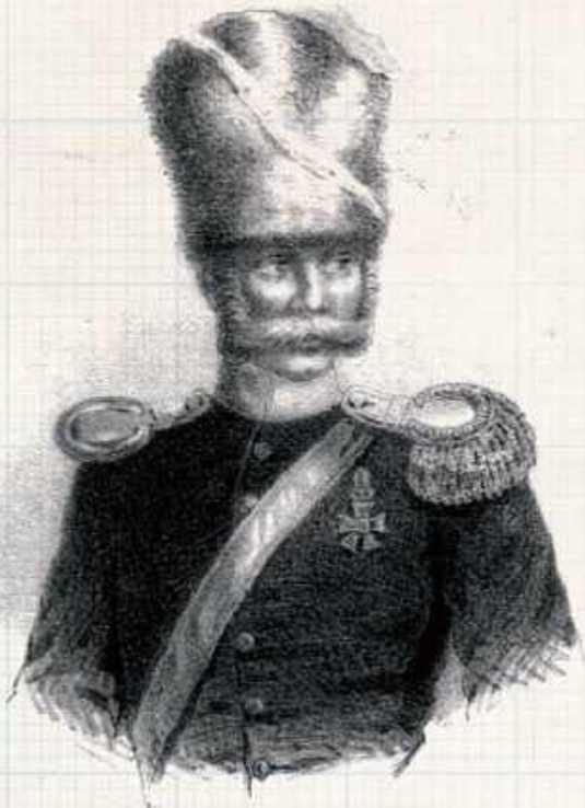
Późny, namalowany 100 lat po śmierci, portret Berka w mundurze kawalerskim

Pewnie była to szybka decyzja podjęta w przededniu konieczności obrony zrewoltowanej Warszawy przed kacapskimi hordami Suworowa. Może i podjęta niedługo potem, kiedy - jak najbardziej słusznie - jego pierwszego patrona