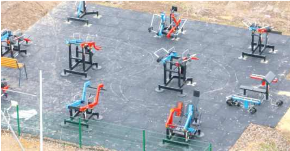
W piątek obiekt ma być gotowy

Nowa siłownia pozwala na wykonywanie pełnowartościowych ćwiczeń siłowych z obciążeniem od 2,5 do nawet 220 kg, co do tej pory było możliwe wyłącznie w profesjonalnych klubach fitness. Wbudowane kody QR uruchamiają wirtualnego trenera, który prowadzi użytkownika krok po kroku przez poprawną technikę treningu. To rozwiązanie