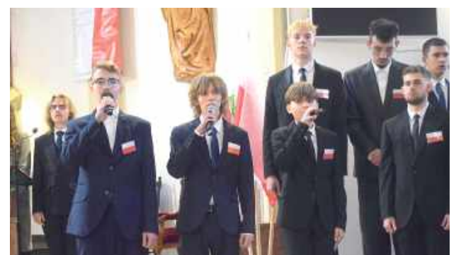
Część artystyczna w wykonaniu młodzieży z II LO