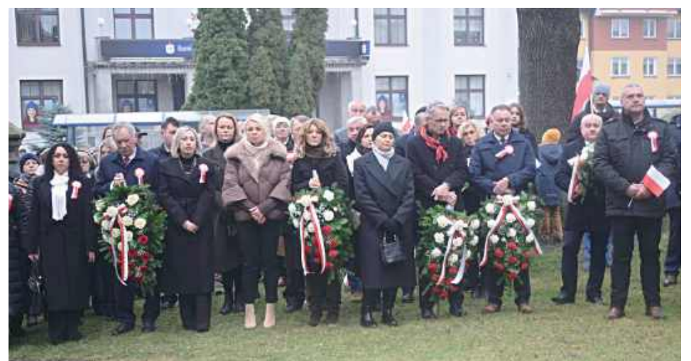
Delegacja z wieńcami pod klasztorem oo. Kapucynów