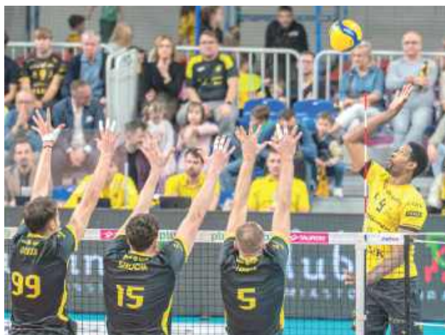
Siatkarze z Lublina zaliczyli dwie kolejne porażki

Początkowy set starcia był dość wyrównany i w jego trakcie żadna ze stron nie zdołała odskoczyć punktowo w znaczący sposób. W końcówce skuteczniejsi w ataku byli podopieczni trenera