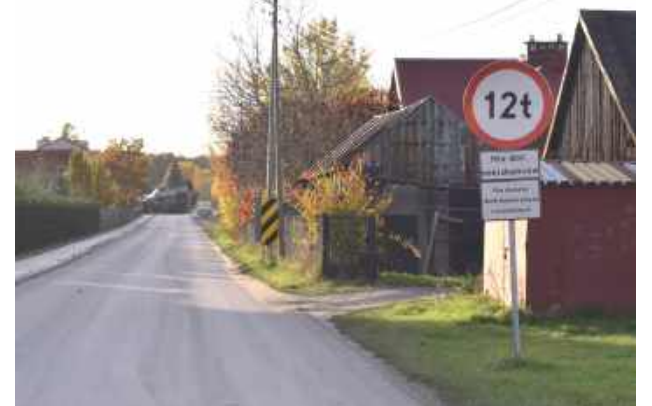
Droga gminna ze znakiem ograniczenia tonażu do 12 ton. Wjechała tam ciężarówka o wadze ponad 20 ton

Czy ciężarówki z budowy nie wjeżdżają w ul. Krańcową w Lubartowie, monitoruje Zarząd Dróg Powiatowych.