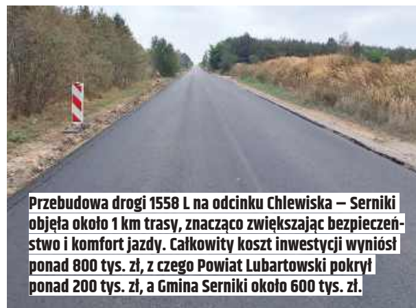
Przebudowa drogi 1558 L na odcinku Chlewiska – Serniki objęła około 1 km trasy, znacząco zwiększając bezpieczeństwo i komfort jazdy. Całkowity koszt inwestycji wyniósł ponad 800 tys. zł, z czego Powiat Lubartowski pokrył ponad 200 tys. zł, a Gmina Serniki około 600 tys. zł.