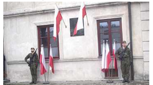
Przy tablicy upamiętniającej Józefa Piłsudskiego na warcie honorowej stanęli żołnierze 2 Lubelskiej Brygady Obrony Terytorialnej