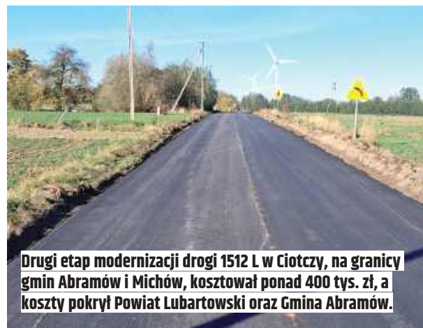
Drugi etap modernizacji drogi 1512 L w Ciotczy, na granicy gmin Abramów i Michów, kosztował ponad 400 tys. zł, a koszty pokrył Powiat Lubartowski oraz Gmina Abramów.