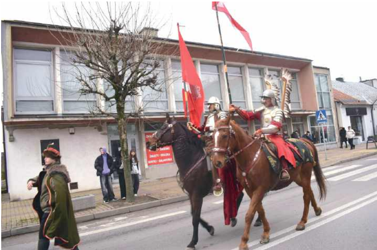
Husarze w Lubartowie