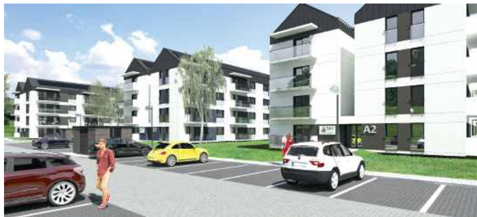
Lokale będą przekazywane najemcom w standardzie „pod klucz”, co oznacza, że będą w pełni wykończone i gotowe do zamieszkania

W Łęcznej projekt zostanie podzielony na dwa etapy – w każdym z nich powstaną po 40 mieszkań. Lokale będą przekazywane najemcom w standardzie „pod klucz”, co oznacza, że będą w pełni wykończone i go-