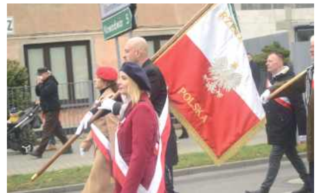
Poczet sztandarowy Miasta Lubartów