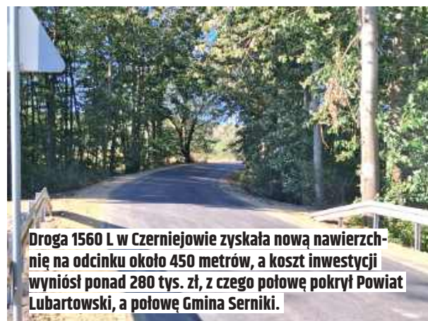
Droga 1560 L w Czerniejowie zyskała nową nawierzchnię na odcinku około 450 metrów, a koszt inwestycji wyniósł ponad 280 tys. zł, z czego połowę pokrył Powiat Lubartowski, a połowę Gmina Serniki.

Zakres prac we wszystkich czterech inwestycjach obejmował frezowanie istniejącej nawierzchni, wzmocnienie warstwy wyrównawczej i ścieralnej, wykonanie wzmocnień nawierzchni na krawężniach dróg, wzmocnienie poboczy gruntowych kruszywem oraz wykonanie zjazdów z kruszywa łamanego.