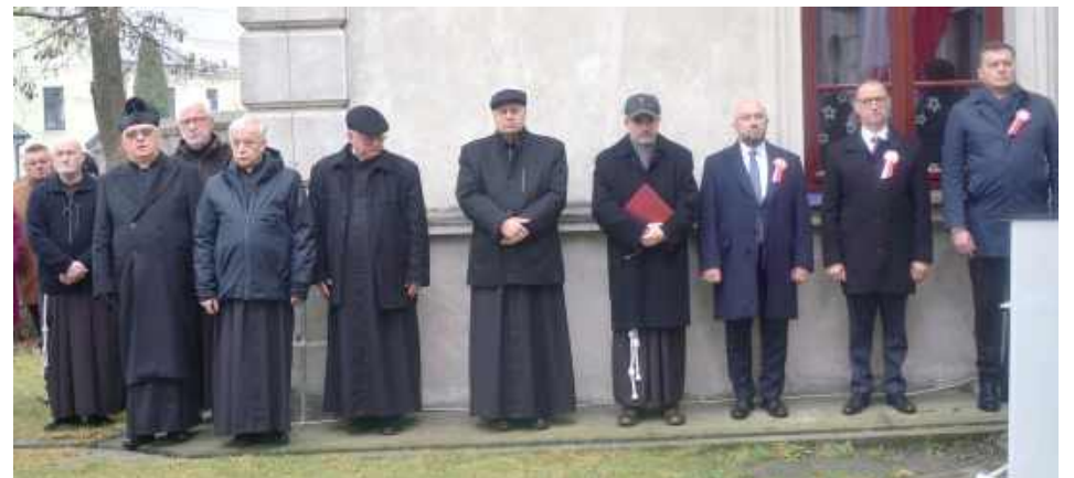
Władza świecka i duchowna podczas uroczystości 11 listopada

Legiony Polskie (I Brygada i czasowo przydzielony do niej 4 pułk piechoty Legionów Polskich) walczyły na ziemi lubartowskiej w sierpniu 1915 r., pod Samokłeskami