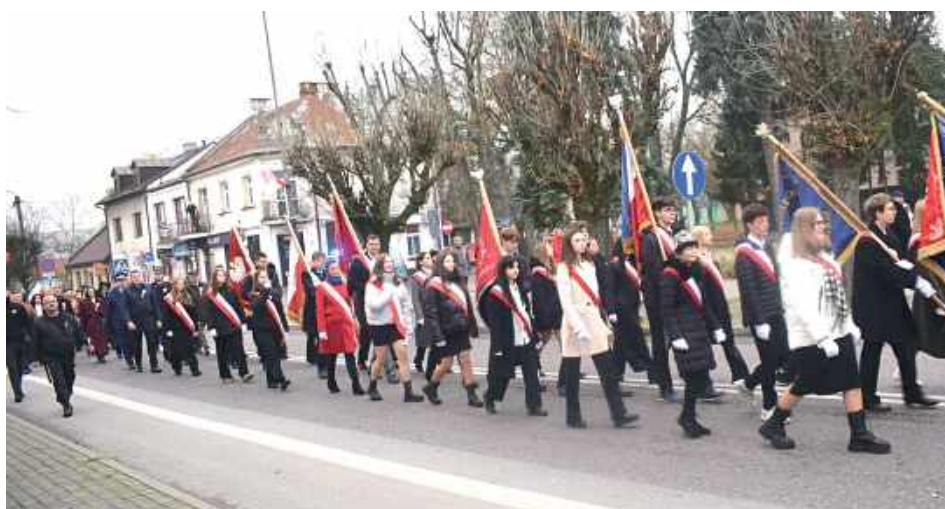
Przemarsz przez ulice Lubartowa