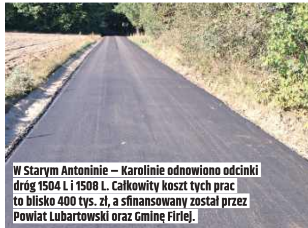
W Starym Antoninie – Karolinie odnowiono odcinki dróg 1504 L i 1508 L. Całkowity koszt tych prac to blisko 400 tys. zł, a sfinansowany został przez Powiat Lubartowski oraz Gminę Firlej.