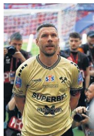
Łukasz Podolski na razie ma 8 procent akcji Górnika

Cieszymy się dzisiaj, jutro z Pucharu, a potem znów liga, przygotowania na te ostatnie cztery mecze, po to, żeby to miejsce, jakie teraz mamy, utrzymać. Może uda się jeszcze trochę więcej? I potem na spokojnie usiądź sobie i zobacz, jak to pójdzie dalej.