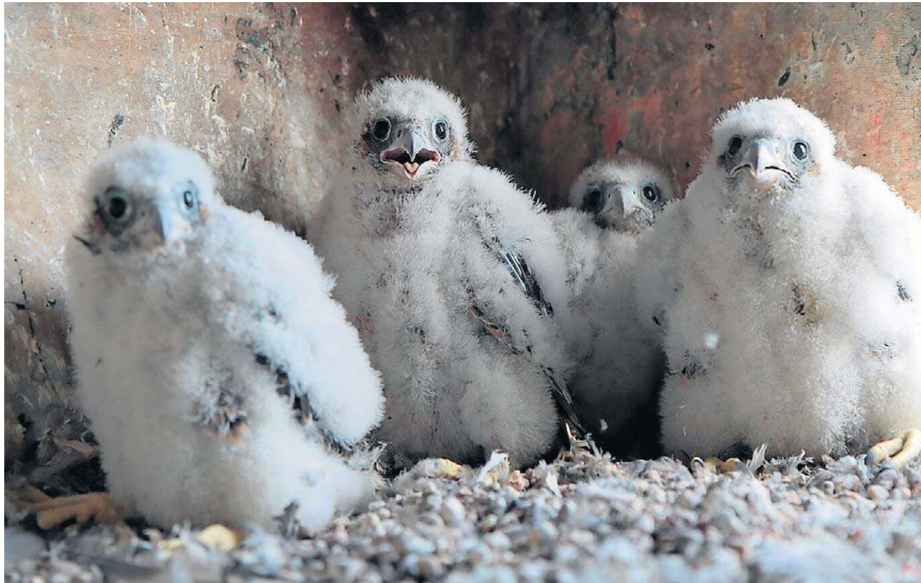
Po niemal 40 latach prowadzenia programu reintrodukcji dziś w Polsce mamy ponad 100 par sokołów wędrownych. Dla porównania bielików jest 1100-1400 par

Bardzo dużą rolę w reintrodukcji gatunku odegrali sokolnicy z Krakowa, Włocławka