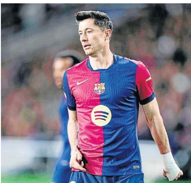
Lewandowski będzie rozmawiał o swojej przyszłości dopiero wtedy, gdy Barca zapewni sobie mistrzostwo

Mistrzostwo Portugalii po kolejnej skromnej wygranej zapewniło sobie FC Porto. „Smoki” wygrały u siebie z niżej notowaną Alvercą (1:0) po голу polskiego obrońcy Jana Bednarka, który przesądził o 31. tytule w bogatej