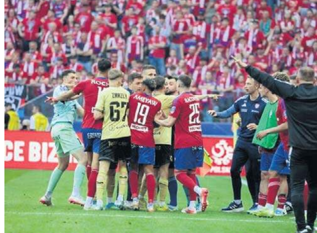
W końcówce spotkania na murawie doszło do awantury

Górniki po raz ostatni grał w finale w 2001 roku, a zdobył Puchar w 1972. Związaną z tym