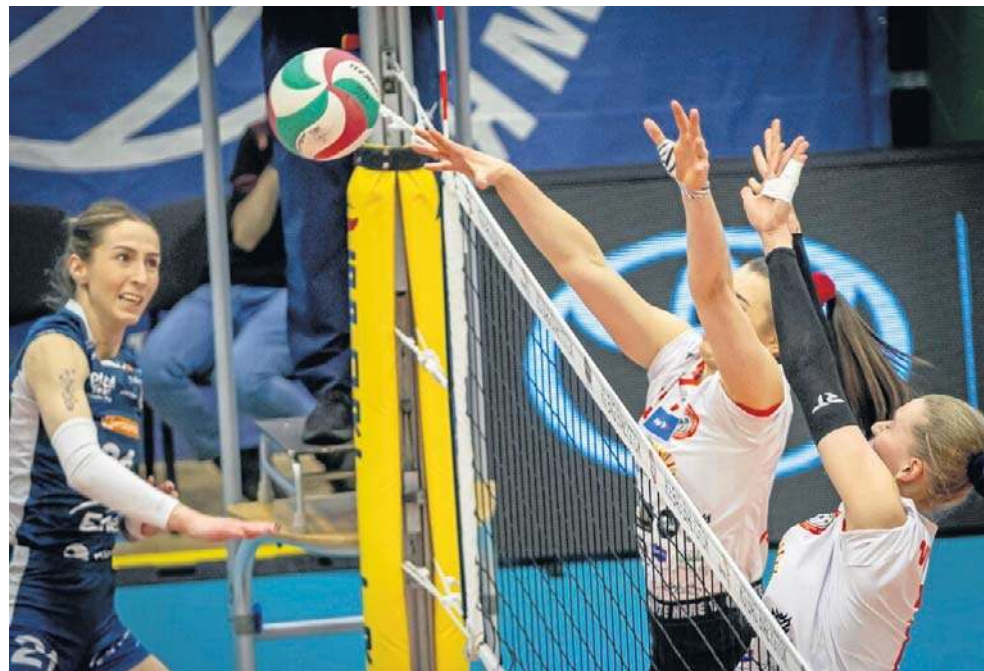
Siatkarki BAS-u KB Białystok (z prawej) stoczyły fantastyczną batalię z KS-em Piła

Niewiele lepiej wyglądał dla przyjezdnych trzeci set. Wśród gospodyń nie było słabych punktów, wszystko funkcjonowało znakomicie i punkty trafiały