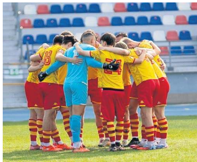
Piłkarze Jagiellonii II Białystok po emocjonującym meczu zremisowali z wiceliderem III ligi Wartą 3:3

Mecz ŁKS Łomża z Legią II Warszawa zakończył się po zamknięciu numeru gazety.