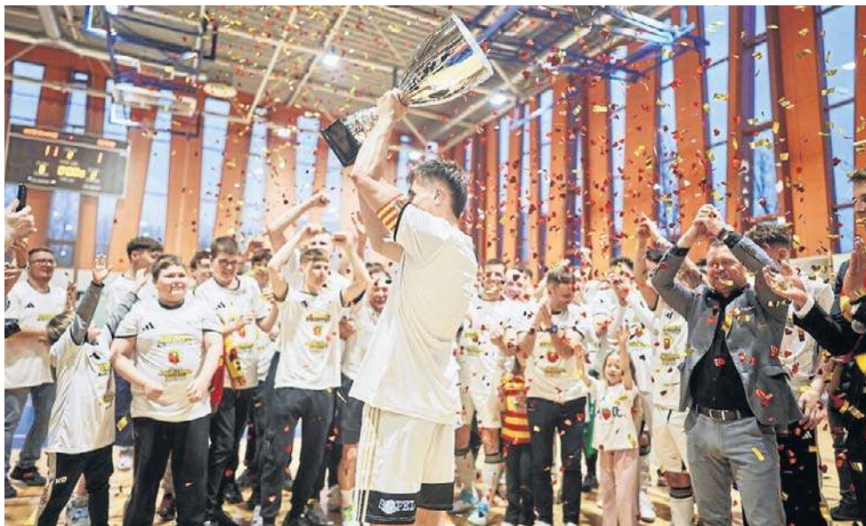
Jagiellonia Futsal Białystok świętuje powrót do ekstraklasy

Futsaliści Jagiellonii Białystok byli pewniakami do awansu do ekstraklasy. W pierwszym spotkaniu, rozegranym na wy-