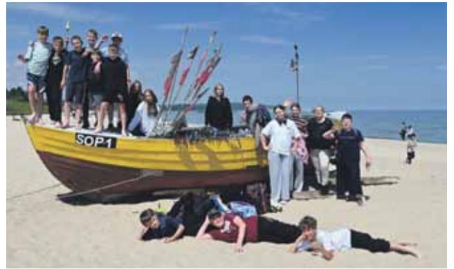
Pogoda w wożach cichowianom sprzyjała.