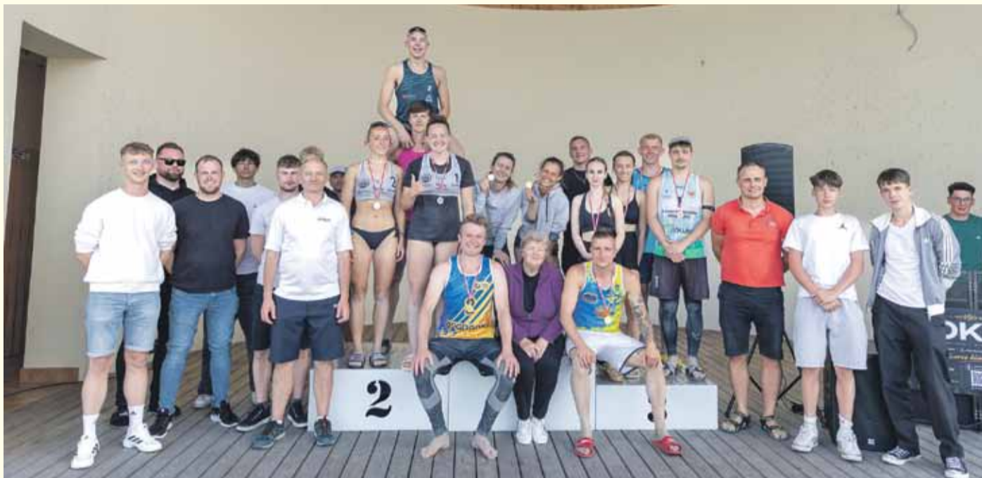
Do tegorocznej edycji memoriału zgłosiło się aż 58 drużyn.