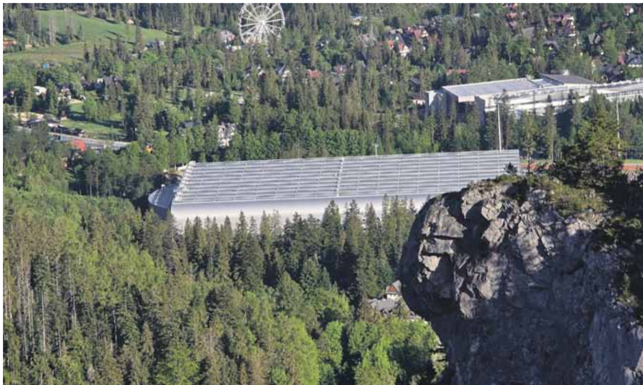
Hala lodowa ma być oddana do użytku w przyszłym roku.

szczegółowy audyt inwestycji. W jego trakcie wykryto liczne problemy techniczne, mimo że obiekt był już zaawansowany w 80–90 procentach.