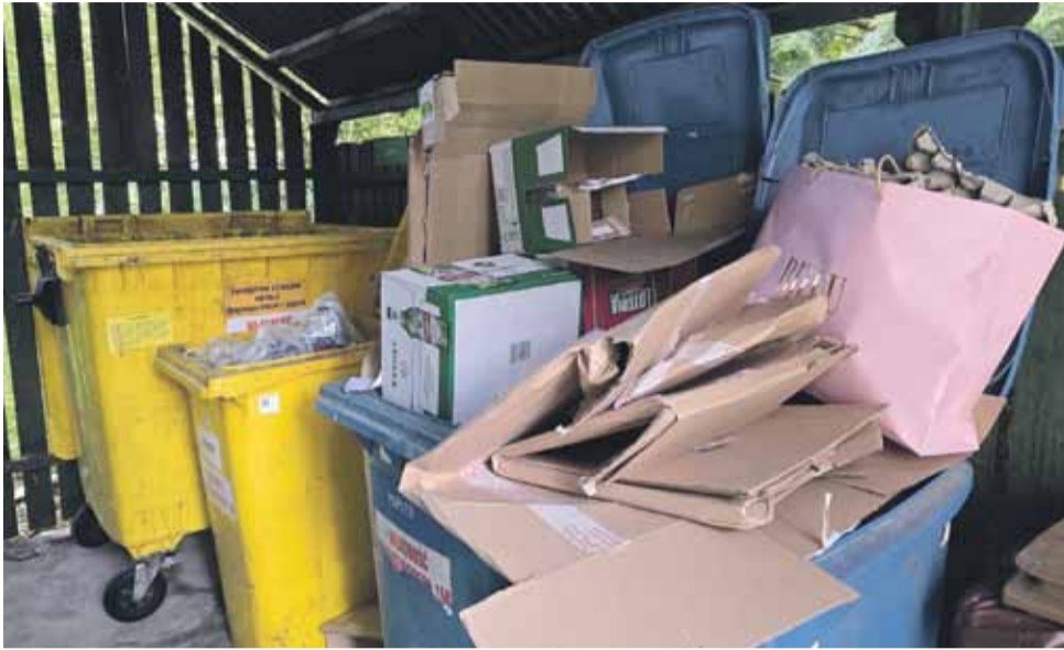
Mieszkańcy bloków zapłacą za śmieci według zużycia wody, a właściciele domów jednorodzinnych nadal według liczby mieszkańców.

system musi się sam finansować i nie może być dopłacany z innych środków, kosztem choćby dróg, edukacji czy kultury – mówił Szwenk.