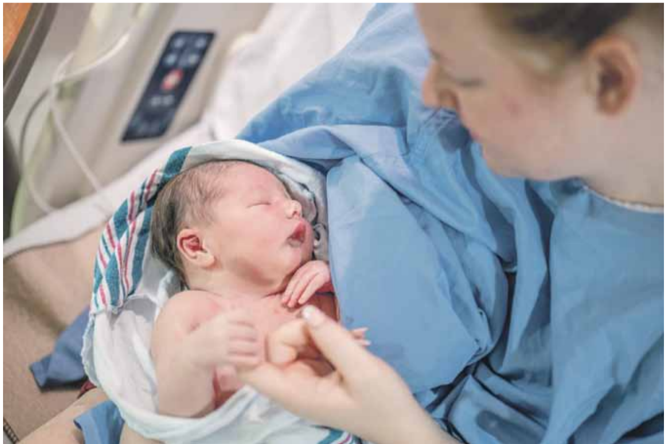
Czy dzieci nadal będą przychodzić na świat w zakopiańskim szpitalu?