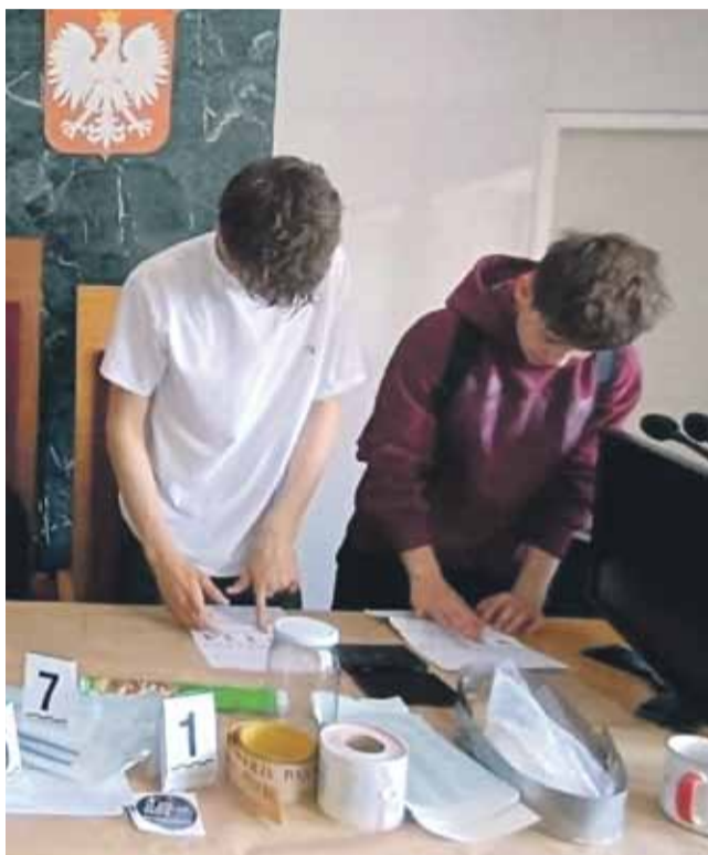
Uczniowie zasiedli w fotelach sędziowskich i odbijali swoje linie papilarne.