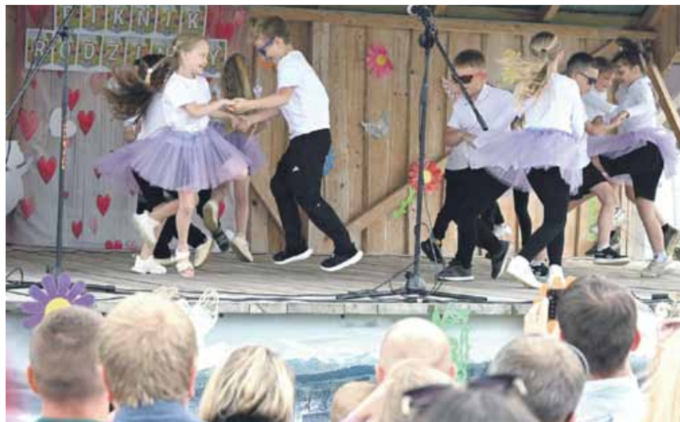
Scena uגינאלa się od tańca pierwszoklasistw z SP Ciche 1.