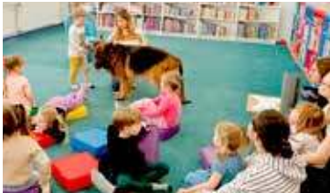
Pies w bibliotece

Sporo się działo w ostatnich dniach w Miejskiej i Powiatowej Bibliotece Publicznej w Goleniowie. Odbyło się pieskove spotkanie oraz warsztatach z glutkami. A już niebawem czekają też atrakcje dla fanów planszówek.