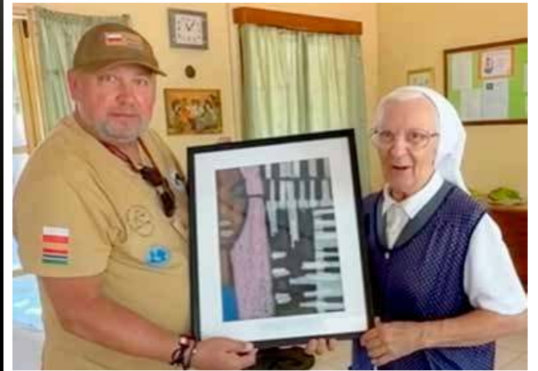
Praca przesłana na Color Art trafiła do Gambii

Już jakiś czas temu poznaliśmy wygranych w Festiwalu Sztuki Pięknej Color Art. Jednak nadesłanych prac jest oczywiście więcej i wiele z nich jest godnych uwagi. Jedna z nich trafiła z Goleniowa do Gambii w Afryce Zachodniej.