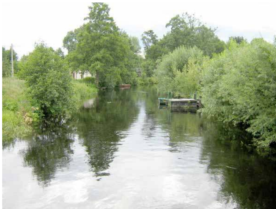
Gowienica jest niezwykle piękna rzeką