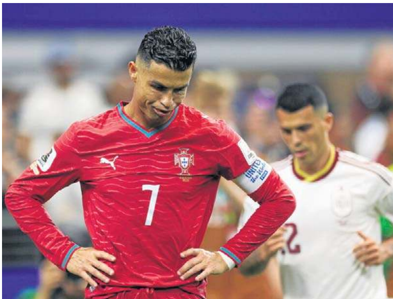
Dwadzieścia lat trwała przygoda Cristiano Ronaldo z mistrzostwami świata. Zmierch okazał się przykry i dla kibiców, i dla niego

Mecz Portugalii z Hiszpanią stał na dość kiepskim poziomie. Żadna z gwiazd nie potrafiła wpłynąć na wynik. Wszystko wskazywało na to, że będziemy świadkami pierwszej dogrywki w tej rundzie. Gdy jednak sędzia techniczny podniósł w górę tablicę z wyświetloną liczbą dodanych minut, wtedy zaskoczył wszystkich Mikel Merino. Zmiennik Daniego Olmo trafił do siatki po koronkowej akcji całej drużyny, która pozostaje jedyną na turnieju bez straconej bramki