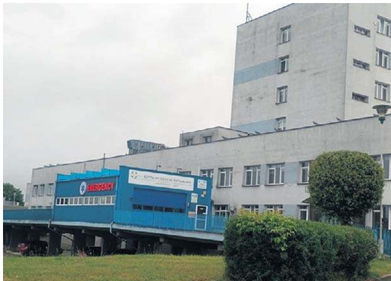
Do incydentu doszło na SOR w Suwałkach. To nie był pierwszy przypadek w regionie ataku na pracowników ochrony zdrowia

Policjanci wyjaśniają wszystkie okoliczności zdarzenia. Postępowa-