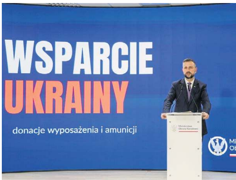
Władysław Kosiniak-Kamysz podczas konferencji prasowej przedstawił szczegóły pomocy wojskowej udzielonej Ukrainie

We wtorkowym wpisie na X Kosiniak-Kamysz napisał, że „otoczenie prezydenta kłamie, twierdząc, że prezydent Nawrocki nie wiedział o sprzeczności przekazywanym Ukrainie”. Szef MON wskazał, że ta sprawa była omawiana na posiedzeniach Komitetu Bezpieczeństwa Rady Ministrów z udziałem przedstawiciela BBN 10 i 17 lutego oraz 24 marca tego roku. Zaznaczył, że informacje otrzymał także szef kancelarii prezydenta Zbigniew Bogucki, a „z samym Karolem Na-