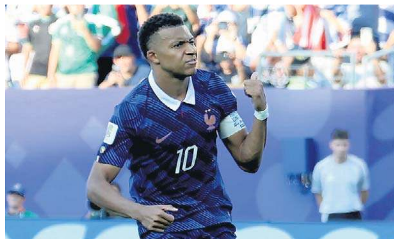
Mbappe odgryzł się senator Paragwaju, nazywając ją „kobietą godną pożalowania, niegodną swojego stanowiska”

Paragwajska polityk zwróciła się do Kyliana z żądaniem o wycofanie swoich oświadczeń: „Wycofaj swoje słowa, uszanuj swoje francuskie obywatelstwo i przeprosź. W przeciwnym razie mogę wnieść pozew o przemoc ze względu na płeć” – napisała Amarilla w liście otwartym do piłkarza.