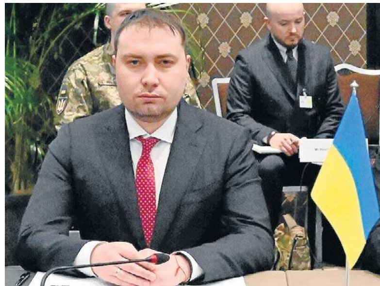
Kyryło Budanow, szef Biura Prezydenta Ukrainy, zabiera głos na temat relacji polsko-ukraińskich

Ukraina nie zamierza podejmować pochopnych decyzji ani błęd-