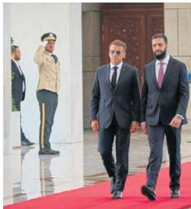
Syrijski prezydent Ahmad al-Szara, podejmuje francuskiego przywódcę w Damaszku