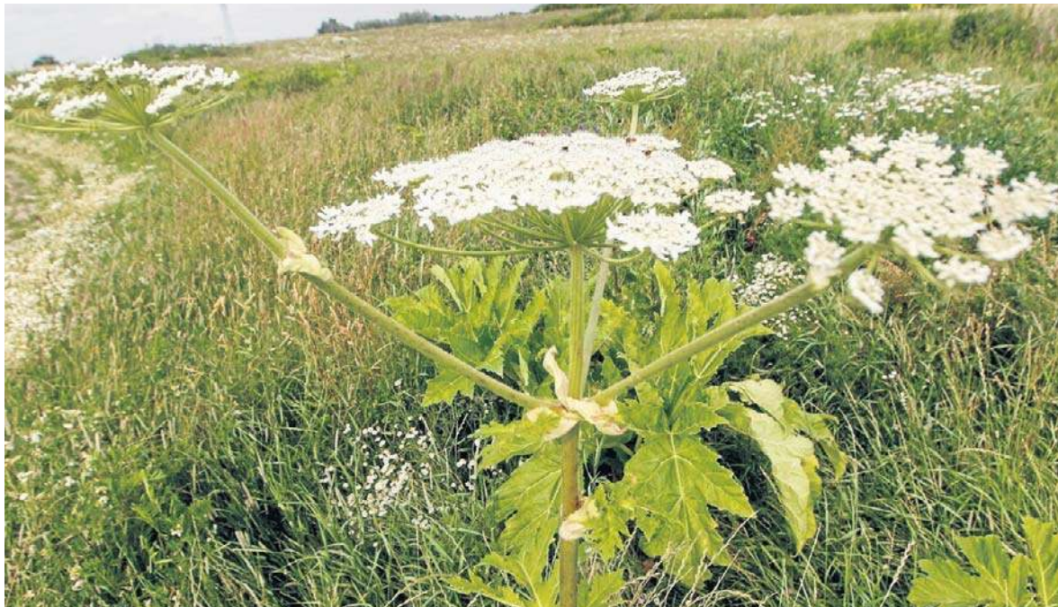
Związki zawarte w barszczu Sosnowskiego stają się żrące pod wpływem promieniowania ultrafioletowego ze światła słonecznego. Mogą wówczas powodować poparzenia chemiczne skóry II i III stopnia

Barszcz Sosnowskiego na pierwszy rzut oka przypomina bardzo duży koper. Jest jednak znacznie większy niż nawet bardzo wyrosnięty osobnik tej rośliny – może bowiem osiągać 4 metry wysokości. Rośliną podobną do barszczu Sosnowskiego jest barszcz Mantegazziego, przy czym obie rośliny to tzw. barszcze kaukaskie. Z perspektywy innej niż badacza