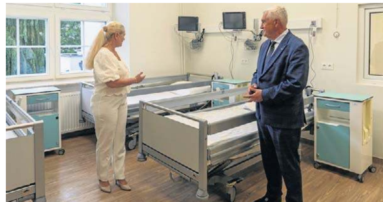
Szpital Miejski im. PCK wzbogacił się m.in. o 9 elektrycznych łóżek

Inwestycja dotyczyła oddziału chorób wewnętrznych o profilu kardiologicznym oraz oddziału chorób wewnętrznych i gastroenterologii. Każdy z nich posiada około 40 łóżek.