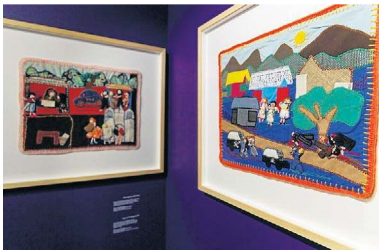
Arpilleras, czyli tekstylne obrazy tworzone przez chilijskie kobiety będzie można oglądać w Muzeum Pamięci Sybiru

Wystawa zestawia doświadczenia chilijskich kobiet z historiami