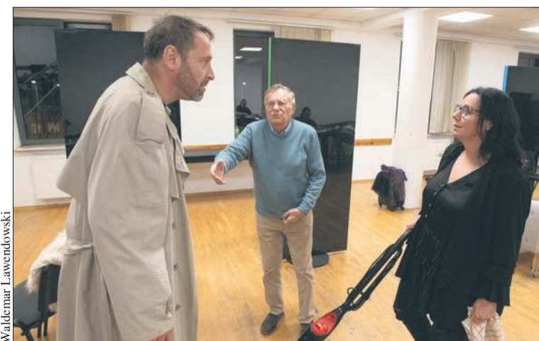
Wernisaż „Apetyt na kolor” w Domu Darmstadt