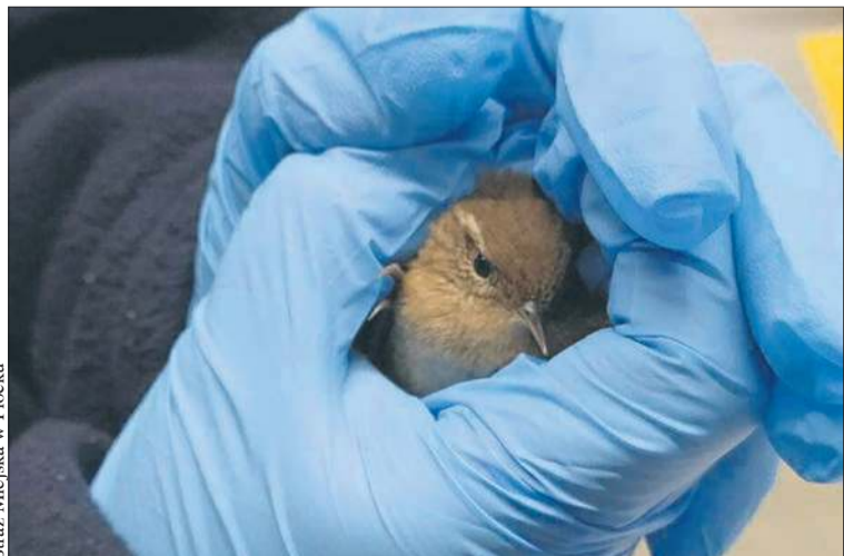
Strzyżyk uratowany w czasie interwencji w markecie w Płocku