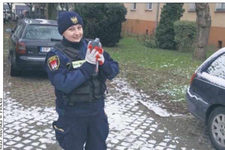
Straż Miejska w Płocku