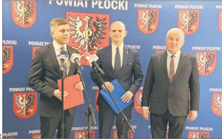
Podczas konferencji prasowej starosta poinformował o inwestycji powiatu w ścieżki rowerowe

Drobin, Gąbin oraz Stara Biała. Wśród zaplanowanych przedsięwzięć znalazły się: