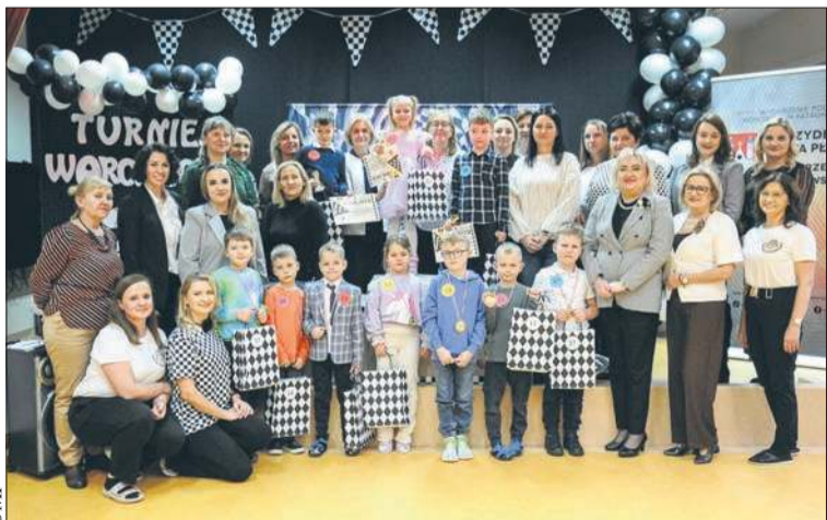
Miejskie Przedszkole nr 13 w Płocku zaprosiło dzieci z plockich przedszkoli do udziału w pierwszej edycji turnieju warcabowego