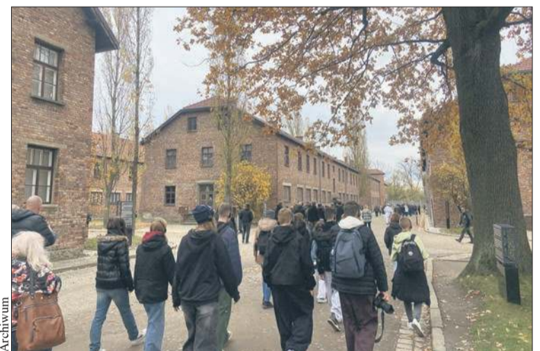
Młodzi gostyninianie podczas polsko-niemieckiego projektu edukacyjnego