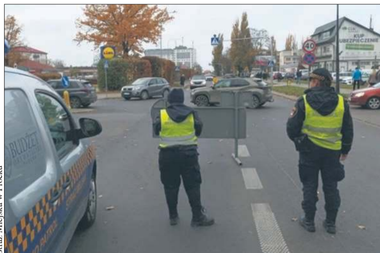
Straż Miejska w Płocku

Kierujący przyjął jednak mandat karny w kwocie 800 zł i 6 punktów karnych za parkowanie na miejscu dla osoby niepełnosprawnej bez uprawnień. Na miejsce wezwano również patrol Policji. Mundurowi uniemożliwili kierowcy dalsze kierowanie pojazdem.