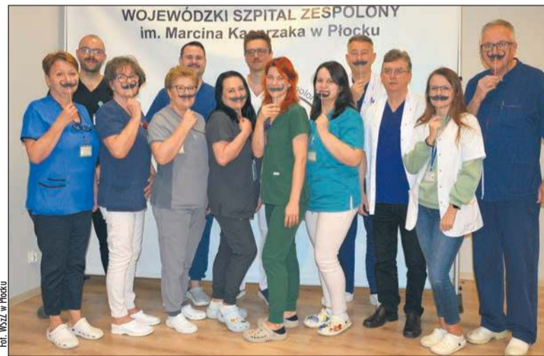
Do wykonywania badań profilaktycznych nie tylko w listopadzie zachęca zespół Klinicznego Oddziału Urologii i Urologii Onkologicznej

rozwinąć się mimo prawidłowego PSA. Dlatego konsultacja urologiczna jest absolutnie konieczna – zaznacza doktor Michalczyk.