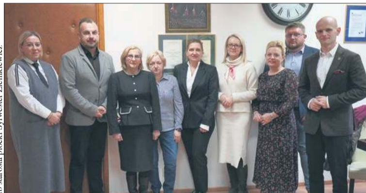
Rozmowy w szerokim gronie przyniosły dobre wiadomości dla pacjentów

Pacjenci z Wyszogrodu, Małej Wsi czy Czerwińska nad Wisłą nie muszą już martwić się o to, gdzie otrzymają pomoc medyczną w porach nocnych czy podczas świąt. Dotychczasowy punkt zlokalizowany w Wyszogrodzie nadal będzie świadczył świadczenia tego typu. Sytuacja była niepokojąca, ale dzięki rozmowom udało się osiągnąć rozwiązanie dobre dla pacjentów i wszystkich zaangażowanych stron.