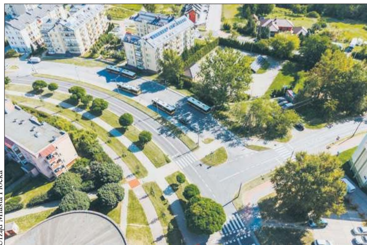
Urząd Miasta Płocka