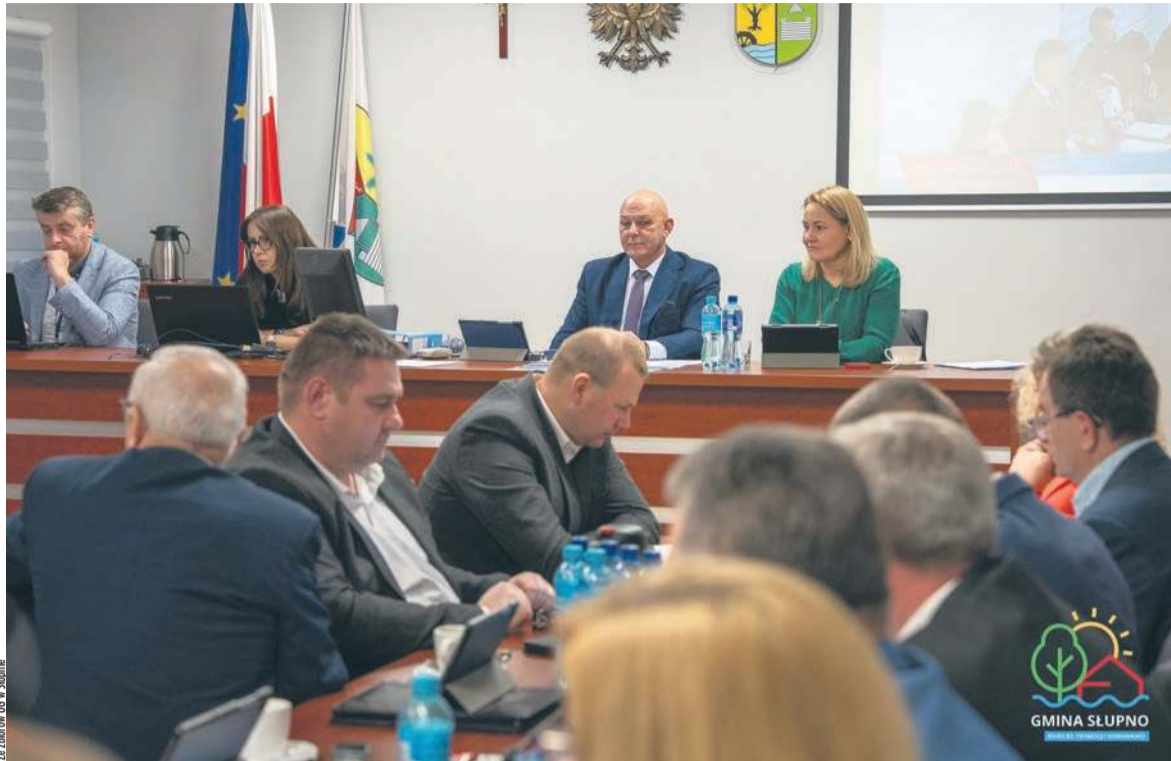
Podczas ostatniej sesji radni podjęli decyzję o utrzymaniu dotychczasowych stawek podatku od środków transportowych