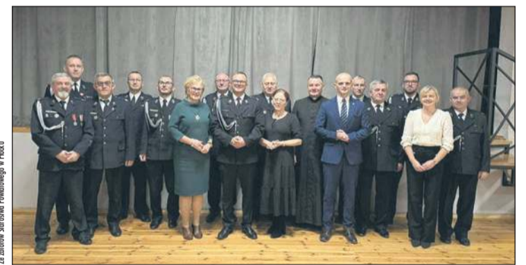
Podczas posiedzenia w Radzanowie rozmawiano m.in. o planach na przyszłość