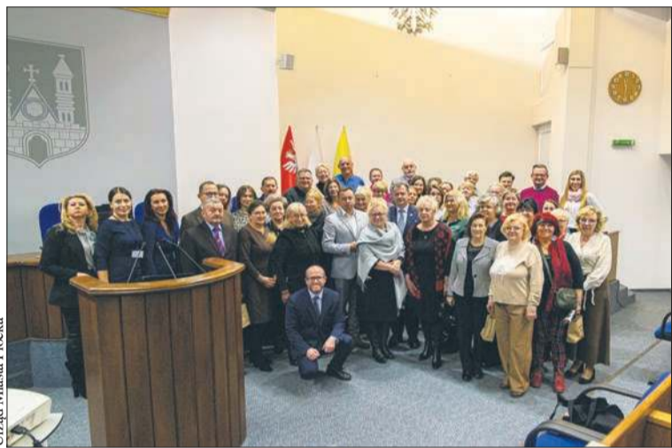
W płockim ratuszu odbyło się spotkanie ławników sądowych

Już w najbliższą niedzielę w SP nr 3 w Płocku