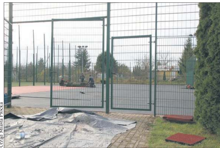
Trwa przebudowa boisk sportowych na Winiarach

Przy ul. Piaska planowana jest budowa boiska wielofunkcyjnego o nawierzchni poliuretanowej z wylapującym piłkę ogrodzeniem o wysokości 6 metrów. Można będzie na nim grać w piłkę ręczną lub koszykówkę. Boisko otoczy bieżnia okrężna, czterotorowa, o długości 200 metrów. Obok niej powstanie jeszcze bieżnia prosta, sześciotorowa, o długości 130 metrów.