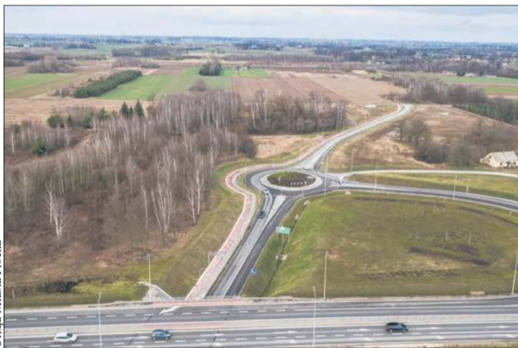
Urząd Miasta Płocka Nowy odcinek ulicy Przemysłowej połączy obwodnicę z ul. Sierpecką

munikacyjny miasta, a także pozwoli na uzbrojenie stu hektarów nowych terenów inwestycyjnych. To budowa nowego odcinka ul. Przemysłowej. Wczoraj otworzyliśmy oferty, które wpłynęły w przetargu i rozpoczynamy ich weryfikację. Zgłoszeń jest 14 i wszystkie mieszczą się w zakładanym przez nas budżecie na tę inwestycję. Szacowany koszt to prawie 53 mi-