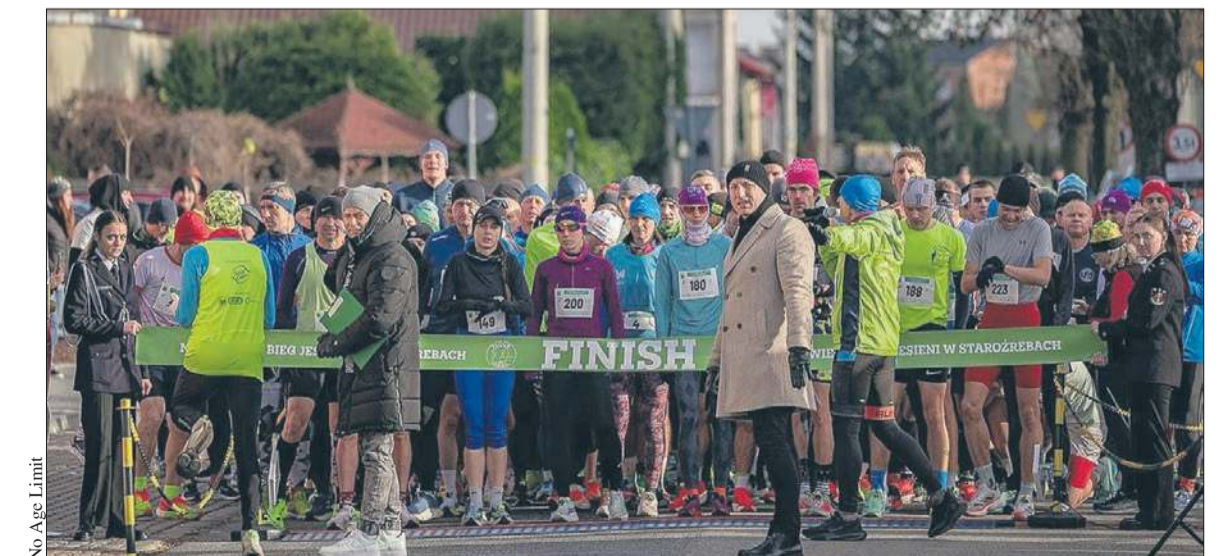
No Age Limit