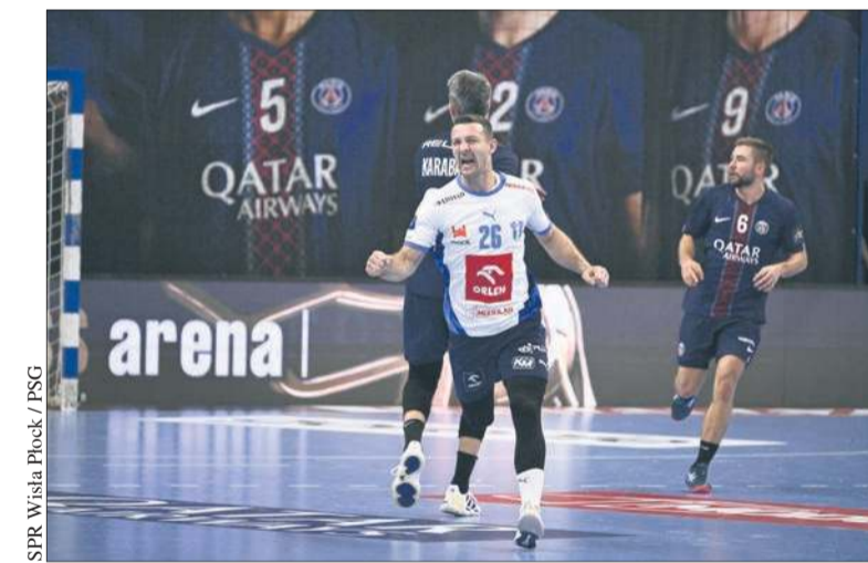
SPR Wisła Płock / PSG

Piłkarze ORLEN Wisły zostali wytrąceni z rytmu, co zauważył Xavi Sabate. Trener poprosił o rozmowę