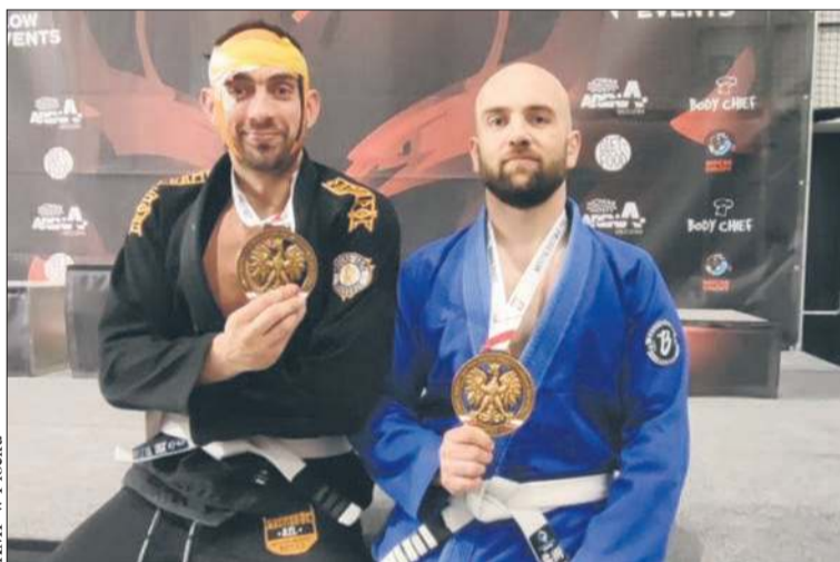
KMP w Płocku