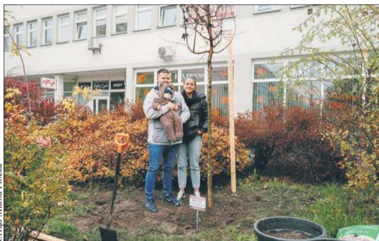
„Drzewa Młodych Płoczan” to program, dzięki któremu przybywa drzew w naszym mieście

Jeden z parków powstaje przy ulicy Lachmana. Nazywany jest linearnym. To od specyficznego kształtu działki, na której jest tworzone. Kiedyś przebiegała tędy bocznicą kolejowa prowadząca do nieistniejącej już jednostki wojskowej.