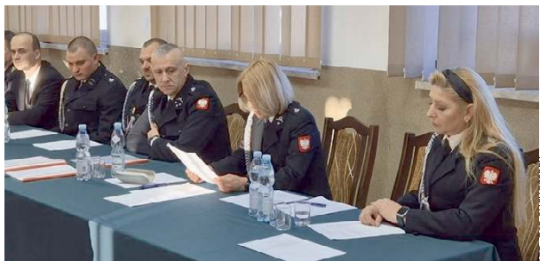
Walne Zebranie Sprawozdawczo-Wyborcze członków OSP.

Podczas spotkań przedstawiono sprawozdania z działal-