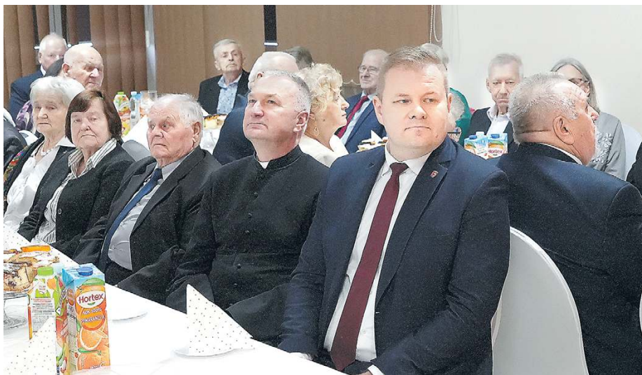
Historie tych małżeństw przypominają, że warto o miłość i relacje dbać każdego dnia.

Najważniejszym momentem uroczystości było wręczenie Medalu za Długoletnie Pożycie Małżeńskie, przyznawanych przez Prezydenta Rzeczypospolitej Polskiej parom obchodzącym Złote Gody, czyli 50-lecie ślubu.