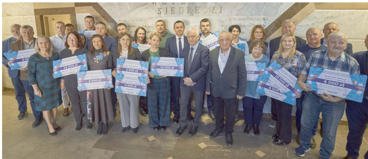
Dzięki wsparciu samorządu lokalne organizacje będą mogły rozwijać swoją działalność.

O dofinansowanie mogły ubiegać się podmioty, które złożyły oferty w otwartym konkursie do 9 stycznia. Największą część środków - około 350 tys. zł - została przeznaczona na