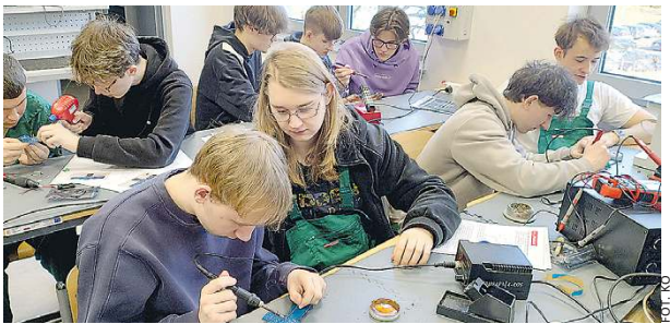
Uczniowie montowali układ na płycie i lutowali.

Uczniowie I Liceum Ogólnokształcącego zbudowali sprzęt, którym posługiwał się polski astronauta. Licealiści z "Prusa" wzięli udział w ogólnopolskim projekcie "Klucz do Kosmosu". To jeden z elementów Ogólnopolskiego Programu Edukacyjnego misji IGNIS (pierwszej polskiej misji na Międzynarodową Stację Kosmiczną), którego twórcą i realizatorem jest Polska Agencja Kosmiczna. Zajęcia odbywały się 9 i 10 marca w Branżowym Centrum Umiejętności nr 1 przy ul. Konarskiego. W warsztatach wzięła udział klasa 3F o profilu matematyczno-informatycznym z I LO, wspierana przez starszych kolegów - uczniów z Zespołu Szkół Ponadpodstawowych nr 1. Młodzież miała za zadanie zbudować klucz telegraficzny - urządzenie, którego użył Sławosz Uznański-Wiśniewski do nadawania sygnałów bezpośrednio ze stacji orbitalnej. Uczniowie dostali zestawy edukacyjne składające się z płytki PCB w kształcie satelity oraz dwóch obwodów - klucza telegraficznego i sygnalizatora dźwięku, który generuje komunikaty alfabetem Morse'a w formie sygnałów świetlnych i audio. Do zestawu dołączono instruktażowy