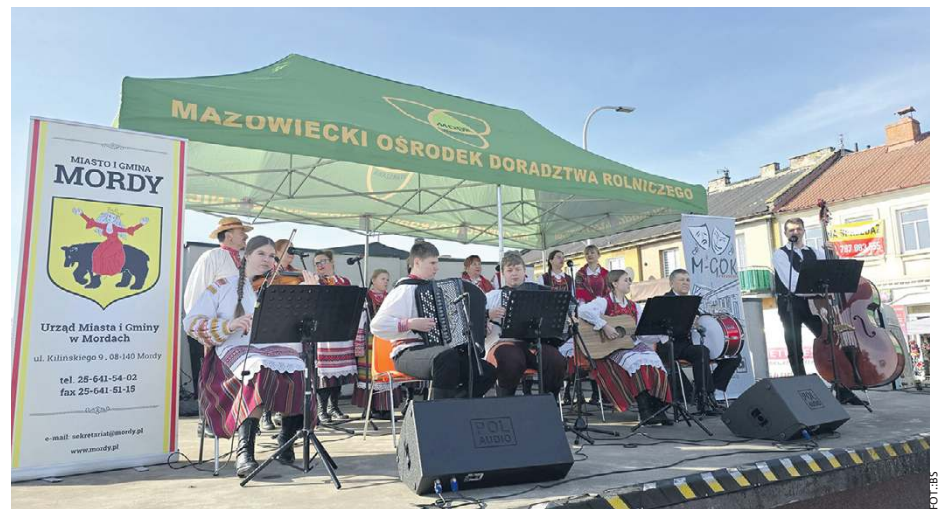
Na scenie prezentowali się nie tylko miejscowi artyści.

Program tegorocznej edycji Jarmarku na rynku w centrum miasta był bogaty. Na straganach królowały wyroby z drewna, włóczki i czapki,