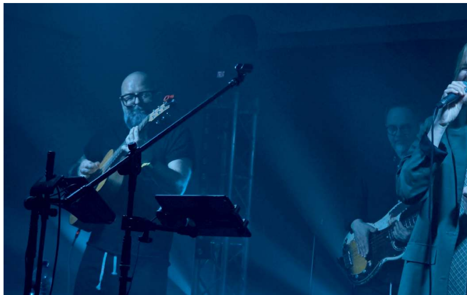
Nie zabrakło poetyckich tekstów, pokazujących świat z kobiecej perspektywy.

Oczywiście podczas koncertu temat kobiet nie dominował. Publiczność z wielkim entuzja-