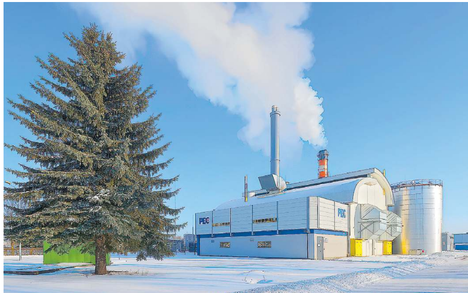
Miniony sezon grzewczy firma kończy bez żadnej awarii na koncie.

Prezes jednak od razu uspokaja: – Po pierwsze, pozostałe miesiące są na podobnym poziomie co rok temu, więc sam styczeń nie zmieni znacząco całorocznego rachunku za ciepło. Oprócz tego trzeba powiedzieć, że nasza cena ciepła spadła w ciągu ostatnich dwóch lat o kilkanaście procent, a biorąc jeszcze pod uwagę inflację, real-