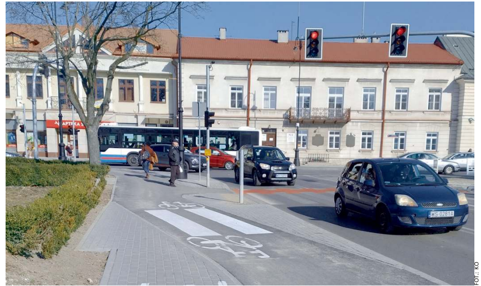
Organizacja ruchu w tym miejscu spotkała się z krytyką.