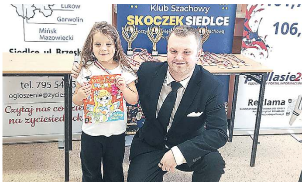
Młodzi zawodnicy wykazali się dużą koncentracją.