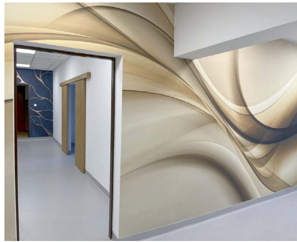
Dofinansowanie wyniosło 523 tys. zł.