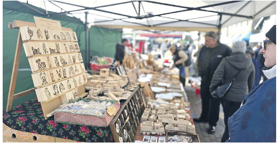
Jarmark cieszy się coraz większą popularnością.