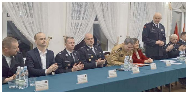
Podczas spotkań przedstawiono sprawozdania z działalności operacyjnej, szkoleniowej i społecznej.

Działalność Ochotniczych Straży Pożarnych to jednak nie tylko akcje ratownicze. Druhowie aktywnie angażują się w ży-