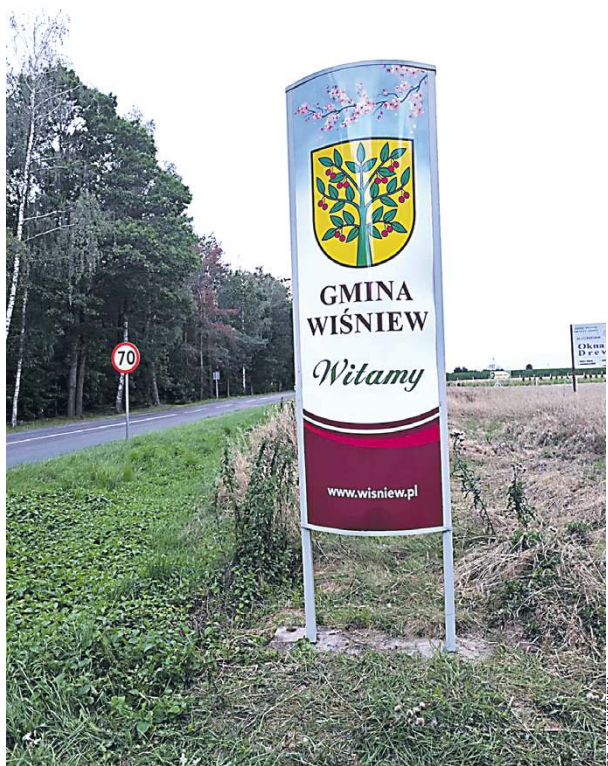
Mieszkańcy mogą zgłaszać uwagi do planu ogólnego gminy.

Plan ogólny to strategiczny dokument, który określa zasady zagospodarowania całej gminy. Decyduje o tym, gdzie mogą powstać nowe inwestycje mieszkaniowe, przemysłowe czy usługowe, jakie tereny przeznaczy się pod ochronę przyrody, a gdzie poprowadzi się nowe drogi. W praktyce wpływa na wartość nieruchomości, możliwości uzyskania pozwoleń na budowę i jakość życia w gminie. - To dokument