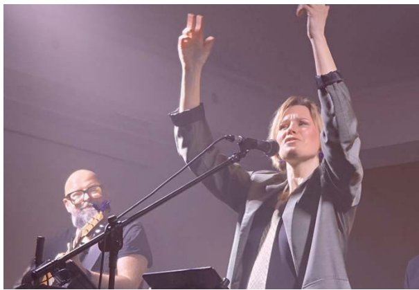
Po drodze, nim doszło do bisów, z ust wokalistki padło pytanie: „Czy lubicie śpiewać?”

Także sama liderka grupy nie ukrywała tego „babskiego” podejścia na niedzielny koncert. Prawie w wstępie oświadczyła, że 8 marca to jeden z najważniejszych dni w roku. A potem dodała, wyraźnie nawiązując do napiętej sytuacji geopolitycznej na świecie, że nasza planeta potrzebowałaby przywództwa kobiet, bo choć