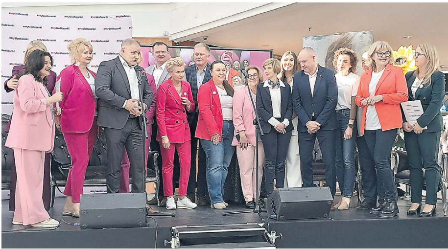
Druuga edycja wydarzenia #MySiedlczanki pokazała, że inicjatywy społeczne mogą skutecznie łączyć mieszkańców miasta.

7 marca w Galerii Siedlce odbyło się wydarzenie #MySiedlczanki „Ona i On – Dzień Kobiet i Mężczyzn 2026”. Spotkanie przyciągnęło wielu mieszkańców miasta i regionu, którzy chętnie skorzystali z przygotowanych atrakcji, badań profilaktycznych oraz paneli tematycznych poświęconych zdrowiu, aktywności i rozwojowi.