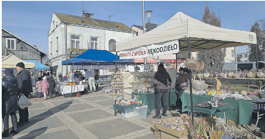
Nie brakowało wystawców i klientów.