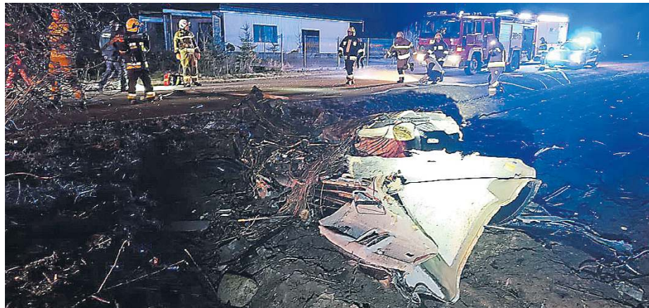
Kierujący wypadł z pojazdu i poniósł śmierć na miejscu.