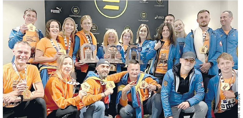
Biegacze z Ruchu Zbuckiego wrócili z Malty.

Bieganie, które łączy ludzi Zbucki Ruch to jednak nie