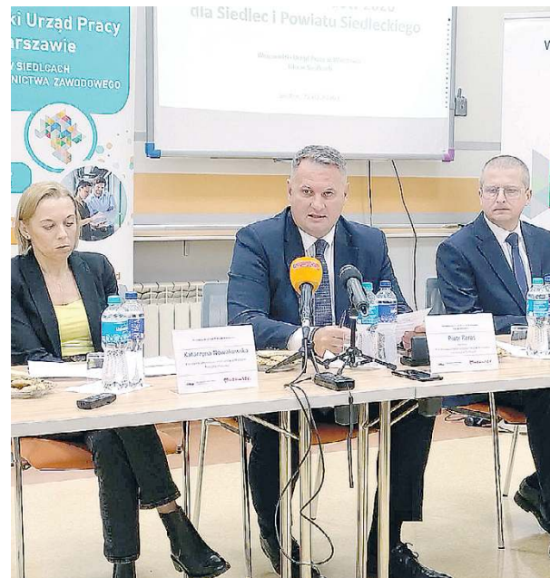
W Siedlcach bezrobocie spadło do 4,6%.

Podregion siedlecki mierzy się z problemami demograficznymi. - Co piąty mieszkaniec podregionu (20,1%) ma ponad 65 lat - wylicza dyrektor siedleckiej filii WUP. Jak zauważa, starzenie się społeczeństwa oraz odpływ młodych osób powodu-