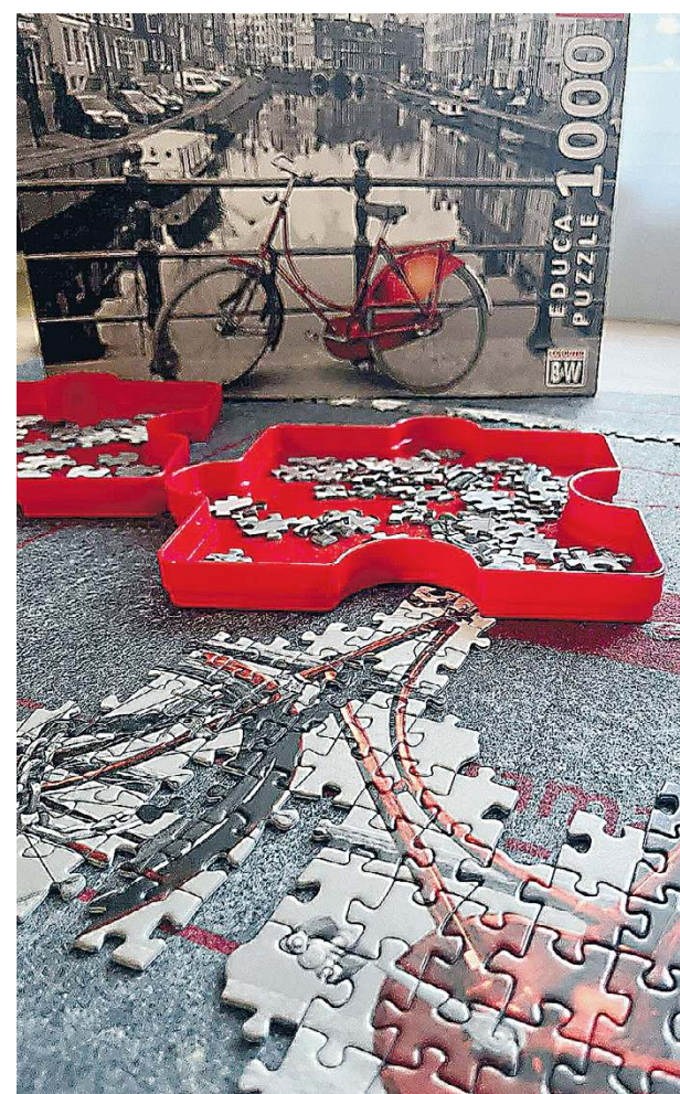
Doradztwo restrukturyzacyjne jest jak wkładanie puzzli we właściwe miejsca.

CUBE KSIĘGOWOŚĆ – DORADZTWO – RESTRUKTURYZACJA TEL.: 608 585 266 E-MAIL: M.JASTRZEBSKA@CUBEMJ.CONSULTING