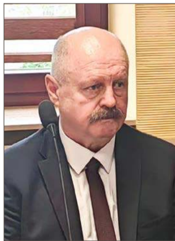
Radny w obradach komisji udziału nie wziął, choć się zalogował.

Ale na sali, przez większą część posiedzenia, trudno było wy-