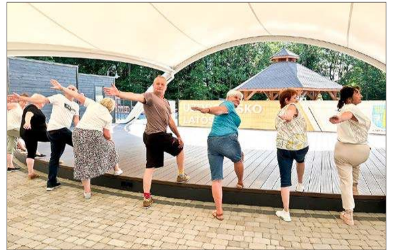
W Latoszynie-Zdroju realizowane są programy dla seniorów.