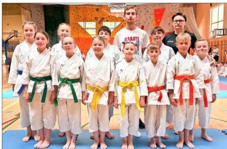
Karatecy DAKT Dębica w stolicy spisali się na medal, a raczej 15 medali.