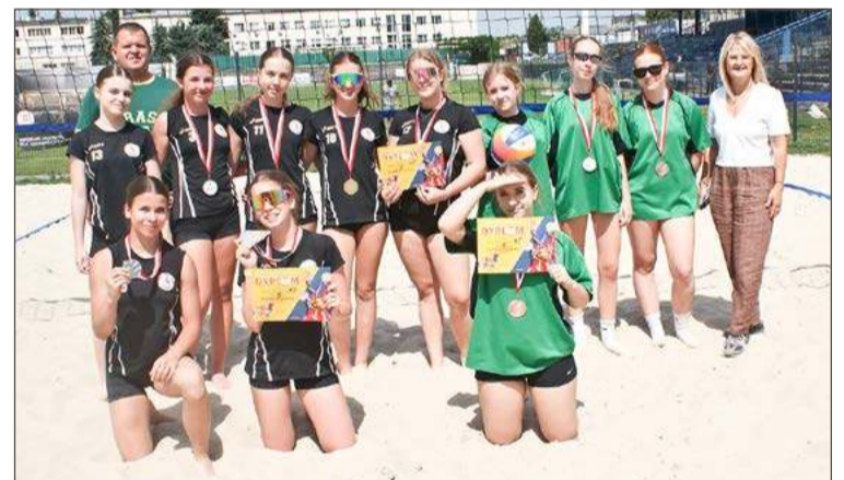
Medalistki siatkówki plażowej w komplecie.