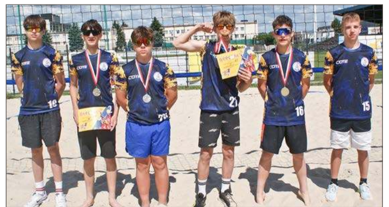
Chłopcy z Piątki i nie chcieli być gorsi od swoich kolegów.