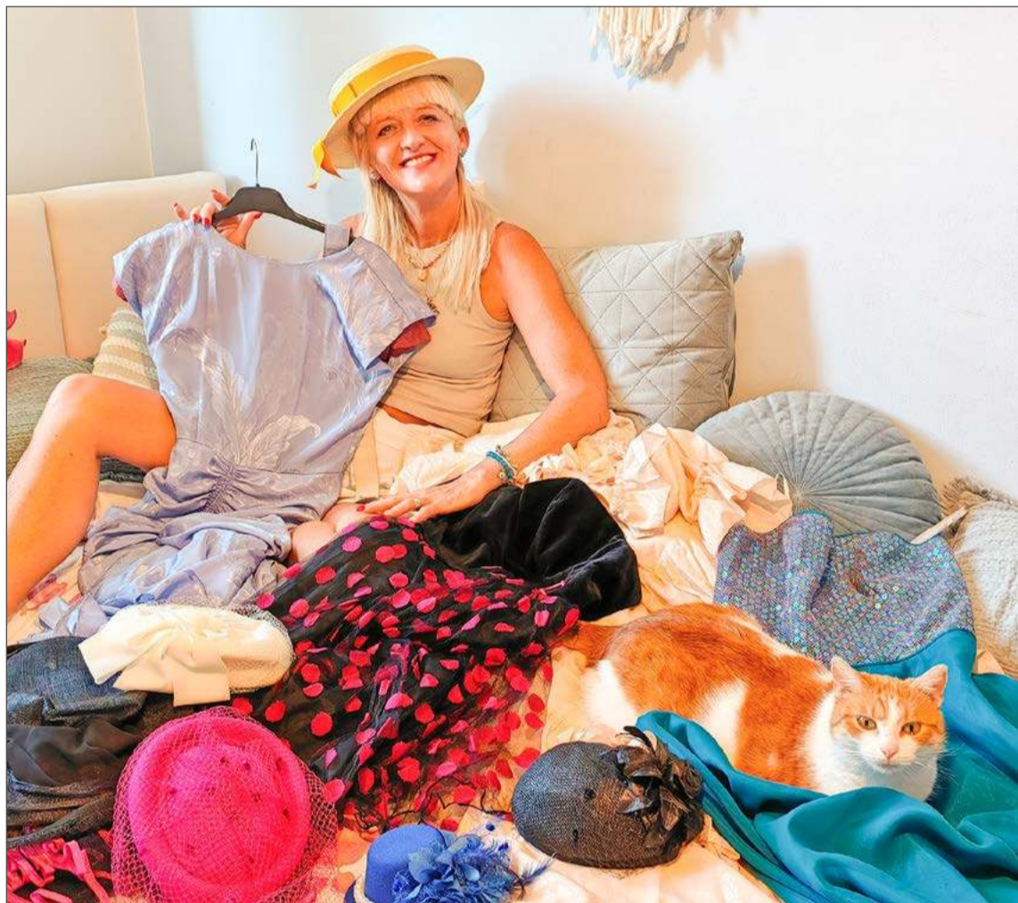
Jej szafa to garderoba pełna kreacji dodatków do wykorzystania na scenie.

- Zadzwoił do mnie ten przeżyły człowiek i mówi: jest rola do zagrania. W barze. Zwłoki - opowiada ze śmiechem Cobra.