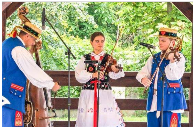
Iskierczanie w swojej kategorii okazali się najlepsi.