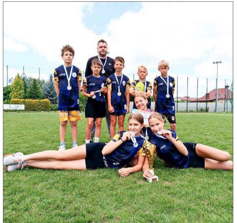
W rugby tag rywalizują drużyny mieszane. Na zdjęciu nasi wicemistrzowie.