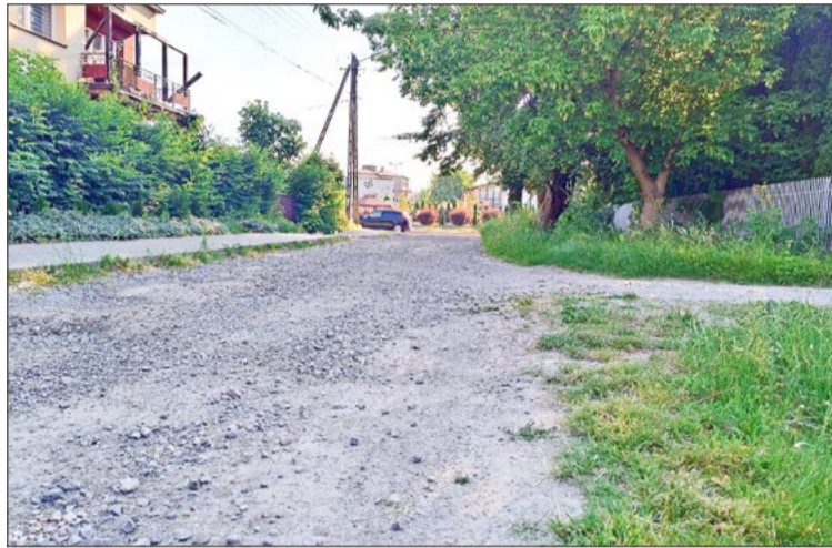
Ul. Osiedlowa łączy ul. Szkolną z Piłsudskiego.

Wielu już wtedy miało nadzieję, że kiedy tylko zrobi się ciepło nie będzie trzeba tam jeździć po dziurach. Tymczasem wiosna minęła, zaczęło się lato, a Osiedlowa wygląda jak wyglądała. Dlaczego?