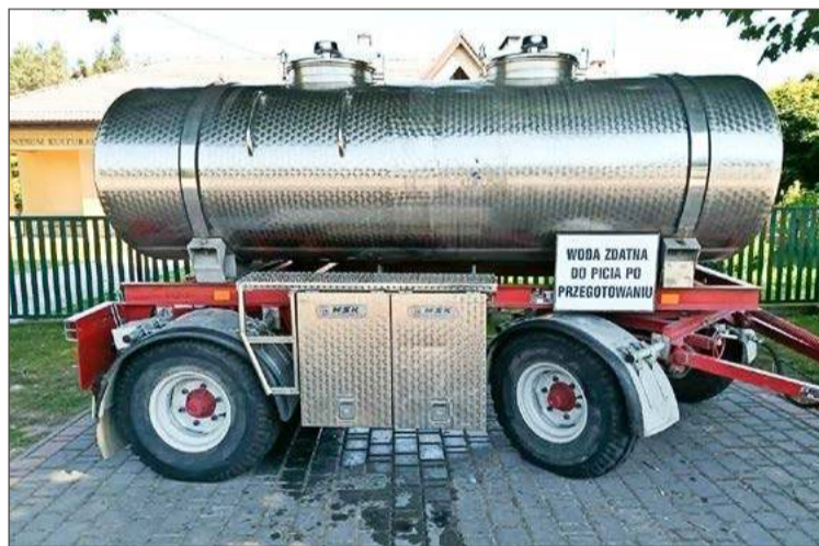
Beczki w Chotowej staną w sobotę po dziesiątej rano.

Niestety, po jego włączeniu w piątek okazało się, że następnego dnia