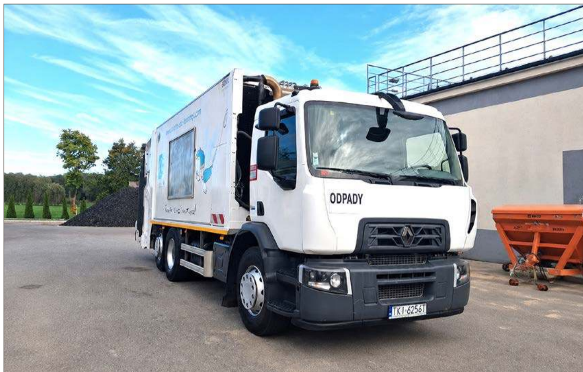
Odpady z gminy Jodłowa, ale i te z Brzostku przez rok zagospodarowywane będą za te same pieniądze.

Jednak najważniejszą informacją z punktu widzenia mieszkańców jest ta, że cena za gospodarowanie odpadami w pierwszym roku obowiązywania porozumienia nie ulegnie zmianie. I tu dobre wiadomości się kończą. Bo w drugim roku obowiązywania będzie negocjowana z gminą Dębica i może się okazać, że dojdzie do podwyżek opłat.