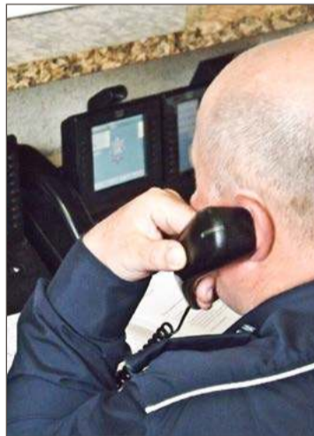
O kradzieży kurier zawiadomił dyżurnego KPP w Dębicy.

Na podstawie rysopisu, udało się ustalić mężczyznę, który wsiadł za kierownicę samochodu. Został zatrzymany w pobliżu parku Skarbek-Borowskiego, niedaleko policjanci trafili na samochód firmy kurierskiej. Kluczyki do niego