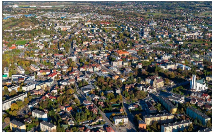
Miasto podzielone zostanie na strefy. Plan jest praktycznie gotowy.

- W trakcie konsultacji otrzymaliśmy kolejne 120 wniosków - mówi wiceburmistrz Dębicy, dodając,