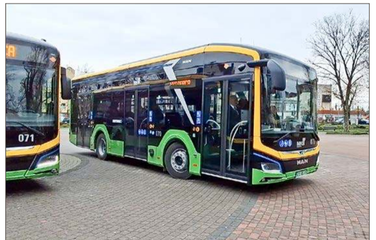
Delegację czeka przejażdżka takim właśnie elektrycznym MANem.

Jeśli wszystko pójdzie zgodnie z planem, to konferencja powinna zakończyć się około godz. 16:00.