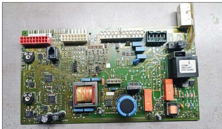
Prawie jak makieta miasta.