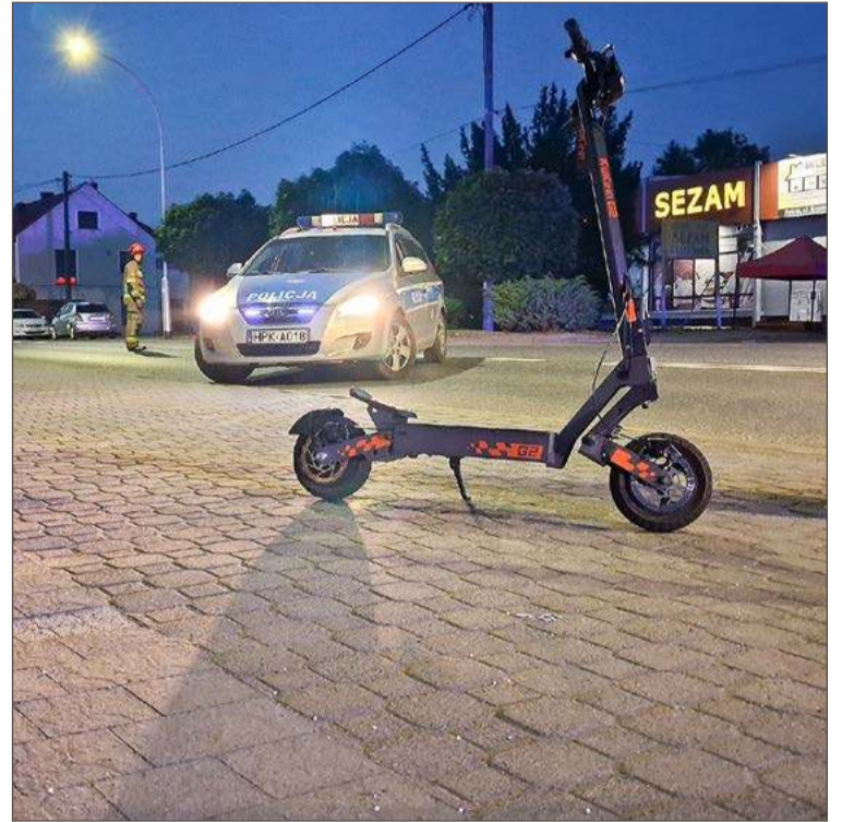
Nastolatka nie miała na głowie kasku ochronnego.