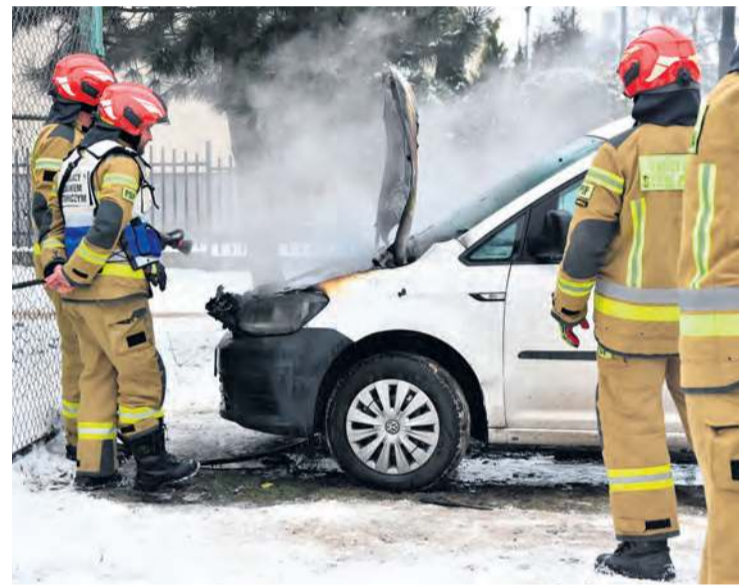
Strażacy podali jeden prąd wody w natarciu na palącą się komorę silnika.

Czynnościami lokalnych służb na ul. Kościuszki w Tucholi przyglądaliśmy się w środowy (7 stycznia) poranek. Jaką przypuszczalną przyczynę pożaru samochodu wskazują przedstawiciele mundurowych?