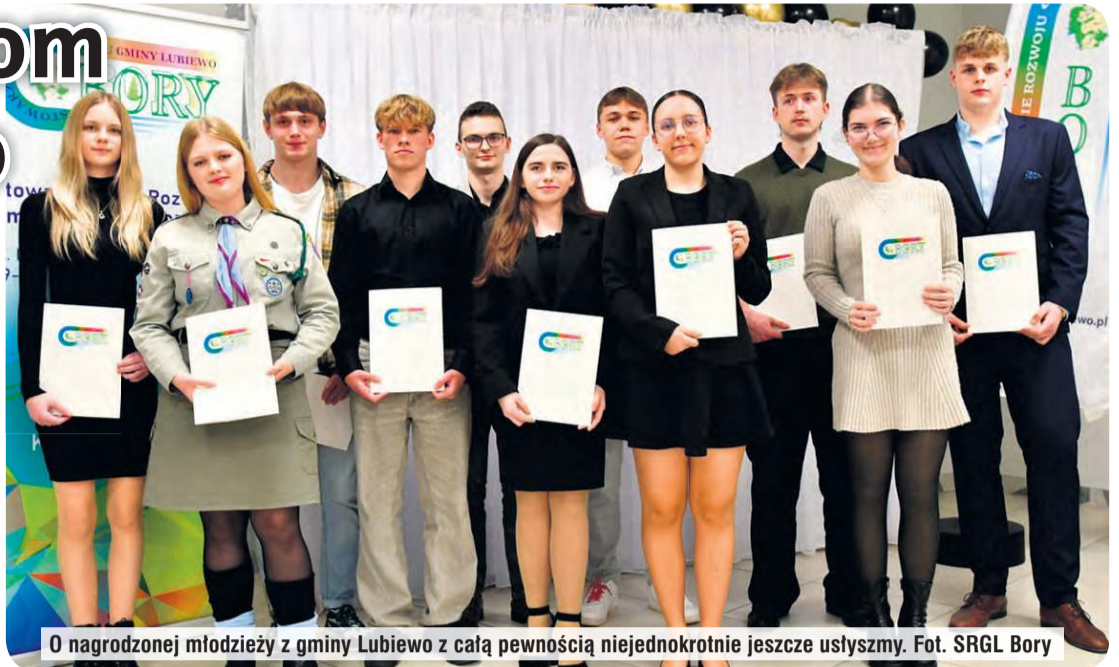
O nagrodzonej młodzieży z gminy Lubiewo z całą pewnością niejednokrotnie jeszcze usłyszymy.