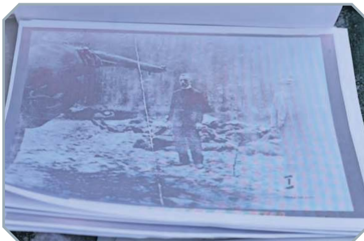
Realizatorzy filmu zapoznają się z aktami prokuratorskimi i przesłuchaniami świadków wydarzeń w Tucholi i Rudzkim Moście z początku II wojny światowej. Między innymi na ich podstawie tworzą scenariusz filmu.