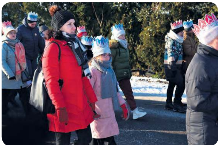
Uczestnicy wydarzenia chętnie zakładali kolorowe korony, a w trakcie przemarszu śpiewali kolędy.