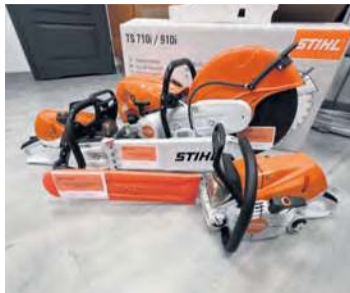
Pilarki otrzymały jednostki OSP.

Dużo mówi się o tym, że w trwającym już 2026 roku ma być ponowna okazja