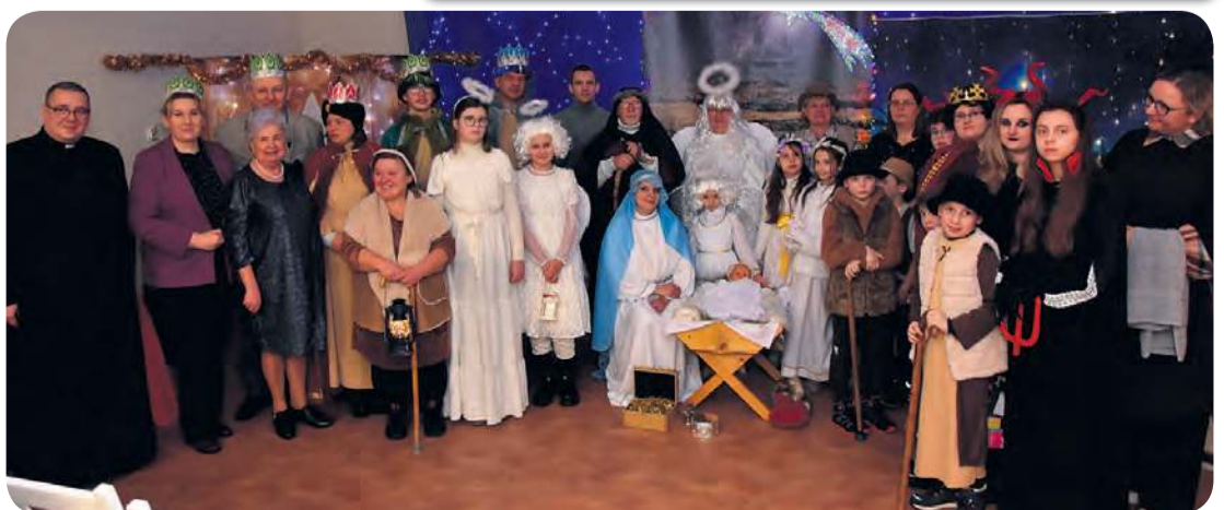
Orszak i jasełka to wydarzenia, które gromadzą mieszkańców i wzmacniają więzi.