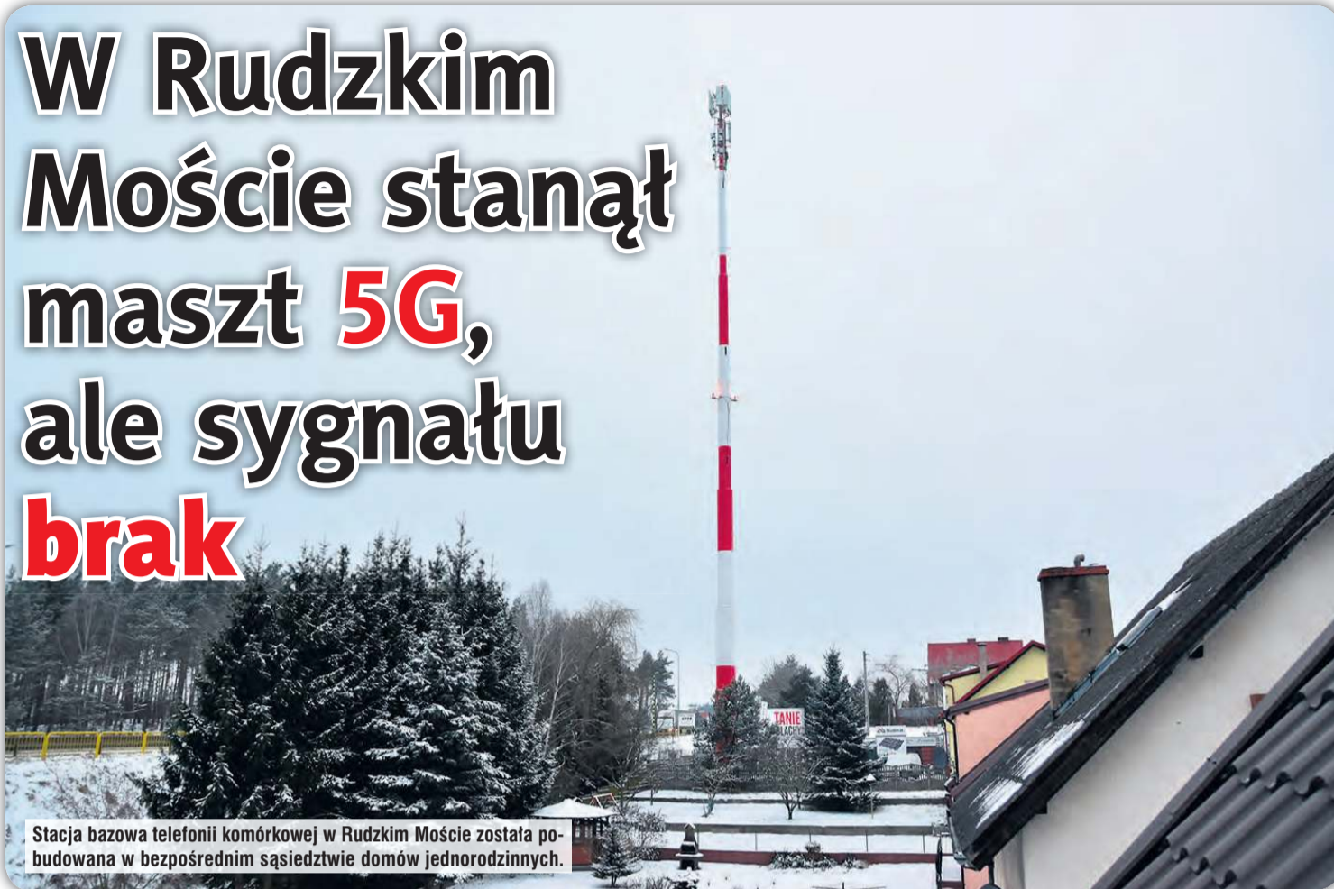
Stacja bazowa telefonii komórkowej w Rudzkim Moście została pobudowana w bezpośrednim sąsiedztwie domów jednorodzinnych.

Po półtora roku od publikacji naszego pierwszego artykułu – na temat planów budowy stacji bazowej telefonii komórkowej na osiedlu Rudzki Most w Tucholi – inwestycja doczekała się realizacji. Nadal jednak budzi skrajne emocje wśród mieszkańców. Jedni czekają na poprawę zasięgu, inni sprzeciwiają się inwestycji i oczekują rozstrzygnięcia skarg w WSA i NSA.