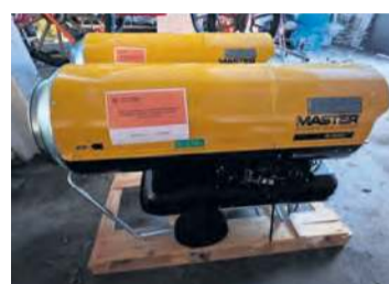
Wśród zakupionych przedmiotów znalazły się nagrzewnice.