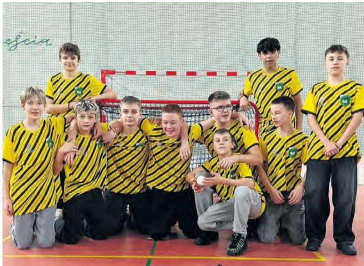
Mistrzowie województwa kujawsko-pomorskiego w unihokeju – uczniowie z Lubiewa.

Było to dość kameralne wydarzenie, ponieważ w ścisłym, kujawsko-pomorskim finale zaprezentowały się cztery szkoły z naszego województwa. Chłopcy z Lubiewa wygrali