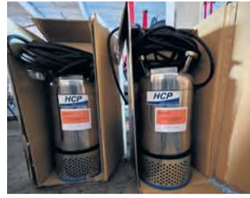
Pompy do zanieczyszczonej wody wydają się być bardzo dobrym zakupem.

– Tym razem chcielibyśmy pójść w projektowanie magazynu obronności cywilnej i stwo-