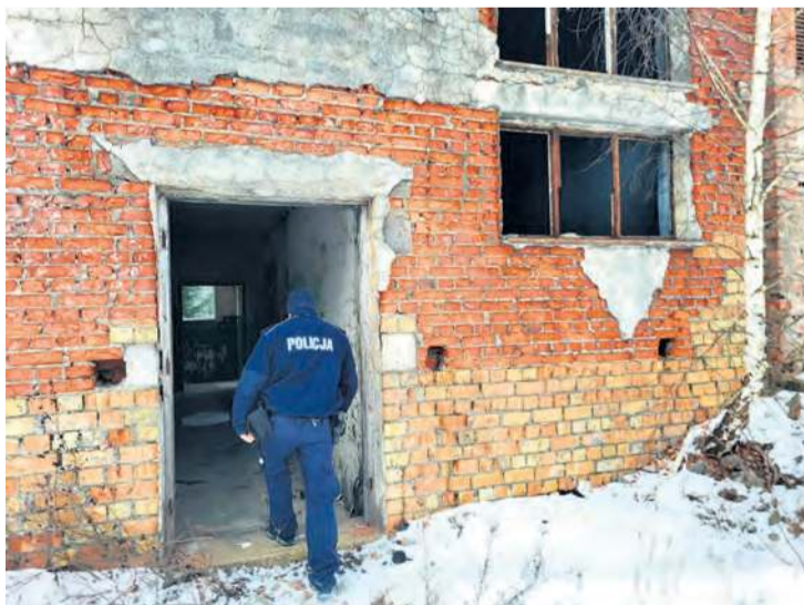
W ramach prowadzonych działań policjanci sprawdzają m.in. pustostany.

– Mundurowi każdego roku monitorują sytuację tych osób oraz sami oferują pomoc każdemu, kto jej potrzebuje. Funkcjonariusze oraz pracownicy socjalni, odnajdując takie osoby, zawsze proponują przewiezienie ich do ośrodków, w których jest ciepło, gdzie mogą zjeść ciepły