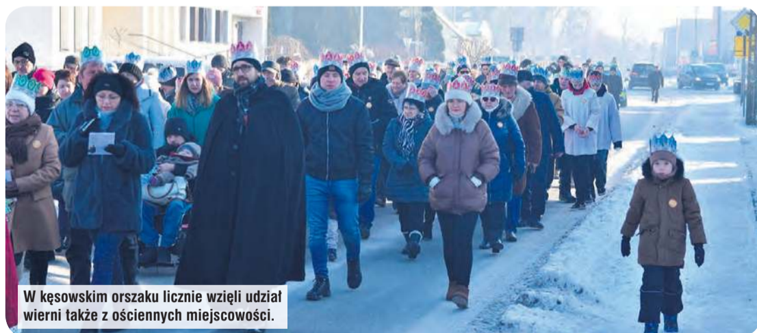
W kęsowskim orszaku licznie wzięli udział wierni także z ościennych miejscowości.