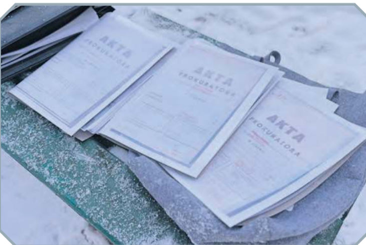
Realizatorzy filmu zapoznają się z aktami prokuratorskimi i przesłuchaniami świadków wydarzeń w Tucholi i Rudzkim Moście z początku II wojny światowej. Między innymi na ich podstawie tworzą scenariusz filmu.