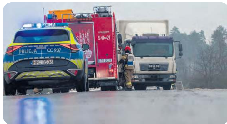
Obłędzenie drogi Tuchola – Czersk, godziny przedpołudniowe, 14 stycznia.

Generalnie jednak tego poranka kierowcy poruszali się po naszych drogach z wielką ostrożnością. Mniej więcej