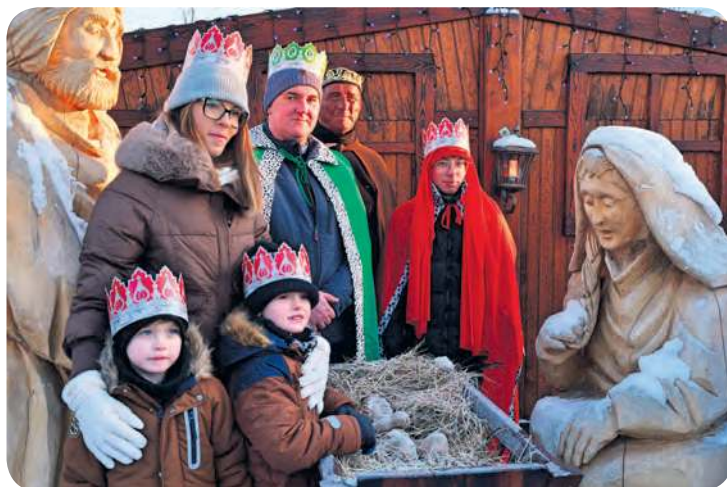
Sesja zdjęciowa z trzema królami? W XXI wieku to możliwe.

Miejszem docelowym miała być stajenka znajdująca się na placu księdza Nagórskiego. Tam dotarło już wspólnie Trzech Króli z potężną proce-