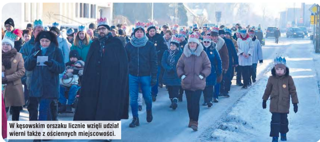
W kęsowskim orszaku licznie wzięli udział wierni także z ościennych miejscowości.