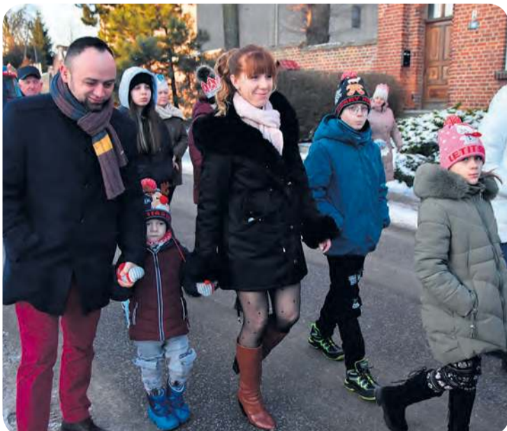
Wydarzenie cieszyło się zainteresowaniem całych rodzin.

Orszak ulicami Bysławka przeszedł do świetlicy wiejskiej. Na jego czele szli... dwaj królowie i królowa, anioły, nawet zwierzęta – alpaki. Wszystko przy akompaniamencie Orkiestry Dętej Ochotniczej Straży Pożarnej w Bysławiu. W świetlicy mieszkańcy Bysławka zagrali w jaseł-