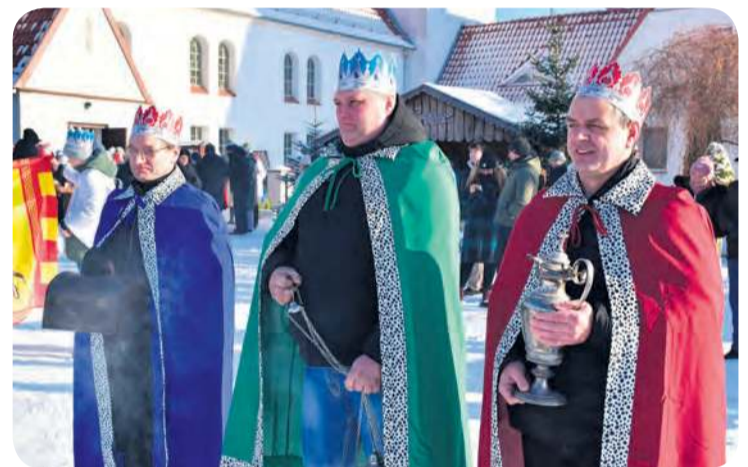
W postaci Mędrców ze Wschodu wcielili się członkowie KGW „Bractwo Mężczyzn”.

Przy źłóbku wierni wraz z Trzema Królami oddali pokłon Nowonarodzonemu, a monarchowie złożyli symboliczne dary: