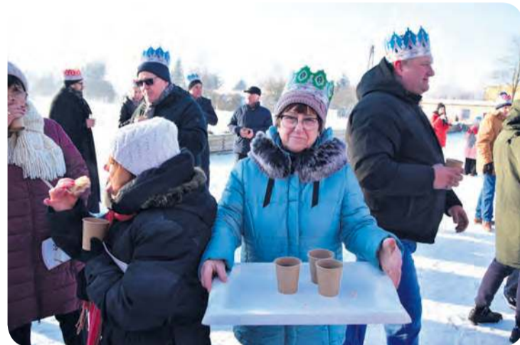
Po orszaku panie z KGW w Kęsowie częstowały świąteczną herbatą.

Formowanie orszaku miało miejsce na placu przed Kościołem pw. św. Bernarda po mszy