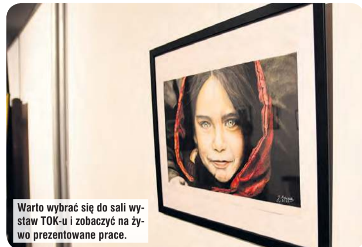
Warto wybrać się do sali wystaw TOK-u i zobaczyć na żywo prezentowane prace.

– Konie fascynowały mnie od dziecka. Miałem też mały