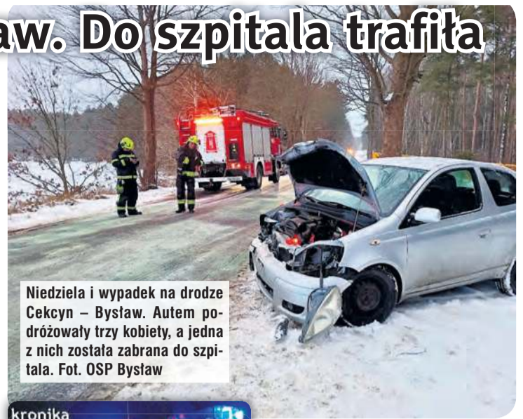
Niedziela i wypadek na drodze Cekcyn – Bysław. Autem podróżowały trzy kobiety, a jedna z nich została zabrana do szpitala.