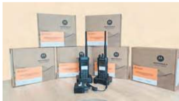
Dzięki pozyskanym środkom z Kujawsko-Pomorskiego Urzędu Wojewódzkiego w Bydgoszczy gmina Lubiewo zrealizowała zakupy za 444.817,14 zł.

do otrzymania dodatkowej kasy z zakresu ochrony ludności i obrony cywilnej. Dopytujemy stojącą na czele gminy Lubiewo, na co mogłoby trafić kolejne dofinansowanie.