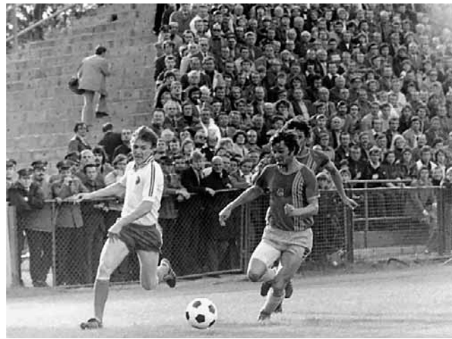
Zbigniew Boniek (z lewej) brylował w Widzewie Łódź, który odnosił wtedy sukcesy także na arenie międzynarodowej