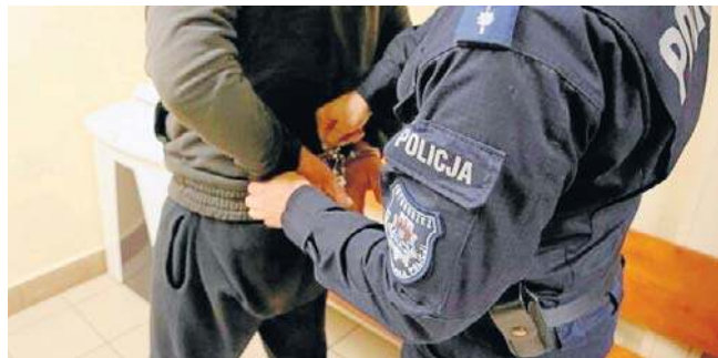
Zarzut dotyczący ugodzenia nożem to niejedyny problem, jaki ma zatrzymany 18-latek. Odpowie też za posiadanie narkotyków

- Z uwagi na grożącą podejrzanemu surową karę oraz wynikającą z jego postawy obawę matactwa procesowego, prokurator zawniósł do sądu o zastosowanie izolacyjnego środka zapobiegawczego w celu zabezpieczenia prawidłowego toku postępowania. Wniosek ten został przez sąd uwzględniony - informuje prok. Agnieszka Adamska-Okońska, rzeczniczka prasowa Prokuratury Okręgowej w Bydgoszczy. ©