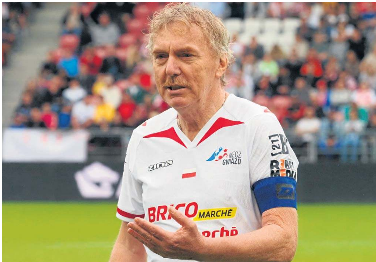
W czerwcu 2025 Boniek zagrał w charytatywnym meczu gwiazd Polska – Francja. Na boisko wybiegł z opaską kapitańską