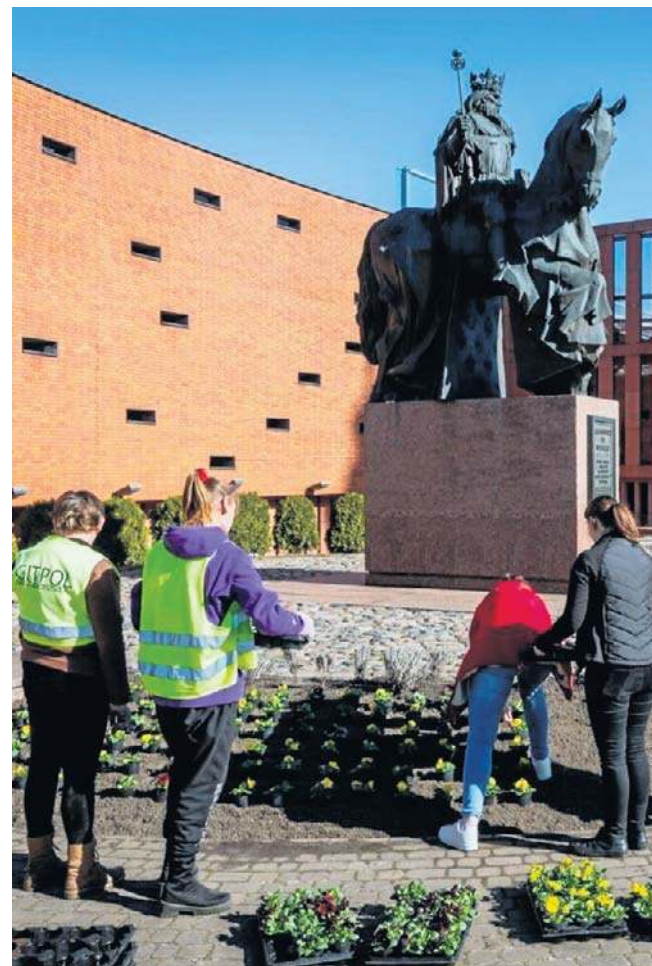
Między innymi z okazji imienin (4 marca - Kazimierza) wypucowano pomnik władcy, naprawiono ławki w pobliżu i posadzono bratki na rabatach; wszystko to stosownie do królewskiej godności...