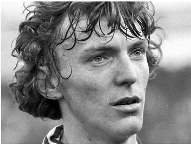
Zbigniew Boniek karierę zaczynał w Zawiszy Bydgoszcz, ale wkrótce trafił do Widzewa Łódź