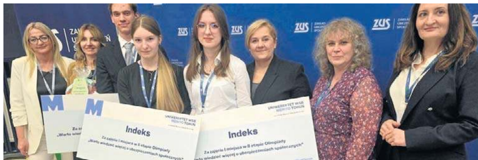
Uczniowie Zespołu Szkół Elektronicznych im. Wojska Polskiego w Bydgoszczy mają powody do dumy. Wystąpią w ogólnopolskim finale Olimpiady ZUS

W dogrywce zmierzyły się drużyny: Zespołu Szkół Elektronicznych im. Wojska Pol-