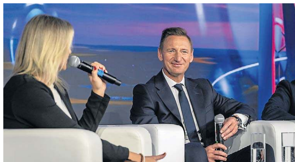
Olgię Geblewicz, marszałek województwa zachodniopomorskiego, wziął udział w panelu dyskusyjnym z marszałkami województw lubuskiego i wielkopolskiego