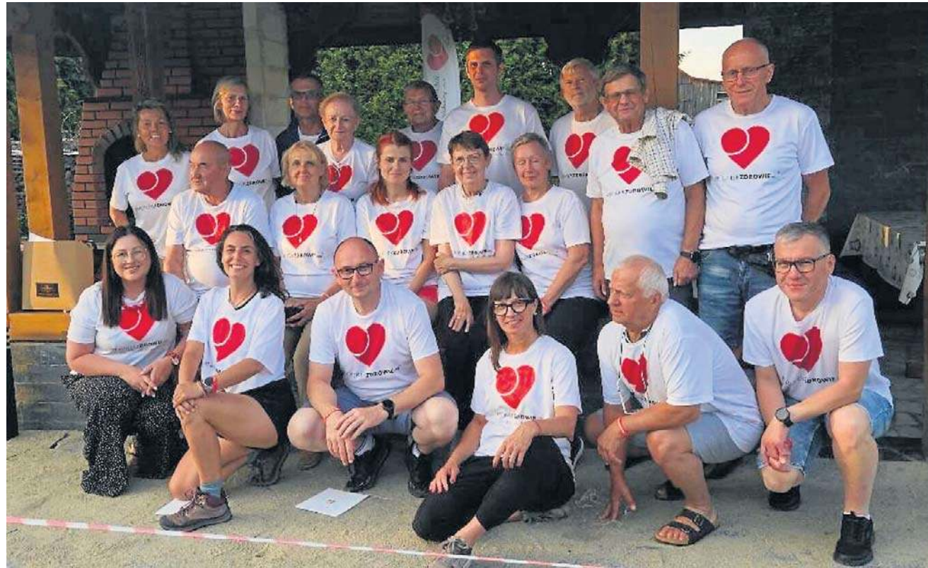
Stowarzyszenia Kierunek Zdrowie od ponad 20 lat wspiera pacjentów hematologicznych

Regularna aktywność pomaga poprawić wydolność organizmu i ograniczyć nega-