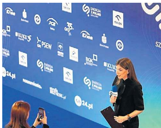
Forum relacjonowali dziennikarze „Głosu Szczecińskiego” i Strefy Biznesu

Relacja z Forum w serwisach: strefabiznesu.pl oraz gs24.pl