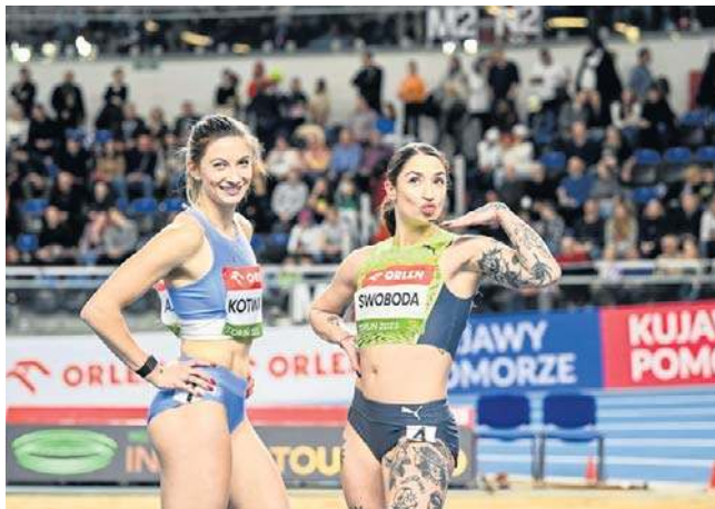
„Copernicus Cup” w Toruniu

ści, której trudno sobie odmówić, ale z każdym łykiem małej czarnej zastanawiam się, dlaczego u nas, myślę nie tylko o Bydgoszczy, kawa musi kosztować dwa razy więcej niż w krajach przeciwieństwa wcióż Zachodu. Łyknąłem już jak przysłowiowy pelikan fakt astronomicznych cen wina w naszych lokalach, gdzie restauratorzy operują kilkusetprocentową marżą za butelkę napoju, którego smak przypomina jakość trunków leżakujących na słońcu w egipskich hotelach w ramach programu „all inclusive” z zabawnym dodat-