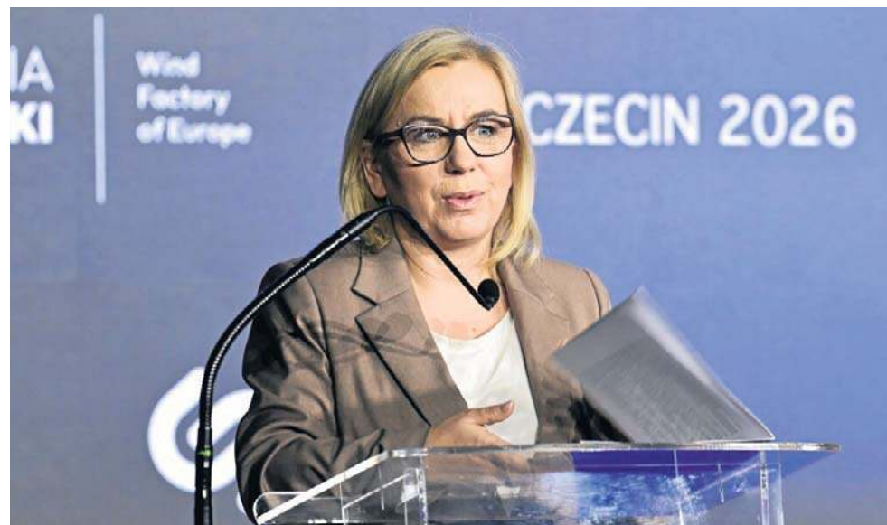
Paulina Hennig-Kloska, minister klimatu i środowiska, podkreśliła, że w ubiegłym roku Polska wyprodukowała ponad 31 proc. energii z OZE