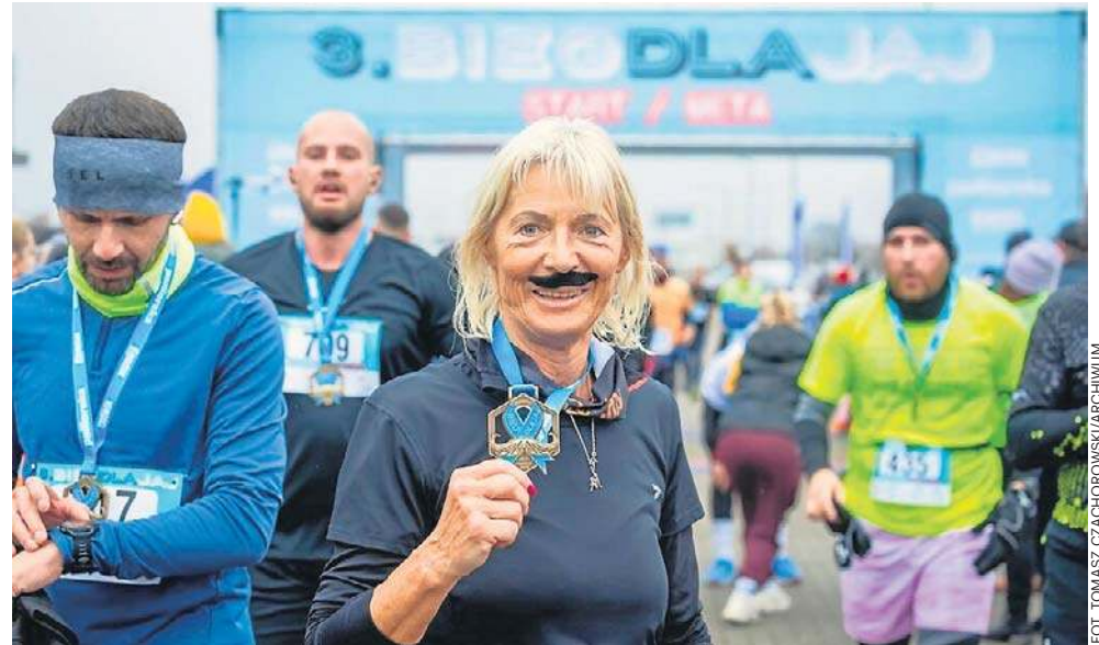
„Bieg Dla Jaj” wpisuje się w ogólnopolską akcję Movember, której symbolem są wąsy

O dofinansowanie mogą ubiegać się organizacje non-profit, organizacje pozarządowe, organizacje pożytku publicznego, osoby fizyczne i prawne, rady osiedla. Najważniejszymi kryteriami branymi pod uwagę są m.in. zasięg oddziaływania promocyjnego w obszarze regionu i całego kraju, oryginalność i wyjątko-