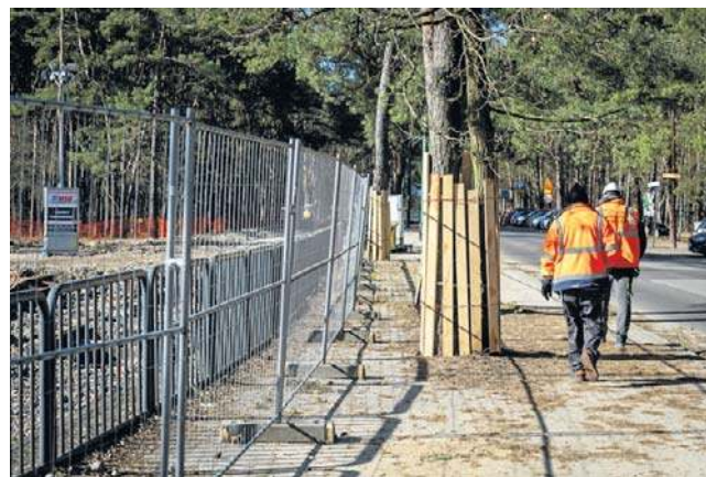
Prace przy pętli Las Gdański trwają od początku stycznia

Ewentualny dojazd do Rekreacyjnej możliwy będzie jedynie od Smukalskiej przez drogę pożarową nr 16. Prace, według informacji umieszczonej na tablicy przy ulicy, mają potrwać do 30 kwietnia. To istotna informacja dla osób, które odwiedzają Myślęcinek, ponieważ wiele osób przy Rekreacyjnej zostawia swoje auta. Teraz będą musieli poszukać innego miejsca - jedną z opcji jest sąsiedni parking park and ride. Na Rekreacyjnej