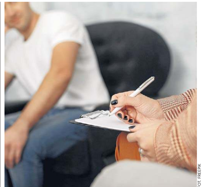
Możesz zapisać się do kolejnych trzech specjalistów bez skierowania