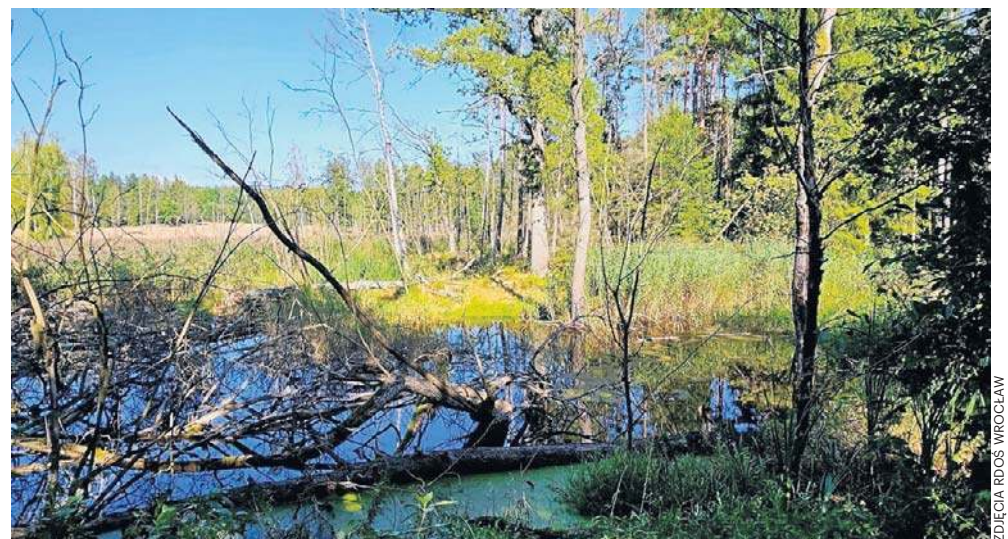
Rezerwat „Mokradła nad Wilką” w gminie Olszyna