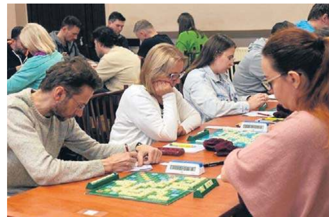
Turniej Scrabble o Puchar Wójta Gminy Kunice, wystartowało 36 graczy, zdjęcia

To dowód, że gra przyciąga ludzi z różnych środowisk - zarówno humanistów, jak i ścisłowców.