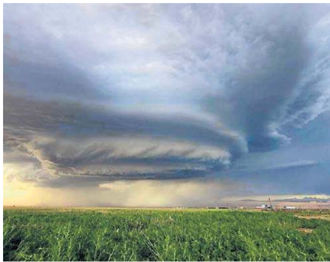
Naukowiec z Poznania aż 21 razy był świadkiem tornad

Podczas polowania na burzę obowiązują jednak konkretne zasady. Mają one zapobiec ryzyku, które przy polowaniu na żywioł potrafi być bardzo wysokie.