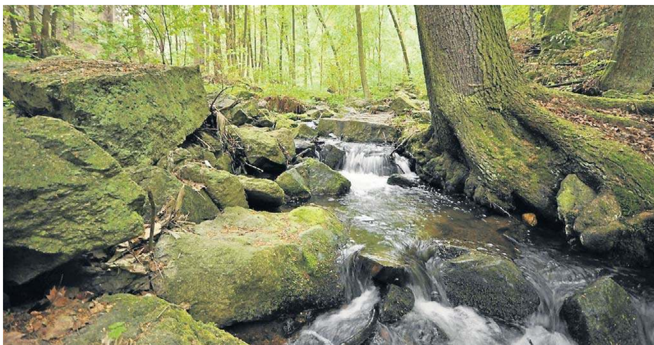
Rezerwat „Dziki Wąwóz” w gminie Lubomierz

Trzeci rezerwat, o powierzchni 31,14 ha, powstał w gminie Olszyna (powiat lubański). Obejmuje dolinę potoku Wilka oraz zmieniający się, naturalny system mokradeł tworzonych przez bobry. To ważna ostoja płazów, ptaków i ssaków, które znajdują tu bezpieczne siedlisko. Nie wiadomo, czy będą tutaj szlaki turystyczne. Szczegółowy plan ochrony znajduje się na etapie opracowania przez Regionalną Dyrekcję Ochrony Środowiska we Wrocławiu.