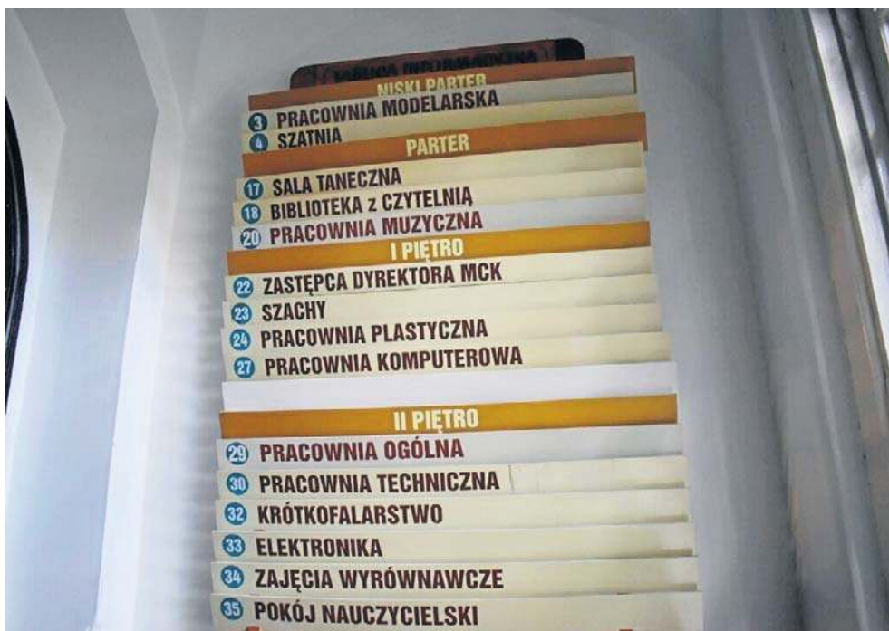
Władze miasta rozważają sprzedaż budynku MCK przy ul. Rataja

- Zamiast inwestować w drogie remonty i kosztowne utrzymanie dwóch budynków, możemy wykorzystać przestrzeń, którą już oferują szkoły. Nie jesteśmy w stanie zapewnić budynkowi przy ul. Rataja warunków wymaganych przy obiek-