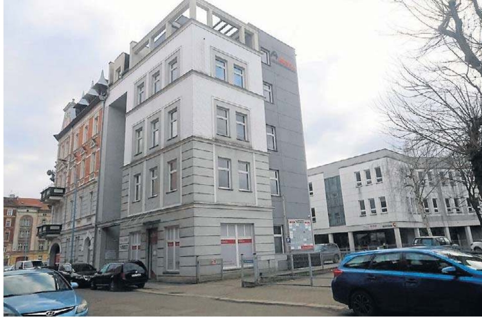
Legnickie centrum ma swoją siedzibę w budynku Arlegu przy pl. Wolności 4

Centrum pełni podwójną rolę. Z jednej strony wspiera bezpieczeństwo i porządek publiczny poprzez obsługę procesów związanych z legalnym pobytom. Z drugiej promuje język, kulturę i tradycję polską, umożliwiając tworzenie więzi społecznych i lepsze zrozumienie lokalnej wspólnoty dla wszystkich. - Dolnośląskie Centra Kultury Polskiej w nowej formule oferują pod-