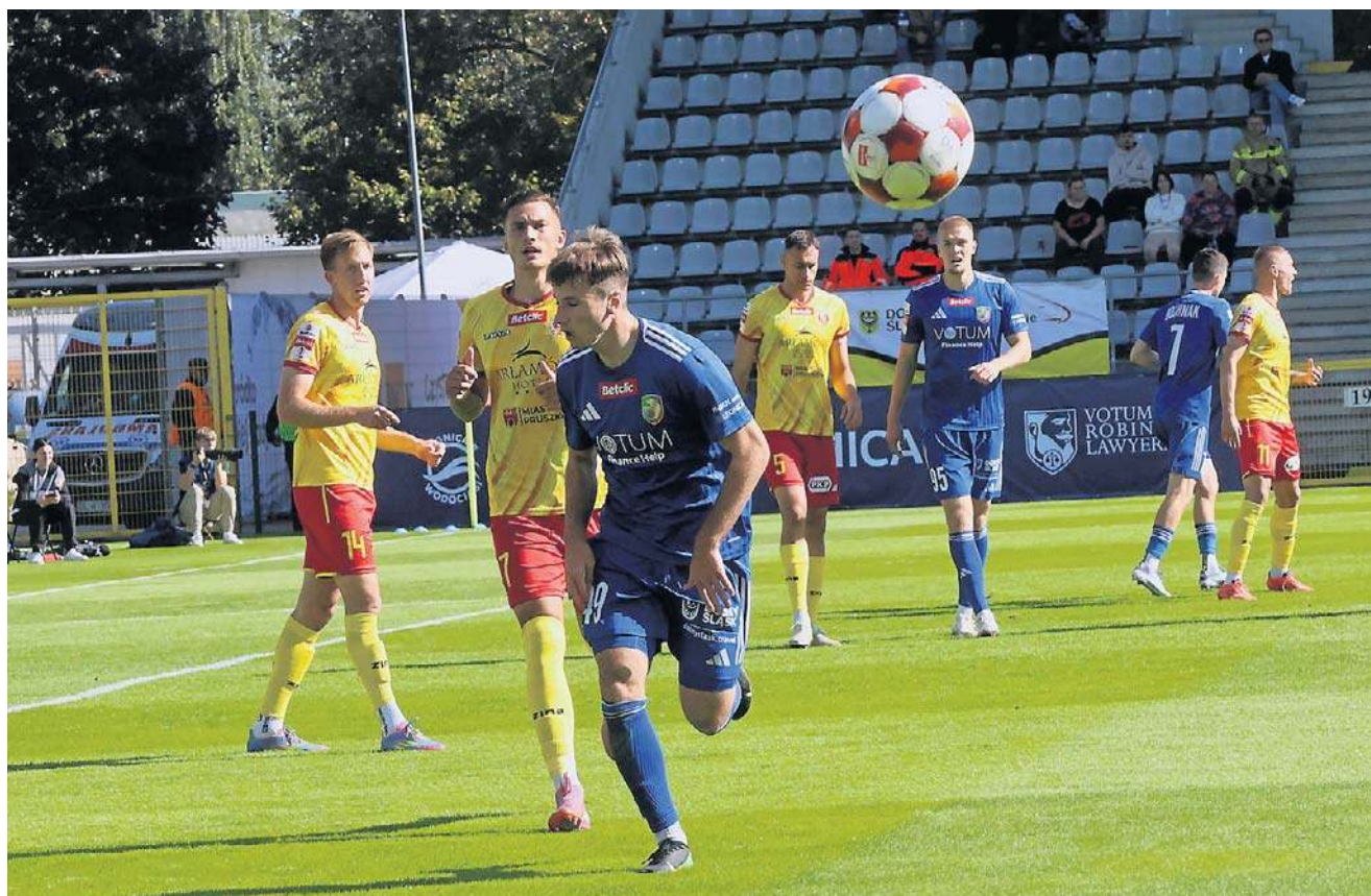
Niedzielny mecz ze Zniczem na Stadionie Orła Białego w Legnicy początkowo toczył się pod dyktando gości

PIŁKA NOŻNA MIEDŹ LEGNICA WYGRAŁA 2:1 ZE ZNICZEM PRUSZKÓW