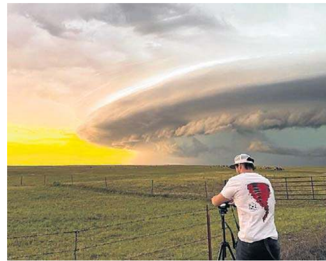
Na terenie USA te zjawiska są najbardziej spektakularne

Najbardziej niebezpieczną wyprawę łowca burz z Poznania odbył jednak w 2016 roku. Wówczas naukowiec miał przyjemność ścigać burzę wraz z legendarnym synoptykiem Rogerem Edwardsem ze Storm