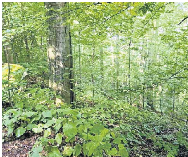
Rezerwat „Leśne zbocza” w gminie Janowice Wielkie