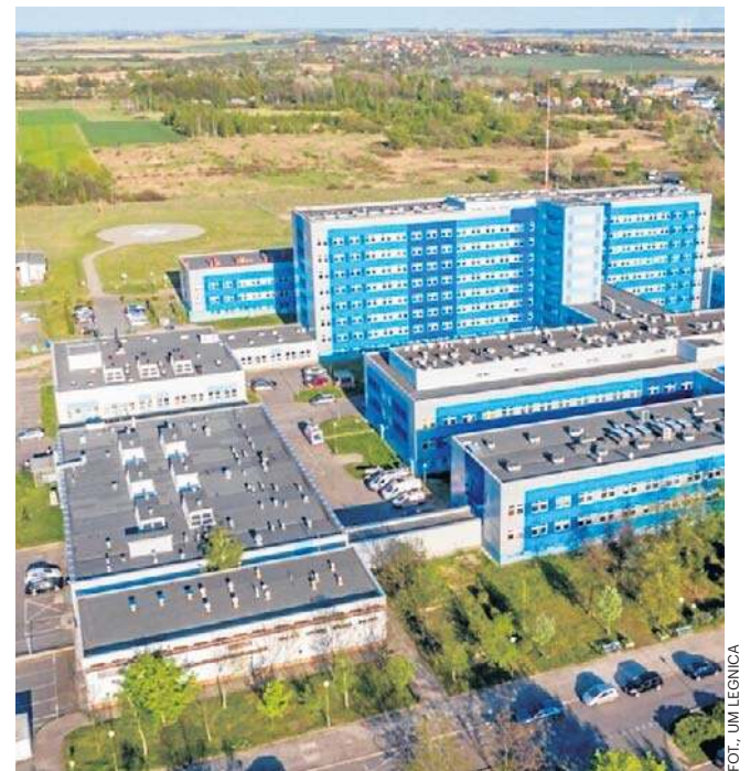
Remont SOR-u rozpoczął się latem 2024 roku, kosztował ok. 16 mln zł

- Nowością będzie rozdział pacjentów. SOR jest podzielony na dwa wejścia. Na jednej części będą pacjenci przywożeni przez Zespoły Ratownictwa Medycznego, a na drugiej będą pacjenci zgłaszający się sami do szpitalnego oddziału ratunkowego. Będą dwa triazery i to ma za zadanie przede wszystkim usprawnić pracę