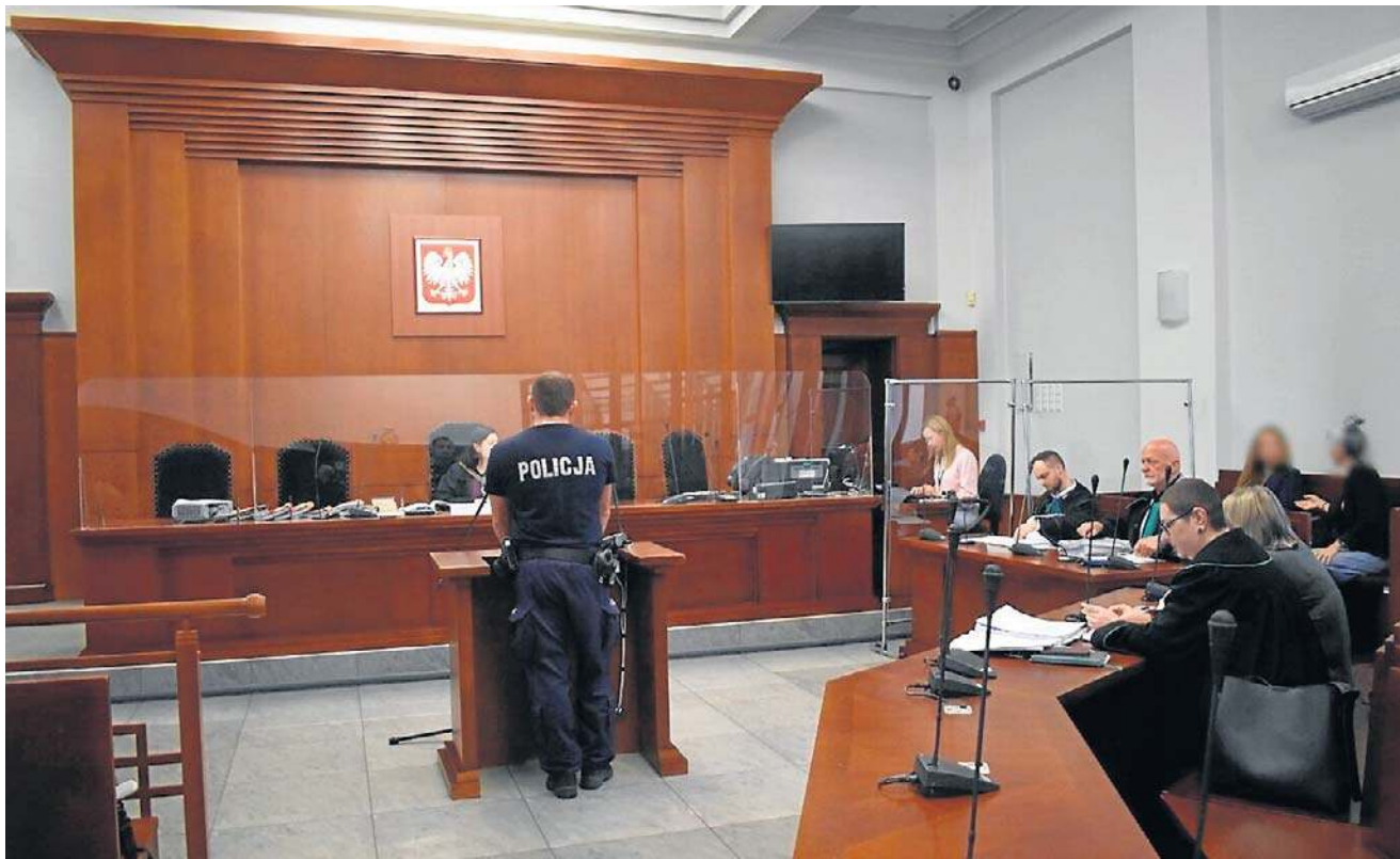
22 września odbyła się kolejna rozprawa w procesie czterech osób, oskarżonych o znęcanie się nad egzotycznymi zwierzętami. Zeznawał m.in. policjant, który mówił, że nie zauważył, by zwierzętom działa się krzywda