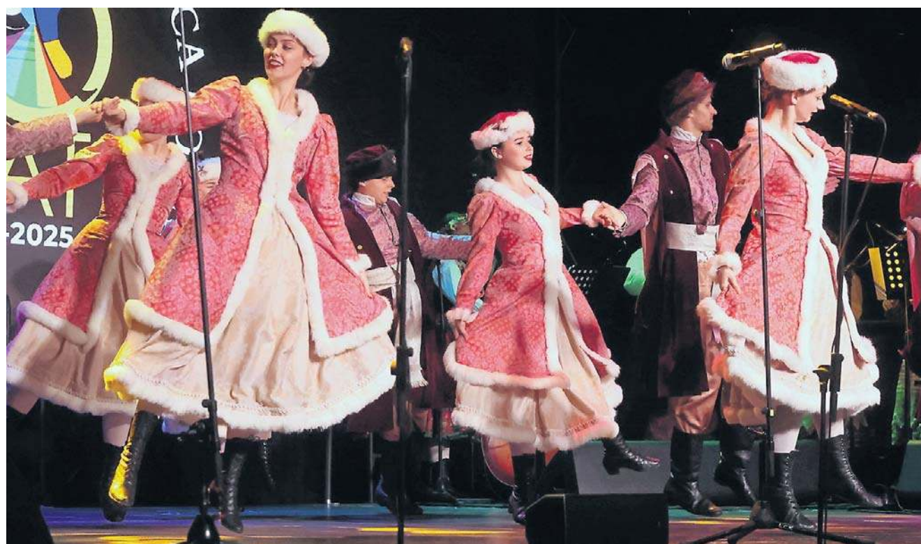
Na repertuar składają się głównie regionalne suity - m.in. górnośląska, lubelska, rzeszowska, kurpiowska, tańce z okolic Legnicy oraz tańce narodowe: mazur, krakowiak, polonez czy oberek