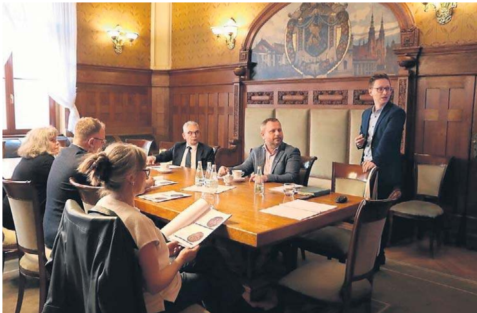
Komisja heraldyczna pracuje od kilku miesięcy