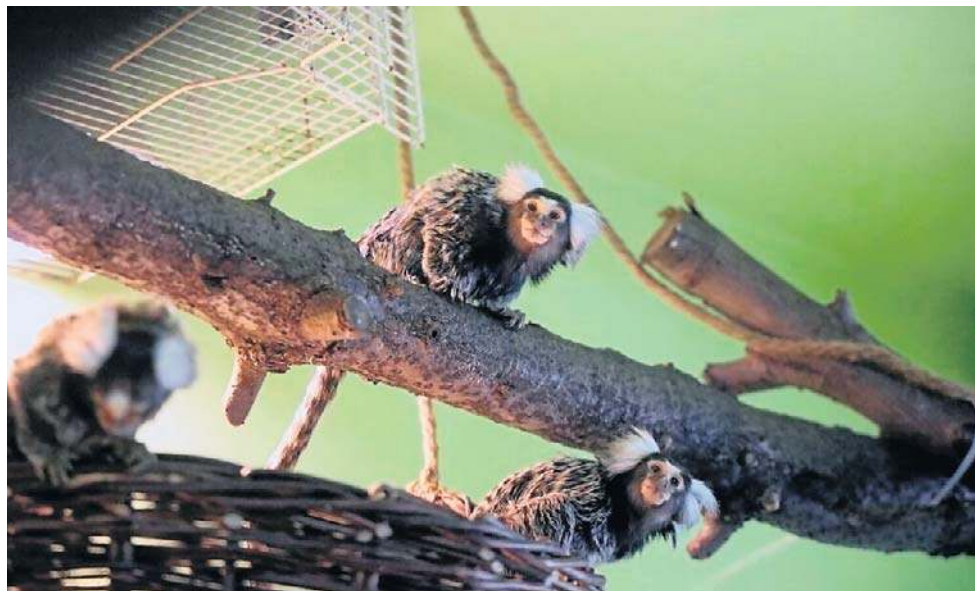
Dzięki zwierzętom, Palmiarnia cieszyła się wśród legniczan dużą popularnością