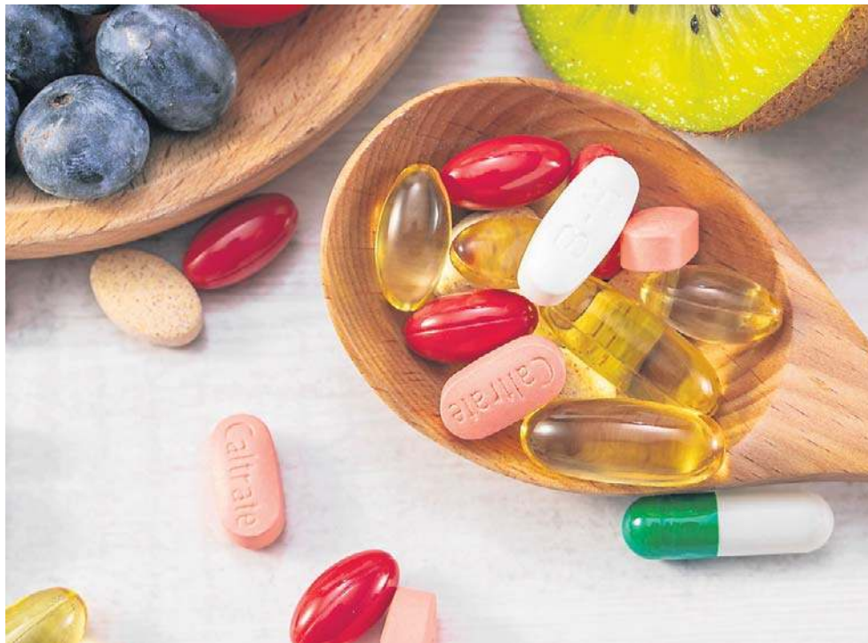
Witaminy są niezbędne do prawidłowego funkcjonowania organizmu

Od lekarza POZ uzyskasz także skierowanie na wykonanie podstawowych badań profilaktycznych, takich jak: mor-