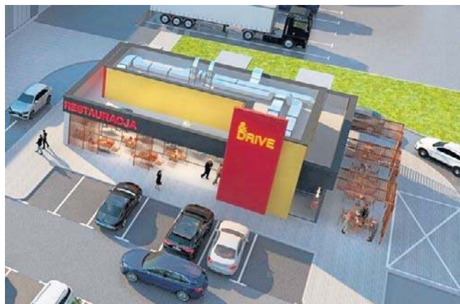
Carrefour ma w planach budowę restauracji obok głównego pawilonu

norodny charakter i odpowiada na potrzeby różnych grup klientów. Równocześnie przeprowadzono gruntowną modernizację wnętrza. Wymieniono posadzki i sufity, generalny remont przeszły toalety. Obecnie trwają prace projektowe nad drugą fazą rozbudowy centrum. To nie koniec zmian jakie zaplanowaliśmy w Legnicy. - Rozpoczęliśmy już proces projektowania kolejnej fazy rozbudowy tego centrum, uwzględniając zainteresowanie najemców tą lokalizacją - zapowiada Carrefour.