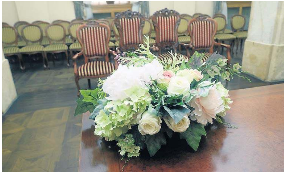
Zamiast w legnickim USC (na zdj.), pary z gminy Legnickie Pole będą brać śluby u siebie

Obecnie mieszkańcy gminy muszą pokonywać sporą odległość, aby załatwić sprawy w Urzędzie Stanu Cywilnego w Legnicy. Utworzenie lokalnego urzędu skróci ten dystans. Wielokrotnie mieszkańcy zgłaszali wnioski, aby sprawy z zakresu stanu cywilnego można