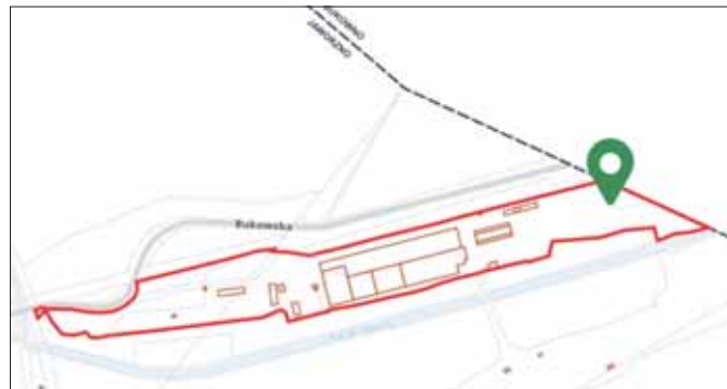
Teren objęty miejscowym planem zagospodarowania przestrzennego w rejonie ul. Bukowskiej

Celem planu jest ustalenie zasad prowadzenia działalności produkcyjnej i usługowej, z uwzględnieniem uwarun-