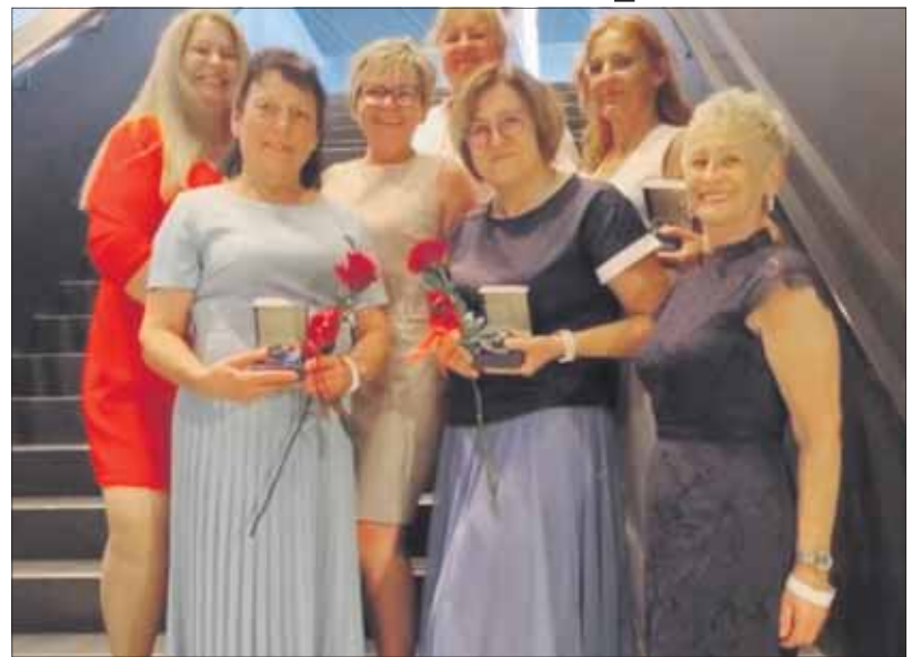
Diamentowe Czepki dla pracowniczek jaworznińskiego szpitala

Wyróżnionym pracownicom złożono gratulacje oraz podziękowania za profesjonalizm wkładany w codzienną opiekę nad pacjentami. PK