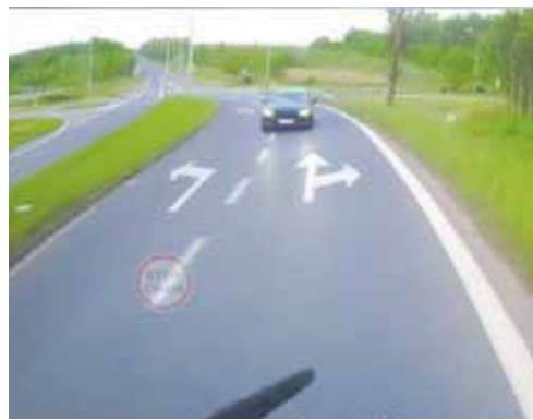
Jazda pod prąd w Jaworznie

Do niebezpiecznej sytuacji doszło na ulicy Fryderyka Chopina w rejonie skrzyżowania z ulicą Radwańskich w Jaworznie. Kierowca, który nagrywał zdarzenie, jechał prawidłowo od kopalni w stronę skrzyżowania. Nagle z naprzeciwka nadjechał czarny Ford. Kierowca samochodu osobowego jadąc ulicą Radwańskich zjechał na przeciwległy pas ruchu, przejechał za pas zieleni i znalazł się pod prąd. Samochód jechał wprost na pojazd z wideorejestratorem.