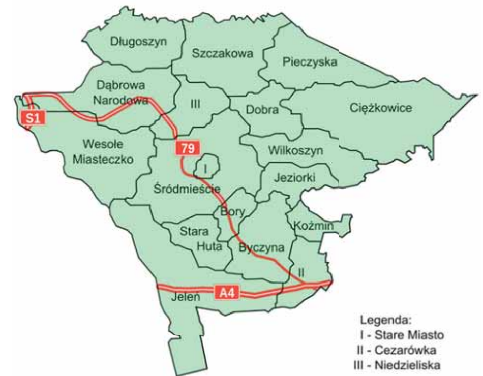
Przybliżony podział Jaworzna na dzielnice

Jak widać z powyższego podziału jest on absolutnie umowny, nastrocza zresztą sporo problemów, zarówno w kontekście historycznym, jak i geograficznym. Część obecnych dzielnic bowiem może poszczycić się średniowieczną metryką, niektóre powstawały później, w XVII wieku czy w stuleciu XIX. Istnieje w nich duże poczucie odrębności historycznej, które można by określić nawet mianem swego rodzaju partykularyzmów. Dwie z obecnych dzielnic były w przeszłości także odrębnymi miastami, które także posiadały wówczas swe dzielnice. Dlatego też dzisiaj nastrocza to trochę kłopotów; pytanie bowiem brzmi: Które jednostki można uznać za pełnoprawne dzielnice, a które nie? Odpowiedź na to pytanie jest wszak bardzo trudna. Posłużyć się tutaj można chociażby przykładem Szczakowej, która jako miasto składała się z dzielnic właśnie, szczególnie wówczas gdy była gminą zbiorową. Była to np. Góra Piasku, która dawniej stanowiła rdzeń Szczakowej jako takiej i przez jakiś czas była określaną mianem Szczakowej Wsi. Były to także Ciężkowice czy Długoszyn, którym odrębności odmówić nie sposób, są to chociażby Pieczyska czy Dobra, które dzisiaj traktuje się jako odrębne dzielnice Jaworzna, a które kiedyś przecież wchodziły w skład Szczakowej właśnie. Niejednokrotnie też