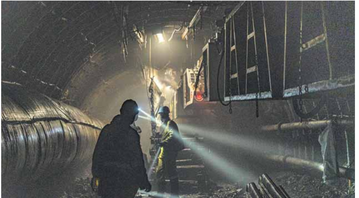
Zdjęcie poglądowe