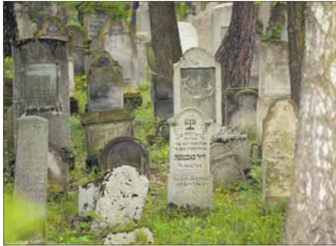
Macewy na cmentarzu żydowskim w Jaworznie

– Nie przewidujemy na tę chwilę spotkania w weekend, ale na pewno kolejny spacer będzie późnym popołudniem, najpewniej około godz. 18. O szczegółach poinformujemy, gdy wyklaruje się konkret-