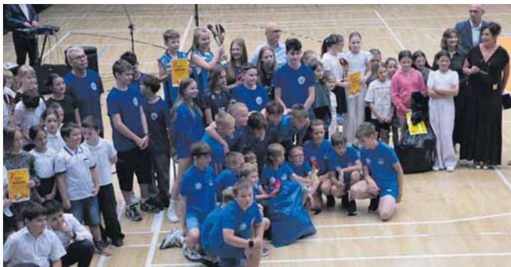
Najlepsi z całorocznych zmagani w ramach Igrzysk Dzieci

Podsumowując tegoroczne zmagania w mieście w ramach Igrzysk Dzieci, na najwyższym stopniu podium stanęli uczniowie reprezentujący dwie szkoły SP 15 i SP