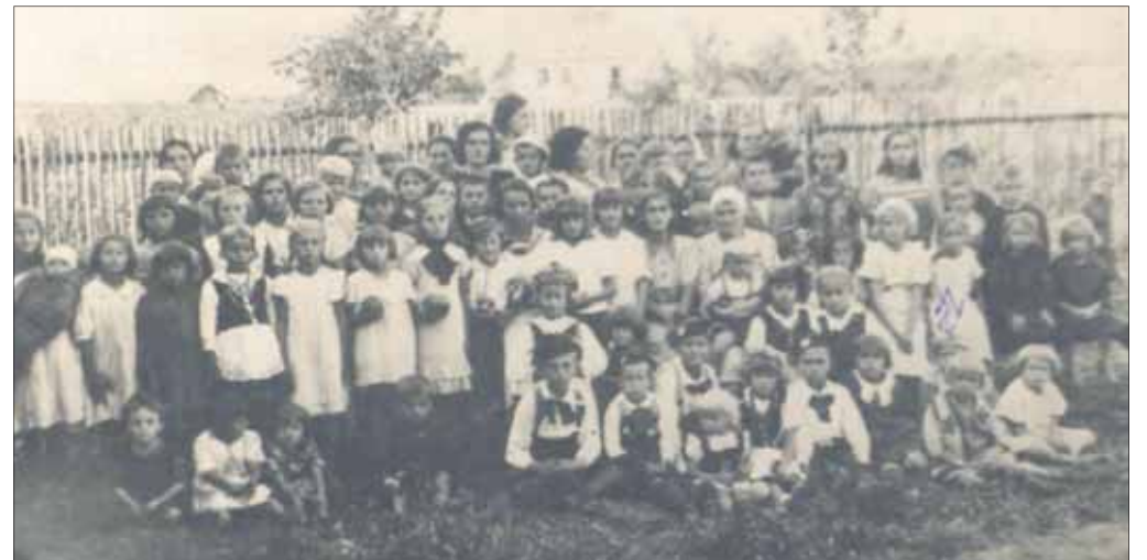
Długoszyńskie dzieci w obrębie Palianowszczyzny, lata 40. XX wieku

w samym Jaworznie oraz w wielu innych wsiach i osadach. W jaworznickim przypadku przestrzeń ta pokrywała się z dzisiejszym rynkiem oraz Placem św. Jana. Co do zasady na terenie klasycznego „nawsia” znajdowało się zazwyczaj miejsce kultu (kościół, kaplica, kapliczka), miejsce na targ czy na pochówek i różnego rodzaju spotkania. Oczywiście cmentarza nigdy tutaj nie było, ale trzy pozostałe rzeczywistości miały tutaj rację bytu, choć raczej w zniwelowanej formie. Owa owalna, duża część wspólna, dziś zabudowana, była niewątpliwie pokłosiem tego, że wcześniej, przez prawie trzy stulecia północną krawędzią owego „nawsia”,