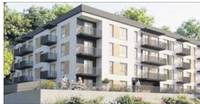
Wizualizacja bloku

Z dokumentów wynika, że prywatny inwestor planuje bu-