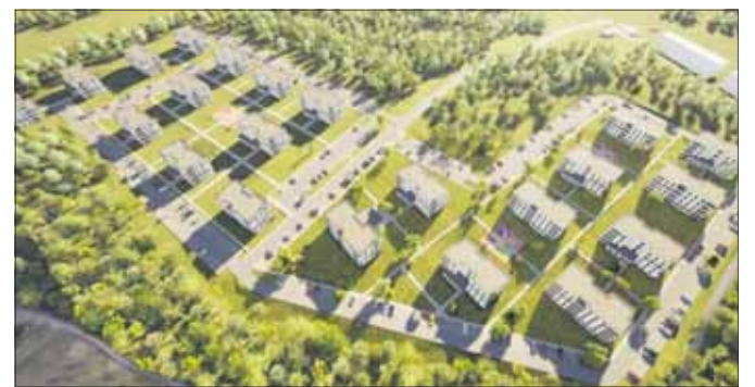
Osiedle Skałka w Jaworznie – wizualizacja.

Osiedle Skałka powstaje przy ul. Olgi Boznańskiej i jest realizowane etapami. Pier-