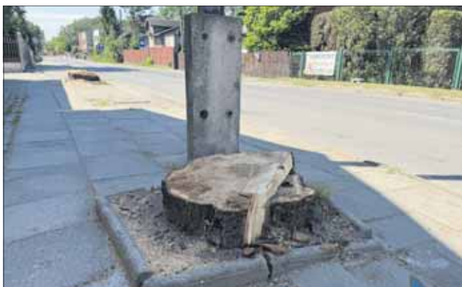
Wycięte drzewa na ul. Szczakowskiej

Mieszkańcy przekonują, że stare drzewa powinny zostać zachowane, a urząd wyjaśnia, że ich usunięcie jest niezbędne do zrealizowania inwestycji.