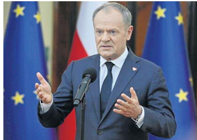
Premier Donald Tusk oświadczył we wtorek, że liczy na szybką decyzję prezydenta ws. ustawy o SAFE

Marszałek Sejmu Włodzimierz Czarzasty poinformował w środę, że Sejm nie będzie pracował nad prezydenckim projektem ws. „polskiego SAFE” do momentu zakończenia procesu związanego z ustawą o unijnym programie SAFE, skierowaną do prezydenta.