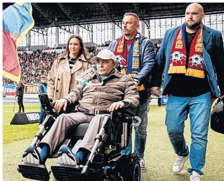
FOT. POGONISZCZEWI, P. WIOŁA, UFLAND

Robert nie chciał filmu tylko o sobie. Chciał nim pomóc innym chorym i ich rodzinom str. 16