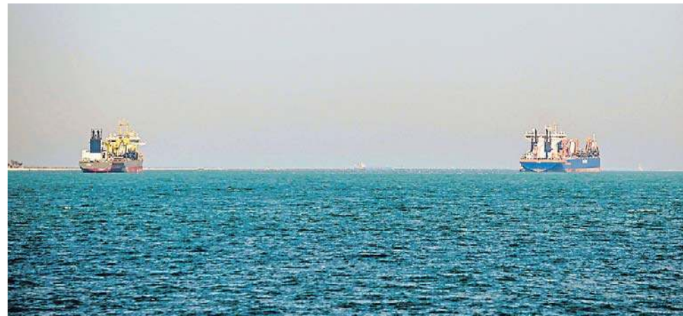
Wczoraj doszło do nowych ataków na trzy statki handlowe w Zatoce Perskiej. Cieśnina Ormuz to jeden z najważniejszych szlaków żeglugowych na świecie

Centralne Dowództwo Sił Zbrojnych Stanów Zjednoczonych (CENTCOM) poinformo-