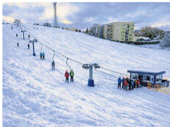
Górka winniczna w Szczecinku - grafika poglądowa. Ruszył proces przygotowania planów dla inwestycji

Ostateczny koszt inwestycji oraz harmonogram jej realizacji będą znane po zakończeniu prac projektowych i uzyskaniu wymaganych decyzji administracyjnych. Kolejnym krokiem będzie ogłoszenie przetargu na realizację robót budowlanych. ©