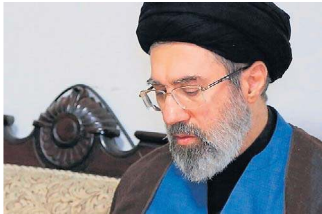
Modżtaba Chamenei objął stanowisko najwyższego przywódcy Iranu w niedzielę, zastępując swojego ojca

Według cytowanych rozmówców polityk „został ranny, szczególnie w nogi, ale jest przytomny i bezpieczny w ściśle strzeżonym miejscu o ograniczonych możliwościach komunikacji”. Jak podała AFP, nowy przywódca miał zostać ranny podczas tego samego nalotu, w którym zginął jego ojciec. Izraelski wywiad miał wiedzieć o tym jeszcze przed jego oficjalnym mianowaniem. PAP