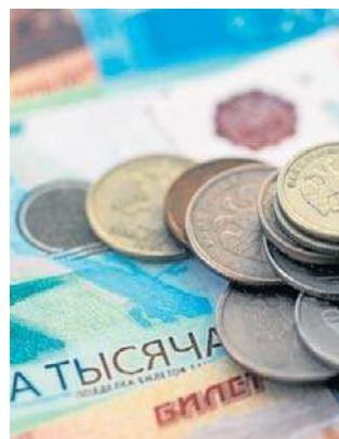
Fatalna sytuacja budżetu Rosji na początku 2026 r.

Dochody z ropy i gazu spadły o połowę (do 826 mld rubli) po spadku cen rosyjskiej ropy i wymuszonym ograniczeniu wydobycia przez koncerny naftowe. W rezultacie budżet wydał prawie dwa razy więcej niż zebrał w postaci podatków.