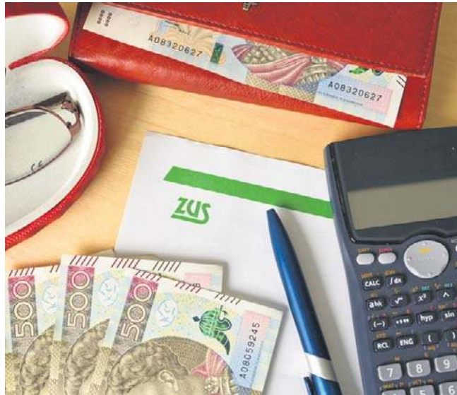
„Mały ZUS plus” przysługuje na nowych zasadach niezależnie od tego, czy była wcześniej wykorzystywana

Pozostałe zasady małego ZUS plus nie ulegają zmianie. Zmiany dotyczą wyłącznie sposobu liczenia okresów i mają