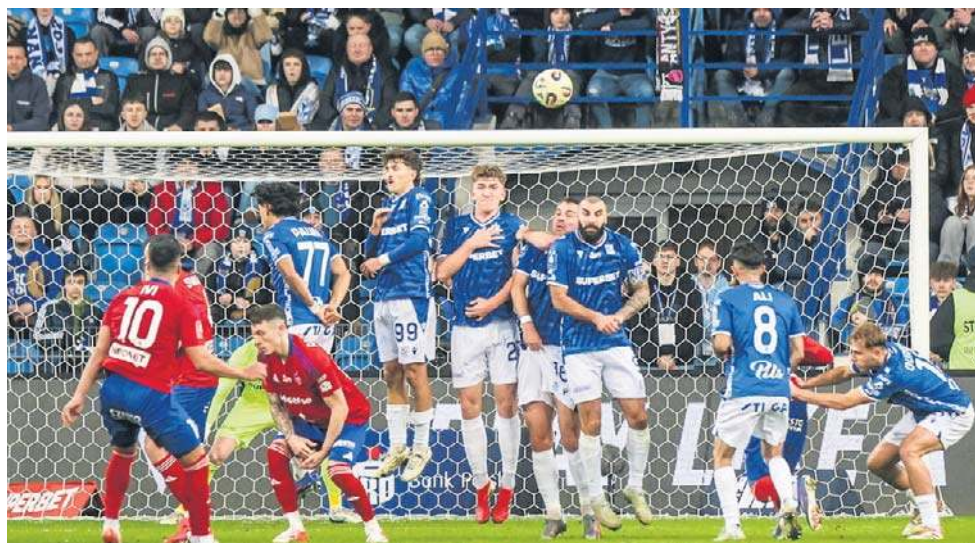
Lech Poznań podejmował w niedzielny wieczór na Enea Stadionie Raków Częstochowa. Dziś mistrz Polski zmierzy się z ukraińskim Szachtarem Donieck

Początek meczu na Enea Stadion w Poznaniu o godzinie