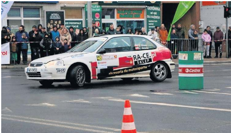
Stopień zaawansowania prac na każdym budowanym odcinku S6 w Pomorskiem przekroczył już 90 procent.

Rajd rozpocznie się w sobotę po południu na drogach wokół bazy rajdu - Homanit Areny w Karlinie. - Bezpośrednio stąd załogi przejadą do Białogardu, by zmierzyć się z nocnym miejskim odcinkiem po zabytkowej kostce wokół Placu Wolności - zaprasza do kibicowania Raczewski. I już przypomina, że tego dnia od południa przejazd przez stare miasto w Białogardzie będzie niemożliwy.