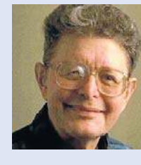
POUL ANDERSON (1926-2001)

– Nie wiem, co to jest! – wrzasnął, przekrzykując ogólne zamieszanie. – Może to jakaś francuska sztuczka, może też coś przyjaznego, a wtedy nasz strach wypadłby głupio. Chodźcie ze