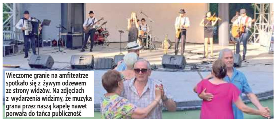
Wieczorne granie na amfiteatrze spotkało się z żywym odzewem ze strony widzów. Na zdjęciach z wydarzenia widzimy, że muzyka grana przez naszą kapelę nawet porwała do tańca publiczność