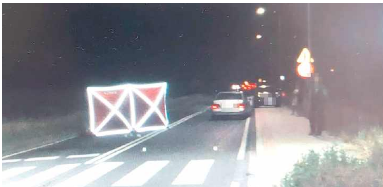
Do śmiertelnego wypadku doszło w sobotę około godziny 22:00 w Łęcznej na ulicy Osiedle Kolonia Trębaczów, jest to ciąg drogi krajowej numer 82

- Ze wstępnych ustaleń policjantów łęczyńskiej drogówki wynika, że 72-letni kierowca Mercedesem poruszając się od miejscowości Zońkówka w kierunku Łęcznej na prostym odcinku oświetlonej drogi potrafił w rejonie przejścia dla pieszych 65-latkę - informuje podkomisarz Kamil