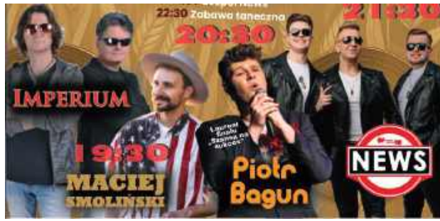
Oni zagrają w Abramowie

Wśród atrakcji organizatorzy wymieniają rejs motorówką po Jeziorze Maśluchowskim.