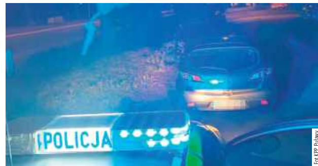
33-latek wydmuchał ponad 2 promile. Teraz będzie tłumaczyć się przed sądem

8 sierpnia policyjny patrol zauważył mazdę jadącą ul. Lu-belską w Puławach. Było już po zmroku, a pojazd nie miał włączonych świateł, co więcej jego kierowca miał wyraźne problemy w utrzymaniu toru jazdy na jednym pasie. Funkcjonariusze postanowili zatrzymać go do kontroli. Chwilę później okazało się, że za kierownicą osobówki siedzi 33-letni puławianin, który