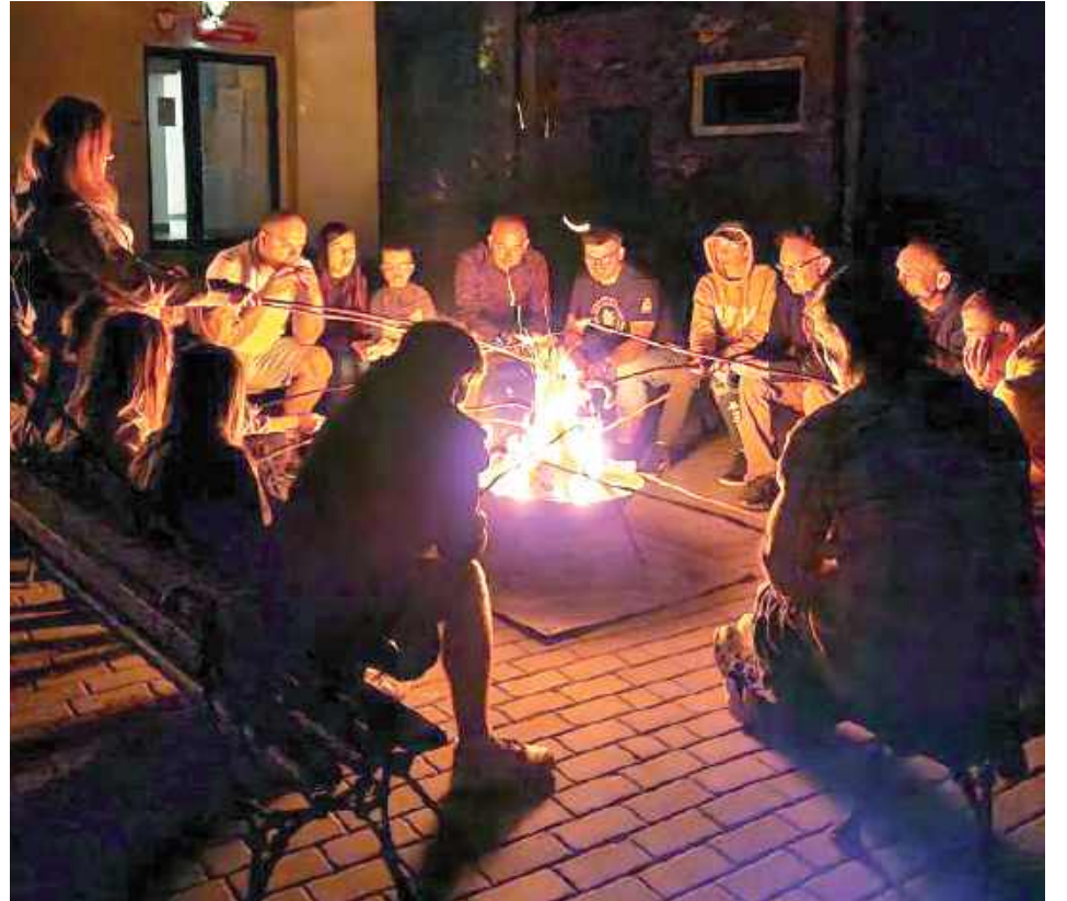
Na zakończenie wieczoru rozpalono ognisko, przy którym można było upiec kiełbaski i jeszcze przez chwilę cieszyć się atmosferą letniej nocy

12 sierpnia 2025 roku w Gminnej Bibliotece Publicznej im. Andrzeja Łuczeńczyka w Ludwinie odbyła się piąta edycja Nocy Perseidów – wydarzenia, które na stałe wpisało się w kalendarz astronomicznych atrakcji regionu.