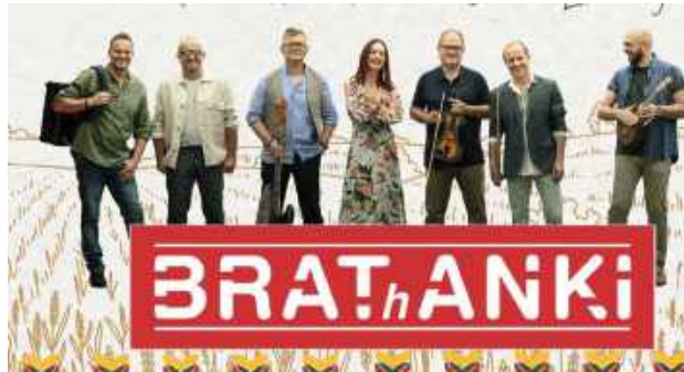
Brathanki zagrają w Ostrowie Lubelskim

Koncerty na dożynkach Godz. 16.00 - Piękni i Młodzi Godz. 18.00 - News Godz. 20.30 - Eratox Godz. 21.30-24.00 - dyskoteka pod gwiazdami