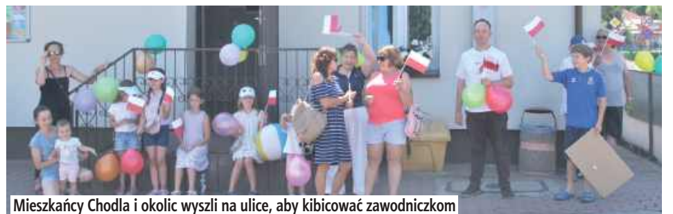
Mieszkańcy Chodla i okolic wyszli na ulice, aby kibicować zawodniczkom

– To wielka dumą i radością, że Chodel znalazł się na mapie tak prestiżowego wyścigu. To wydarzenie nie tylko promuje naszą