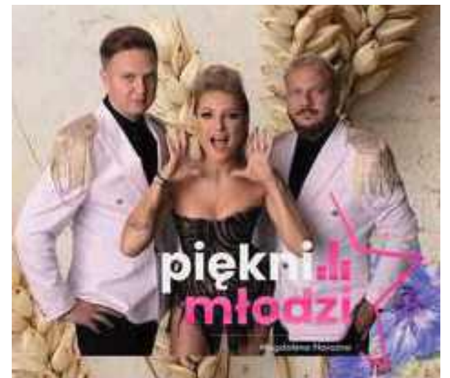
Piękni i Młodzi zagrają w Uścimowie