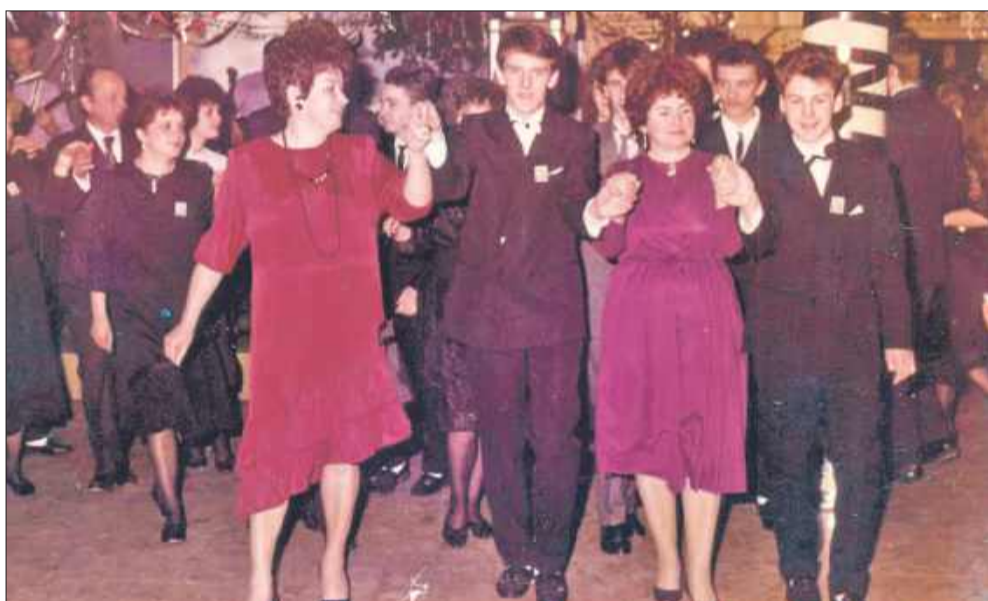
Tak dawniej wyglądały bale maturalne.