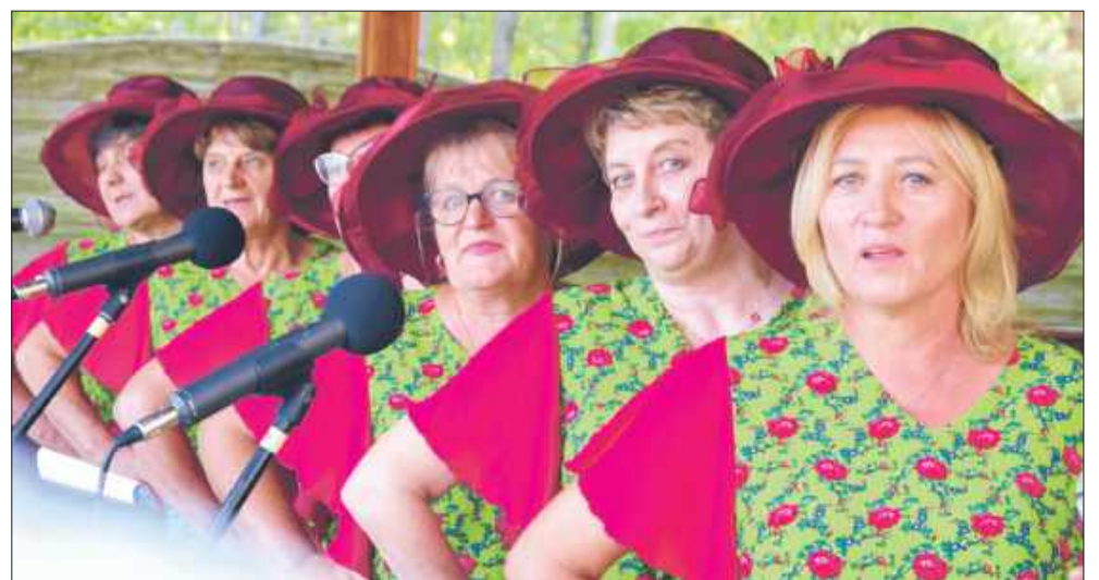
Gospodynie z Mechowca co roku organizują Święto Kapusty, które cieszy się bardzo dużym zainteresowaniem.