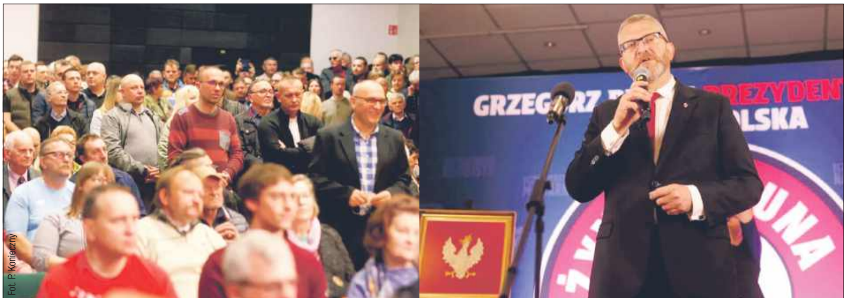
Grzegorz Braun odwiedził Mielec.