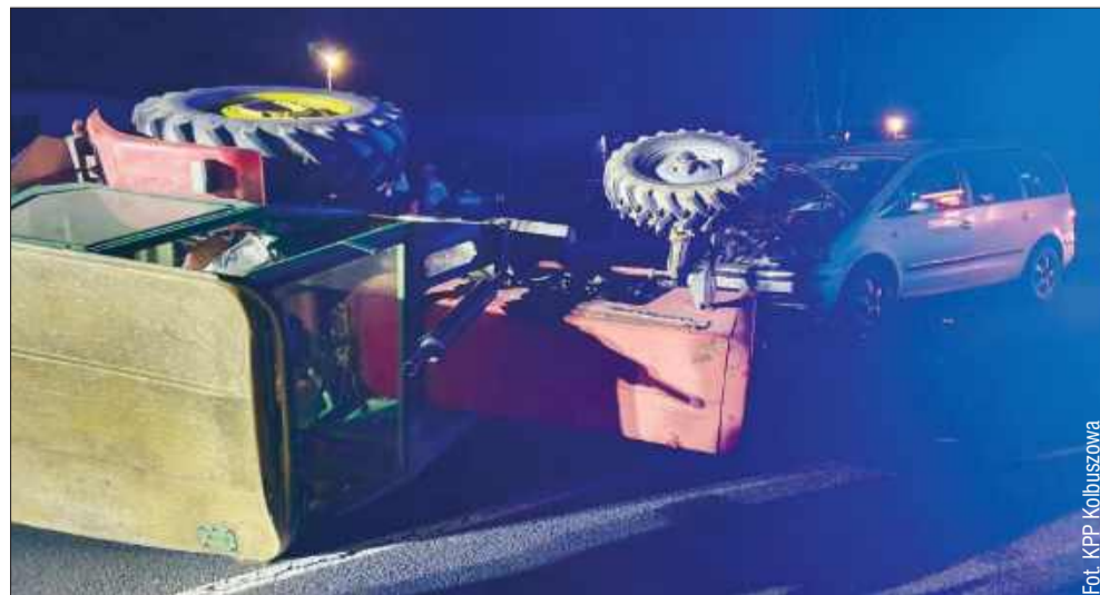
Zdarzenie pociągnęło za sobą jedynie straty materialne.