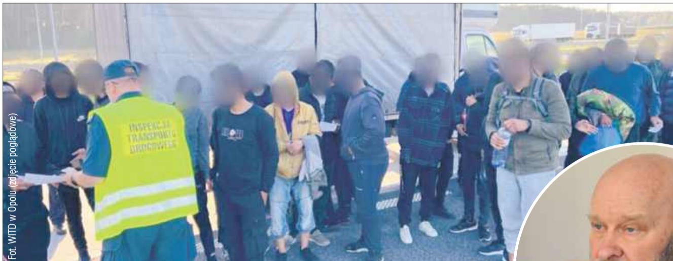
Coraz częściej wśród mieszkańców rosną obawy o relokację imigrantów.