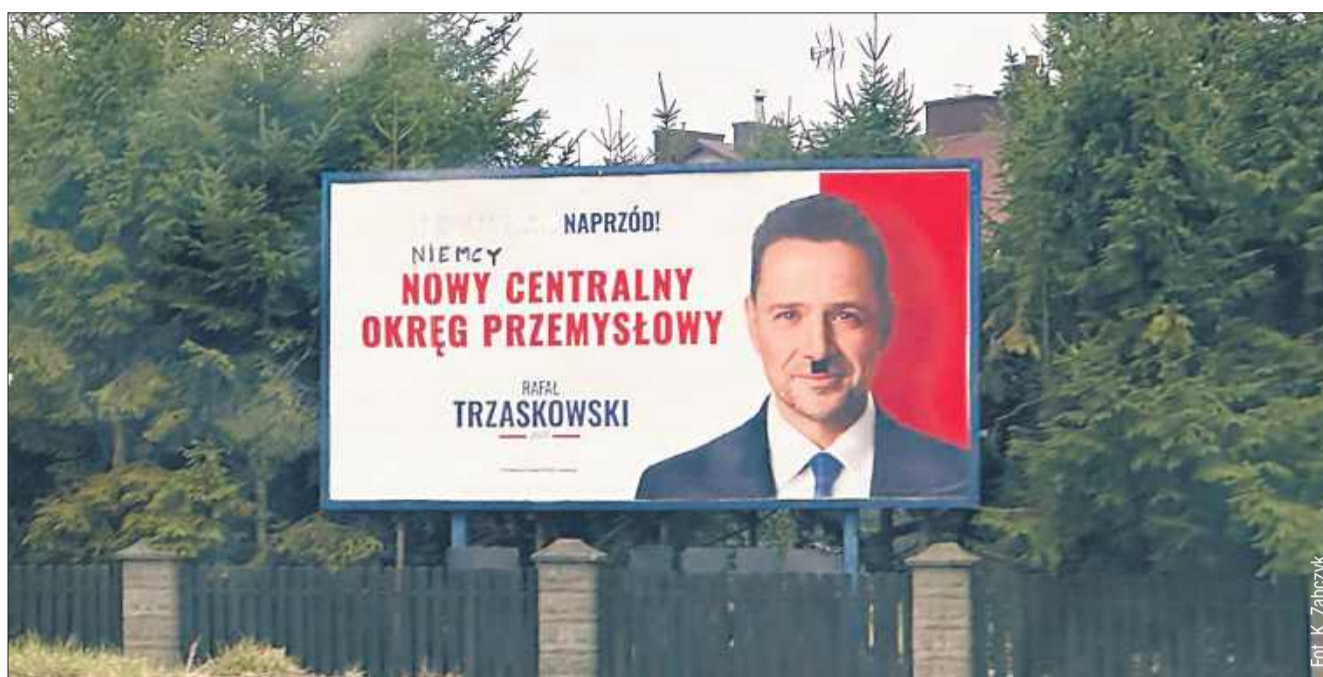
Tak wygląda baner przy ul. Rzeszowskiej. Co grozi za tego typu wykroczenie?

Zgodnie z przepisami prawa, niszczenie, usuwanie lub zamalowywanie plakatów wyborczych jest czynem karalnym. Jak informuje policja, usunięcie lub