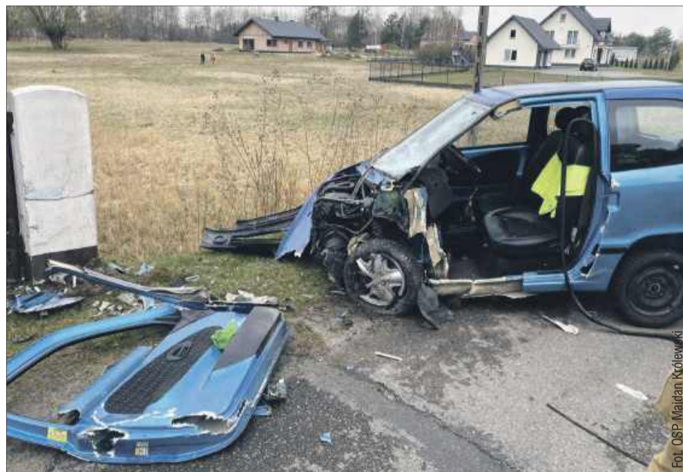
Do zdarzenia doszło na bocznej drodze.