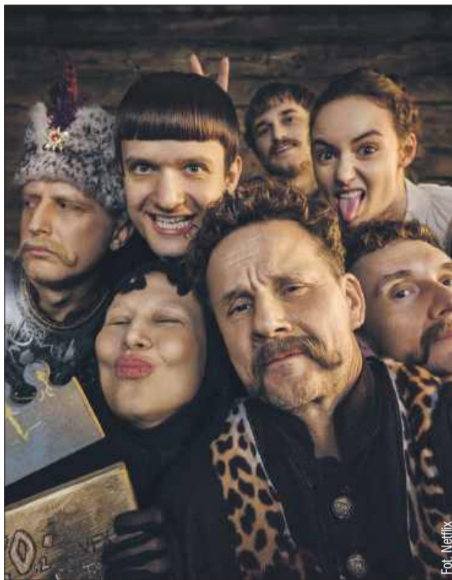
Producenci zapowiedzieli powstanie 3. sezonu „1670”.

W sieci, w tym na platformie YouTube, pojawiło się zabawne