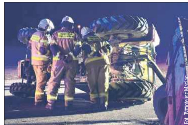
Traktor po zderzeniu zatrzymał się na boku i zablokował całą drogę.