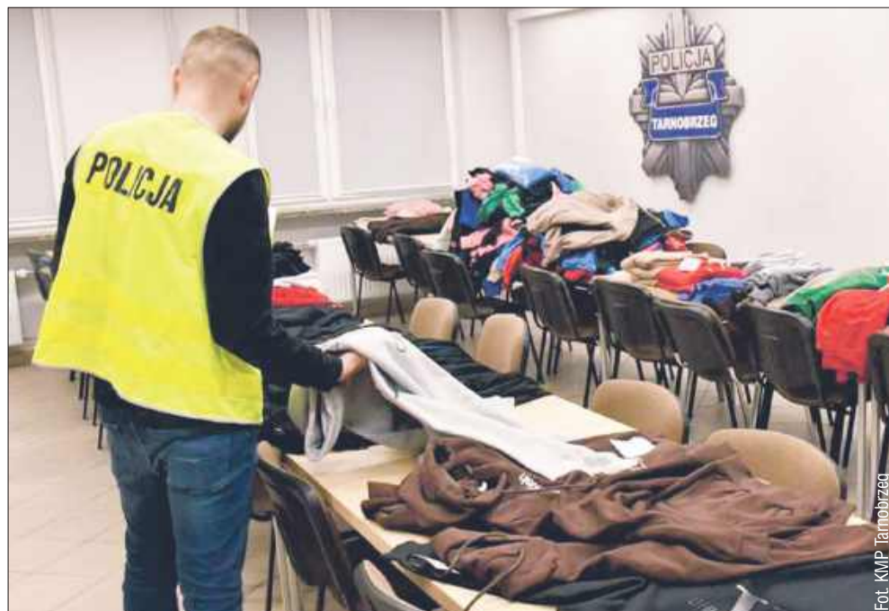
Policjanci zatrzymali 48-letnią mieszkankę Kolbuszowej.