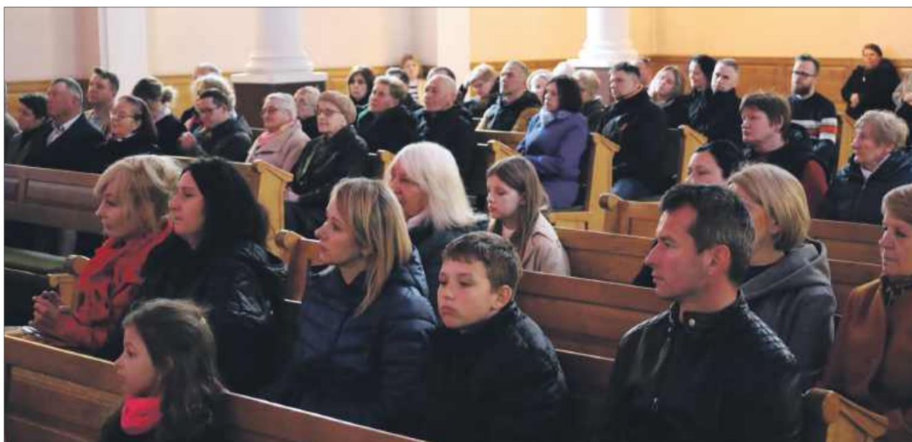
Wierni zgromadzili się w świątyni po mszy.