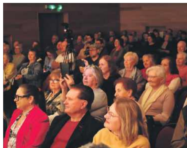
W domu kultury nie zabrakło widzów.