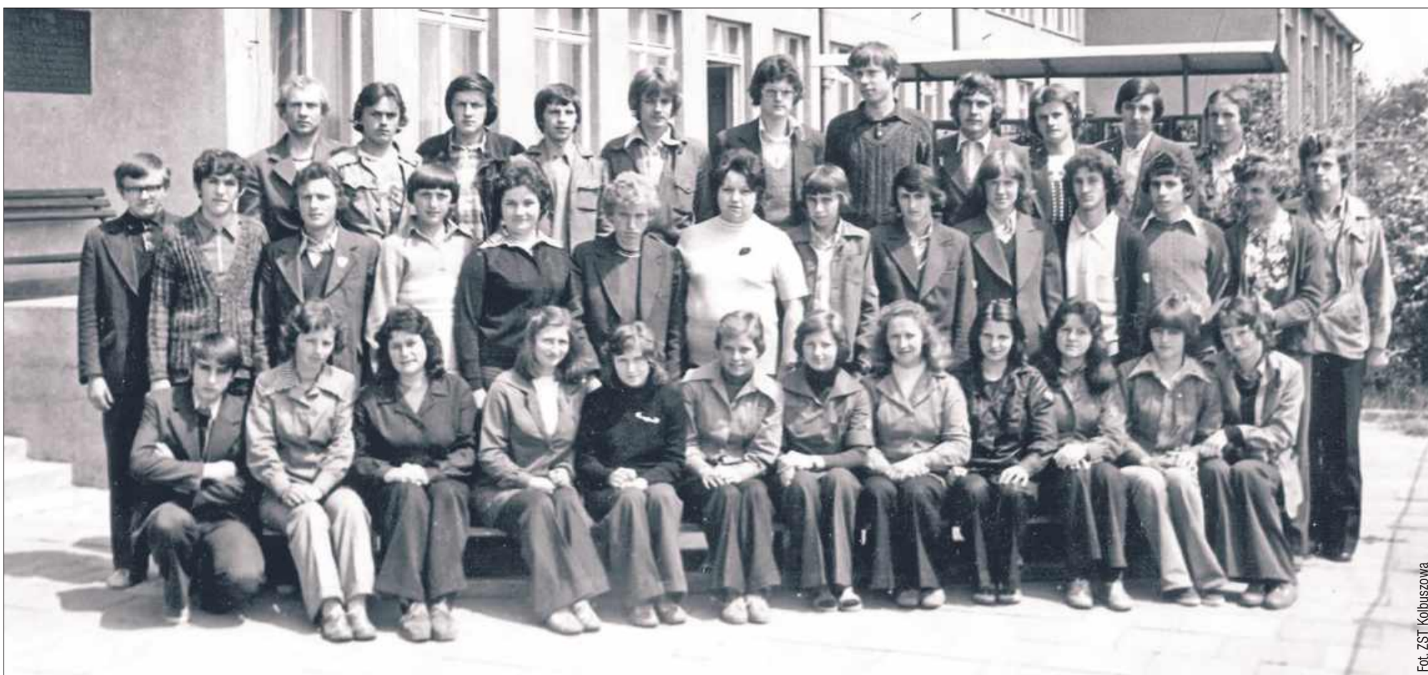
W tym roku Zespół Szkół Technicznych w Kolbuszowej będzie świętował 60-lecie.