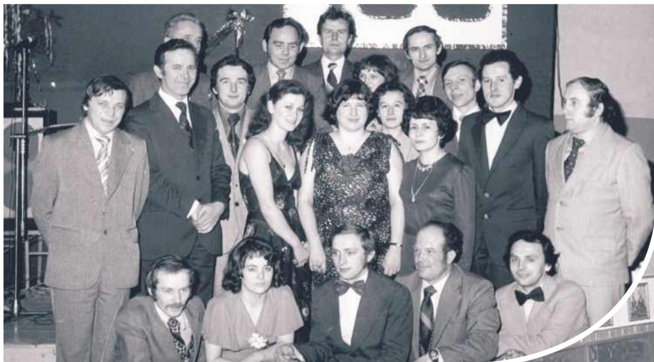
Archiwalne zdjęcia przywołują wiele wspomnień.

Z okazji zbliżającego się jubileuszu publikujemy archiwalne zdjęcia z Zespołu Szkół Technicznych w Kolbuszowej. bp