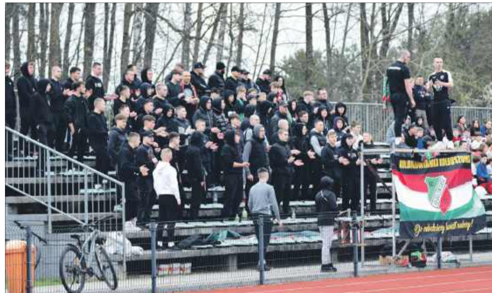
Kolbuszowiankę dopingowali wierni kibice.