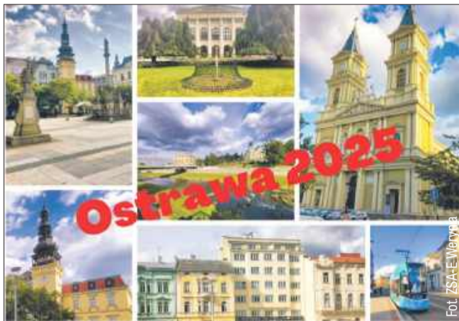
Uczniowie w Weryni odbędą praktyki zawodowe w Czechach.

Jak podkreśla szkoła w Weryni, projekt cieszy się zainteresowaniem, a jego uczestnicy mogą liczyć na ogromne korzyści zarówno w zakresie rozwoju zawodowego, jak i osobistego. Udział w stażu zawodowym to doskonała okazja do zdobycia