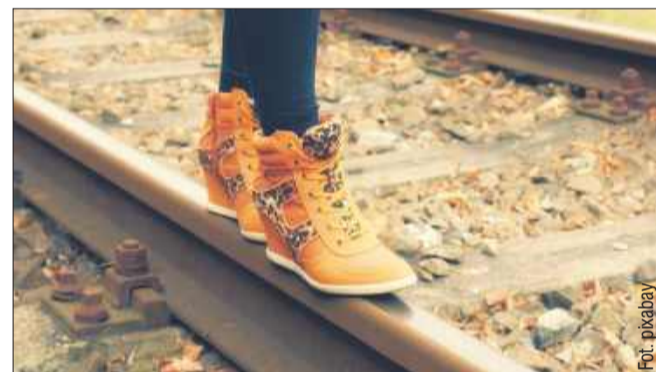
Moda wiosenna wiązania.