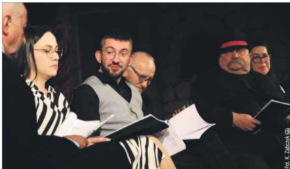
Nasi mieszkańcy wcielili się w role.

Występujący aktorzy, zarówno amatorzy, jak i zawodowi, dostarczyli widzom niezapomnianych