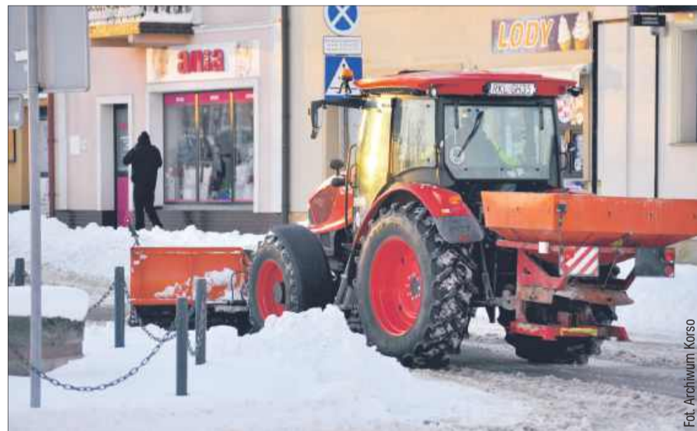
W tym sezonie zima oszczędziła drogowców. Ile kosztowało odśnieżanie?