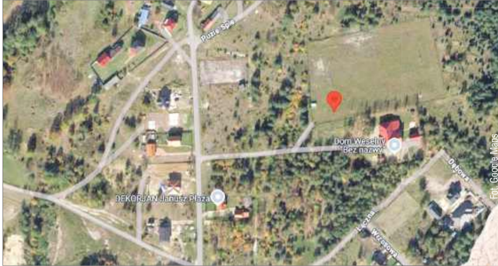
Czerwonym znacznikiem na mapie została oznaczona przybliżona lokalizacja wilczych jarmarków.

Wśród atrakcji, które czekają na odwiedzających, znajdują się stoiska artystów, rękodzielników, rzemieślników oraz producentów lokalnych produktów. Będzie można tam zna-