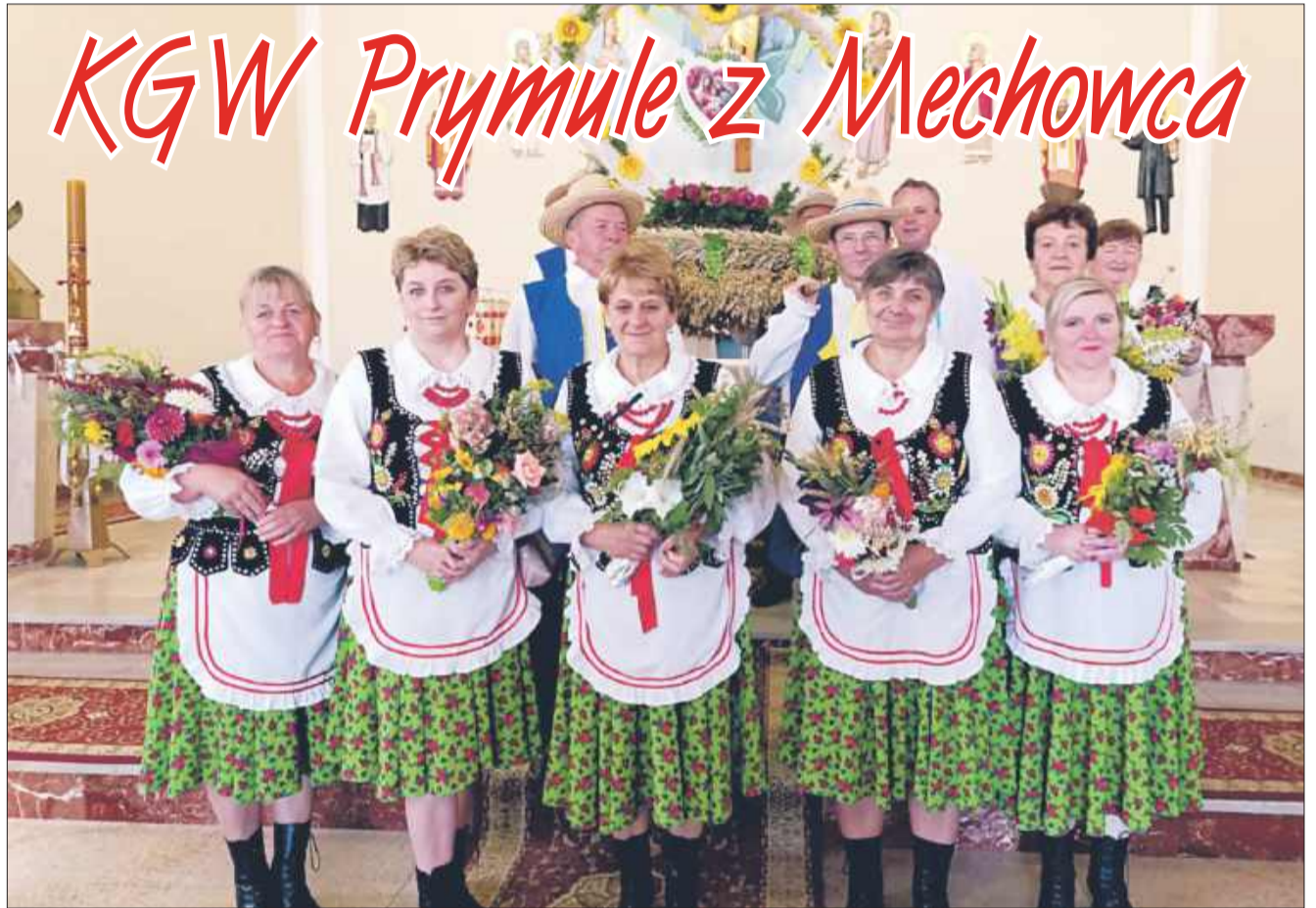
Nazwa koła „Prymule” pochodzi od wdzięcznych i kolorowych kwiatów, zwiastujących wiosnę.

Jednym z najważniejszych wydarzeń organizowanych przez KGW „Prymule” jest coroczne Święto Kapusty, które na stałe wpisało się w kalendarz imprez w Mechowcu, organizowane w pierwszą niedzielę września. To wydarzenie przyciąga nie tylko mieszkańców, ale także gości z całej gminy Dzikowiec i okolic. Podczas tego święta nie brakuje lokalnych przysmaków, występów zespołów ludowych, a także atrakcji dla najmłodszych. Na scenie pojawiają się kapele ludowe, występy, a panie z „Prymul” dbają zawsze o rado-