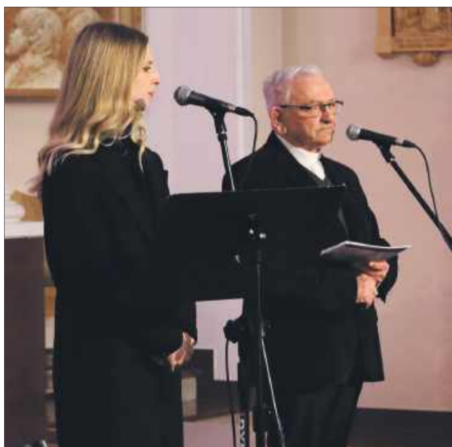
Był to czas zadumy i refleksji.