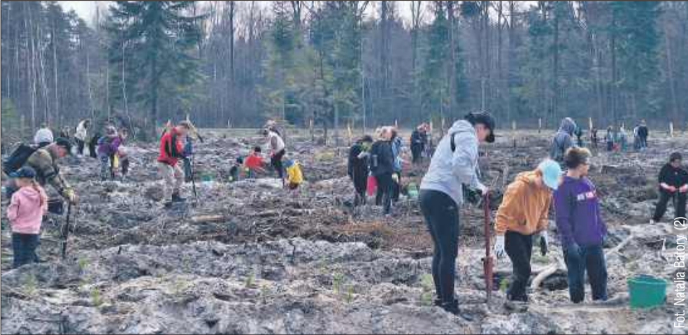
W sadzeniu lasu wzięli udział także uczniowie.