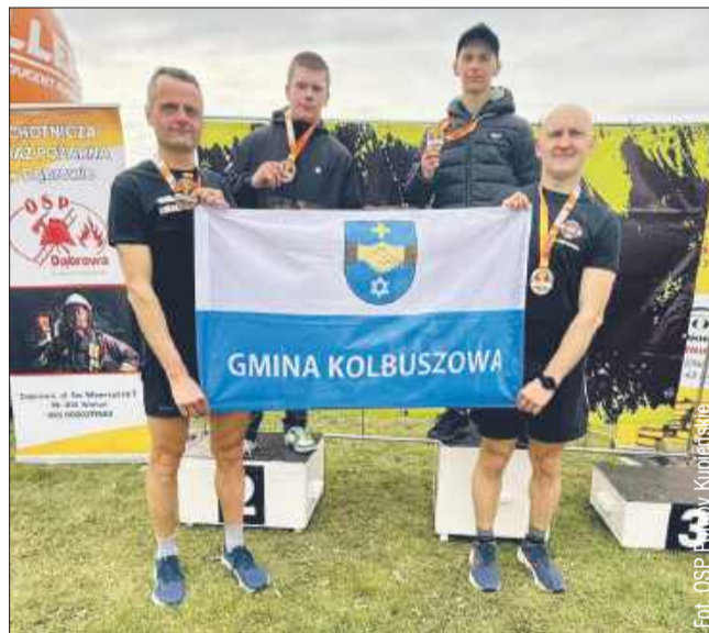
Strażacy z Porąb Kupieńskich reprezentowali kolbuszowską gminę.