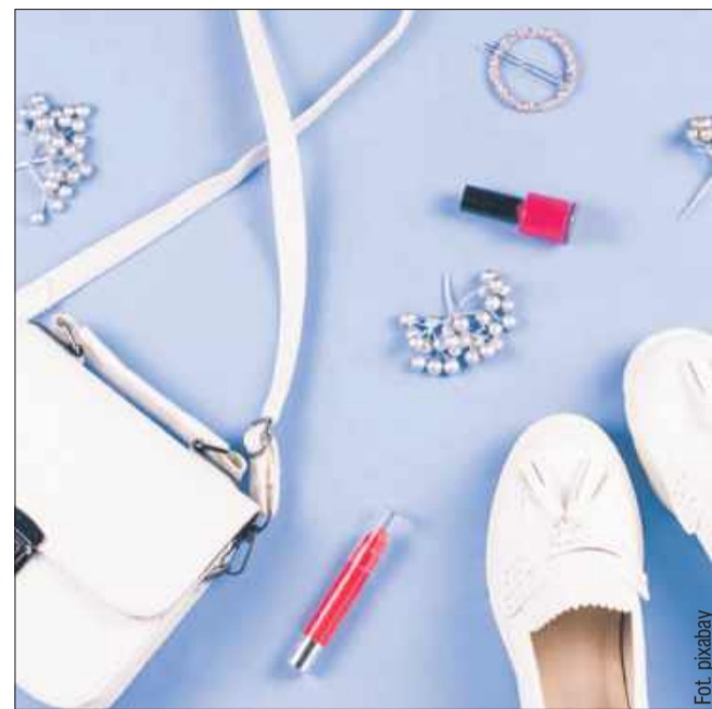
Mokasyny modne wiosną 2025.

Będą świetnym uzupełnieniem większości stylizacji. Dobrze wyglądają zarówno z jeansami, zwiewną sukienką, jak i materiałowymi spodniami. Sprawdzają się nie tylko podczas weekendowego wypadu za miasto, ale można je nosić również w miejskich stylizacjach. Oprócz bieli można zdecydować się na inne, subtelne barwy. Pudrowy czy beż to również dobry wybór. Będą pasować do więk-