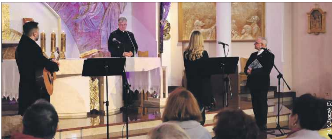
Koncert rozpoczął się od przemówienia proboszcza.

„Golgota Jasnogórska” to nie tylko koncert, ale także sposób na refleksję nad Wielkim Tygodniem, który zbliża się wielkimi krokami. Takie wydarzenie stanowi doskonałą okazję, by wspólnie przeżywać misterium męki Pańskiej, wzbogacone o walory artystyczne. Piękno muzyki łączy się tu z głębokim przeżyciem duchowym, co czyni to wydarzenie jeszcze bardziej wyjątkowym. kz