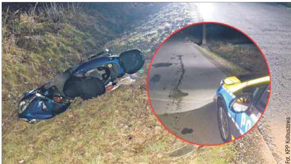
Senior, wracając z kościoła, uległ wypadkowi.

We wtorek (25 marca) po godzinie 19 w Kolbuszowej doszło do wypadku z udziałem 87-letniego kierowcy skutera. Mężczyzna trafił do szpitala.