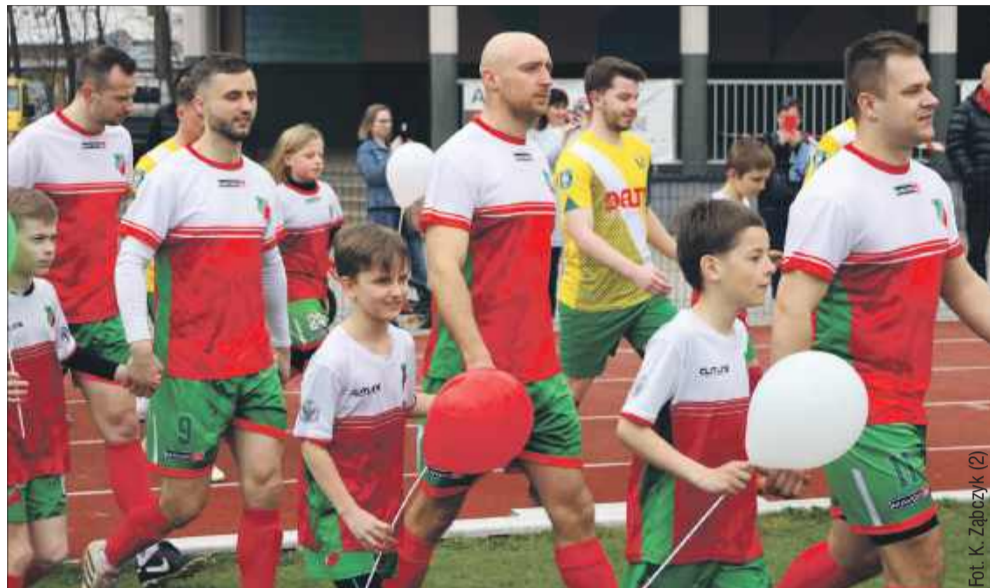
Na murawę wraz z pierwszym składem Kolbuszowianki wyszli najmłodsi wychowankowie Klubu.