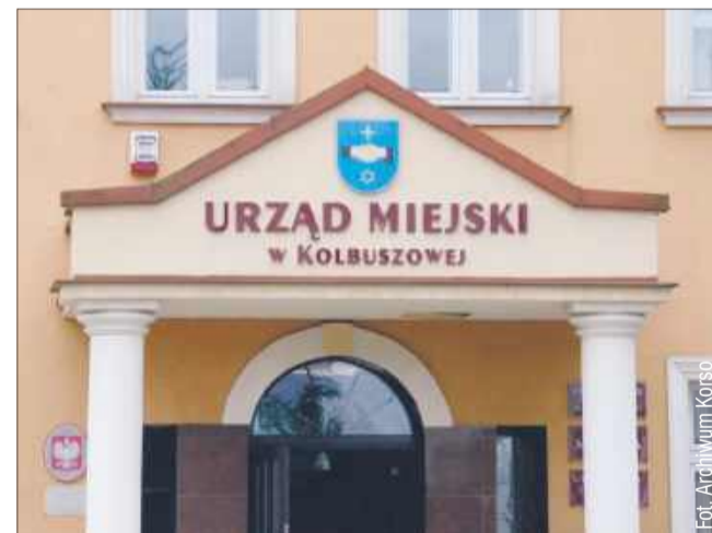
Mieszkańcy Weryni napisali petycję do urzędu.

Zgodnie z petycją, pełna dokumentacja umożliwiłaby