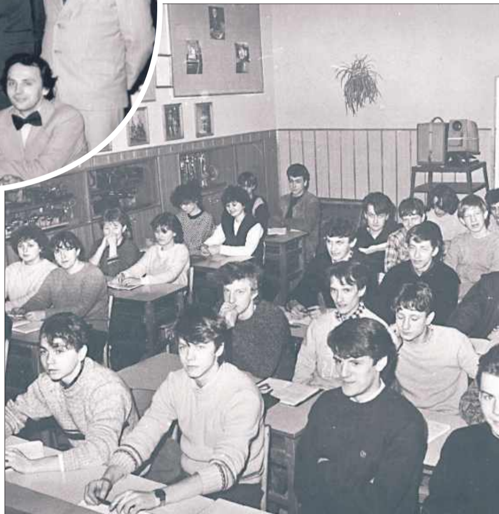
Tak dawniej wyglądała nauka w ZST w Kolbuszowej.