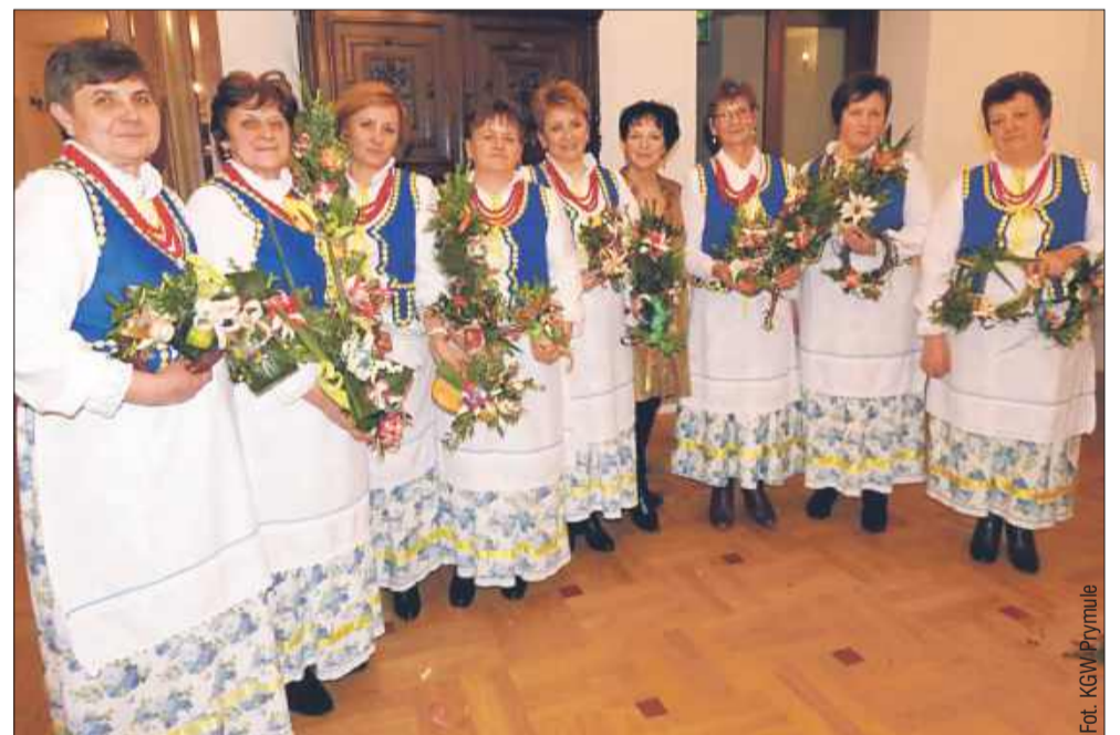
Koło Gospodyń Wiejskich Prymule z Mechowca prężnie działa, kultywując tradycję.