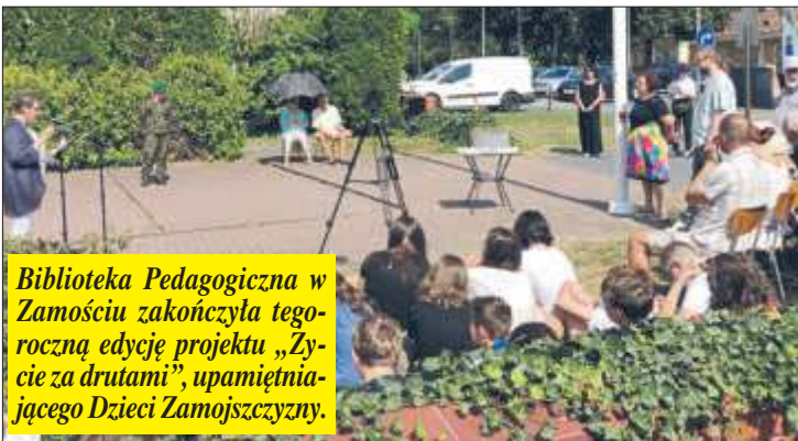
Biblioteka Pedagogiczna w Zamościu zakończyła tegoroczną edycję projektu „Życie za drutami”, upamiętniającego Dzieci Zamojszczyzny.