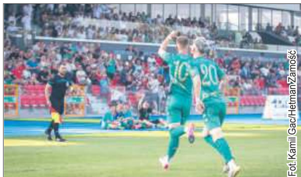
Zamościanie zaaplikowali rywalom 5 bramek.

W 54. Jampol wyłożył piłkę Skibie, a ten dopełnił formalności. Rywale odpowiedzieli golem Misztala , ale na więcej nie było ich już stać. Zamościanie