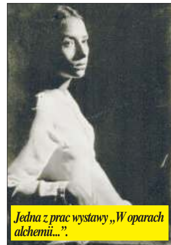
Jedną z prac wystawy „W oparach alchemii...”.

W Biłgorajskim Centrum Kultury od 9 do 28 września można oglądać wystawę ry-