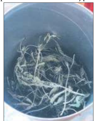
Marihuana była w pojemniku po płatkach.