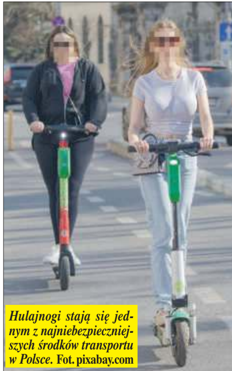
Hulajnogi stają się jednym z najniebezpieczniejszych środków transportu w Polsce.

Tylko w maju, czerwcu i lipcu 2025 roku policja odnotowała