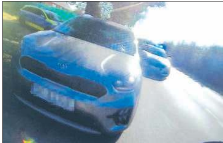
Kierowca kii był nietrzeźwy, jechał za szybko, a na dodatek przewoził dwójkę małych dzieci.