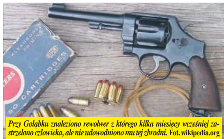
Przy Gołąbku znaleziono rewolwer z którego kilka miesięcy wcześniej zastrzelono człowieka, ale nie udowodniono mu tej zbrodni.

– Wiadomo wam coś na ten temat? – spytał.