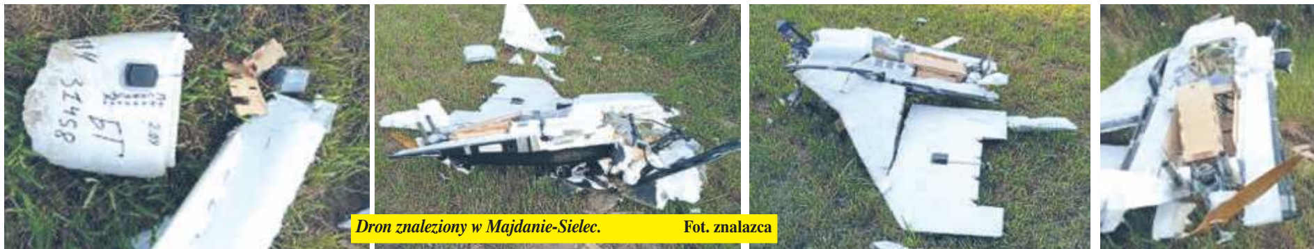
Dron znaleziony w Majdanie-Sielec.