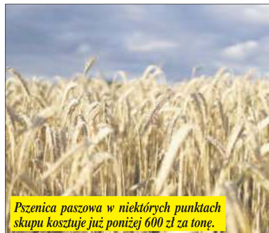
Pszenica paszowa w niektórych punktach skupu kosztuje już poniżej 600 zł za tonę.

Ministerstwo Rolnictwa i Rozwoju Wsi odpowiedziało rolnikom 26 sierpnia, podkreślając przede wszystkim globalny cha-