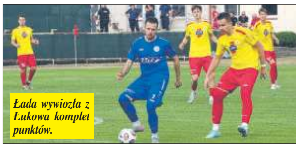
Łada wywiozła z Łukowa komplet punktów.

ki i ostrych spięć z obu stron. Gospodarze nie znaleźli recepty na rozmontowanie defensywy gości, która do końcowych minut nie dała się zakoszyć. Bardziej doświadczeni w ligowych bojach biłgorajanie kontrolowali przebieg boiskowych wydarzeń i pewnie utrzymali korzystny wynik. /MiT/