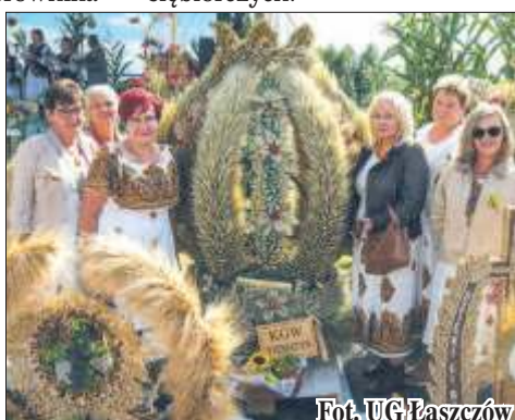
W konkursie tradycyjny wieniec dożynkowy I miejsce zajęło KGW ze Steniatyna.