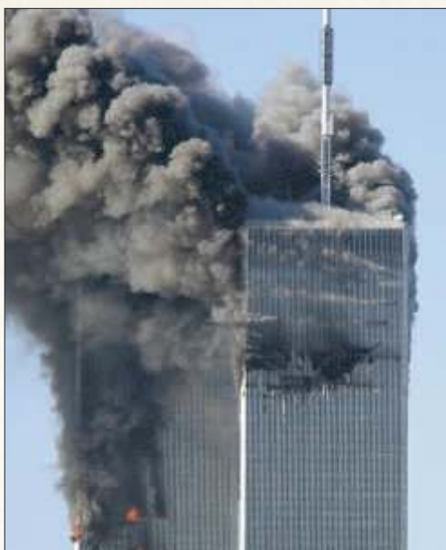
Do zamachu na WTC terrorysty wykorzystali 4 porwane samoloty pasażerskie krajowych amerykańskich linii lotniczych.