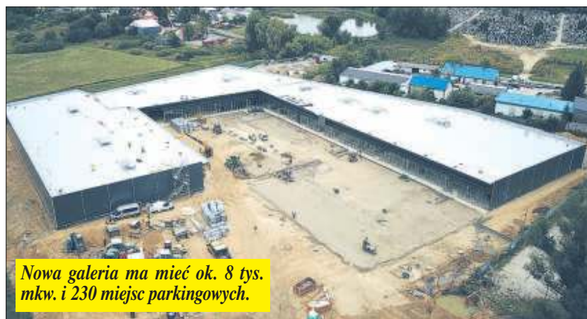
Nowa galeria ma mieć ok. 8 tys. mkw. i 230 miejsc parkingowych.

– Chcemy w ten sposób uzupełnić ofertę istniejącej już galerii i stworzyć kompleksową bazę zakupową dla mieszkańców mia-