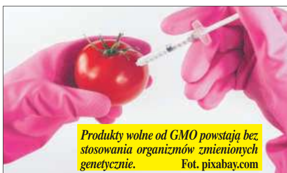
Produkty wolne od GMO powstają bez stosowania organizmów zmienionych genetycznie.