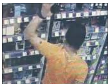
43-letni recydywista próbował ukraść perfumy o wartości blisko 2 tys. zł.

Policjant, przechodząc przez centrum handlowe, zauważył szar-