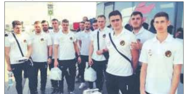
Zamościanie wywalczyli w Warszawie 2. miejsce.

– Dragunas to aktualny mistrz Litwy. Przez 45 minut graliśmy jak równy z równym, a przez co najmniej 15 minut