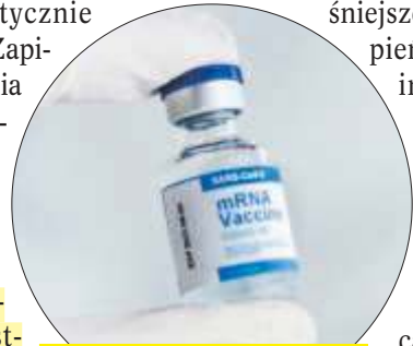
Szczepionka i jej podanie są darmowe.

Narodowy Fundusz Zdrowia zaprasza na bezpłatne badania mammograficzne