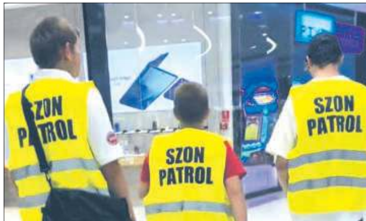
Jeden z „szon patroli” na TikToku.

„Nagrywają i fotografują dziewczyny, których ubiór, wygląd czy zachowanie uznają za „wyzwijające”. Materiały – bez zgody nagrywanych czy fotografowanych – publikują w mediach społecznościowych; głównie na TikToku.”