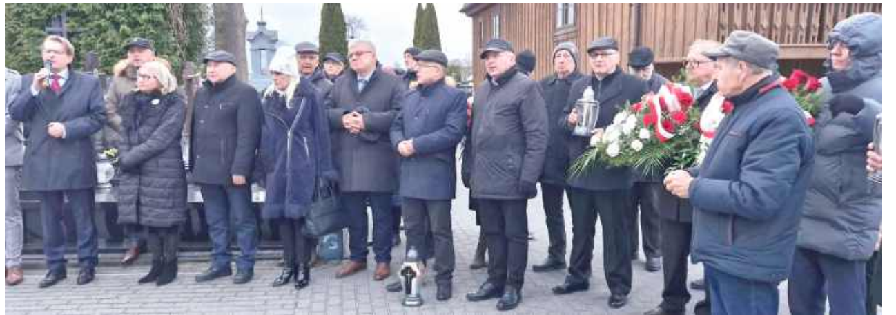
Uroczystości miały na celu upamiętnienie ofiar Zbrodni Katyńskiej oraz tych osób, które zginęły w katastrofie lotniczej pod Smoleńskiem