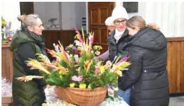
Kiermasz Wielkanocny w Klasztorze w Woli Gułowskiej

6 kwietnia w malowniczej Woli Gułowskiej odbył się tradycyjny kiermasz ozdób wielkanocnych. To coroczne wydarzenie zgromadziło licznych mieszkańców oraz turystów, którzy mieli okazję podziwiać i nabyć ręcznie wykonane dekoracje świąteczne.