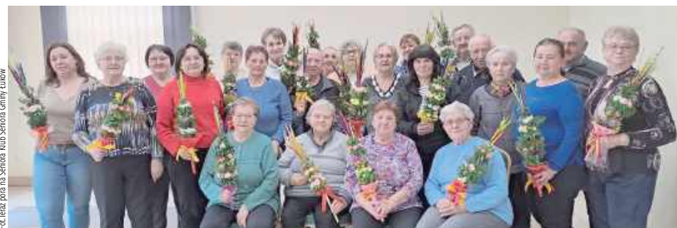
Własnoręcznie wykonane palmy są pięknym symbolem nadchodzących świąt

Seniorzy po raz kolejny spotkali się i z ogromnym zaangażowaniem przygotowali własnoręczne palmy na nadchodzącą Niedzielę Palmową. To spotkanie było okazją do