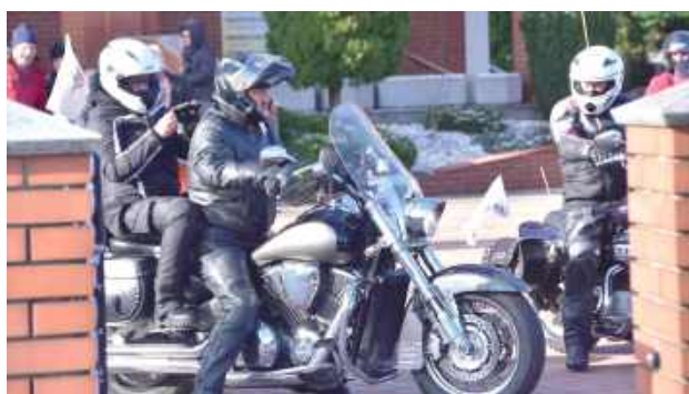
Motocyklowa Droga Krzyżowa w Łukowie

Cała trasa miała na celu połączenie fizycznego wysił-