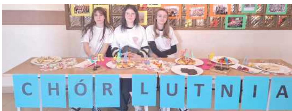
Chór Lutnia w ILO zaprasza kandydatów!

12 kwietnia w Łukowie szkoły średnie otworzyły swoje drzwi dla ósmoklasistów. Przyszli uczniowie mogli zwiedzić placówki, porozmawiać z nauczycielami i uczniami oraz poznać jakie kierunki oferują szkoły.