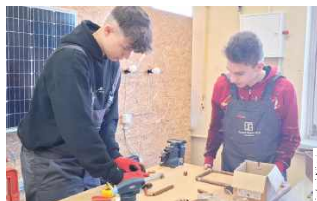
Każdy mógł znaleźć coś interesującego!