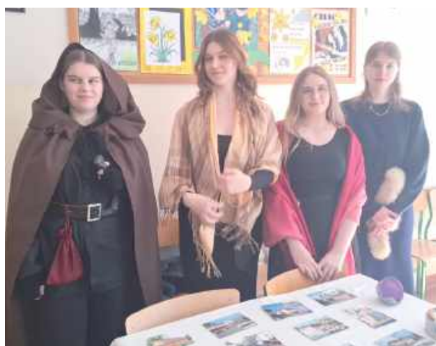
Przyszli uczniowie mogli posłuchać szczerych opinii o szkołach