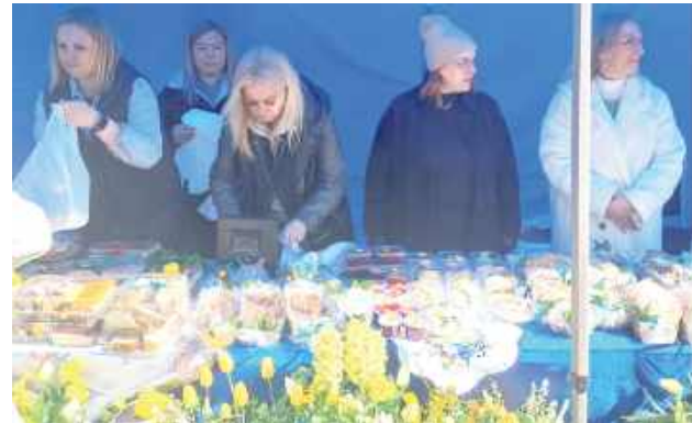
Panie z Sulej zapraszały do zakupu pyszności