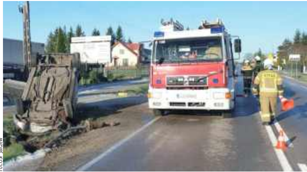
Na łuku drogi 37-latką straciła panowanie nad pojazdem, wjechała do rowu, w wyniku czego auto dachowało

Jak informuje oficer prasowy z KPP Łuków, Marcin Józwiak, kierująca samochodem osobowym marki Opel Zafira, 37-letnia mieszkanka gminy Ulan-Majorat, na łuku drogi straciła panowanie nad pojazdem, wjechała do rowu, a następnie doszło do przewrócenia się auta na dach.