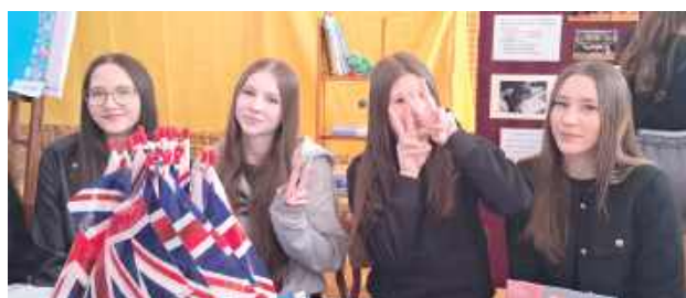
W „Medyku” do stanowisk językowych ustawiały się kolejki