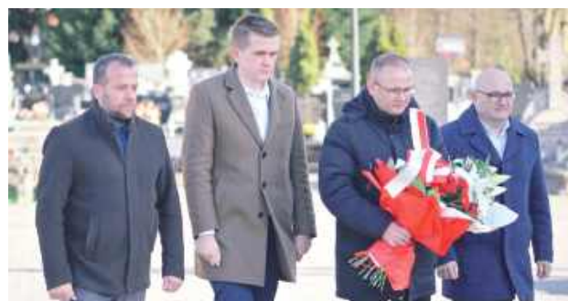
Przedstawiciele samorządu miejskiego rankiem 10 kwietnia złożyli okolicznościowe kwiaty pod pomnikiem znajdującym się na cmentarzu parafialnym św. Rocha w Łukowie