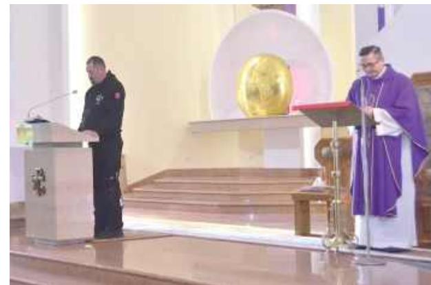
Motocyklowa Droga Krzyżowa w Łukowie

ty, które umożliwiły głębsze przeżycie Męki Pańskiej. W Międzyrzeczu Podlaskim pielgrzymka zakończyła się