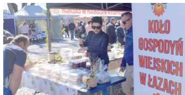
Co by tu pysznego wybrać ze stoiska KGW Łazy?