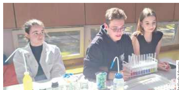
Dużym zainteresowaniem cieszyły się stanowiska klas o profilu chemicznym