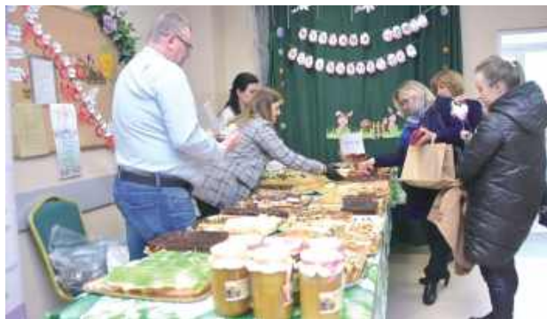
Kiermasz Wielkanocny w Klasztorze w Woli Gułowskiej

Żołnierzy Września stanowiło idealne tło dla świątecznych stoisk, podkreślając duchowy charakter wydarzenia. Wydarzenie nawiązywało do tradycji