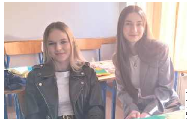
Od rana młodzież odwiedzała swoje wymarzone szkoły średnie

12 kwietnia w Łukowie szkoły średnie otworzyły swoje drzwi dla ósmoklasistów. Przyszli uczniowie mogli zwiedzić placówki, porozmawiać z nauczycielami i uczniami oraz poznać jakie kierunki oferują szkoły.