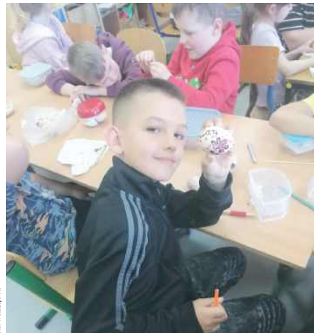
Uczniowie wykazali się talentem i kreatywnością tworząc pisanki

GMINA WOJCIESZKÓW W Szkole Podstawowej w Oszczepalinie odbyły się warsztaty wielkanocne, podczas których uczniowie mieli okazję poznać tradycyjne metody zdobienia pisanki z wykorzystaniem wosku.