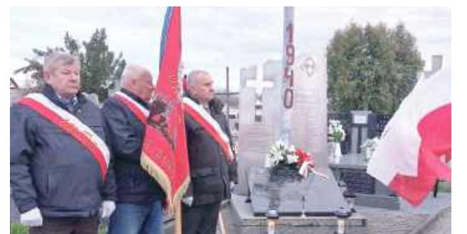
W czwartek, 10 kwietnia w Łukowie odbyły się powiatowe obchody 85. rocznicy Zbrodni Katyńskiej oraz 15. rocznicy Katastrofy Smoleńskiej

O godzinie 18 w kościele Podwyższenia Krzyża Św. odprawiona została Msza Święta w intencji ofiar, a następnie na cmentarzu św. Rocha przy Krzyżu Katyńskim delegacje