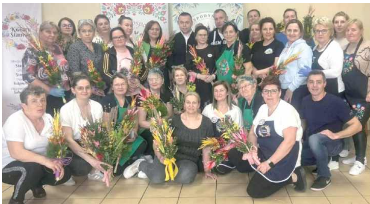
Podczas warsztatów uczestnicy mieli okazję wziąć udział zarówno w zajęciach rękodzielniczych, jak i kulinarnych

W warsztatach uczestniczyły: KGW Kwiaty Staniluk