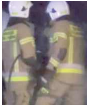
W akcji uczestniczyły jednostki straży z OSP Okrzeja, OSP Wola Okrzejska i JRG Łuków

Obok warsztatu samochodowego w Okrzei (Kol. Szczepaniec) doszło do pożaru.