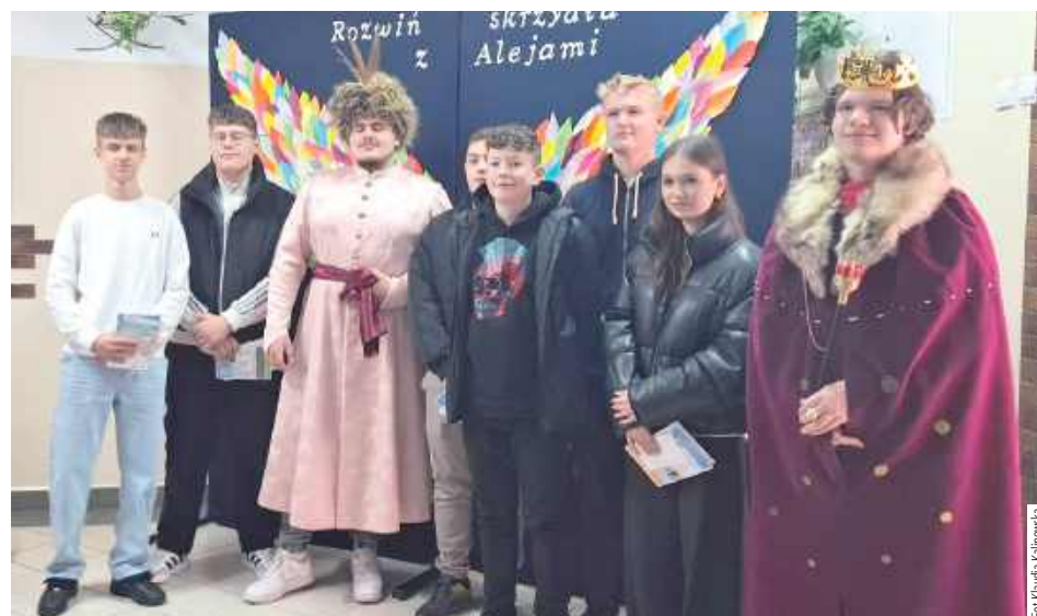
Tego dnia „Aleje” były pełne młodzieży