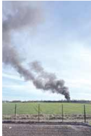
Pożar było widać z daleka