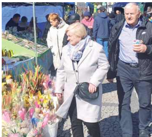
Na stoiskach każdy znalazł coś ciekawego dla siebie

W Niedzielę Palmową, 13 kwietnia Plac Solidarności i Wolności w Łukowie tętnił życiem. Odbył się tam Jarmark Wielkanocny, który przyciągnął tłumy mieszkańców.