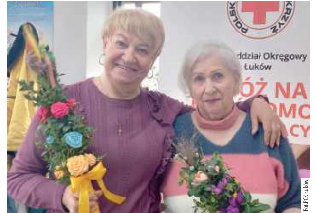
Wspólne warsztaty angażowały zarówno ręce, jak i serca uczestników

Organizatorzy dziękują za wyjątkową energię i wspólną pracę wszystkim uczestnikom za podtrzymywanie tej pięknej, świątecznej tradycji.