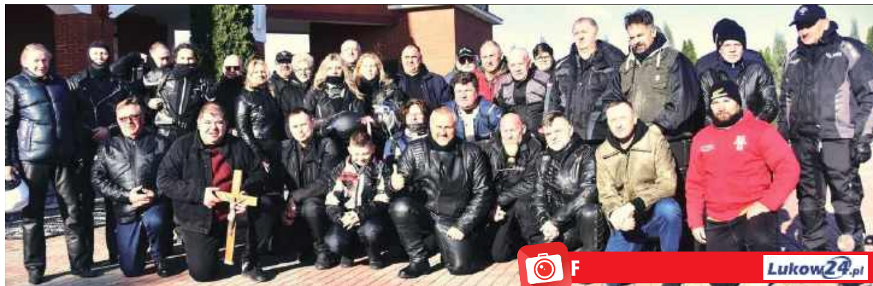
Motocyklowa Droga Krzyżowa w Łukowie

W niedzielę, 6 kwietnia, w Łukowie odbyła się wyjątkowa inicjatywa, która połączyła pasję motoryzacyjną z duchowością – Ekstremalna Droga Krzyżowa organizowana przez Motoweteranów. Uczestnicy w licznej grupie motocyklistów ruszyli na trasę, której celem była głęboka modlitwa i refleksja.