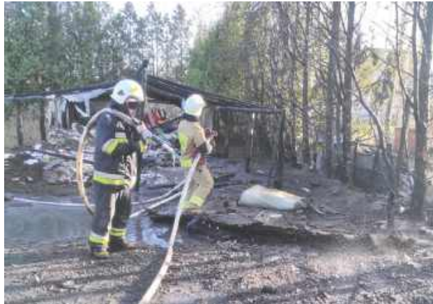
Joanna Niecko Strażacy gasili pożar szopy w miejscowości Podgaj

- 12 kwietnia o godz. 16.37 nasza jednostka została zadysponowana do pożaru szopy w miejscowości Podgaj - informuje OSP KSRG Dąbie.