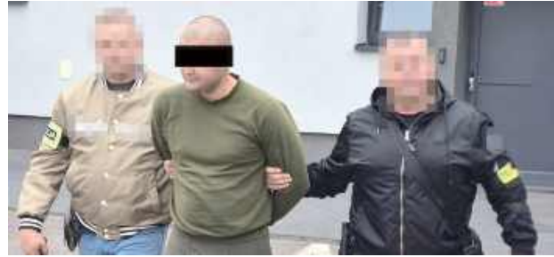
Mężczyzna miał uciec z miejsca zdarzenia, ale mundurowym namierzenie go zajęło kilkadziesiąt minut. Jak podają funkcjonariusze, odnaleźli 28-latka ukrywającego się w miejscowości oddalonej o kilka kilometrów od Łukowa