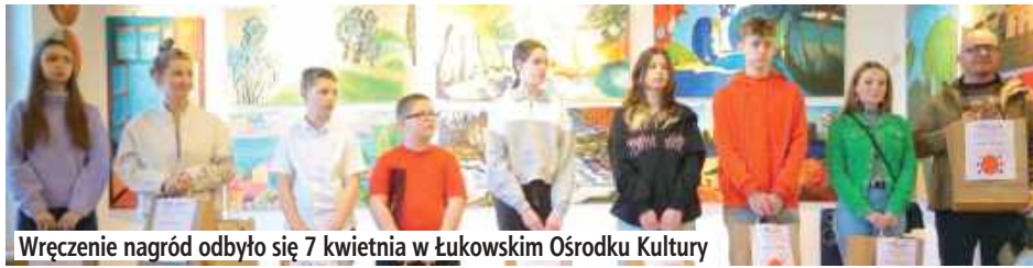
Wręczenie nagród odbyło się 7 kwietnia w Łukowskim Ośrodku Kultury

W Łukowskim Ośrodku Kultury odbyło się uroczyste podsumowanie konkursów plastycznych „Kartka Wielkanocna 2025” i „Wielkie Jajo Wielkanocne 2025”.