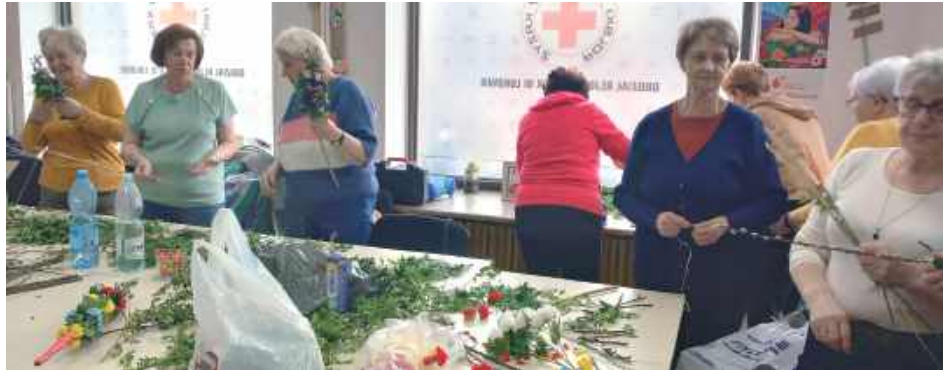
Tworzenie palm przyniosło wiele radości i wspomnień

Seniorzy wspólnie przygotowali piękne, kolorowe palmy. Wyróżniali się niezwykłą cierpliwością i precyzją podczas pracy. Spotkanie było także okazją do dzielenia się wspomnieniami oraz opowieściami o dawnych tradycjach wielkanocnych.