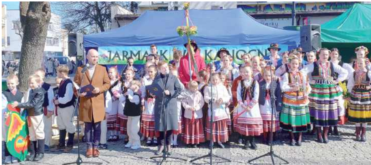
Wydarzenie rozpoczęło występ Zespołu Pieśni i Tańca „Jata”