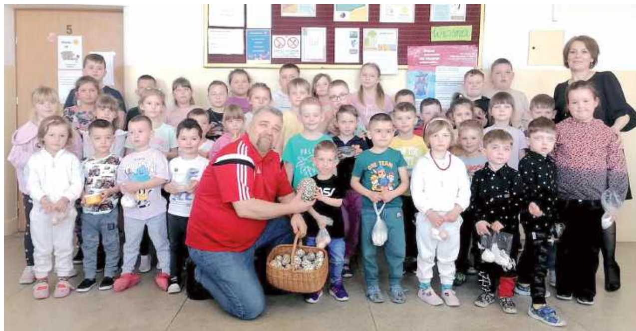
Najmłodszy uczniowie z poznawali świąteczne tradycje, ćwiczyli cierpliwość i precyzję, robiąc pisanki