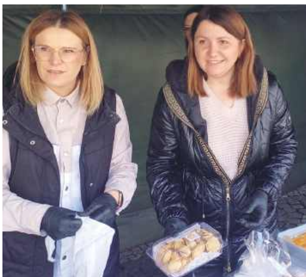
Panie z KGW Turze Rogi zapraszały na pyszne ciasta i jajeczka