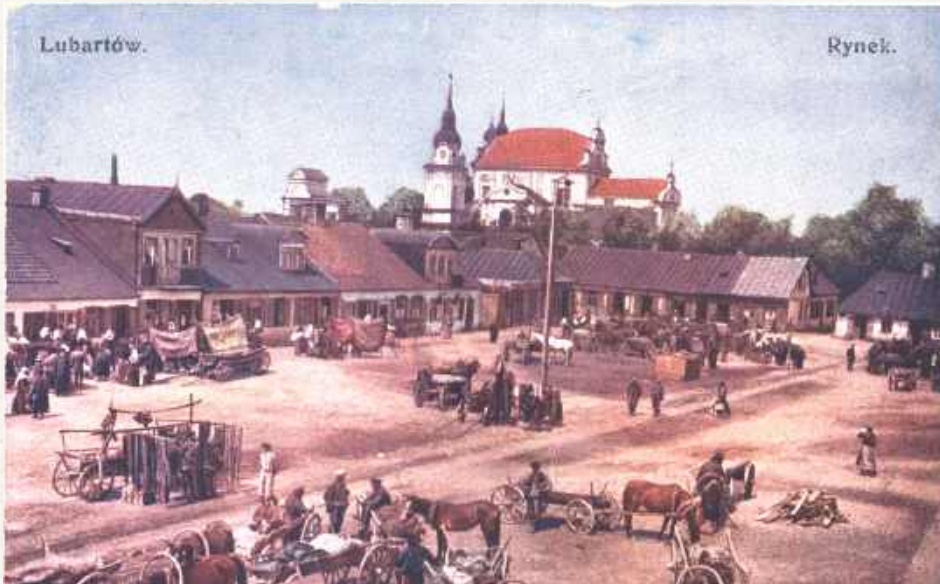
Rynek w Lubartowie, w tle kościół św. Anny. Kolorowane zdjęcie z lat dwudziestych, z czasów, kiedy burmistrzem miasta był m.in. mąż Wandy Śliwiny. Rynek I był miejscem handlu między zjeżdżającymi z okolicznych wiosek włościanami, zwożącymi swoje produkty rolne (acz nie tylko - o tym w następnej części) a mieszkańcami - w dużej części żydowskimi sklepikarzami i handlarzami, wprowadzającymi go do dalszego obrotu

W 2012 r. Wandę Śliwinę wpisano do księgi zasłużonych dla Lubartowa, acz jej wkład w rozwój życia kulturalnego, społecznego i naukowego w tym mieście zasługuje na znacznie poważniejsze uhonorowanie. Najwięcej aktualności zachowały jej prace dotyczące etnograficznych obserwacji zwyczajów i kultury materialnej ludu lubartowskiego lat 20. XX wieku zawierające również próbę rekonstrukcji dawniejszych elementów.