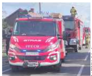
W akcji gaśniczej uczestniczyły jednostki straży z JRG Łuków, OSP Charlejew, OSP Wola Gułowska oraz dwa zastępy z OSP Serokomla

5 kwietnia o godzinie 13.10 służby ratunkowe otrzymały zgłoszenie o pożarze pomieszczenia gospodarczego w Krzówce, w którym przechowywane było m.in. drewno.