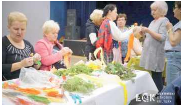
W warsztatach wielkanocnych, które odbyły się 7 kwietnia, wzięły udział słuchaczki Łukowskiego Uniwersytetu Trzeciego Wieku