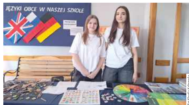
„Warszawska” zaprasza nowych uczniów!