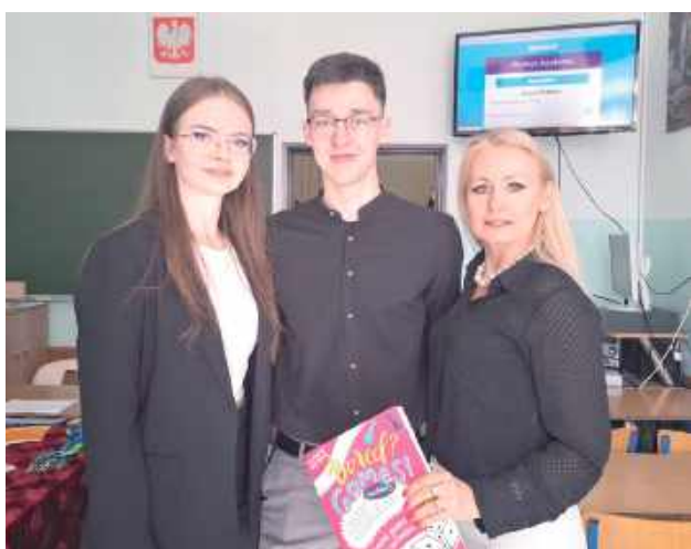
Dni otwarte w „Rolniku”