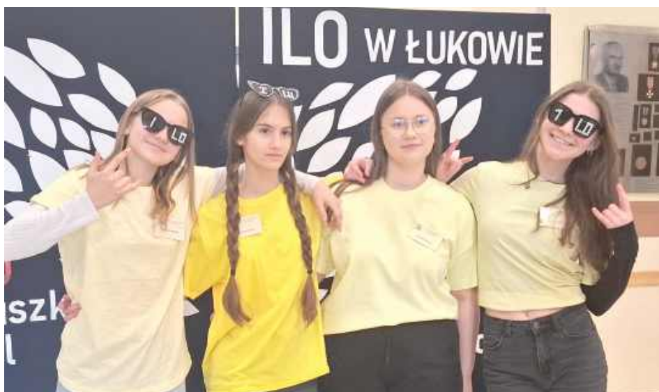
Szkoły otworzyły swoje drzwi dla ósmoklasistów