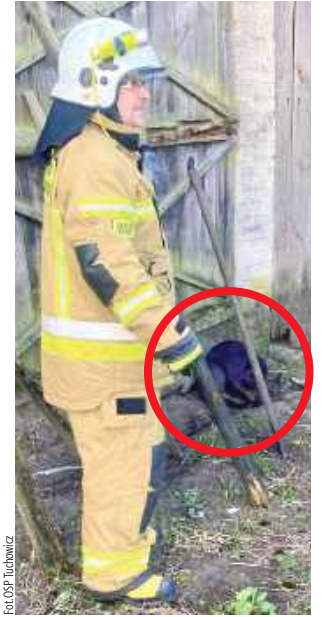
Zwierzę zostało przetransportowane do lasu

- Zwierzę zostało bezpiecznie przetransportowane do lasu, do swojego naturalnego środowiska. Wszystko zakończyło się pomyślnie - bóbr jest cały i bezpieczny - dodaje OSP Tuchowicz.