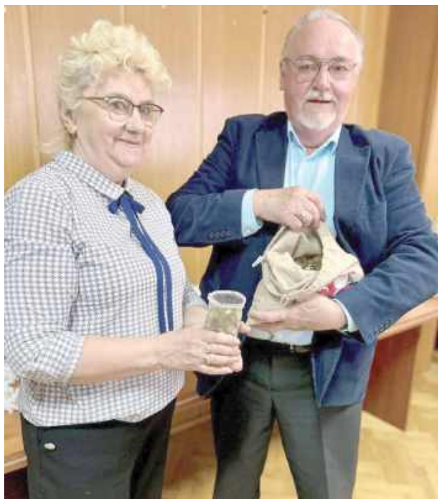
Klub Seniora „Raj” zebrał aż 15 kg monet

Kluby Seniora działające przy Łukowskiej Spółdzielni Mieszkaniowej wzięły udział w akcji „Gorączka Złota” organizowanej przez Polski Czerwony Krzyż.