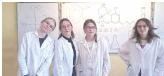
Młodzież dzieliła się z odwiedzającymi swoją wiedzę