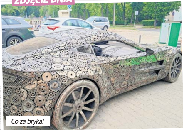
Co za bryka!