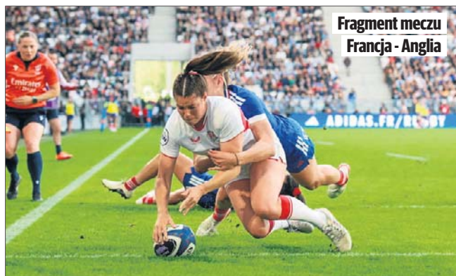
Fragment meczu Francja - Anglia