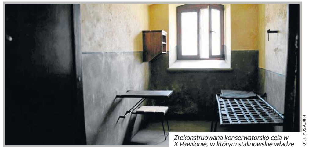
Zrekonstruowana konserwatorsko cela w X Pawilonie, w którym stalinowskie władze więziły i torturowały polskich patriotów.

Wyrok jest nieprawomocny. Prokurator złożył od niego odwołanie.