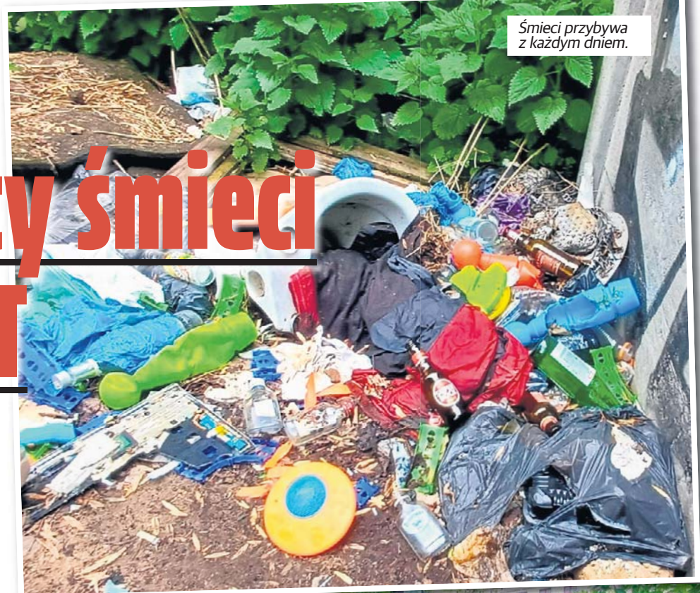
Śmieci przybywa z każdym dniem.

Zniszczony betonowy płot, porzucane śmieci, połamane drzwi, stary sedes, podarte ubrania, rozbite szkło i opuszczony kontener wypełniony odpadami. Tak wygląda otoczenie siedziby Zarządu Dróg i Transportu w Łodzi przy ul. Tuwima 36. Nasi Czytelnicy alarmują, że miejsce od dawna zamienia się w dzikie wysypisko i przyciąga kolejne osoby podrzucające śmieci.