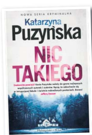
Katarzyna Puzyńska, „Nic takiego”, Wydawnictwo: Prószyński i S-ka, Warszawa 2025

We mnie ciągle coś krzyczy. Wątpliwości, lęki, nadmierna być może wrażliwość na pewne tematy. Często staram się trochę ten zamęt w mojej głowie uspokoić. Nie zawsze się udaje. Trzeba jednak pamiętać, że choć w życiu to może być trudne, to w pisaniu pomaga. Bo dzięki własnym rozterkom, czy wysokiej wrażliwości, można lepiej wczuć się w bohaterów. Coś za coś.