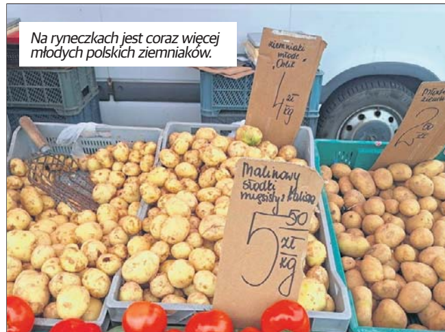
Na rynekach jest coraz więcej młodych polskich ziemniaków.