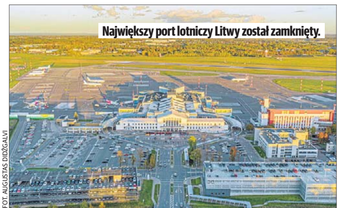
Największy port lotniczy Litwy został zamknięty.

Zatrzymani to, mężczyźni w wieku od 48 do 62 lat. Zarzuca się im działania wywiadowcze - rozpoznawanie rozmieszczenia wojsk NATO na terytorium RP oraz wytwarzanie i udostępnianie materiałów o charakterze propagandowym i dezinformacyjnym.