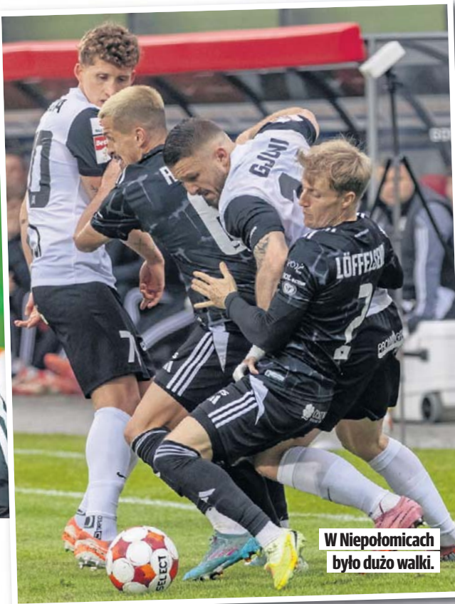
W Niepołomicach było dużo walki.