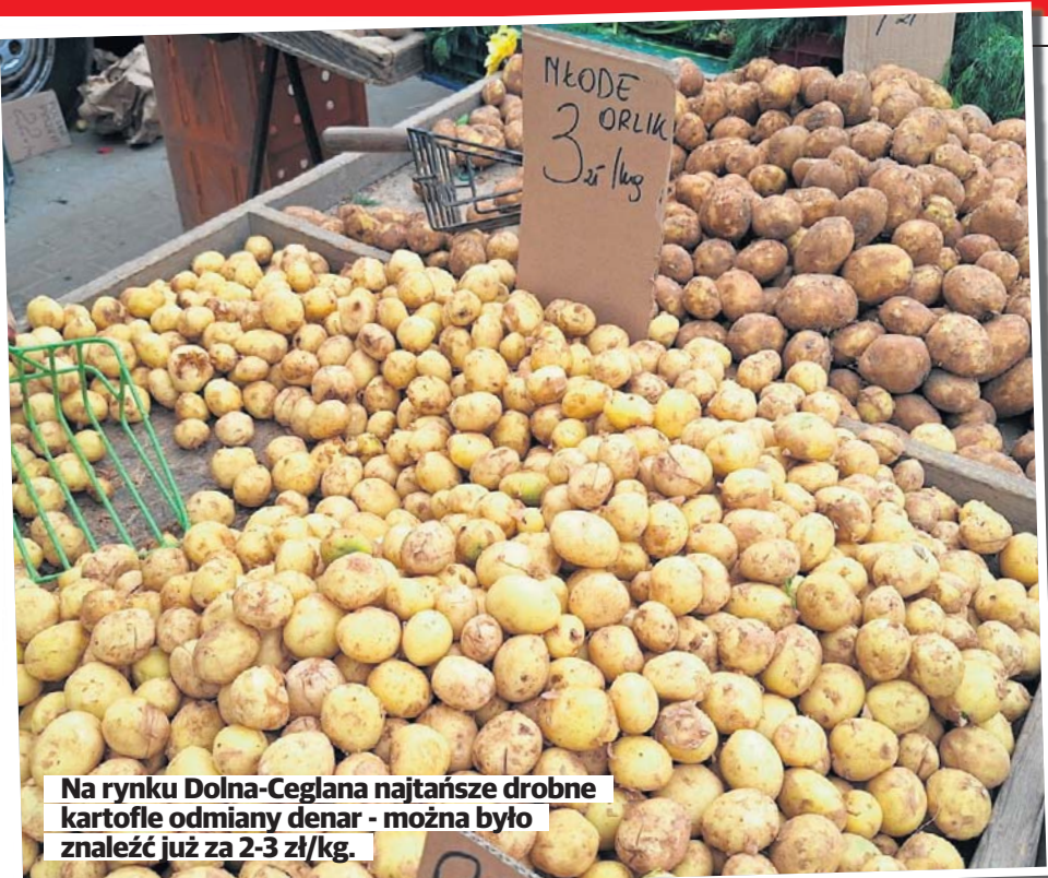
Na rynku Dolna-Ceglana najtańsze drobne kartofle odmiany denar - można było znaleźć już za 2-3 zł/kg.