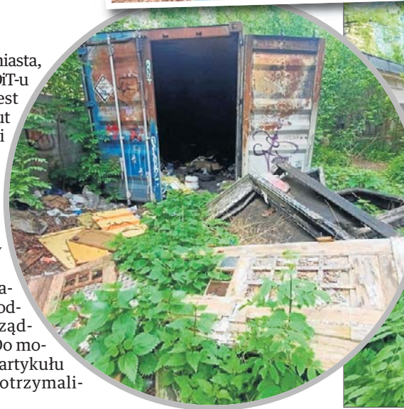
- Wstyd to mało powiedziane. To miejsce wygląda po prostu obrzydliwie - podkreślają mieszkańcy.