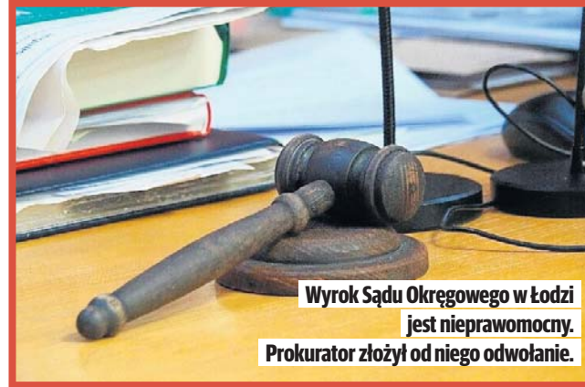
Wyrok Sądu Okręgowego w Łodzi jest nieprawomocny. Prokurator złożył od niego odwołanie.

Rodzice, żona i dzieci - tylko oni mogą dziedziczyć Ustawa z 23 lutego 1991 r. stanowi, że takim skazanym