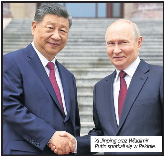
Xi Jinping oraz Władimir Putin spotkali się w Pekinie.

Chiński przywódca zwrócił uwagę na sytuację na Bliskim Wschodzie, podkreślając, że