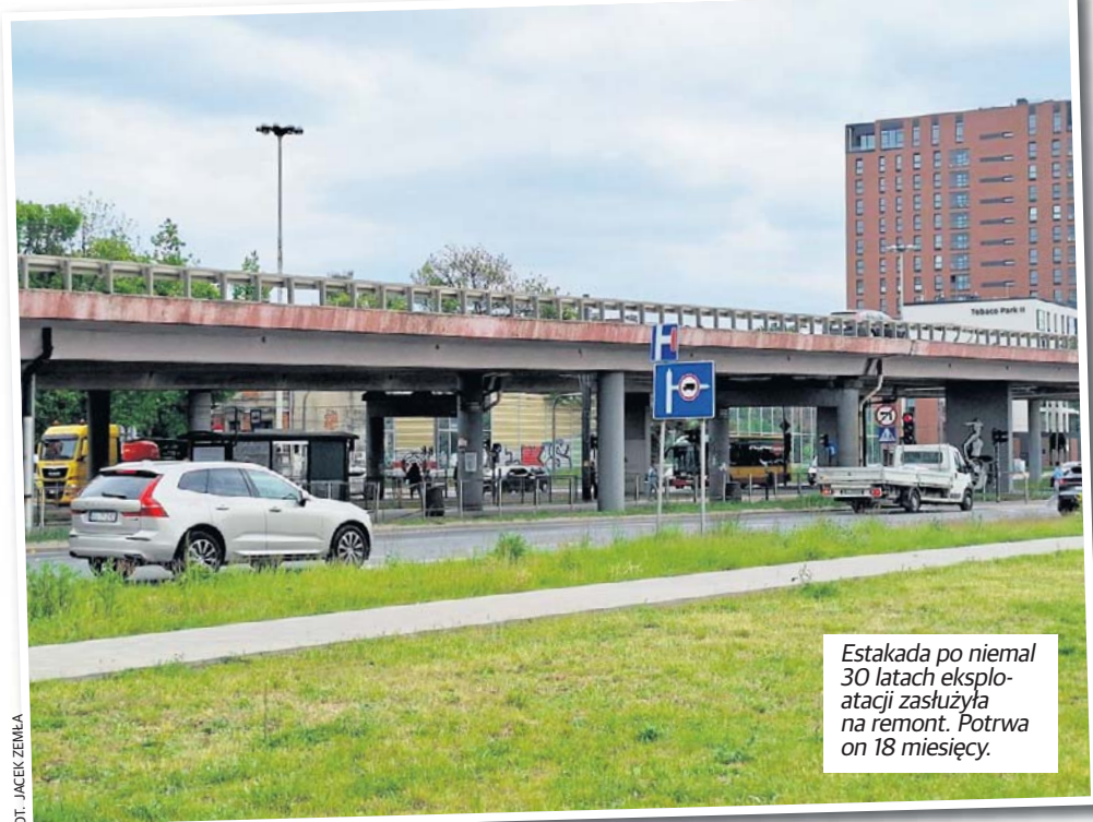
Estakada po niemal 30 latach eksploatacji zasłużyła na remoncie. Potrwa on 18 miesięcy.

W połowie czerwca ma się zacząć remont zachodniej części estakady w ciągu al. Włókniarzy przy dworcu Kaliskim. Wyłączona zostanie bieżąca nad skrzyżowaniem jezdni w kierunku al. Jana Pawła II. Ruch dwukierunkowy zostanie wprowadzony na części wschodniej. Przejazdna przez cały czas, ale z możliwymi punktowymi zwichnięciami będzie dolna jezdni. Roboty potrwać aż do jesieni 2027 roku.