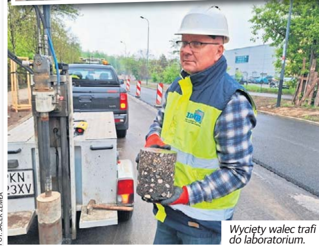
Wycięty walec trafi do laboratorium.

Wydobyty w ten sposób rdzeń trafi do specjalnego laboratorium drogownictwa, gdzie zostanie dokładnie zbadaany materiał, z którego wykonano drogę, jego parametry fizyko-chemiczne, odporność na zgniatanie i inne niekorzystne działania, które mogą występować na drodze podczas jej eksploatacji. Fuszerka nie ma prawa się przesuwać, tak jak to miało miejsce w przypadku ulicy Boya-Zeleńskiego, gdzie świeżo wyremontowaną drogę trzeba było po roku rozetrzeć i wybudować jeszcze raz.