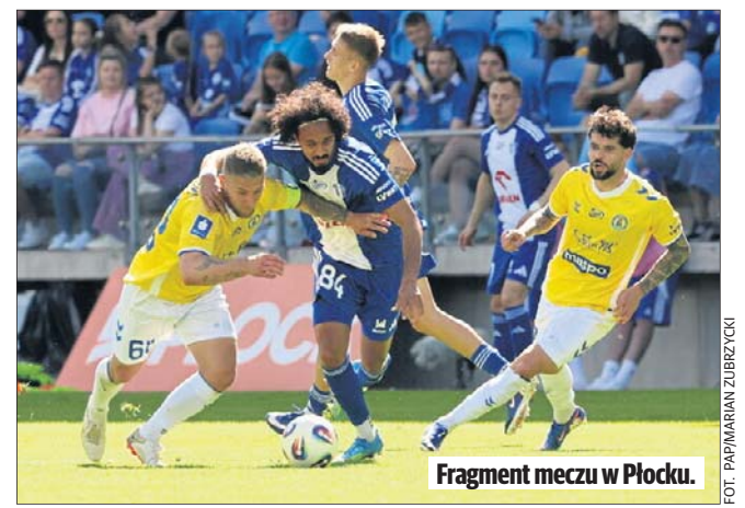
Fragment meczu w Płocku.