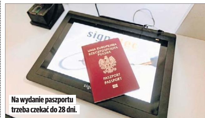
Na wydanie paszportu trzeba czekać do 28 dni.

W ubiegłym roku w Łodzi złożono blisko 57 tys. wniosków o paszport, a w województwie 130 tys. Dla porównania w 2020 roku takich wniosków wpłynęło odpowiednio 19 i 35 tys. Napływ wniosków o wydanie paszportu rozpoczął się wraz z wybuchem wojny na Ukrainie. W latach 2022-2024 aż 300 tys. mieszkańców Łódzkiego, z czego połowę stanowili łodzianie.