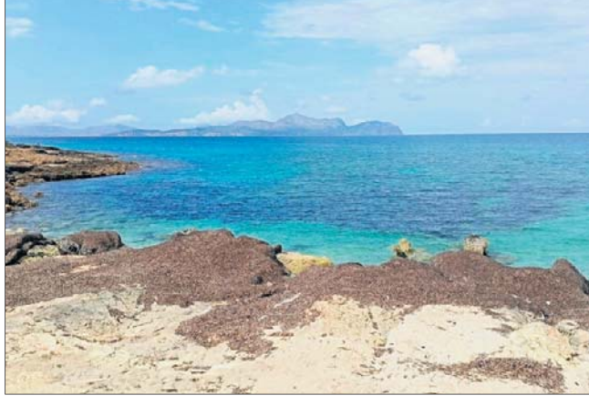
Plaża na Majorce