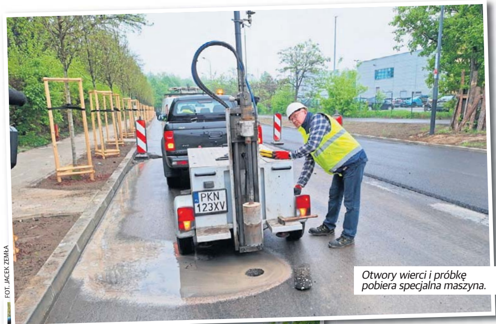
Otwory wierci i próbkę pobiera specjalna maszyna.

Z nawierzchni ulicy Szparagowej pobrano próbkę materiału wierząc w asfalcie dziury.