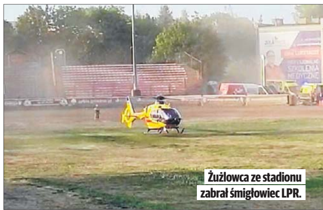
Żuźłowca ze stadionu zabrał śmigłowiec LPR.