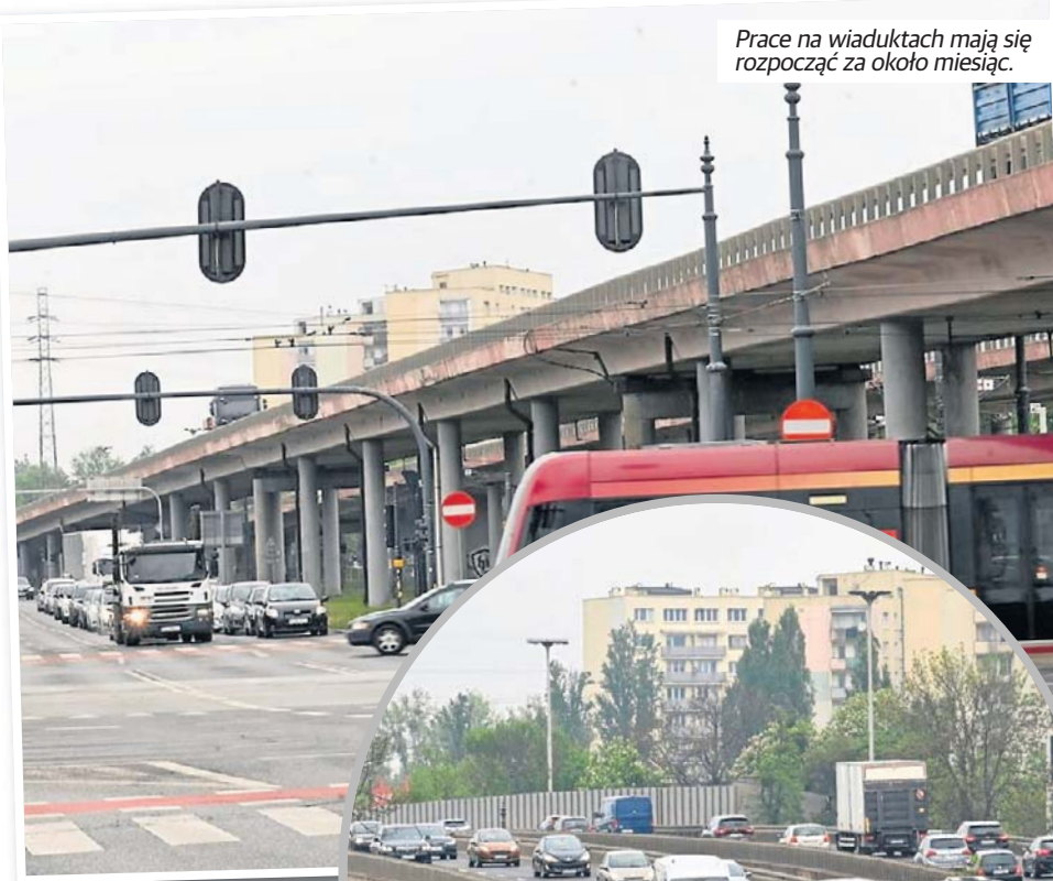
Prace na wiaduktach mają się rozpocząć za około miesiąc.

O fatalnym stanie tego newralgicznego wiaduktu pisaliśmy w „Expressie Ilustrowanym” kilkakrotnie. Gołym okiem można na nim zauważyć dziury, spękania, ubytki betonu i korozję zbrojeń. Te-