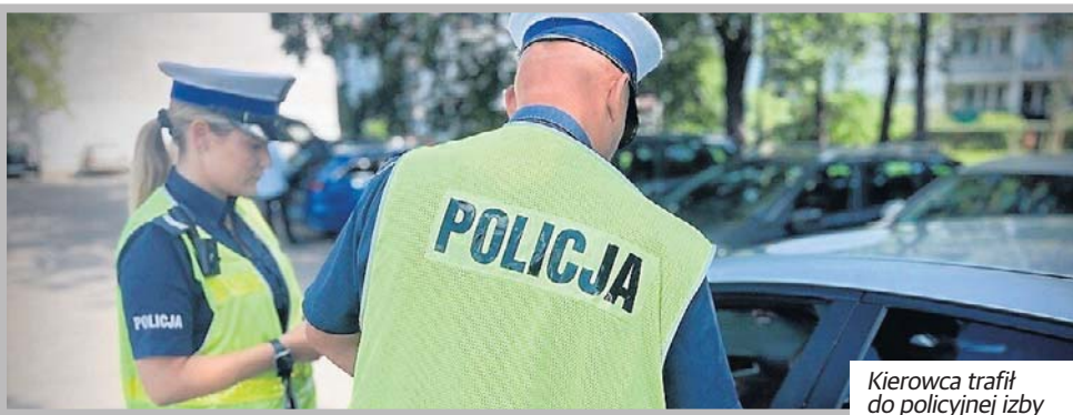
Kierowca trafił do policyjnej izby zatrzymań.

Kierowca mercedesa miał 1,8 promila alkoholu w organizmie. Grozi mu do trzech lat pozbawienia wolności.