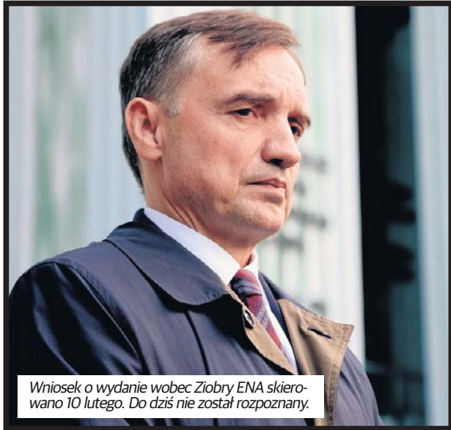
Wniosek o wydanie wobec Ziobry ENA skierowano 10 lutego. Do dziś nie został rozpoznany.

- Kwestia, której prokuratura starała się zaradzić, ale taki jest fakt: mianowicie Zbigniew Ziobro nie jest osobą poszuki-