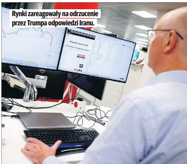
Rynki zareagowały na odrzucenie przez Trumpa odpowiedzi Iranu.

Prezydent nie ujawnił szczegółów odpowiedzi Ira-