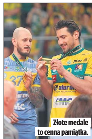
Złote medale to cenna pamiątka.

● Hokeiści Anaheim Ducks wygrali przed własną publicznością z Vegas Golden Knights 4:3 i doprowadzili do remisu 2-2 w rywalizacji play off do czterech zwycięstw w półfinale Konferencji Zachodniej ligi NHL.