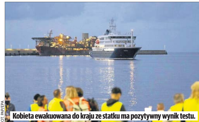
Kobieta ewakuowana do kraju ze statku ma pozytywny wynik testu.

Podczas konferencji prasowej w Moskwie 9 maja Putin podkreślił, że Erywań powinien „jak najszybciej określić swój wektor geopolityczny”. Jako mechanizm takiego rozwiązania zaproponował przeprowadzenie ogólnokrajowego referendum w sprawie integracji z Unią Europejską. Putin zaznaczył, że byłoby to „uczciwe wobec obywateli Armenii oraz Rosji jako głównego partnera gospodarczego”.