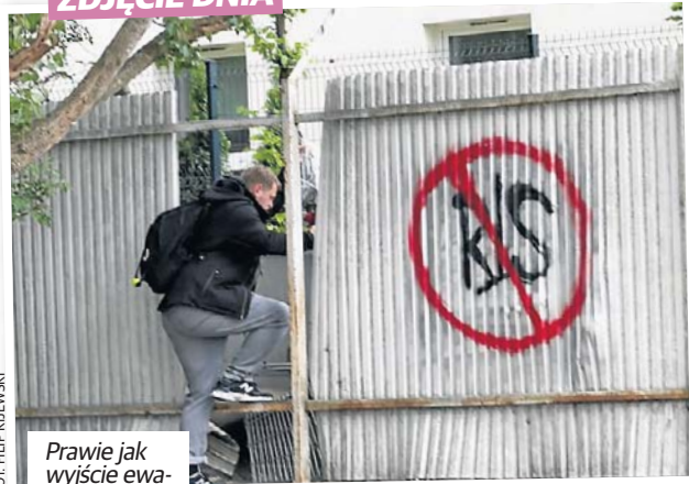
Prawie jak wyjście ewakuacyjne...