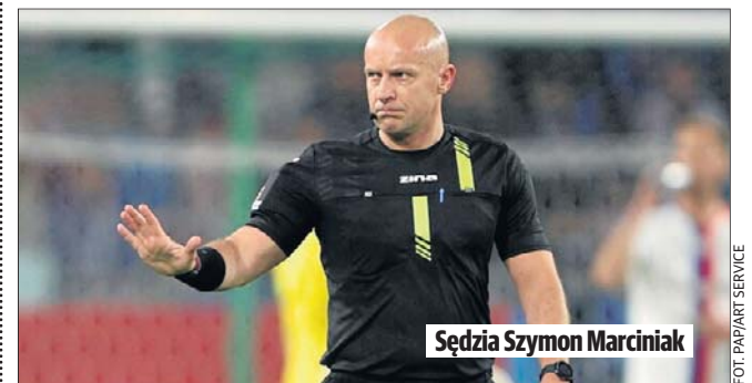
Sędzia Szymon Marciniak