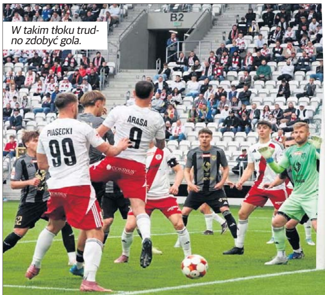
W takim tłoku trudno zdobyć gola.