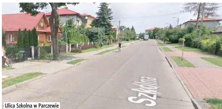
Ulica Szkolna w Parczewie