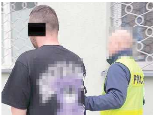
Mężczyzna usłyszał już zarzuty. Grozi mu kara do 10 lat pozbawienia wolności

– Policjanci, na terenie zajmowanej przez niego posesji, ujawnili reklamówki z towarami pochodzącymi z włamania – in-