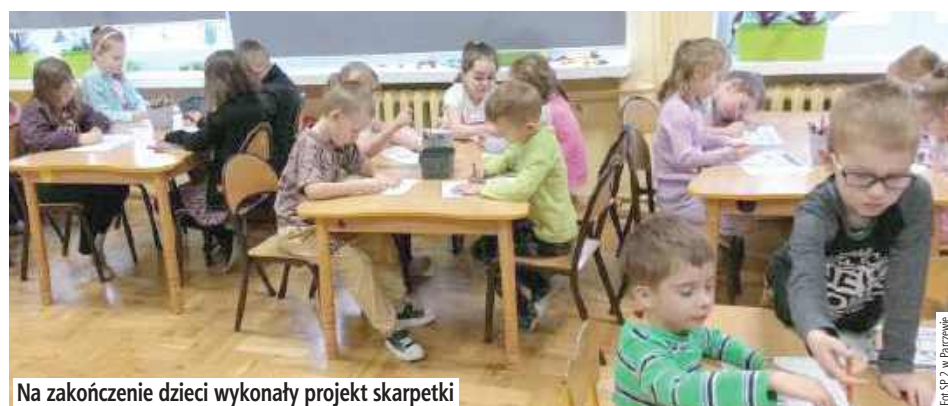
Na zakończenie dzieci wykonały projekt skarpetki

PARCZEW: Niedawno obchodziliśmy Światowy Dzień Zespołu Downa. Dzieci w zerówkach przy SP 2 w Parczewie, w ramach projektu edukacyj-