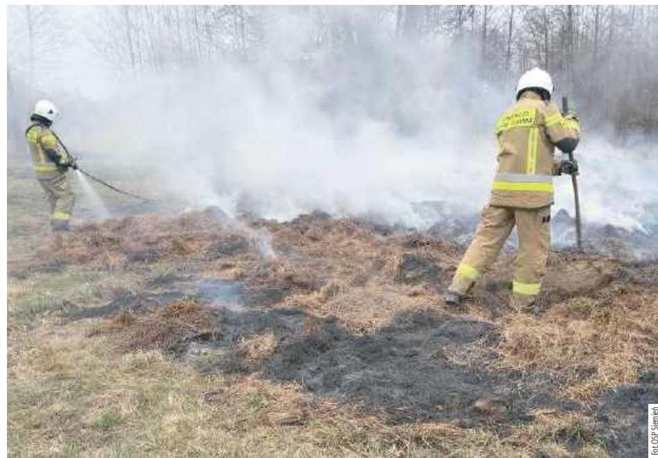
Pożar traw wybuchł w niedzielę, 30 marca w Woli Tulnickiej. Na miejscu interweniowali druhowie z Ochotniczej Straży Pożarnej w Siemieniu, dla których była to 13. interwencja w tym roku.