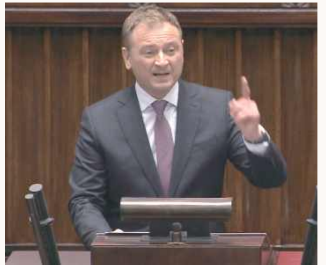
Minister Sportu i Turystyki Sławomir Nitras zapowiada zmiany w prawie, które zapobiegą podobnym sytuacjom, jak ta w Puławach, w przyszłości

- Po czym jego wiceminister w styczniowym programie