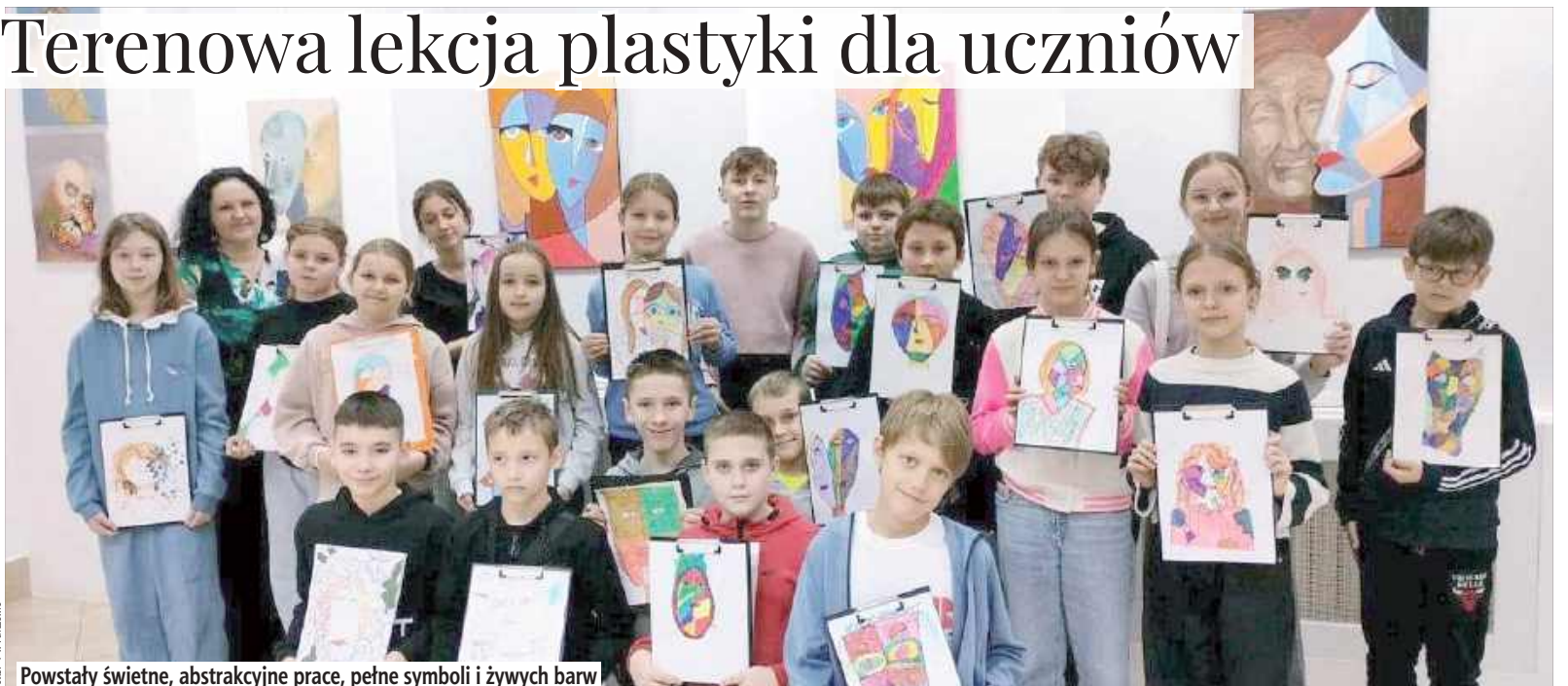
Powstały świetne, abstrakcyjne prace, pełne symboli i żywych barw