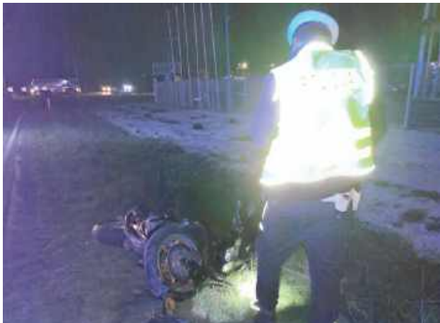
Dziewczynka jechała elektryczną hulajnogą po chodniku, a do wypadku doszło, gdy przejeżdżała na drugą stronę drogi

- Mundurowi ustalili, że jadąca elektryczną hulajnogą 16-latka z gminy Łuków, przejeżdżając przez jezdnię, została potracona przez motocykl marki Kawasaki, którym kierował 23-latek z powiatu radzyńskiego. Pokrzywdzona dziewczynka doznała obrażeń ciała i śmigłowcem LPR została przetransportowana do specjalistycznego szpitala. Na szczęście później okazało się, że urazy, jakich doznała, nie zagrażają jej życiu - informuje Marcin Józwik, oficer prasowy Komendy Policji w Łukowie.