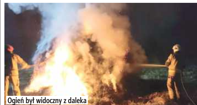
Ogień był widoczny z daleka