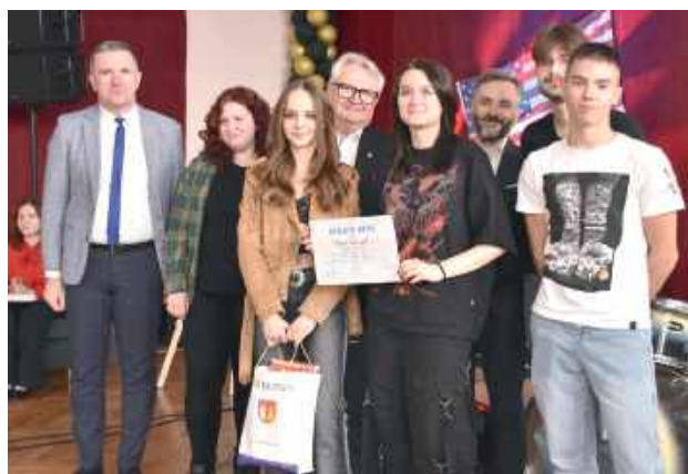
Nagrody zostały ufundowane przez Zarząd Powiatu oraz Radę Rodziców

W Zespole Szkół im. Stanisława Staszica w Parczewie został zorganizowany II Powiatowy Konkurs Piosenki Angielskiej pod patronatem starosty parczewskiego. Uczniowie ze szkół podstawowych i ponadpodstawowych zaprezentowali swoje umiejętności językowe i wokalne.