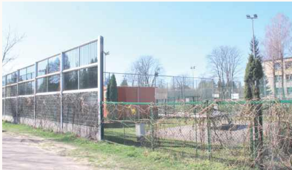
Nawet ustawienie ekranów akustycznych, na które miasto wydało kilkaset tysięcy złotych, nic nie dało

- Wy postanowiliście zamykać „Orliki”, tak, jak doprowadziliście do zamknięcia „Orlika” w Puławach. Ludzie! Boisko,