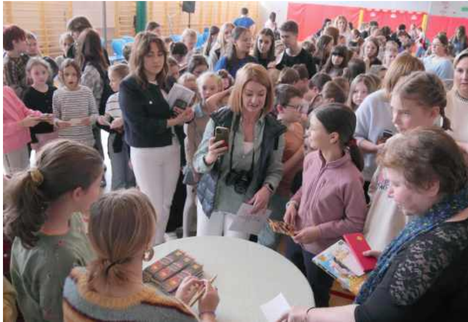
Pisarka rozdawała autografy