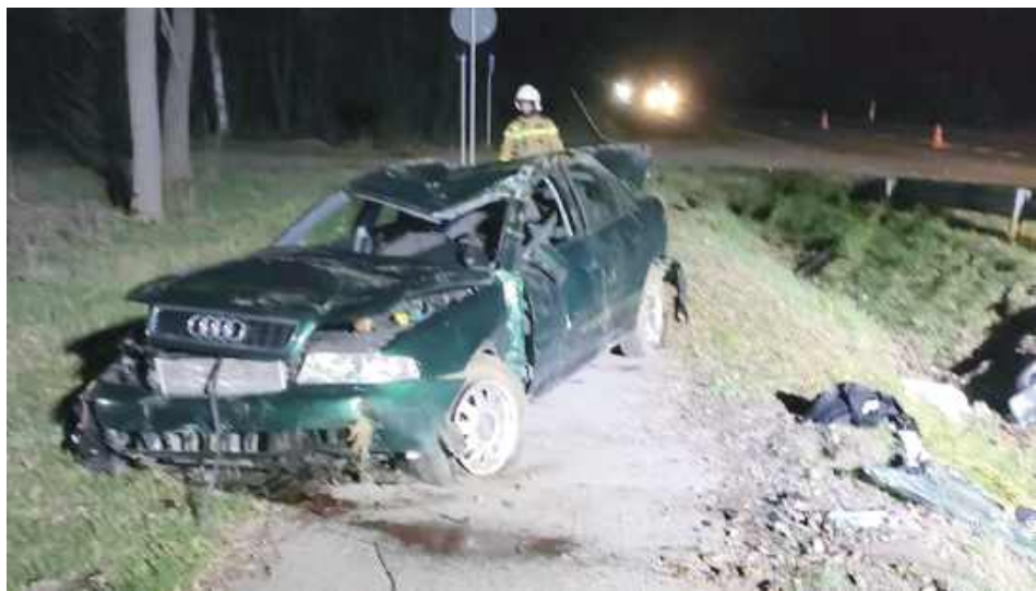
Audi zostało mocno uszkodzone

Do groźnego wypadku doszło w Siemieniu na drodze wojewódzkiej numer 815. Audi zjechało do rowu i dachowało.