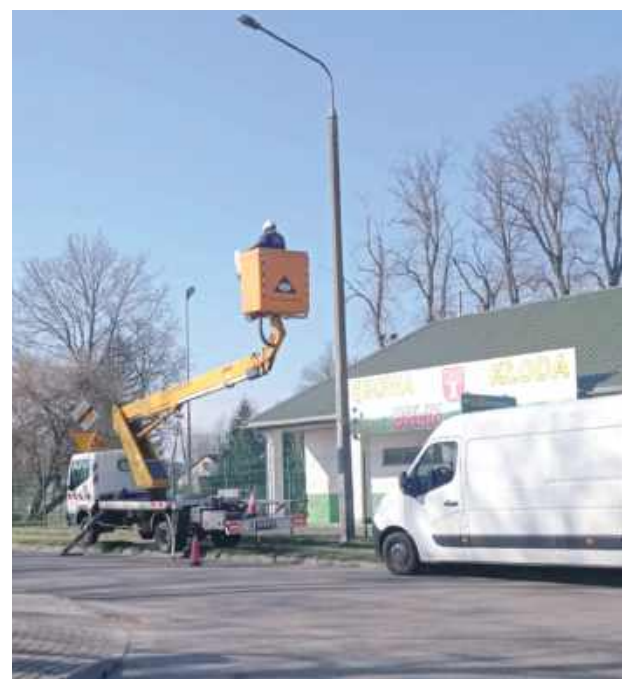
Oświetlenie zostało wymienione m.in. koło Orlika w Dębowej Kłodzie

Zakończyła się wymiana opraw oświetleniowych na terenie gminy Dębowa Kłoda.