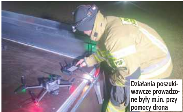
Działania poszukiwawcze prowadzone były m.in. przy pomocy drona

Zaginiony 37-latek sam wrócił do domu. 39-latek został odnaleziony w lesie. W ich poszukiwania zaangażowano kilkudziesięciu policjantów i strażaków. Na koniec dostali mandaty za awanturowanie się podczas późniejszego badania w szpitalu.