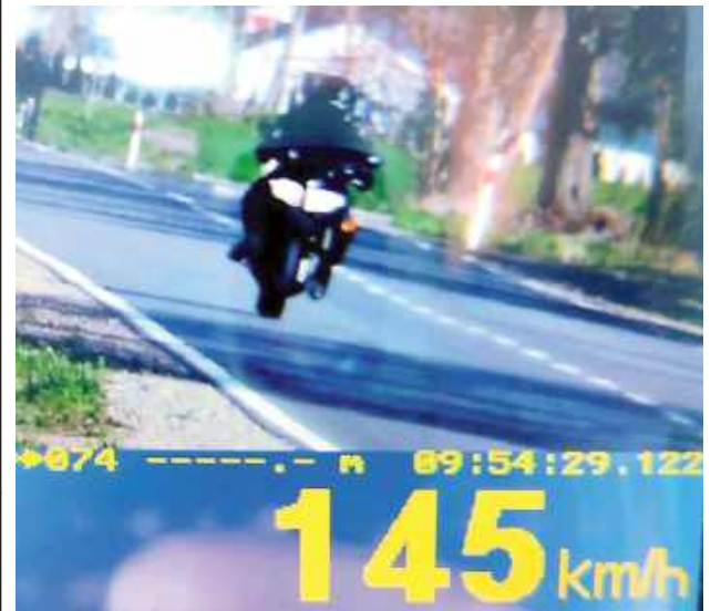
W terenie zabudowanym gwał z prędkością 145 km/h

5 tysięcy złotych mandatu dla pirata z powiatu puławskiego. Wpadł w Samoklęskach