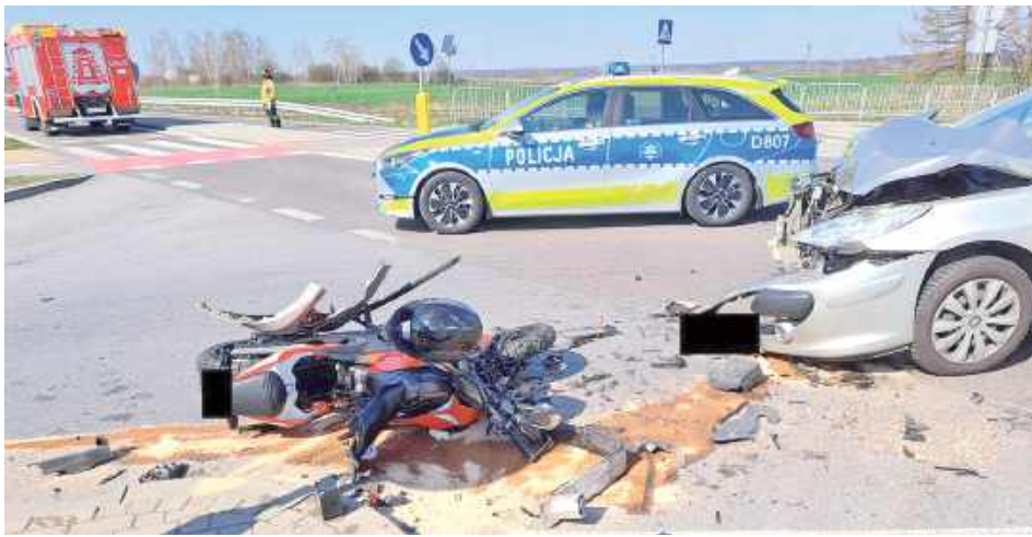
58-letni mieszkaniec powiatu ryckiego kierujący osobowym peugeotem nie zachował należytej ostrożności podczas skrętu w lewo, w wyniku czego doprowadził do zderzenia z jadącym z przeciwnego kierunku motocyklem

Ze wstępnych ustaleń pracujących na miejscu funkcjonariuszy wynika, że