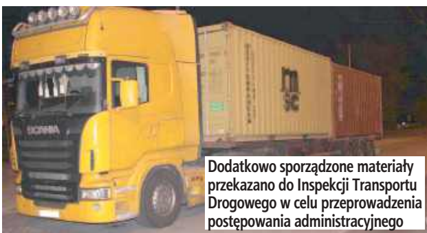
Dodatkowo sporządzone materiały przekazano do Inspekcji Transportu Drogowego w celu przeprowadzenia postępowania administracyjnego

- 25-latek wykonywał usługę transportową na rzecz jednego