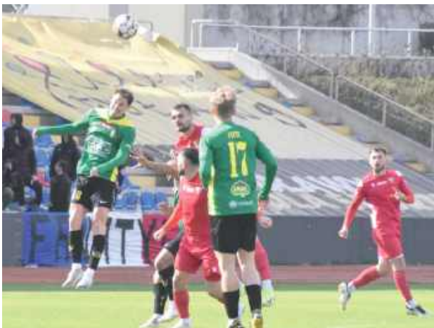
Wiślacy znow przegrali. Puławianie plasują się w strefie spadkowej...