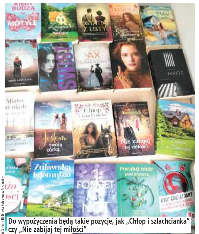
Do wypożyczenia będą takie pozycje, jak „Chłop i szlachcianka” czy „Nie zabijaj tej miłości”

Miały przyjść na początku kwietnia, a dotarły pod koniec marca. Świeżutkie, pachnące nowością książkowe sugestie naszych Czytelników i te wybrane przez nas, biorąc pod uwagę preferencje czytelników osób będących użytkownikami naszej biblioteki. Mamy nadzieję, że trafione, prosimy o trochę cierpliwości. Już wkrótce zagospodzą na półkach - zapowiada biblioteka.