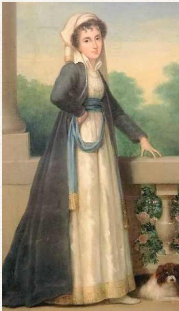
Portret Izabeli z około 1790 roku, czyli na kilka lat przed ukończeniem Świątyni Sybilli i skompletowaniem jej wyposażenia. Powstał prawdopodobnie w Londynie, skąd księżna przywiozła do Puław wiele cennych, przynajmniej jej zdaniem, zabytków

W całej tej operacji widać sporo oczywistych u amatorki naiwności, braku warsztatu, czasem po prostu braku wiedzy, których nie było komu, stojącemu obok, naprostować. W kolekcji znajduje się cała masa bzdur. Cegła z domu Dąbrówki, tabakierka Wierzyńska, autograf świętego Wojciecha, but, w którym konfederaci barscy porwali Stanisława Augusta (może i autentyczny, czort go wie...) oraz jedna z, bodajże, trzech występujących w obrocie kolekcjonerskim czaszka Stefana Czarnieckiego... Mocno to przypomina