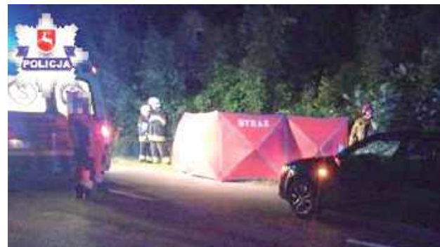
Opinia biegłego wykazała również, że do zdarzenia przyczynił się nie tylko kierowca, ale też piesi

Pomimo prowadzonej reanimacji 42-latek zginął na miejscu, a kobieta trafiła do szpitala. Z kolei kierowca osobówki był trzeźwy.