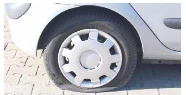
Przecięli cztery opony w osobowym Renaultie

– Białscy policjanci zwalczający przestępczość przeciwko mieniu ustalili dane osób podejrzanych