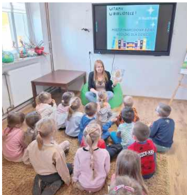
Mróweczki z uwagą słuchały opowieści o wzorowym jajku

Spotkanie z grupą „Mróweczki” było okazją do wspólnego świętowania. Na początku każde dziecko musiało pokonać tor przeszkód, który wywołał mnóstwo śmiechu i radości. Czas wyciszenia i odpoczynku przyszedł przy wspólnej lekturze. Przedszkolaki wysłuchały opowieści pt. „Wzorowe jajo”, która przypominała, jak ważne jest dbanie o siebie i swoich bliskich. Każde dziecko mogło także poczuć się jak prawdziwy bibliotekarz! Mali goście mieli okazję poznać tajniki naszej pracy oraz samodzielnie wypożyczyć książkę za pomocą czyt-