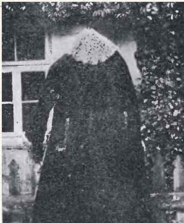
Plecy jupy lubartowskiej. Zdjęcie wykonała Helena Morozewicz, lubartowska działaczka społeczna i kulturalna. Jupa było to wierzchnie, przypominające nieco suknię, okrycie ze czarnej skóry baraniej

Kożuch z czarnego barana - bez pokrycia, wyszyty czerwoną i niebieską bawełną na „pazuchach” i na połączeniu pleców ze spódnicą kożucha. Fason zbliżony do męskich sukman „zza wody”.