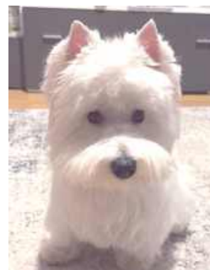
Gucio, Sylwia Ryć, Cyców