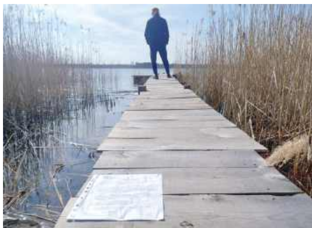
Pomosty są odwiedzane przez wędkarzy i turystów

Turyści mogą skorzystać z kilku pomostów, które - jak się okazuje - są samowolą budowlaną. Na pomostach Wody Polskie umieściły kartki, w których wzywają właścicieli pomostów do ich likwidacji lub legalizacji. - Jeżeli urządzenie wodne zostało wykonane bez wymaganego pozwolenia