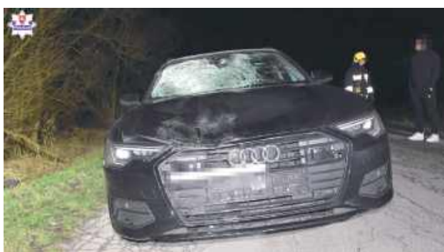
Audi zostało mocno uszkodzone

- Ze wstępnych ustaleń wynika, że 25-letni kierujący Audi w obszarze niezabudowanym i nieoświetlonym potracił pie-