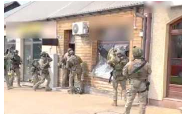
Akcja wejścia do lokalu przy ul. Warszawskiej w Dęblinie

Policjanci z Garwolina przeprowadzili szeroko zakrojoną akcję wymierzoną w przestępczość narkotykową. W jej wyniku zlikwidowano nielegalny salon gier, który stanowił punkt handlu narkotykami.