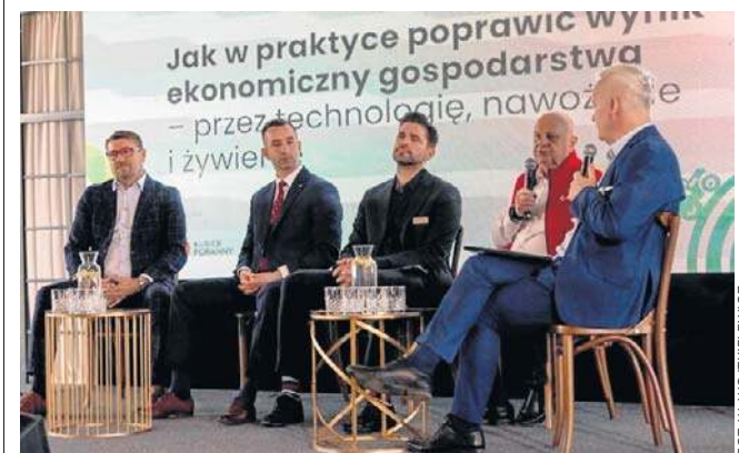
Debata o kondycji rolnictwa i kierunkach jego rozwoju była osią I Forum Rolniczego Województwa Podlaskiego

Relację z wydarzenia zamieścimy w piątkowym wydaniu Kuriera Porannego i Gazety Współczesnej