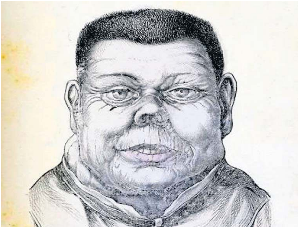
Ryciny przedstawiające idiotów, kretynów i imbecyli były elementem podręczników akademickich. Miały pomóc m.in. nauczycielom w rozpoznawaniu rodzaju zaburzeń. Wizerunek powyżej to ilustracja AI na podstawie XIX-wiecznych grafik

Podobną drogę przeszły inne słowa. „Debil” pochodzi od łacińskiego debilis, czyli „słaby”. „Imbecyl” od imbecillus, oznaczającego kogoś chwziętego, pozbawionego oparcia. Najbardziej zawiłą drogę przeszedł „kretyn”, pochodzący z francuskiego crétin. Słowo to oznaczało w jednym z dialektów chrześcijanina. W alpejskich dolinach tak nazywano osoby dotknięte ciężką chorobą wynikającą z niedoboru jodu. Nazwa miała przypominać, że mimo choroby są oni ludźmi - „także chrześcijanami”.