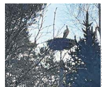
Bociana zaobserwowano w Bachanowie

Świerubska podkreśliła, że od kilku dni na Suwalszczyźnie jest dość ciepło i słonecznie, ale w lasach i na jeziorach ciągle zalega lód i zmarznięty śnieg.