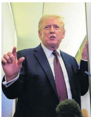
Donald Trump na pokładzie Air Force One

- Żądam, aby te kraje przybyły i chroniły swoje tery-