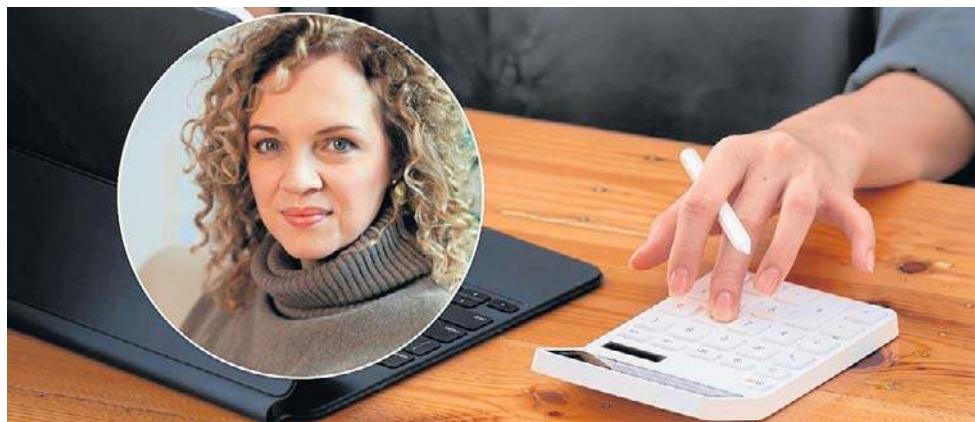
Kobiety w Polsce stanowią zaledwie 8-9 procent aktywnie inwestujących

Uważam, że AI jest świetnym narzędziem w rękach ludzi, którzy wiedzą, co z nim robią. Jeśli tej świadomości nie ma, AI nie zastąpi rzetelnej wiedzy. W finansach powtarzam, że to jest ważne, żeby wiedzieć, do czego używamy narzędzia. Można z wykorzystaniem AI przeanalizować dużą liczbę danych i wyciągnąć wnioski, ale trzeba wiedzieć, co robimy i po co. Zadanie pytania w stylu „Oto moje cele, ułóż mi strategię” to już problem. Nie ma uniwersalnego schematu dla każdego człowieka. Jeśli natomiast mamy już przemyślaną strategię i chcemy coś uprościć, wtedy narzędzie może pomóc. Może zrobić raport, prześledzić dane z wybranego okresu. Ale nie zastąpi to edukatora czy doradcy w dopasowaniu strategii