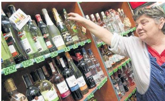
„Schowanie” alkoholu w sklepach może nie wpłynąć na spadek sprzedaży impulsywnej tych produktów

Do kupowania w sposób impulsywny i nieplanowany skłaniają przede wszystkim akcje promocyjne i możliwość nabycia większej liczby produktów za niższą cenę. „Zakupy pod wpływem okazji wielopakowych mają największe znaczenie dla konsumentów w wieku 35-44 lata (41%) oraz dla męż-