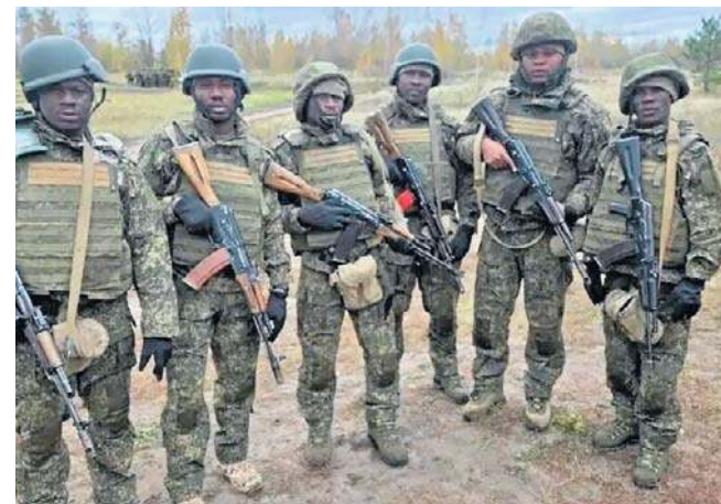
Według raportu kenijskiego wywiadu ponad 1000 Kenijczyków zostało zwerbowanych do walki przez Rosję

Z kolei Ławrow przekonywał, że obywatele Kenii dobrowolnie podpisali kontrakty na walkę u boku armii rosyjskiej.