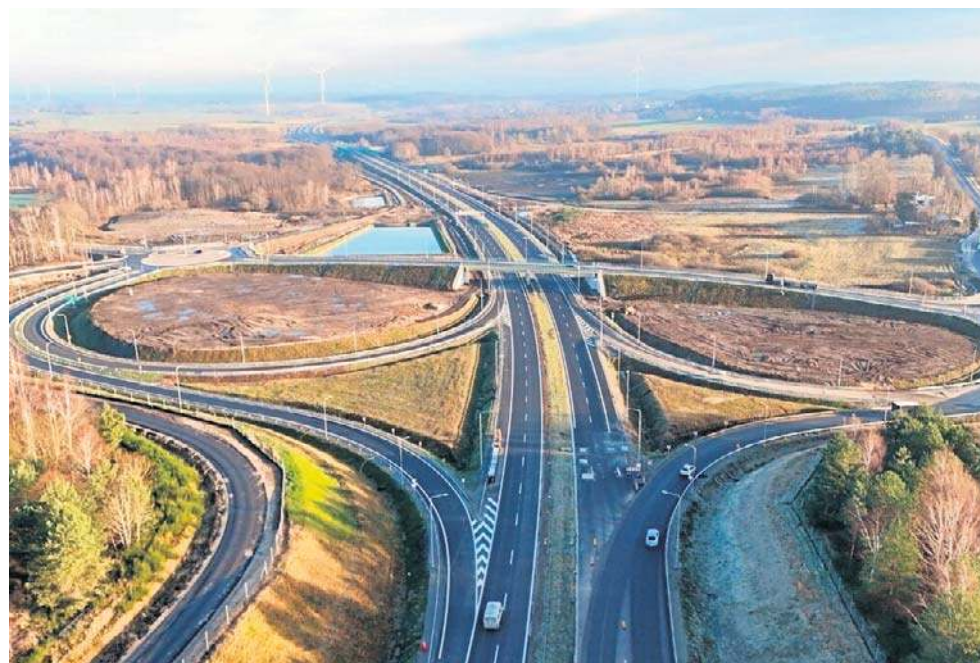
Największy ruch - jeśli chodzi o region koszaliński - panuje na trasie S6 w okolicach Kołobrzegu i w okolicach Koszalina

Podobnie jak na węźle Koszalin Południe. Średnia roczna tutaj to 18942 pojazdy. Wię-