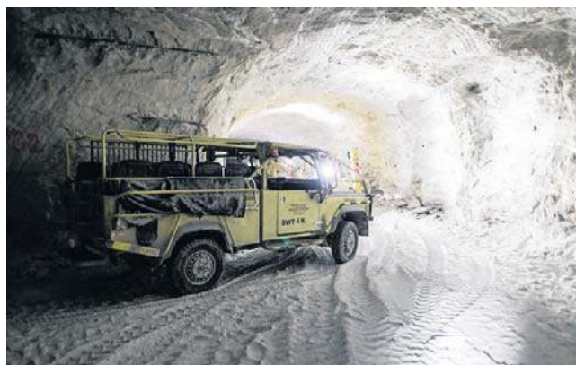
Mamy ogromne złoża soli kamiennej. Mimo to przegrywamy z zagranicznymi podmiotami, które oferują znacznie niższe ceny

– Możliwości produkcyjne kopalń w krajach UE są niewykorzystane, dlatego rynek polski narażony jest na napływ taniego produktu. Z powodu niskiego poziomu cen następuje również wypieranie polskiego „eksportu” soli do takich krajów, jak: Niemcy, Czechy, Słowacja, Węgry oraz kraje nadbałtyckie. Producenci niemieccy, K+S, SUD Salz, stanowią po-