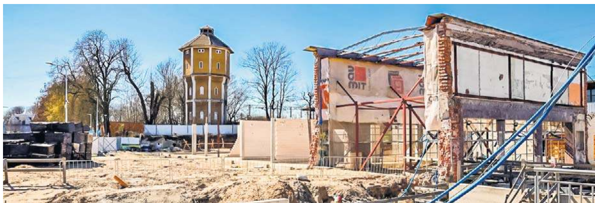
Pozostałości po byłym budynku dworca - stan obecny

Inwestorem prowadzącym budowę nowego dworca w Koszalinie są Polskie Koleje Państwowe S.A. Dokumentację projektową opracowała pracownia TBI Architekti z Gdańska, drugi wykonawca prac budowlanych zostanie wyłoniony w ramach ogłoszonego przetargu. Zawarcie umowy z firmą budowlaną planowane jest do końca sierpnia. Przy założeniu, że dalsze etapy inwestycji będą przebiegały zgodnie z obowiązującym harmonogramem, rozpoczęcie robót budowlanych planowane jest jeszcze we wrześniu, a zakończenie w I połowie 2028 roku.