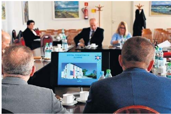
Posiedzenie Społecznej Rady Szpitala Powiatowego w Sławnie

Protest szpitali powiatowych ma być ostatecznym sygnałem dla NFZ i rządu. - Brak rozliczeń za 2025 rok, ograniczanie finansowania nadwykonań oraz zaniżone wyceny świadczeń oznaczają, że zdecydowana większość szpitali powiatowych kończy rok stratą, a skumulowane wyniki liczone w skali kraju sięgają miliardów złotych. Jednocześnie setki szpitali mają zobowiązania wymagalne liczone w miliardach, a w wielu placówkach poziom zadłużenia przewyższa wartość aktywów, co oznacza ryzyko utraty płynności - wylicza Ogólnopolski Związek Pracodawców Szpitali Powiatowych. - Na tym tle szczególnie groźne są nowe zapowiedzi NFZ dotyczące ograniczenia finansowania ambulatoryjnej opieki specjalistycznej i rehabilitacji oraz zmiany zasad rozliczania badań tomografii