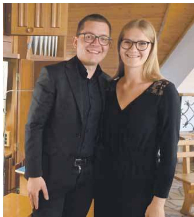
Jeszcze o sukcesach tych młodych i utalentowanych artystach zapewne jeszcze wiele razy usłyszymy.