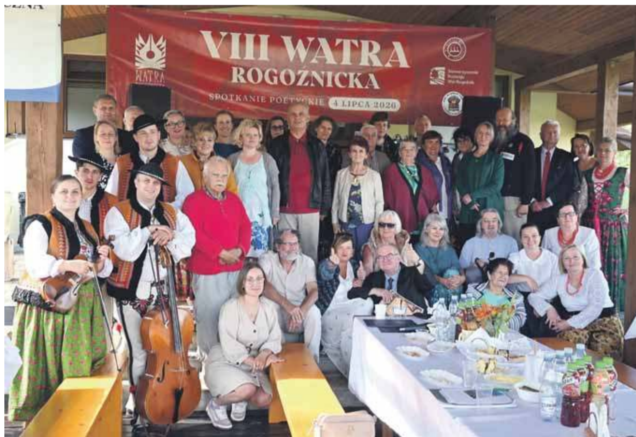
Artyści jak zawsze licznie wstawili się na spotkaniu w Rogoźniku.