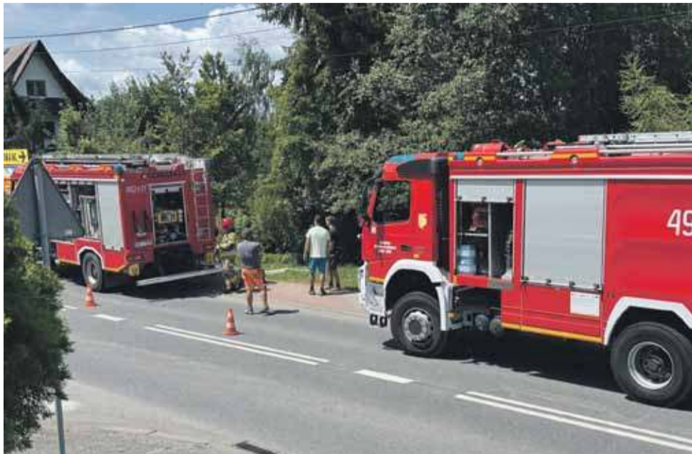
Miejsce awarii zabezpieczyli strażacy z rabczańskiej Jednostki Ratowniczo-Gaśniczej oraz druhowie OSP Chabówka.