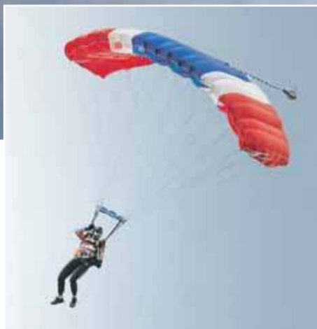
Zrzut skoczków z samolotu AN-2 Wiedeńczyk

Podniebne akrobacje to to, co miłośnicy awiacji lubią najbardziej.