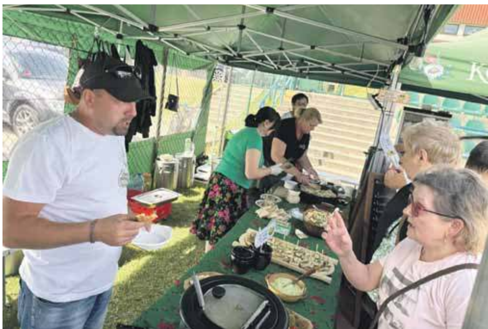
O poczęstunek zadbało Koło Gospodyń Wiejskich ze Skawy.