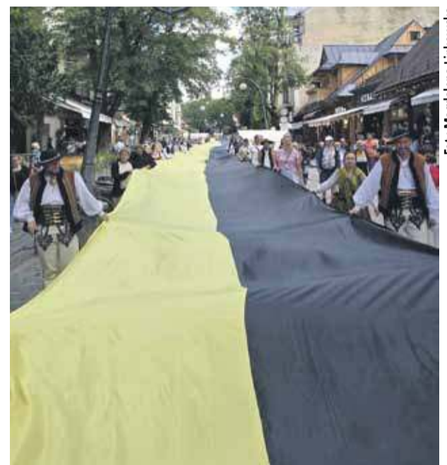
Górale z Kaszubami niosą stumetrowej długości flagę przez Krupówki

Rekordowa Kaszubska Flaga została rozwinięta z zeskoku