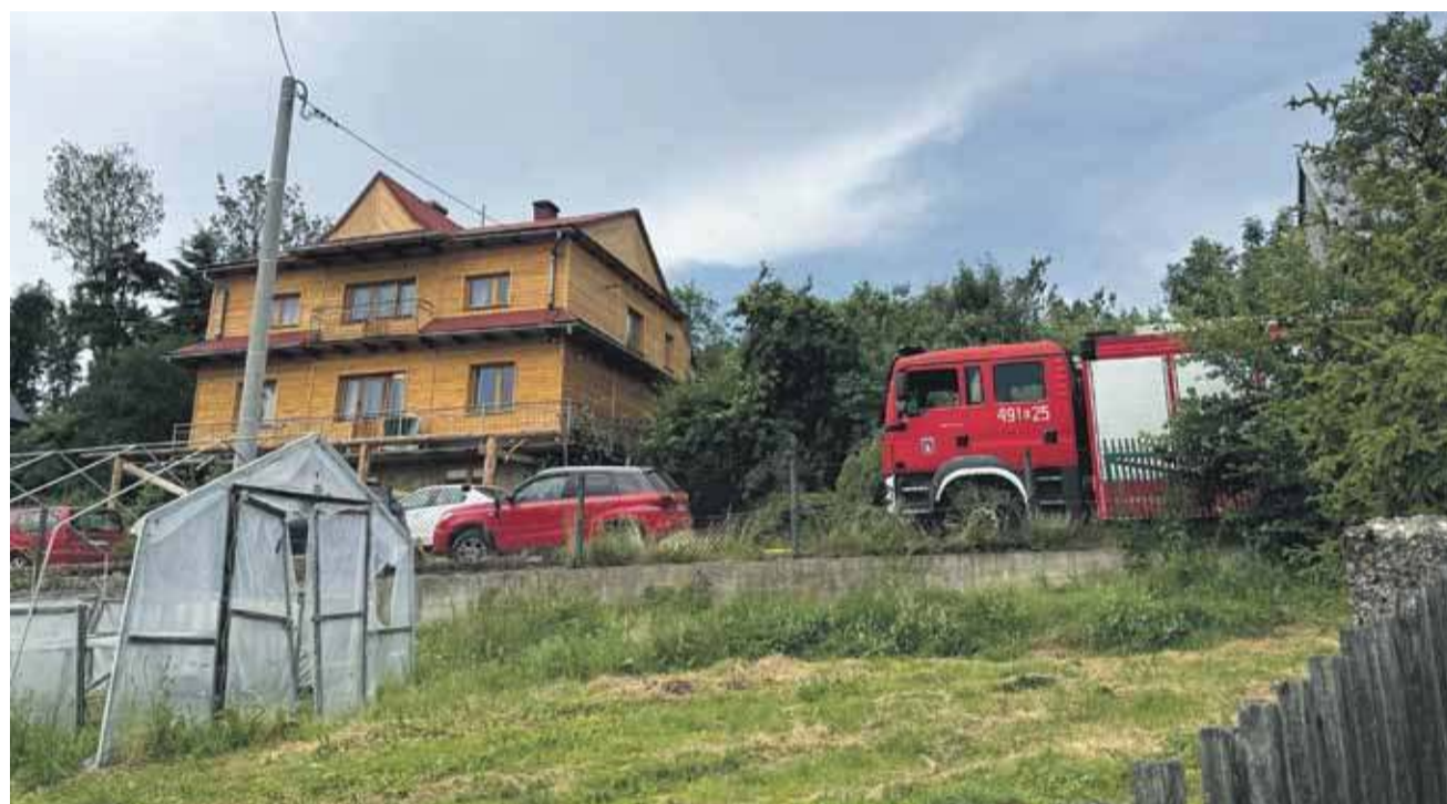
W schładzaniu boksów pomogli strażacy.

Nowotarska prokuratura również potwierdziła ustalenia opublikowane w komunikacie policji.