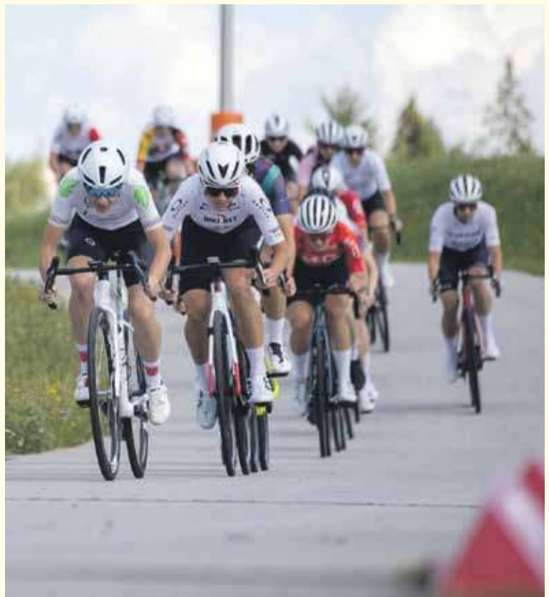
Zawodnicy z wysiłkiem pokonywali kolejne etapy wyścigu.