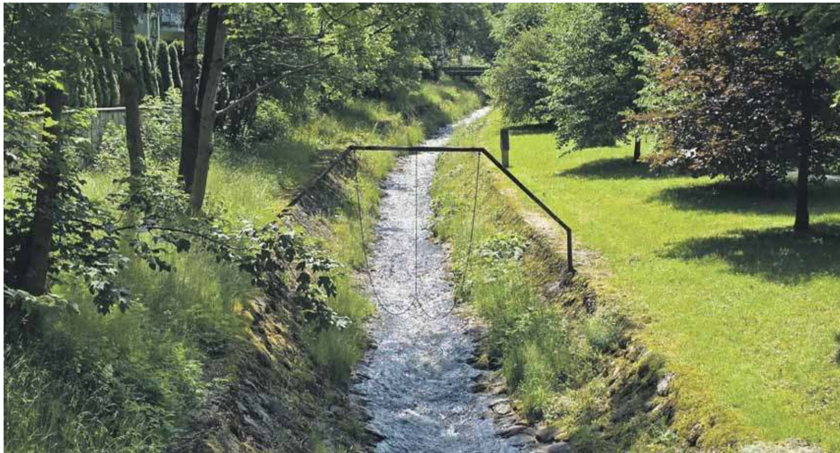
Z powodu mniejszej ilości opadów i szybkiego topnienia śniegu poziom wód w potokach spada w zastraszającym tempie.

Do tego dochodzą skażenia bakteriologiczne. Sanepid co i rusz wydaje ostrzeżenia, by nie pić i nie używać wody do mycia czy kąpieli. Okresowe alerty sanitarne dotykają czasem ujęć zasilających wieś i osiedla w oko-