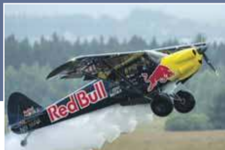
Carbon Cub EX2 za sterami kpt. pil. Łukasz „Luke” Czepiela

Kreślone wśród chmur pętle, beczki i korkociągi mogliśmy podziwiać przez cały weekend w Nowym Targu.