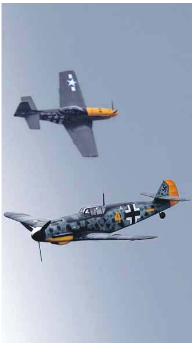
Podniebna bitwa, niemiecki Messerschmitt Bf 109 kontra amerykański P-51 Mustang.

D o tego pokazy historycznych maszyn z II wojny światowej i nie tylko. Przez dwa dni nowotarskie lotnisko tętniło życiem za sprawą XV Nowotarskiego Pikniku Lotniczego. Mieszkańcy i turyści licznie odwiedzili wydarzenie, podziwiając efektowne pokazy lotnicze, zabytkowe maszyny oraz liczne atrakcje przygotowane dla całych rodzin.