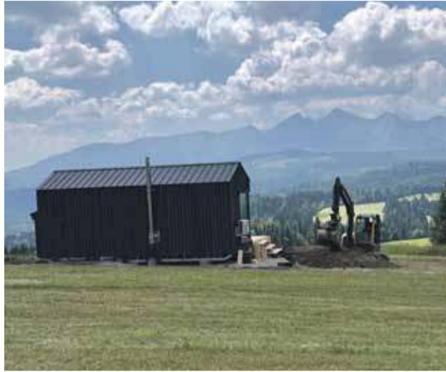
Do jesieni domek mobilny będzie wynajmowany, a potem zostanie przeniesiony – deklaruje inwestor.

– Pewnie, że jestem za tym, żeby to stąd zniknęło – mówi mężczyzna pracujący na polu, wskazując w stronę domu na