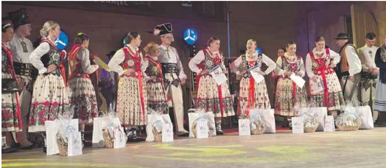
Wielki finał, nagrodzone i utytułowane dziewczęta na scenie.