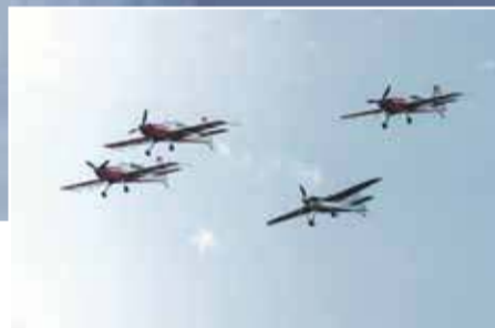
Grupa Akrobacyjna FireBirds

Kreślone wśród chmur pętle, beczki i korkociągi mogliśmy podziwiać przez cały weekend w Nowym Targu.