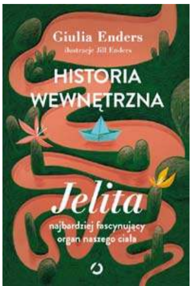
Historia wewnętrzna. Jelita- najbardziej fascynujący organ naszego ciała Giulia Enders