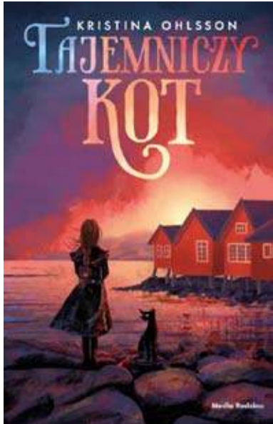
Tajemniczy kot Kristina Ohlsson Wydawca: Media Rodzina