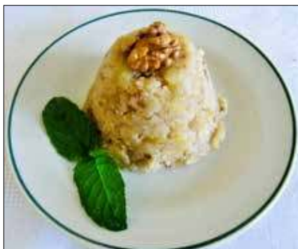
■ Fot. autorka

Masło rozpuścić na większej patelni, dodać orzechy i 2-3 minuty podsmażyć. Dodać kaszę manną, mieszać cały czas na wolnym grzaniu, aż kasza