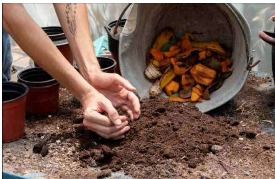
■ Odpowiednie warstwowanie i wilgotność kompostu decydują o skutecznym rozkładzie odpadów zielonych