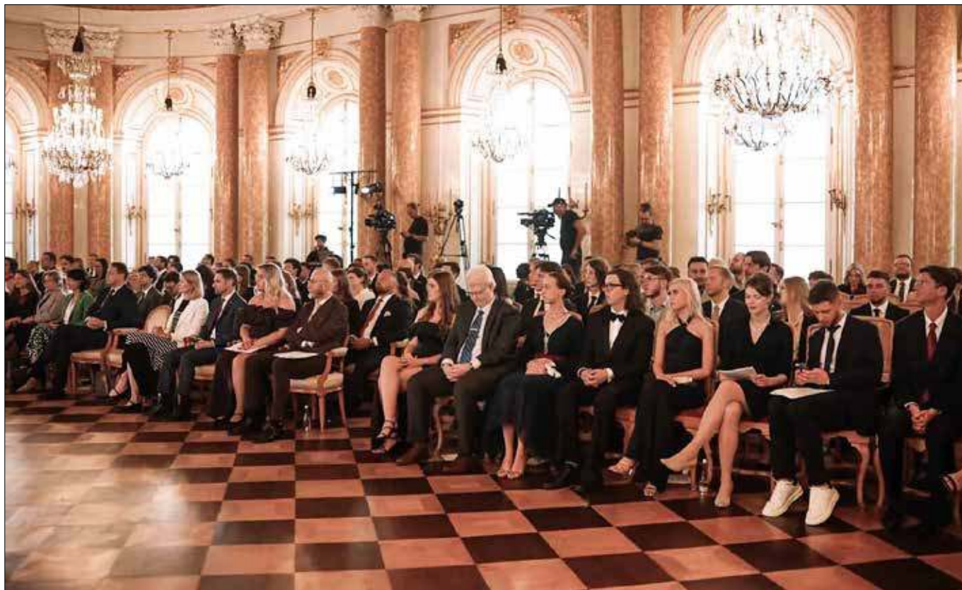
Program skierowany jest do przedstawicieli polskiej diaspory na całym świecie w wieku 21-35 lat, posiadających polskie obywatelstwo lub Kartę Polaka