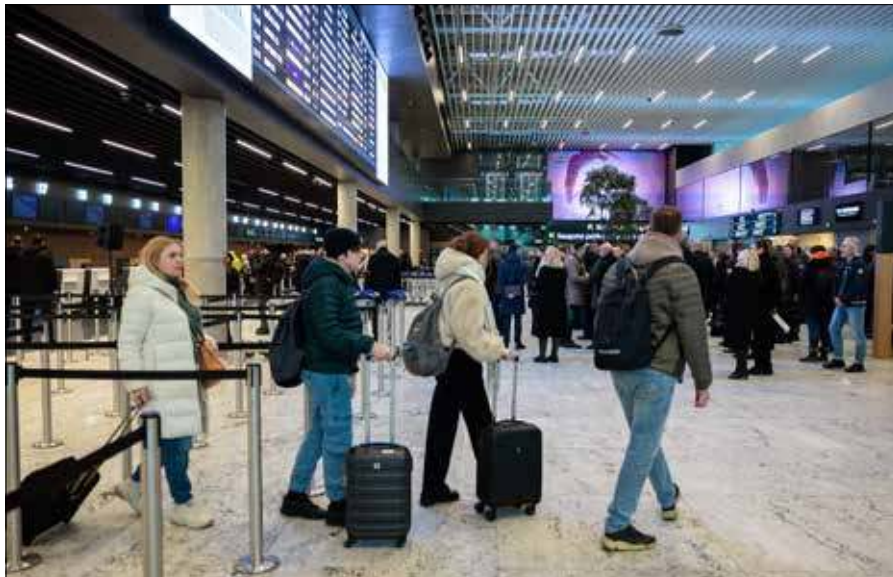
Observacja przepływu pasażerów na litewskich lotniskach wskazuje, że zapotrzebowanie na podróże nie maleje

Konflikt w Iranie ponownie wywołał pytania o stabilność rynku lotniczego i możliwy wpływ sytuacji geopolitycznej na ceny biletów.