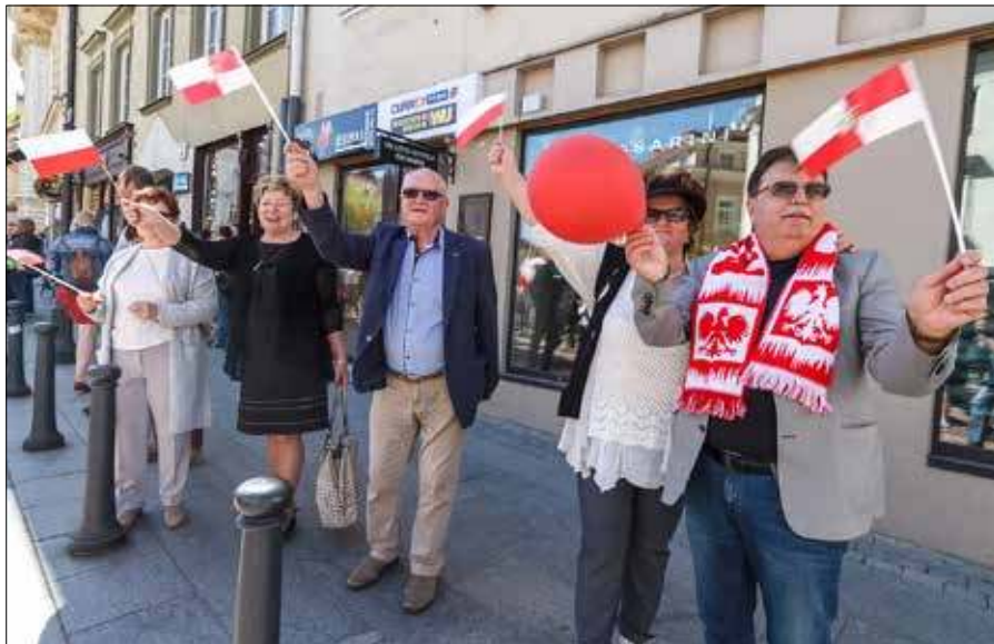
■ Co roku majówka przyciąga do Wilna mnóstwo turystów z Polski

— W tym roku wprowadzono zmiany w stawkach VAT na usługi