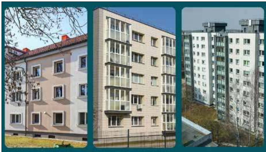
■ Zwycięzcy konkursu „Projekt renowacji roku 2026”

Zajmujący pierwsze miejsce blok przy ul. Ramioji 4 w Kłajpedzie wyróżniał się