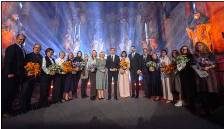
Uhonorowani medycy rejonu wileńskiego podczas uroczystej gali „Sercem dla medycyny”

„Spotkaliśmy się tutaj, aby na chwilę się zatrzymać i wypowiedzieć