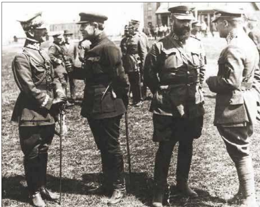
Umowa stała się podstawą do wspólnej polsko-ukraińskiej ofensywy przeciwko bolszewikom

— Wcześniej, zarówno w zachodniej oraz wschodniej części społeczeństwa Ukrainy Petlura funkcjonował, jako zdrajca. Na Wschodzie mu zarzucano zdradę tzw. „starszych braci ze Wschodu”, a na Zachodzie zarzucano zdradę Ukraińskiej Republiki Ludowej. Przede wszystkim chodziło o rzeczenie się na rzecz II Rzeczypospolitej Lwowa, Stanisławowa, Tarnopolu, czy Wołynia. Dzisiaj coraz częściej się mówi, to dotyczy również przekazu oficjalnego, że to była konieczna ofiara ze względu na walkę z większym zagrożeniem, jakim byli bolszewicy. Szymon Petlura nie miał innego wyjścia. Rządziej mówi się też o zdradzie ze strony Piłsudskiego. Wcześniej, szczególnie na zachodzie Ukrainy, można było usłyszeć, że Piłsudski zdradził Ukraińców, ponieważ