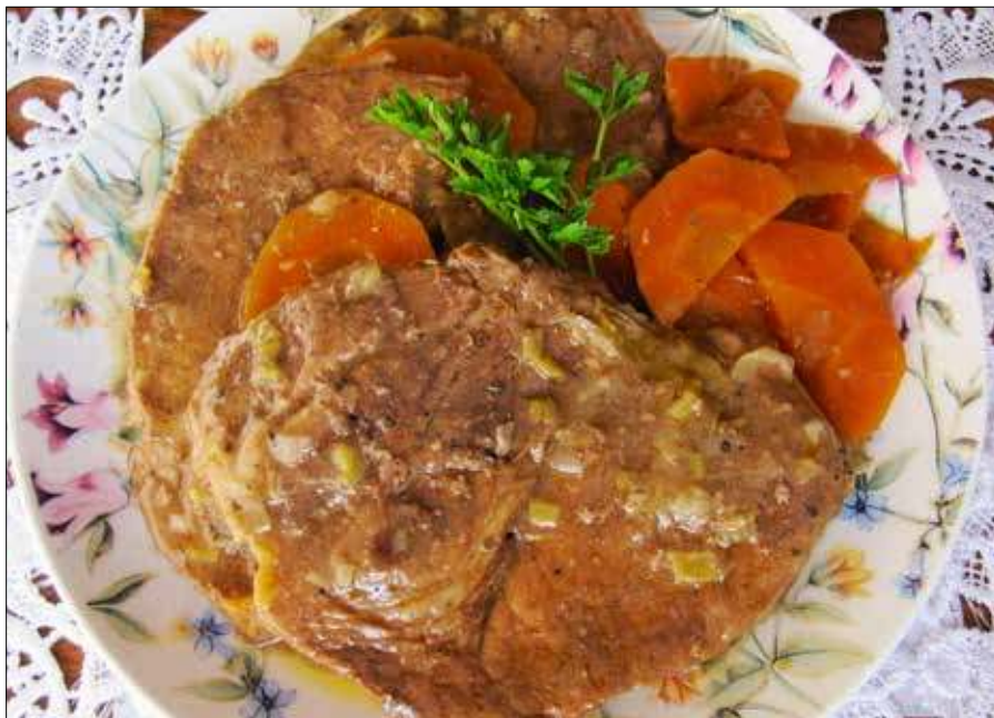
■ Fot. autorka

Karkówkę kroimy w plastry lub większą kostkę, oprószamy solą i pieprzem, a następnie obsmażamy na dobrze rozgrzanym tłuszczu, aż nabierze apetycznego, złocistego koloru. Ten etap jest bardzo ważny, ponieważ pozwala zamknąć soki wewnątrz mięsa. Podsmażone mięso przekładamy do garnka lub głębokiej patelni. Na tej samej