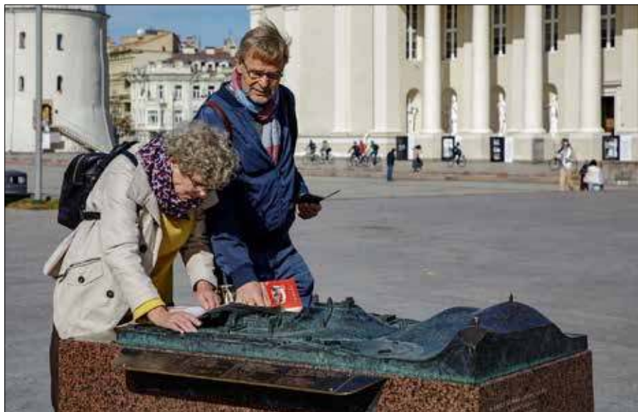
Turyści często planują zwiedzanie w kontekście odbywających się w mieście wydarzeń