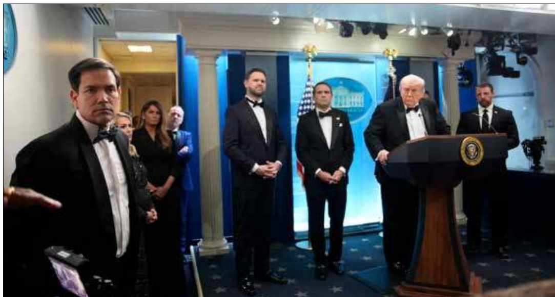
Agent Secret Service USA został ranny w strzelaninie w sobotę podczas kolacji korespondentów Białego Domu w Waszyngtonie, w której po raz pierwszy wziął udział prezydent Donald Trump. Sprawca został aresztowany