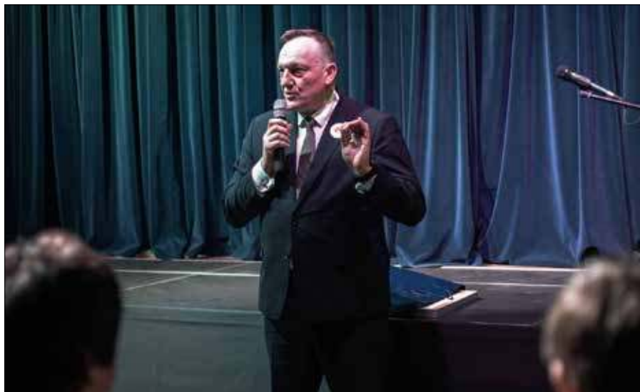
Jednym z obecnych na ceremonii absolwentów placówki był minister Władysław Kondratowicz