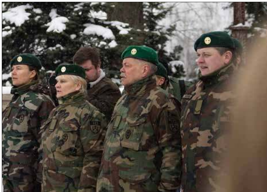
■ Z każdym rokiem rośnie liczba członków Związku Strzelców Litewskich