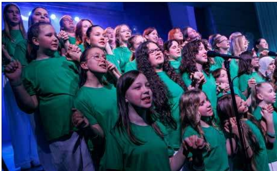
■ Nie zabrakło również występów muzycznych – uczniowie zaprezentowali piosenki, zachwycając zarówno swoimi umiejętnościami wokalnymi, jak i sceniczną swobodą