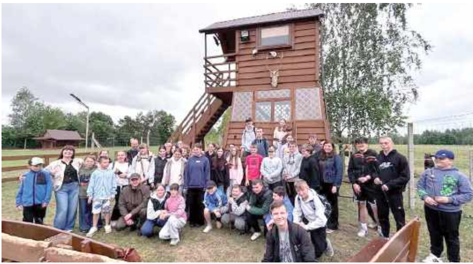
Na rancho starosty bialskiego w Pereszczówce na uczestników czekał zasłużony odpoczynek

Pierwszym punktem dnia była wizyta w malowniczej Pereszczówce. Uczestników wycieczki na swoje prywatne rancho za-