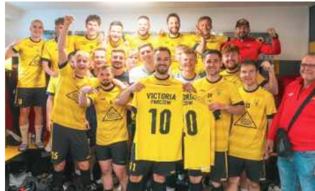
Czy Victoria zagra w IV lidze?

W pierwszym półfinale miały zmierzyć się drużyny z okręgów chełmskiego i lubelskiego. Ostatecznie prawo gry w barażach uzyskały Astra Leśniowice i KS Cisowianka Drzewce. W drugim półfinale Graf Chodwańce miał udać się do Parczewa na spotkanie z Victorią, która już wcześniej zapewniła sobie drugie miejsce w tabeli.