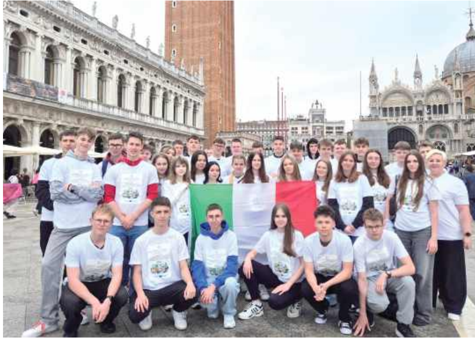
Prawie czterdziestu uczniów Zespołu Szkół Ekonomicznych im. Marii Dąbrowskiej w Międzyrzecu Podlaskim spędziło dwa tygodnie we Włoszech

W dniach od 10 do 23 maja, wybrani w drodze rekrutacji uczniowie klas trzecich i czwartych technikum wzięli udział w zagranicznej mobilności edukacyjnej. Organizatorem przyjmującym młodzież w urokliwej, nadmorskiej miejscowości Cattolica było renomowane stowarzyszenie European Mobility Center SRL, które od lat wspiera roz-