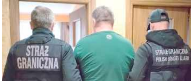
Funkcjonariusze z Nadbużańskiego Oddziału Straży Granicznej, działający pod nadzorem Prokuratury Okręgowej w Lublinie, rozbili zorganizowaną grupę przestępczą

Służby rozbiły zorganizowaną grupę przestępczą. Zajmowała się przemytem, skupowaniem i dystrybucją papierosów bez polskich znaków skarbowych akcyzy. Zatrzymano osiem osób.