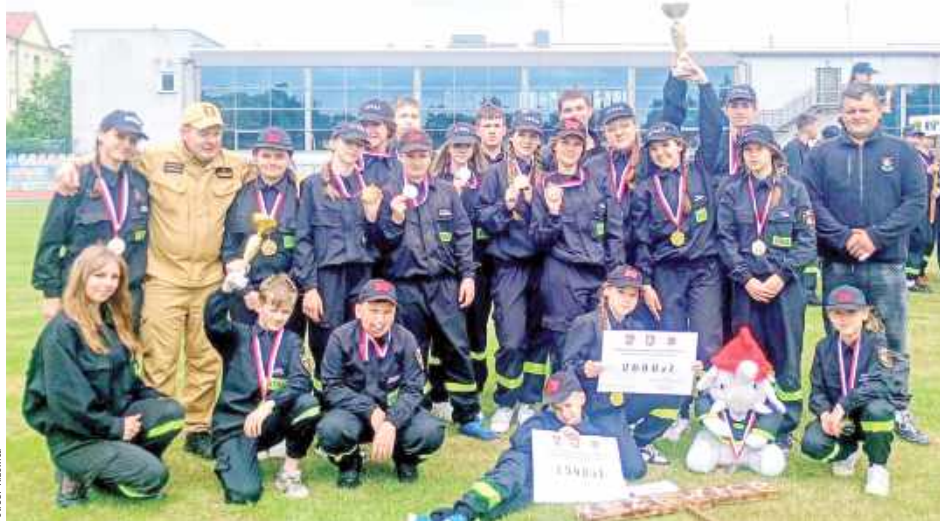
Młode strażaczki z OSP Krzewica wywalczyły I miejsce, a ich koledzy z jednostki zostali wicemistrzami powiatu

Młodzi druhowie i drużyny musieli wykazać się nie tylko świetną kondycją fizyczną, ale także precyzją, opanowaniem i doskonałą współpracą w grupie. Zespoły rywalizowały w dwóch tradycyjnych, widowiskowych konkurencjach: sztafe-