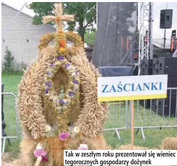
Tak w zeszłym roku prezentował się wieniec tegorocznych gospodarzy dożynek

Ocenie w tej kategorii będą podlegały wyłącznie prace nawiązujące formą do dawnych, miejscowych tradycji, przypominające na przykład kopułę, stożek lub płaską koronę. Wymagane jest