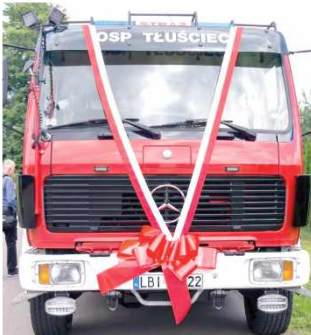
Jednym z głównych punktów uroczystości było oficjalne przekazanie wozu strażackiego marki Mercedes