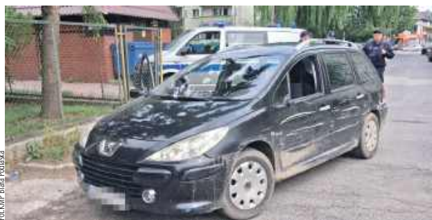
Zarówno 36-latek, jak i mężczyzna, który użytkował Peugeota, odpowiedzą za popełnione wykroczenie

- Z relacji pokrzywdzonego wynikało, że pożyczył swój samochód marki Peugeot koledze, który zaparkował go przy jednej z ulic w Białej Podlaskiej i udał się do pracy. Po powrocie okazało się, że samochodu nie ma. Właściciel auta natychmiast zgłosił ten fakt policji. Dzięki czujności policjantów oddziałów prewencji skradziony samochód jeszcze tego samego dnia został namierzony i zatrzymany na jednej z ulic w Białej Podlaskiej. Funkcjonariusze w trakcie patrolu miasta zauważyli skradzionego Peugeota w momencie, gdy jego kierowca nim cofał. Policjanci natychmiast zatrzymali