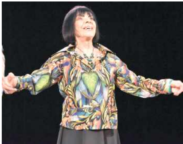
Na scenie pojawiła się sama Sława Przybylska

Artystka z czułością wspominała swoją matkę, pochodzącą z niewielkiej wsi Drelów nieopodal Międzyrzecza. Opowiadała, jak uczyła się śpiewać w harmonii z przyrodą, „słuchając ptaków i śpiewając z nimi”. Z wrodzoną skromnością określiła siebie mianem „prostej wieśniaczki”, mieszkającej w „szwajcarskiej wsi koło Otwocka”. Artystka zdradziła rów-