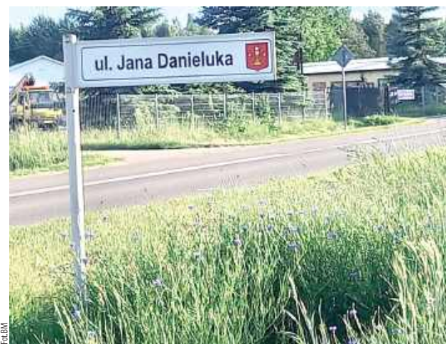
Ulica nazwana imieniem lekarza znajduje się przy wjeździe do miasta, naprzeciwko zalewu Koziół