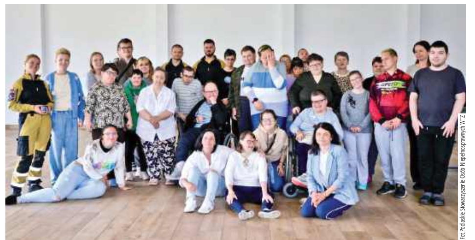
Strażacy z OSP Śródmieście przeszkolili kadry i uczestników Warsztatów Terapii Zajęciowej

W Warsztatach Terapii Zajęciowej (WTZ) prowadzonych przez Podlaskie Stowarzyszenie Osób Niepełnosprawnych zawitali druhowie z OSP KSRG Śródmieście, aby przeprowadzić dla kadry i uczestników szkolenie z zakresu pierwszej pomocy.