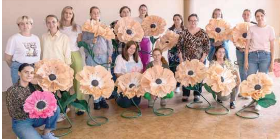
Uczestniczki warsztatów stworzyły kwiaty giganty

Kreatywność, precyzja i ogromna dawka pozytywnej energii towarzyszyły uczestnikom warsztatów artystycznych, które odbyły się 12 czerwca w świetlicy wiejskiej w miejscowości Wysokie. Pod okiem specjalistek powstawały imponujące, wielkoformatowe dekoracje florystyczne.