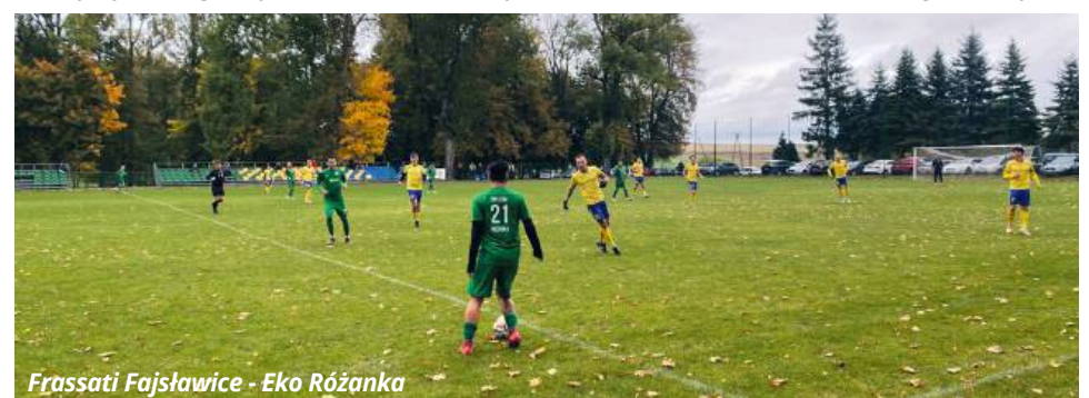
Frassati Fajslawice - Eko Różanka