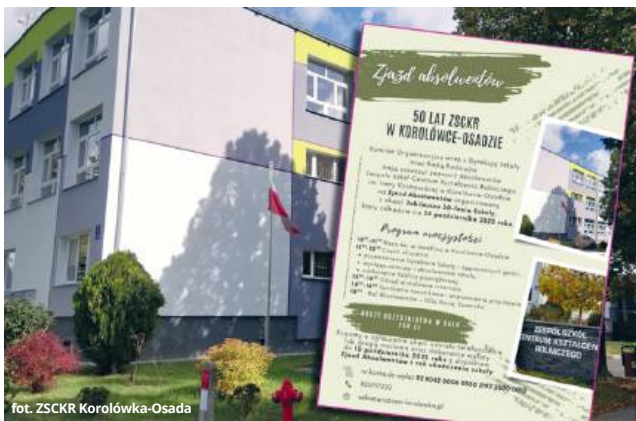
fol. ZSKCR Korolówka-Osada

Część oficjalna przewidziana jest w godzinach 11:00-13:30. Obejmie ona wystąpienia dyrektora szkoły i zaproszonych gości, występy uczniów i absolwentów, a także uroczyste odsłonięcie ta-