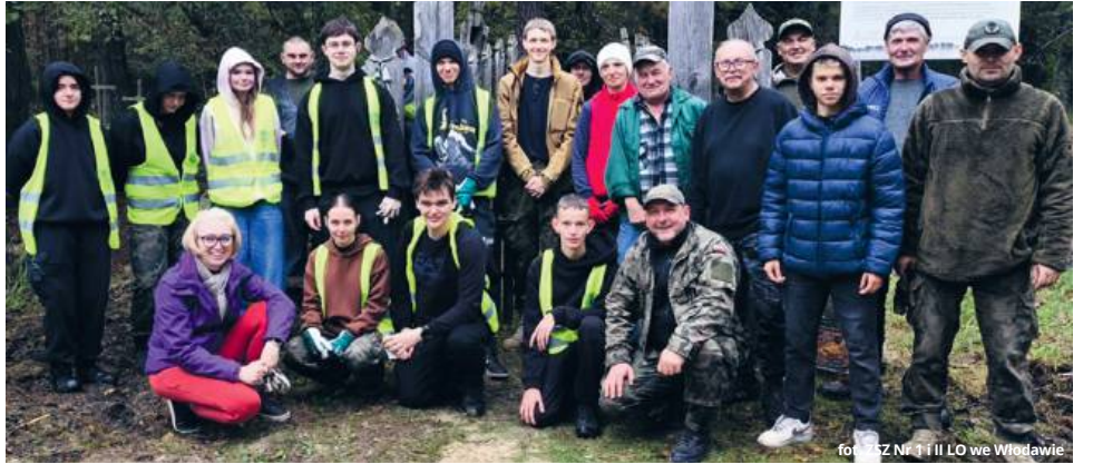
fol. ZS Nr 1 i II LO we Włodawie

● POW. WŁODAWSKI Dzięki zaangażowaniu młodzieży i lokalnej społeczności, udało się po raz kolejny uporządkować dwa cenne miejsca pamięci: cmentarz prawosławny w Żdźzarce oraz cmentarz epidemiczny w Lucie. Prace, prowadzone przez Stowarzyszenie Odkrywców Ziemi Włodawskiej, były elementem szerszego projektu mającego na celu ochronę lokalnego, wielokulturowego dziedzictwa.