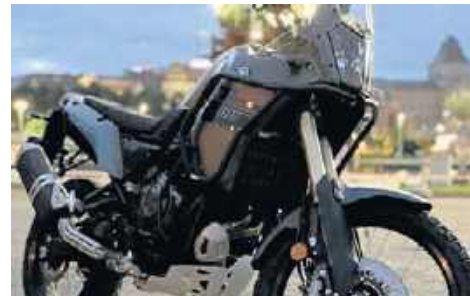
3. Yamaha Tenere 700, 2024, Filip Urbańczyk, Bielkowo