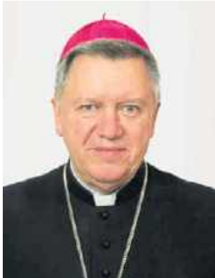
Abp Józef Kupny: - Musimy odzyskać wiarygodność i autorytet

Wyzwania, jakie dziś stoją przed kapłanami, są czymś