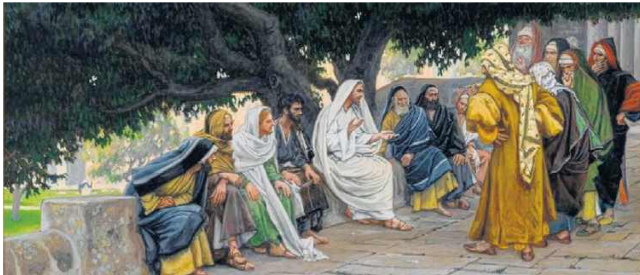
Jean Tissot „Jezus wystawiony na próbę przez faryzeuszy i esseńczyków”. Ten obraz powstał we Francji w latach 1886-1894. Obecnie można go oglądać w Brooklyńskim Muzeum w Stanach Zjednoczonych

Nazwa ugrupowania pochodzi od hebrajskiego słowa „odzielony”, „odseparowany”. Jej rodowód nie jest znany, naj-