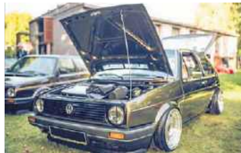
2. VW Golf 2, 1990, Miłosz Glanc, Szczecinek