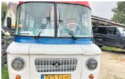
1. Nysa 522s, Dawid Bagrowski