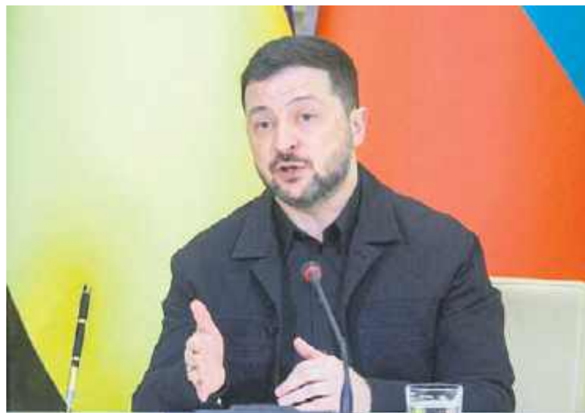
Wojna w Ukrainie trwa już od 2022 roku, prezydent Zełenski chciałby spokoju w czasie świąt wielkanocnych

„Rozmawiałem z premierem Wielkiej Brytanii Keirem Starmerem na temat naszej współpracy z partnerami w celu zakończenia wojny, a w szczególności o kontaktach z amerykańskim zespołem. Zaproponowaliśmy zawieszenie broni na czas świąt wielkanocnych i liczymy, że Stany Zjednoczone nas w tym wesprą” - napisał Zełenski w komunikatorze Telegrama.