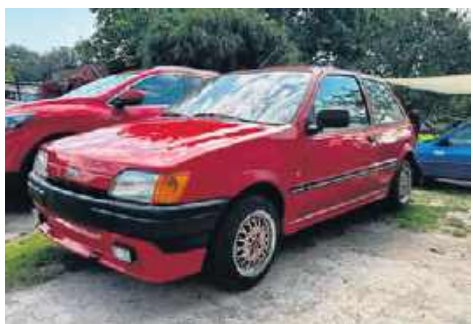
5. Ford Fiesta, 1991, Adam Odważny, Mielno