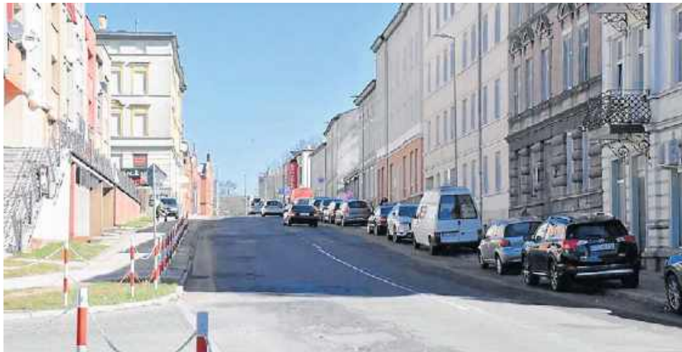
Ulica Młyńska nie będzie przebudowywana, ale zostanie solidnie wyremontowana. Nie pojawi się więc tutaj ścieżka rowerowa