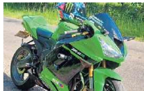
7. Kawasaki 636 ZX6R, 2005, Michał Szczecinek