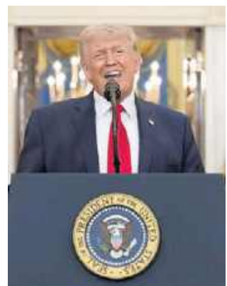
Donald Trump zapowiedział szybkie zakończenie wojny

Zapowiedział, że jeśli w tym czasie nie dojdzie do porozumienia z Iranem, USA „uderzą mocno w każdą z irańskich elektrowni, prawdopodobnie jedno-