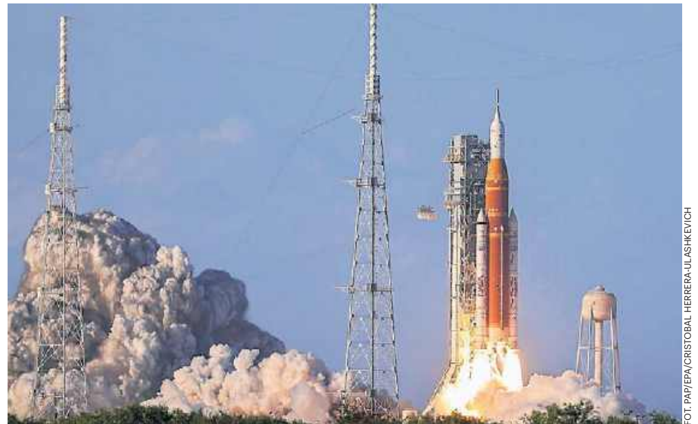
Misja Artemis II ma potrwać 10 dni. Szóstego dnia Artemis II zbliży się do Księżyca na najmniejszą odległość podczas tego lotu

Misja ma potrwać 10 dni.. Artemis II zabierze czworo astronautów, w tym kobietę, w 10-dniową podróż wokół Księżyca. 1 kwietnia to pierwsza możliwa data startu, z oknem czasowym między 18:24 a 20:24 czasu wschodnioamerykańskiego (sześć godzin różnicy