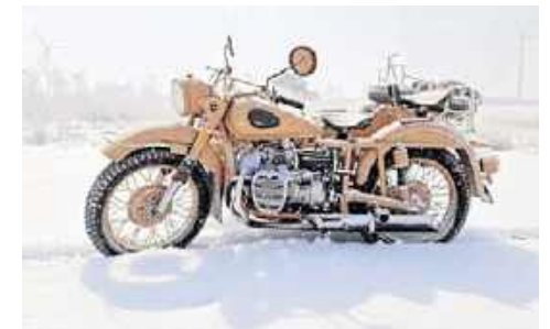
2. IMZ, 1987, Wojtek Śniadecki, Darłowo