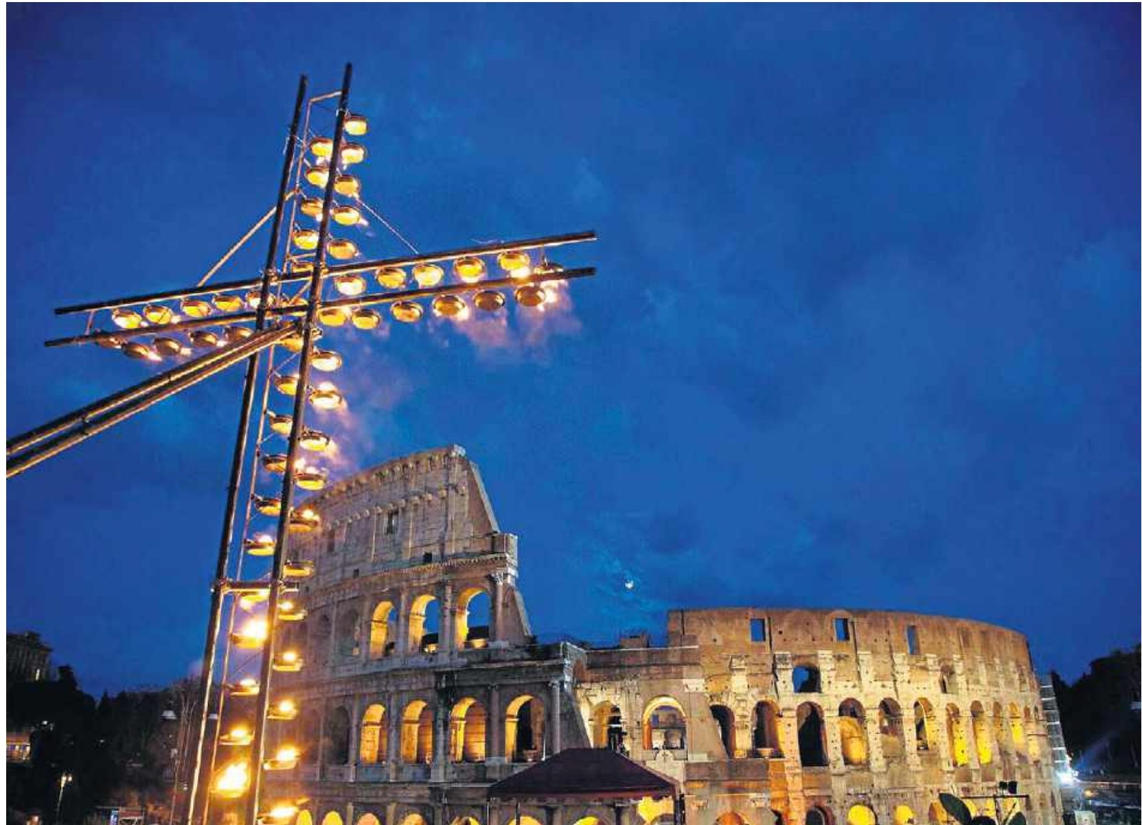
W tym roku tradycyjną drogę krzyżową w Koloseum po raz pierwszy poprowadzi papież Leon XIV. Będzie niósł krzyż

Jest to bardzo trudne, ale nie niemożliwe. Chrześcijanie żyjący dziś w Ziemi Świętej są bardzo podobni do chrześcijan pierwszego pokolenia - mają te same zalety i te same ograniczenia, a prawdopodobnie także to samo „DNA”. Jeśli jednak 2000 lat temu Jezus mówił do nielicznych uczniów: „Nie bój się, mała trzódka, gdyż spodobało się Ojcu waszemu objawić wam tajemnice Królestwa”, to dlatego, że już wtedy uczniowie byli statystycznie