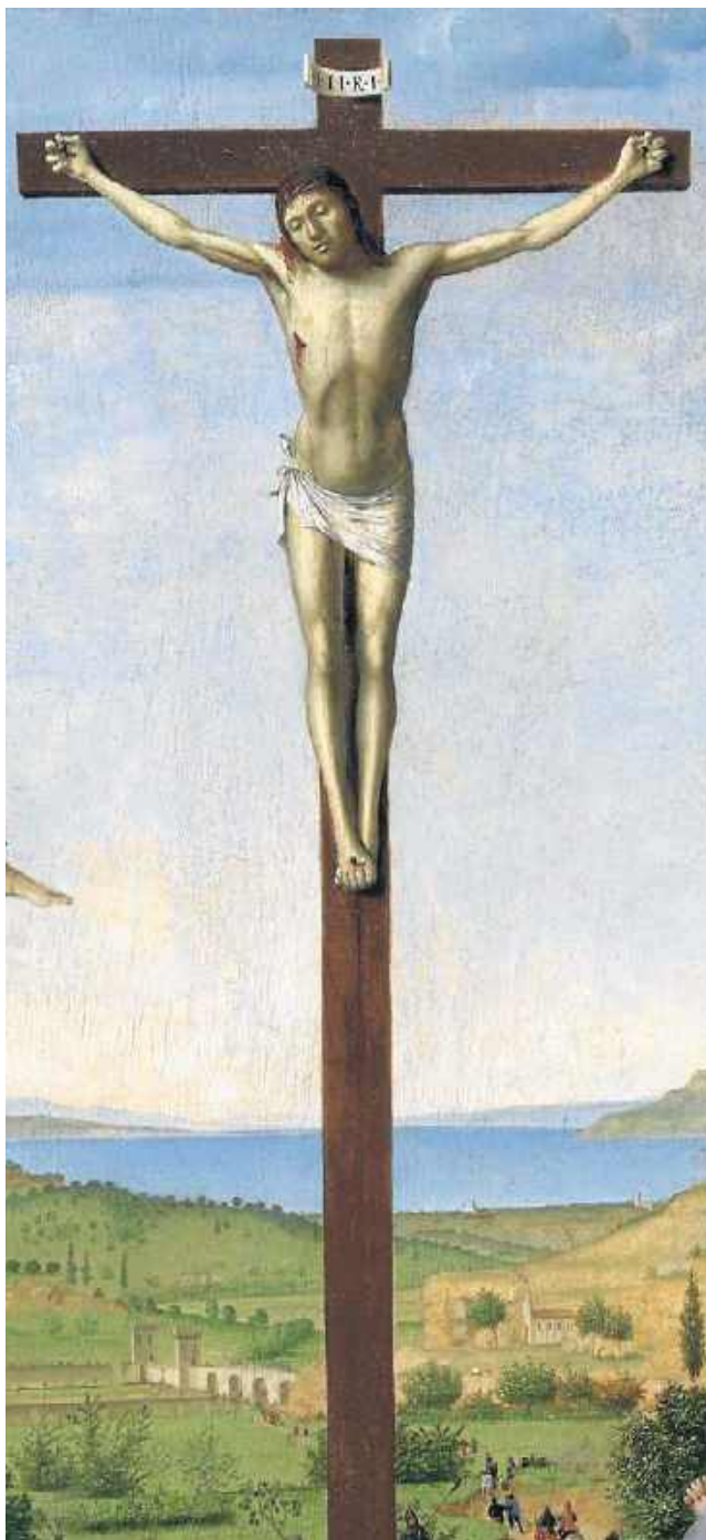
Antonella da Messina „Ukrzyżowanie”. Obraz z 1475 r. Obecnie znajduje się w zasobach Królewskiego Muzeum Sztuk Pięknych w Antwerpii

Potwierdza to argumenty historyków Kościoła, wedle których cesarz Konstantyn dokładnie wiedział, który grób należy do Chrystusa. I dlatego w tym miejscu, po przyjęciu chrześcijaństwa, zbudował bazylikę, by upamiętnić jego śmierć i odizolować od pozostałych mogił.