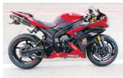
9. Yamaha R1, Łukasz Podpora