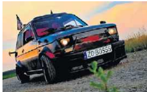
4. Fiat 126p BIS, 1989, Kamil Kamiński