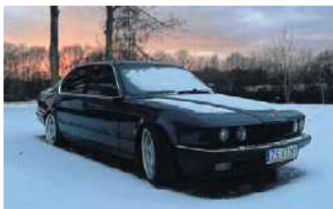
7. Bmw e32, Dorota Galant, Gorawino