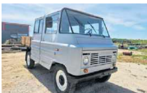
9. Żuk A16B, 1989, Andrzej Nowerski, Szczecin