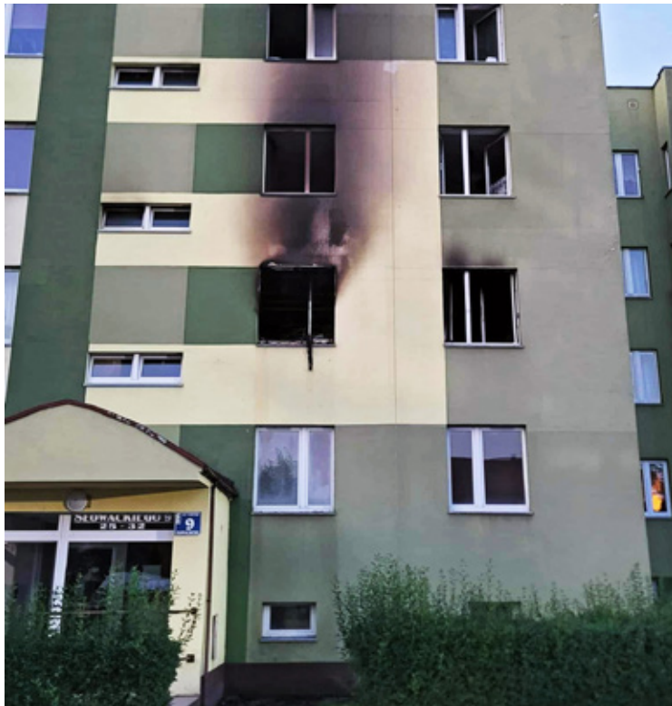
Z bloku ewakuowano lokatorów. Nadal trwa śledztwo co było przyczyną pożaru.

Jedna z osób, próbując ratować życie, wyskoczyła z okna. Poszkodowana kobieta w ciężkim stanie została przetransportowana do szpitala we Wrocławiu. Łącznie ewakuowano około 70 osób – nie tylko z klatki objętej pożarem, ale również z dwóch sąsiednich. Wielu mieszkańców opuściło budynek jeszcze przed przyjazdem służb. W działania od początku zaangażowani byli także policjanci, którzy jako pierwsi dotarli na miejsce.