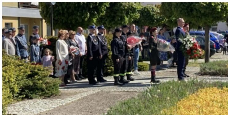
Delegacja składają kwiaty pod pomnikiem na dolnobrzeskim Rynku. To tradycyjny gest szacunku.