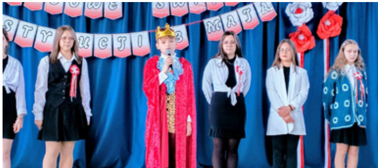
Inscenizacja uczniów z SP im. Królowej Jadwigi z okazji 3 Maja.

W murach Szkoły Podstawowej im. Królowej Jadwigi odbyło się wyjątkowe wydarzenie. Cała społeczność szkolna zgromadziła się, aby wspólnie uczcić rocznicę uchwalenia Konstytucji 3 Maja – symbolu nowoczesnego państwa i polskiego ducha wolności.