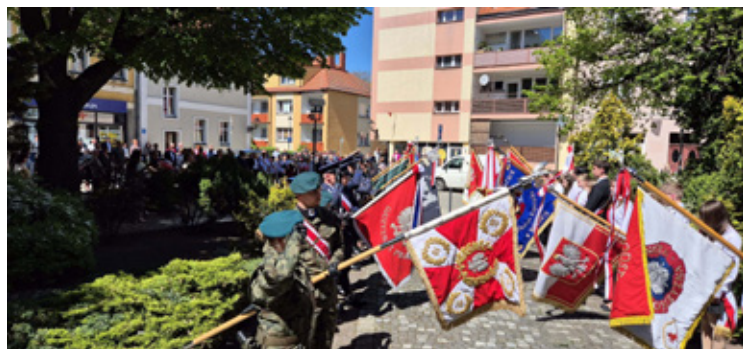
Obchody 3 Maja w Wołowie.