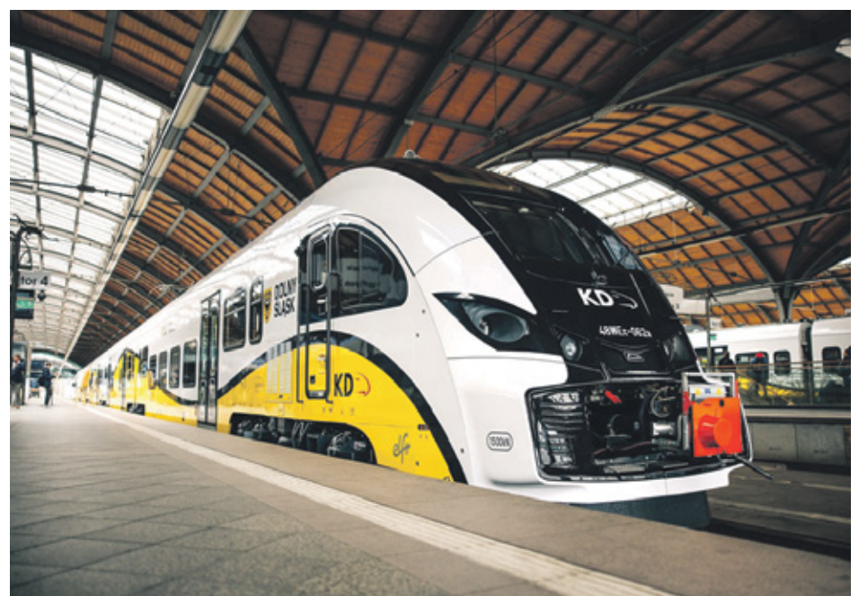
Koleje Dolnośląskie dysponują jedną z najnowocześniejszych flot w Polsce