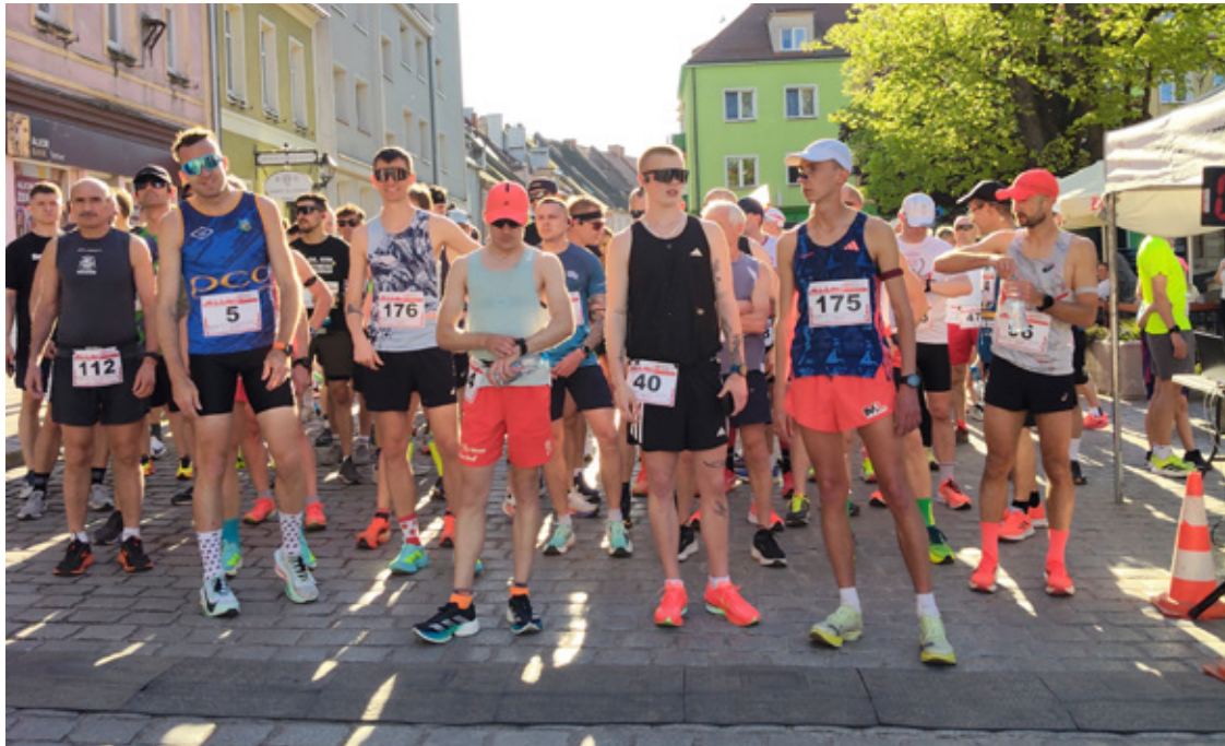
Biegacze na starcie.

Tegoroczna edycja wydarzenia po raz kolejny pokazała, że Wołów potrafi łączyć patriotyzm z aktywnością fizyczną. Od samego rana w okolicach startu panowała podniosła, a zarazem radosna atmosfera. Uczestnicy, ubrani w narodowe barwy, stworzyli niesamowite widowisko, które z entuzjazmem oklaskiwali licznie zgromadzeni mieszkańcy. Wyjątkowym punktem programu był bieg