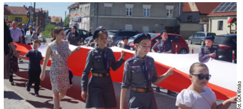
Białe-czerwony pochód na ulicach Wińska, harcerki dumnie trzymające ogromną flagę narodową.