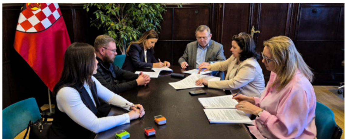
Podpisanie umowy na remont drogi powiatowej nr 1286D – ul. Michała Leopolda Willmanna i ks. Bolesława Wysokiego w Lubiążu, gmina Wołów”. Wykonawca - Przedsiębiorstwo Budowy i Utrzymania Dróg i Mostów Sp. z o.o. w Piotroniowicach.

– modernizacja pomieszczeń sanitarnych w budynku Starostwa, – projekt „Cyberbezpieczny Powiat Wołowski”, którego celem jest wzmocnienie systemów informatycznych,