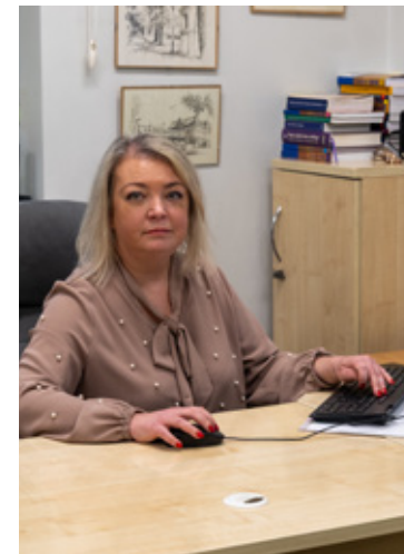
Praca w Urzędzie Stanu Cywilnego wymaga dużej dokładności, odpowiedzialności i znajomości przepisów, również z zakresu prawa międzynarodowego.

To właśnie w USC „wszystko się zaczyna” – od narodzin, przez