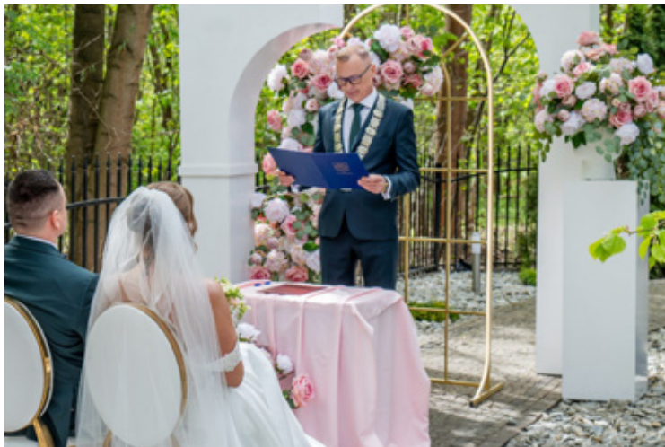
Na prośbę pary młodej, po wcześniejszym uzgodnieniu dogodnego terminu, ślubu udziela Burmistrz Brzegu Dolnego.

Do zadań USC należy również organizacja uroczystości ślubnych oraz jubileuszy 50-lecia pożycia małżeńskiego, wyjątkowych wydarzeń, które na stałe wpisują się w lokalną tradycję i budują wspólnotowy charakter gminy.