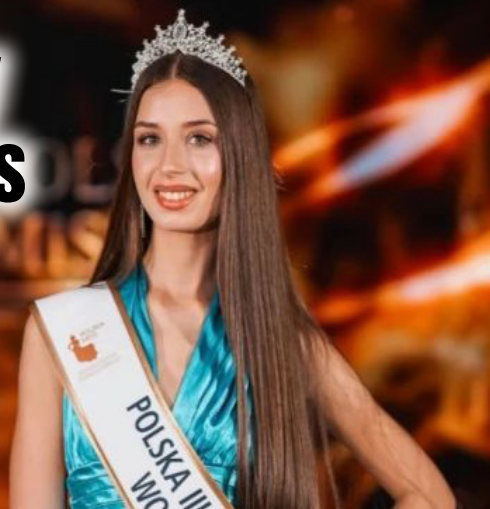
FOT. ORGANIZATOR, MISS DOLNEGO ŚLĄSKA

Brzeg Dolny ma wicemiss Dolnego Śląska str. 8