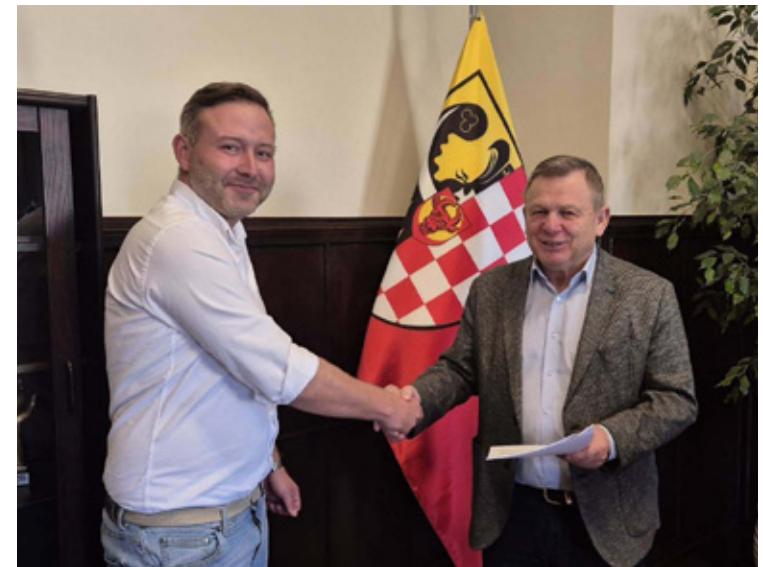
Podpisanie umowy z wykonawcą z firmą CONTRACT Sp. z o.o. na realizację dwóch ważnych inwestycji mostowych: Odbudowę obiektu mostowego w ciągu drogi powiatowej 1290D, km 1+517 Łososiowice oraz Odbudowa obiektu mostowego w ciągu drogi powiatowej 1294D, km 0+120 Prawików.

Wśród kolejnych planowanych przedsięwzięć drogowych znajdują się: