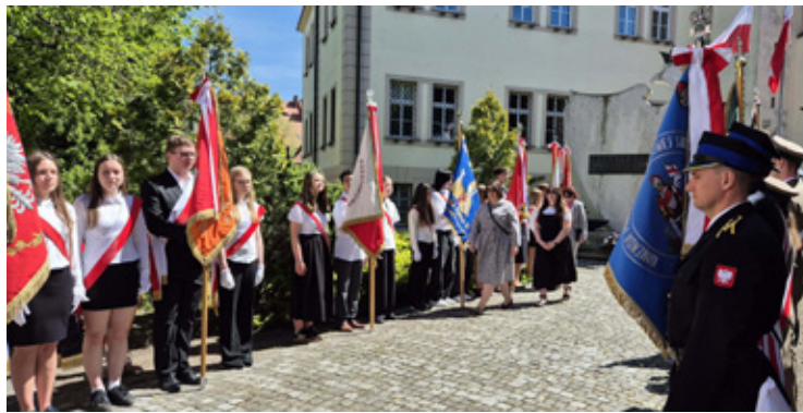
Poczty sztandarowe pod pomnikiem w Wołowie.