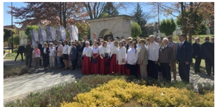
Uroczystość w Brzegu Dolnym uświetnił swoim występem Chór Oremus.