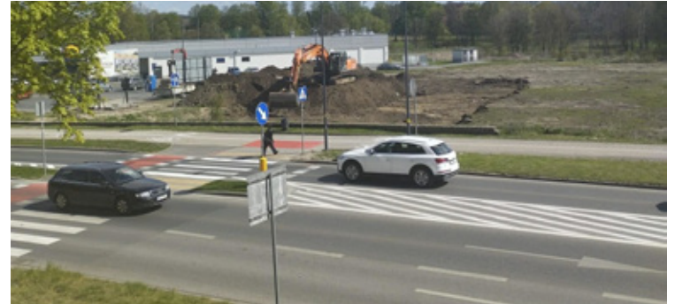
W sąsiedztwie sklepu Lidl powstaje tzw. retail park, czyli nowoczesny park handlowy.

Jak poinformował inwestor Inwest Piat, przy ulicy Jana Pawła II w Wołowie ruszyła duża inwestycja handlowa. W sąsiedztwie sklepu Lidl powstaje tzw. retail park, czyli nowoczesny park handlowy.