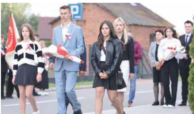
W uroczystościach patriotycznych w Milanowie wzięły udział poczty sztandarowe z jednostek OSP z terenu gminy oraz przedstawiciele urzędów i placówek oświatowych