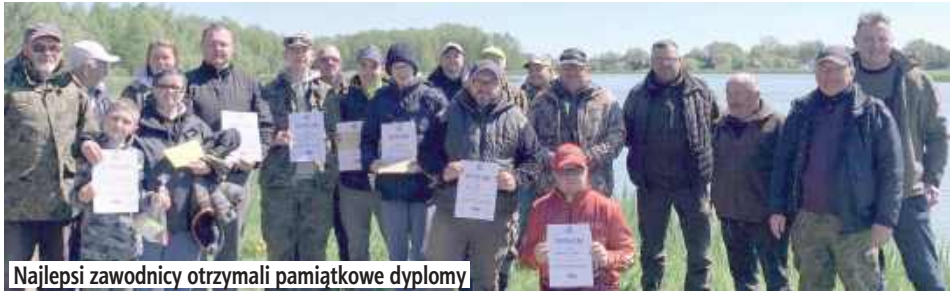
Najlepsi zawodnicy otrzymali pamiątkowe dyplomy

Pod koniec kwietnia na zbiorniku Relaks w Parczewie zostały zorganizowane