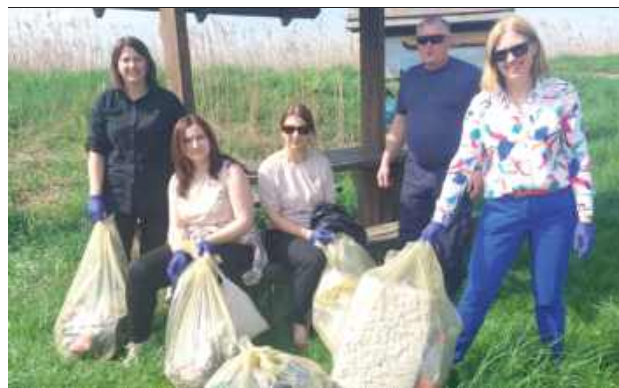
W workach znalazły się m.in. butelki

Razem pokazujemy, że troska o planetę zaczyna się od nas.