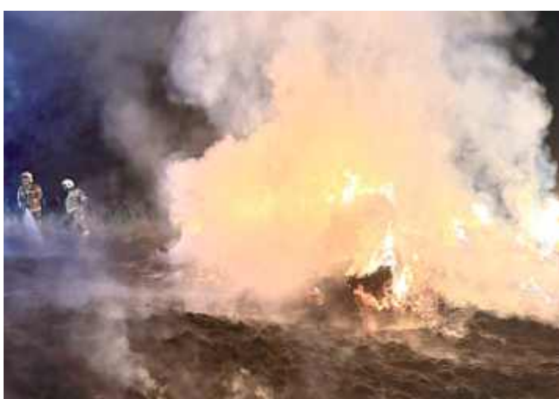
GR Akcja była prowadzona wieczorem

Pożar bel słomy i lasu wybuchł w czwartek, 1 maja w Glinnym Stoku. Na miejscu interweniował zastęp Komendy Powiatowej Państwowej Straży Pożarnej oraz zastęp Ochotniczej Straży Pożarnej w Siemieniu.