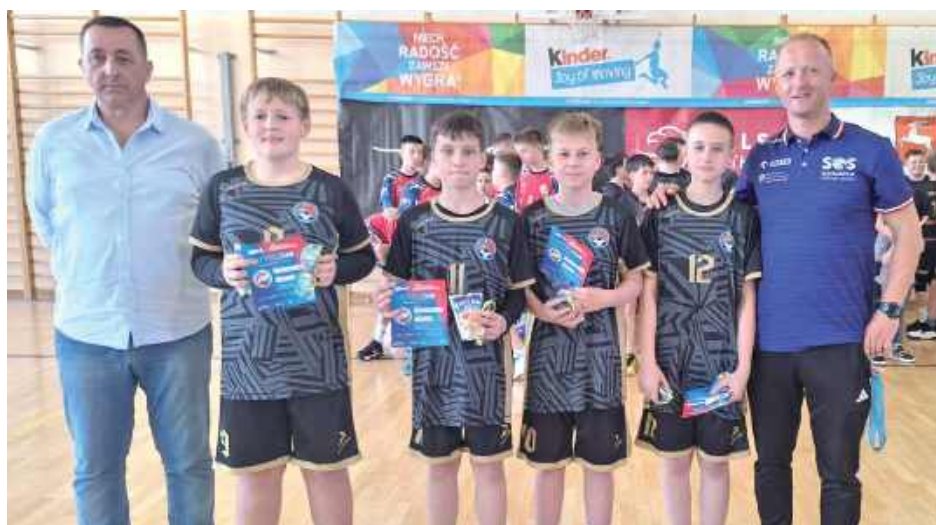
Siódma siła województwa - Zodiak Sosnowica

Zodiak zanotował w turnieju dwa zwycięstwa i trzy porażki, prezentując ambitną i pełną pasji grę. Szczególnie emocjonujące było starcie z LKPS Lublin, w którym