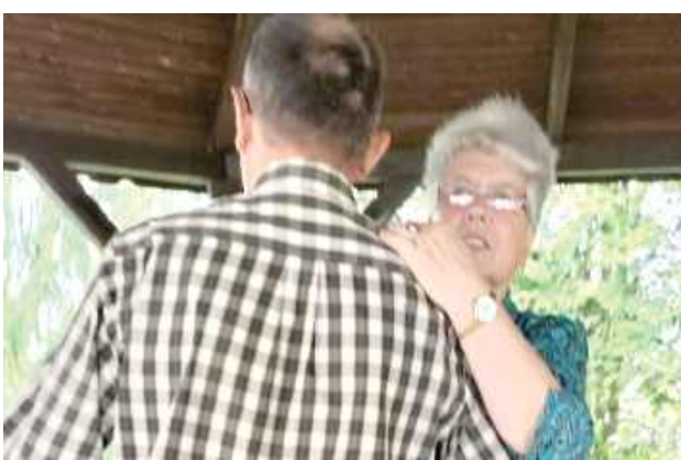
W programie były m.in. tańce