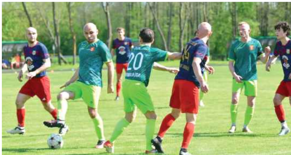
Dąb wziął rewanż za jesienną porażkę 0:1 i wygrał w Jabłoni różnicą trzech goli

- Mamy udany rewanż za rundę jesienną. Dostaliśmy gratulacje od miejscowych oraz sędziów. Wiadomo, gra się tak, jak przeciwnik pozwala. W tym spotkaniu byliśmy dużo lepszym zespołem i za-