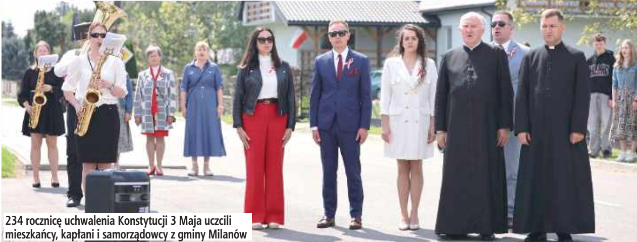
234 rocznicę uchwalenia Konstytucji 3 Maja uczcili mieszkańcy, kapłani i samorządowcy z gminy Milanów