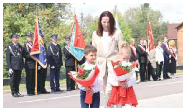
Wyjątkowa lekcja patriotyzmu dla najmłodszych, a święta narodowe to doskonała okazja, by porozmawiać z dziećmi o historii, symbolach i wartościach ważnych dla każdego Polaka