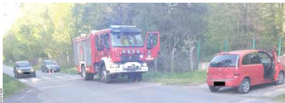
36-letnia mieszkanka Siedlec, kierująca oplem, nie zachowała należytej ostrożności podczas skrętu w lewo, w wyniku czego doprowadziła do zderzenia z kierującym motorowerem, który poruszał się drogą z pierwszeństwem przejazdu

Ze wstępnych ustaleń funkcjonariuszy wynika, że przyczyną zdarzenia było nieustąpienie pierwszeństwa przejazdu. 36-letnia mieszkanka