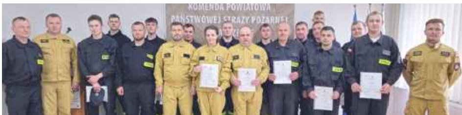
Duże zainteresowanie, frekwencja oraz zdyscyplinowanie słuchaczy pozwoliło zdać egzamin 18 strażakom

W Komendzie Powiatowej Państwowej Straży Pożarnej w Parczewie zakończyło się trzydniowe szkolenie kierowców-konserwatorów sprzętu ratowniczego Ochotniczych Straży Pożarnych.