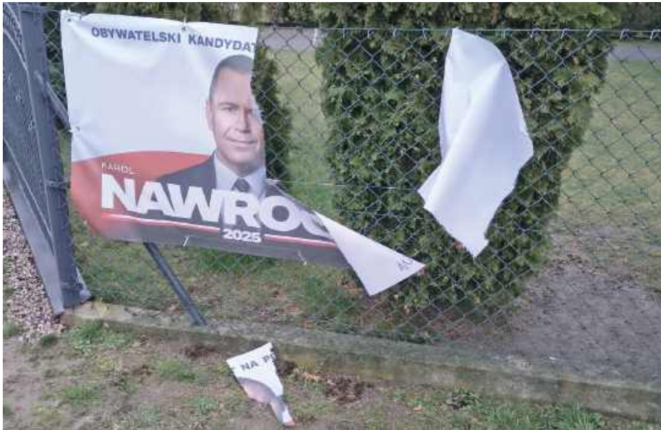
Uszkodzony został m.in. plakat Karola Nawrockiego

Do pierwszych incydentów związanych z wyborami prezydenckimi dochodzi w powiecie parczewskim. Uszkodzone zostały plakaty wyborcze głównych kandydatów - Karola Nawrockiego i Rafała Trzaskowskiego.