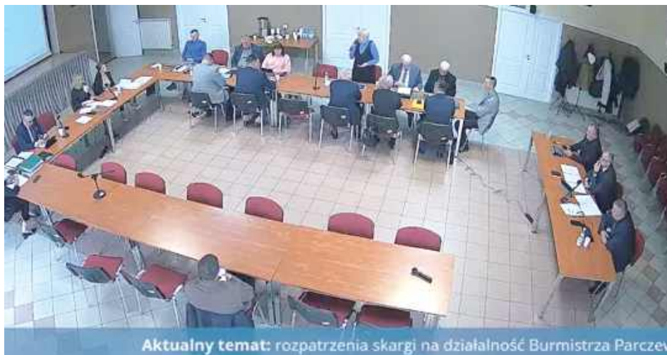
Za podjęciem uchwały zagłosowało siedmiu radnych, trzy osoby były przeciwko (czyli za uznaniem skargi za zasadną), a trzy osoby wstrzymały się od głosu

- Na obszarach rolniczych żyje wiele gatunków zwierząt (mnóstwo ptaków, saren, zajęcy, dzików, lisów itd.). Czas prac podczas stawiania urządzeń to będzie wyjątkowo tragiczny dla nich moment. Potem, gdy ma-