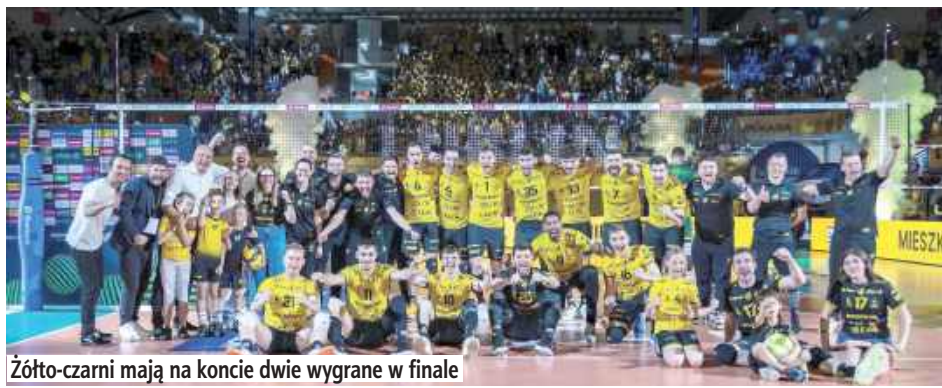
Złoto-czarni mają na koncie dwie wygrane w finale

W drugim finałowym meczu PlusLigi siatkarze Bogdanki LUK Lublin pokonali przed własną publicznością Aluron CMC Warta Zawiercie. Tym samym podopiecznych Massimo Bottiego dzieli od mistrzostwa Polski już tylko jedno zwycięstwo.