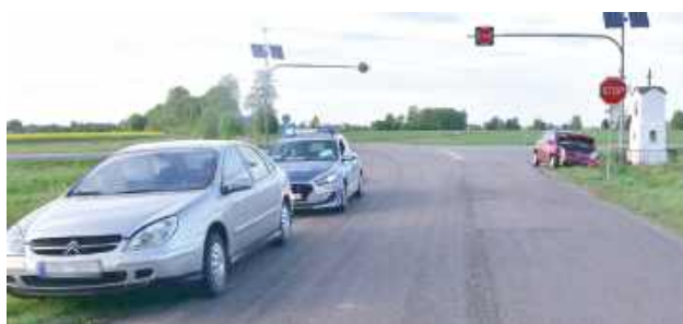
Badanie stanu trzeźwości przeprowadzone przez mundurowych na miejscu zdarzenia potwierdziło, że kierujące były trzeźwe

- 45-letnia mieszkanka gminy Wołyń, kierując Citroënem C5 na skrzyżowaniu nie ustąpiła pierwszeństwa przejazdu kierują-