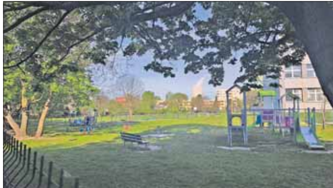
Plac zabaw przy Przedszkolu nr 27

Jednym z kluczowych elementów projektu jest modernizacja placów zabaw. Na ten cel przeznaczono blisko 682 tys. zł. Prace obejmą siedem przedszkoli: PM 1, PM 3, PM