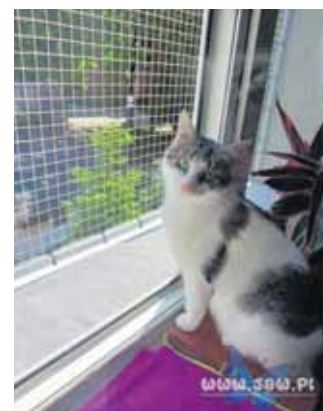
Kot Olek wychodzi czasami na smyczy

Zwracamy się z prośbą do właścicieli psów o zwrócenie uwagi na bezpieczeństwo innych mieszkańców osiedla. Pies ma zostawać pod opieką właściciela, ma mieć smycz, ewentualnie duże psy kaganiec. Prosimy o dbanie o czystość po swoich pupilach. Prosimy również o zrozumienie tematu, ponieważ na osiedlu są również wyprowadzane na smyczy koty, których właściciele martwią się o ich bezpieczeństwo”.