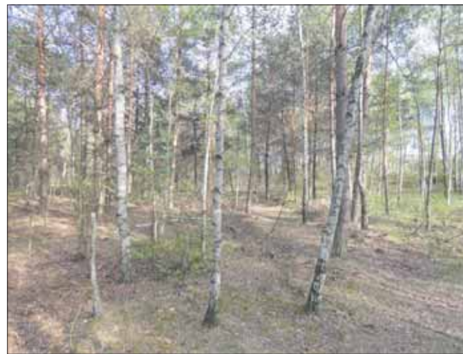
Czeremcha u ujścia koryta