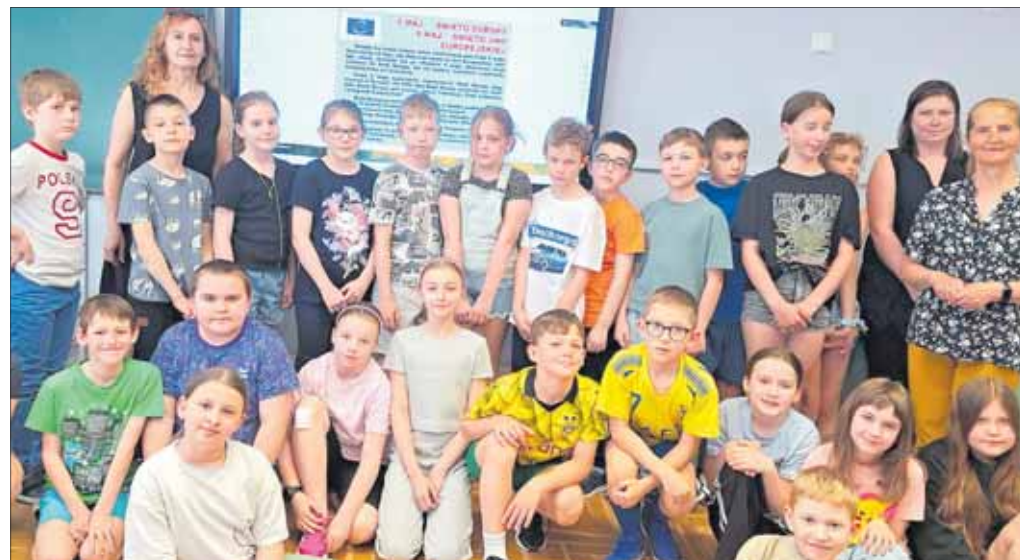
Uczniowie kl. 3b ze Szkoły Podstawowej nr 7

Dzieci były bardzo zainteresowane takimi tematami. Były ciekawe – ilu jest Polaków na całym świecie? W ilu krajach świata żyjemy? Rodaków możemy spotkać w najbardziej niespodziewanych zakątkach świata. Dzień Polonii i Polaków za Granicą jest celebrowany przede wszystkim w miastach w Europie, gdzie występują największe skupiska Polonii. Według danych szacunkowych poza terytorium Polski mieszka do 21 milionów Polaków i osób pochodzenia