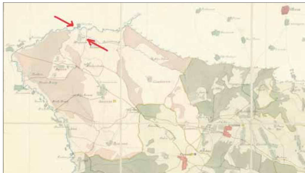
Zaznaczony Długoszyn i Paszeka

Na przestrzeni dziejów osady pojawiały się i zniknęły. Powodów ich zaniku mogło być wiele; od czynników wewnętrznych po zewnętrzne. Niektóre natomiast jednostki osadnicze wyszły z różnego rodzaju zawieruch obronną ręką, opierając się takiej czy innej próbie czasu. Były również osady, które na pewnym etapie historii zniknęły, aby jakiś czas później pojawić się ponownie. Zdarzało się też niejednokrotnie, że w obrębie wsi, miejscowości, miasteczek, a nawet miast zmieniał się ich punkt ciężkości, co powodowało, że owe jednostki osadnicze zmieniały swe położenie. Tak było np. w średniowiecznym Krakowie. We wczesnym średniowieczu Kraków oznaczał Wawel z najbliższą okolicą, czyli podgrodziem. Ale już w wieku trzynastym, za panowania księcia Bolesława V Wstydliwego, w wyniku lokacji miasta, punkt jego ciężkości przeniósł się w obręb współczesnego rynku. Podobnie też było w przypadku Torunia czy Warszawy, kiedy to na pewnym etapie dziejów obok Starego Miasta powstawało też Nowe Miasto, będąc swego rodzaju alternatywą dla tego pierwszego.